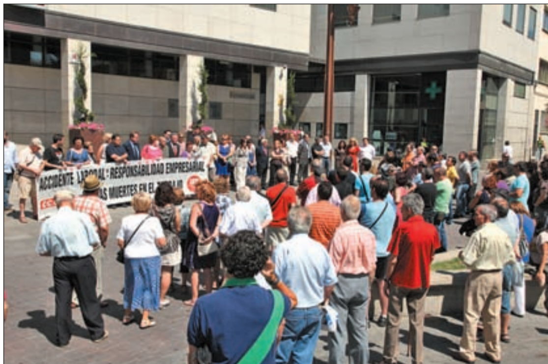
Concentración contra la precariedad laboral convocada por los sindicatos CC OO y UGT