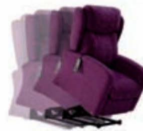
Modelo Elizabeth Sillón Relax Power Lift