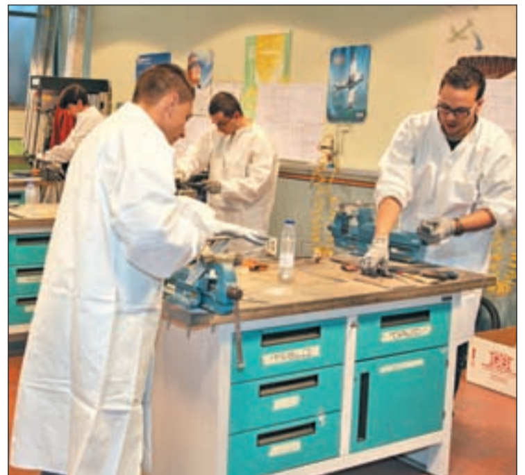
Un grupo de jóvenes en la Agencia Local de Empleo y Formación

Contempla la actuación en cuatro zonas ajardinadas de los barrios de Juan de la Cierva y Getafe Norte, comprendidas entre la avenida de los Ángeles, avenida de España, avenida de la Rabia, el Casar, Parque de Andalucía y Camino Viejo de Pinto.