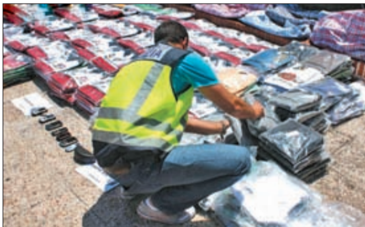
Un Policía observa el material incautado a los detenidos

tabaco y se desarticuló otro grupo que intentaba introducir todas las semanas en España 250.000 cajetillas. El arrestado estaba íntimamente relacionado con los componentes de esta organización delictiva. Las pesquisas llevaron entonces a los agentes a comprobar que ese primer detenido contaba con un socio y que ambos se dedicaban a comprar grandes partidas de material proveniente de robos para luego venderlo a un precio muy inferior al de mercado. A partir de ahí, logró las otras detenciones. Cuando fueron arrestados los tres individuos ya habían alquilado una furgoneta para trasladar toda la mercancía a la zona de Sevilla. En el interior del vehículo se encontraron un total de 558 polos estilo rugby. Además se realizaron dos registros en los que se incautaron teléfonos móviles, dinero en efectivo, una tarjeta de memoria con fotografías de diversas prendas de ropa de la misma marca y numerosa documentación relevante para la investigación.