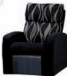
Modelo Flora Sillón Relax Varios colores a elegir