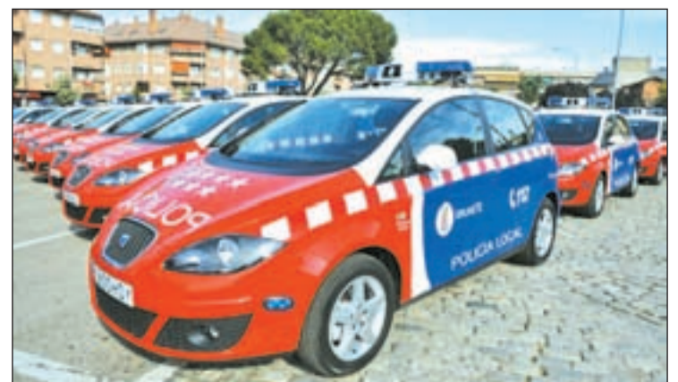
Coches de la BESCAM entregados por la Comunidad

Por otra parte, un total de 41 unidades del modelo Altea han sido adquiridas por la Comunidad para las Bases Operativas BESCAM de 33 municipios integrados en el Proyecto de Seguridad. Se trata de la versión ecológica del Altea de bajo consumo y suministradas por el concesionario oficial de la marca, Gran Centro Getafe.