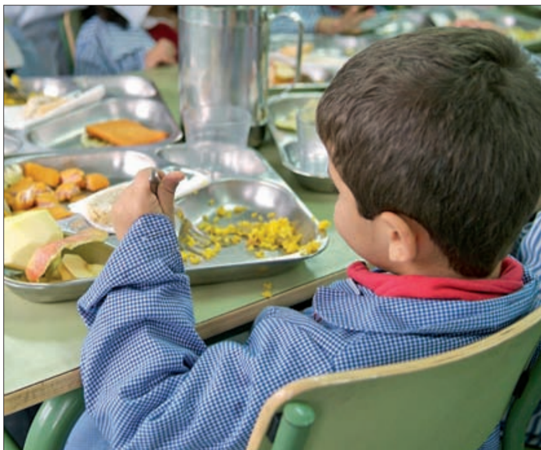
Un niño en el comedor de su colegio en la Comunidad

Estas cifras preocupan, no sólo por que el sobrepeso y la obesidad infantil está aumentando, sino, como alerta la Asociación Española de Pediatría (AEP), hoy es "mucho más peligrosa" que hace 20 años porque conlleva complicaciones "más graves".