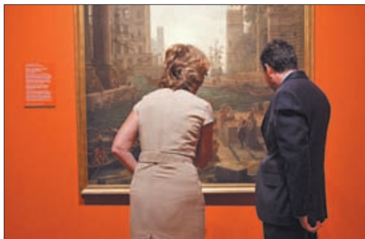
Esperanza Aguirre inauguró la exposición este lunes

La muestra, inaugurada por la presidenta de la Comunidad de Madrid, Esperanza Aguirre,