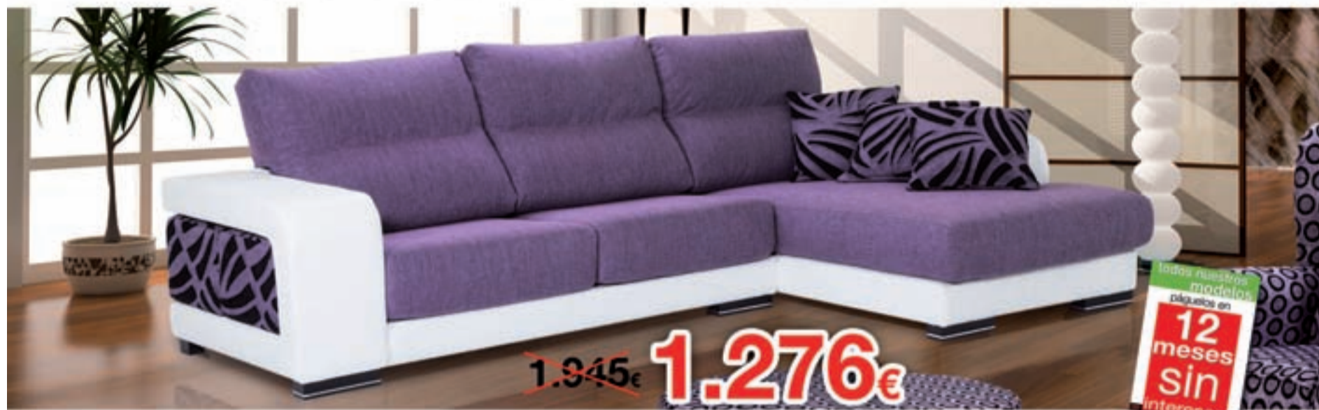
Modelo Emily | Composición 3pl. + Chaiselongue | Asientos deslizantes | Cabezales abatibles | Con puff en brazo

REBAJAS, OPORTUNIDADES Y OCASIONES... ¡JUNTAS! ¡VEN Y COMPARA!