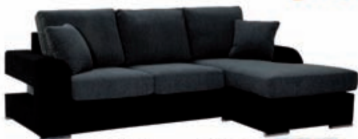
Modelo Torres Composición 3 pl. Chaiselongue

REBAJAS, OPORTUNIDADES Y OCASIONES... ¡JUNTAS! ¡VEN Y COMPARA!