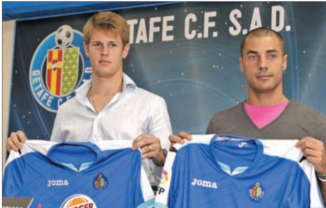
El joven defensa italiano y el internacional argelino posan con su nueva camiseta