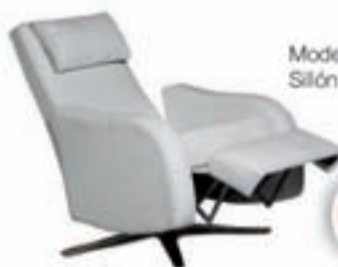
Modelo Egeo Sillón Relax Giratorio