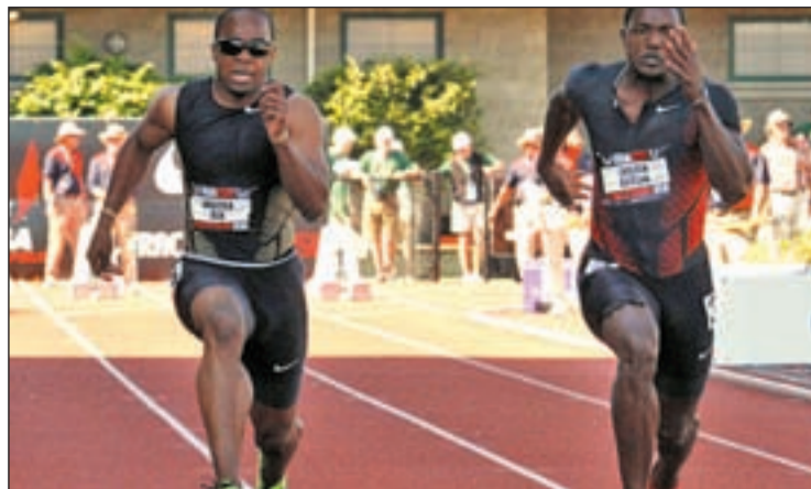
El velocista estadounidense, uno de los favoritos en los 100 metros

ATLETISMO SE CELEBRA ESTE SÁBADO EN MORATALAZ