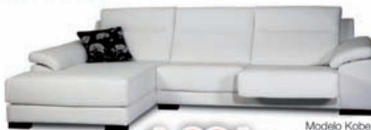
Modelo Kober Composición 3 pl. + Chaiselongue Asientos deslizantes