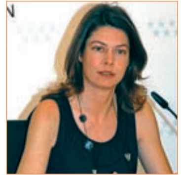
La consejera Lucía Figar

ción y nutrición. Además, este curso ha comenzado el Programa de Salud Integral en 7 colegios, de forma piloto cuyo objetivo es desarrollar hábitos de vida saludable que puedan contribuir a una salud cardiovascular y a una buena calidad de vida.