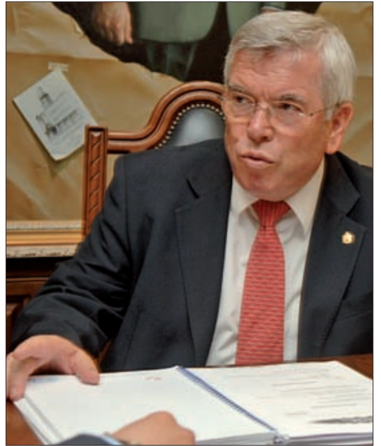
El ex alcalde de Getafe, Pedro Castro

Según los asistentes fueron especialmente atendidas y analizadas las demandas que se han venido realizando el Movimien-