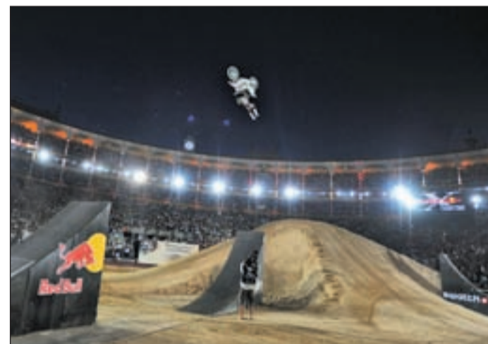
Imagen de la edición anterior del evento

En estos momentos, tras tres pruebas disputadas, el líder de la clasificación general es el rider norteamericano Nate Adams, vencedor de la última competición disputada en Roma. Adams cuenta con una ventaja de 40 puntos respecto a su inmediato perseguidor, el noruego afinado en Torre Vieja André Villa, quien en 2008 ya estuvo a punto de saborear las mieles del triunfo en Madrid. El representante español, Dany Torres, se encuentra a 80 puntos de Villa y a 120 del líder, por lo que ya no cuenta con opciones de conquistar el campeonato del mundo. Sin embargo, Torres está dispuesto a arriesgar para hacerse con un triunfo en la única prueba del circuito que se celebra en su país y así salir por la puerta grande como ya hiciera el año pasado el australiano Robbie Maddison, actualmente cuarto clasificado del Mundial.