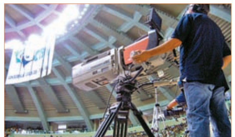
Esta temporada podrían jugarse partidos en horarios poco habituales

momentos es dividir la jornada, quedando cinco encuentros para el sábado y otros tantos para el domingo. Los encuentros se jugarían de forma que no coincidieran entre sí, de modo que la jornada comenzaría el sábado a las 16:00 horas y terminando el domingo a las 21 horas, con un partido programado para la matinal del domingo incluido.