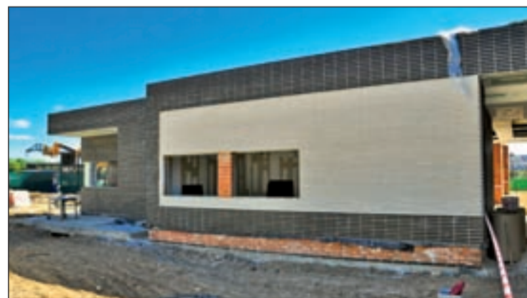
Fachada de la nueva escuela infantil en Torrejón

El nuevo centro se está llevando a cabo con un presupuesto de 2 millones de euros, y permitirá atender las necesidades de escolarización de la zona sur del municipio, donde hay más de 25.000 vecinos. Con esta, ya habrá 6 escuelas infantiles en Torrejón, y será la tercera construcción en los últimos 4 años.