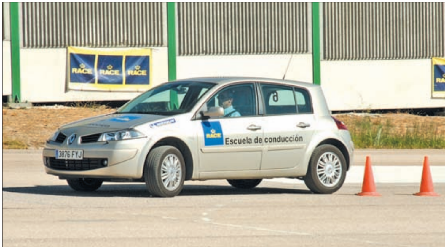
Uno de los cursos de conducción organizados por RACE