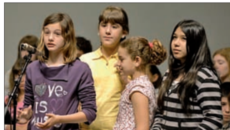
Algunos de los niños que han asistido a los campamentos

La Comisión de Participación está formada por integrantes del Foro Infantil (50%) y del Foro Juvenil (50%), que son elegidos mediante elecciones para un mandato de dos años.