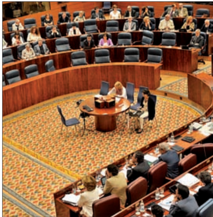
Una sesión del Pleno de la Asamblea de Madrid

Asimismo, indicó que a pesar de su propuesta inicial han "rebajado esas pretensiones en aras de consenso porque en este tipo