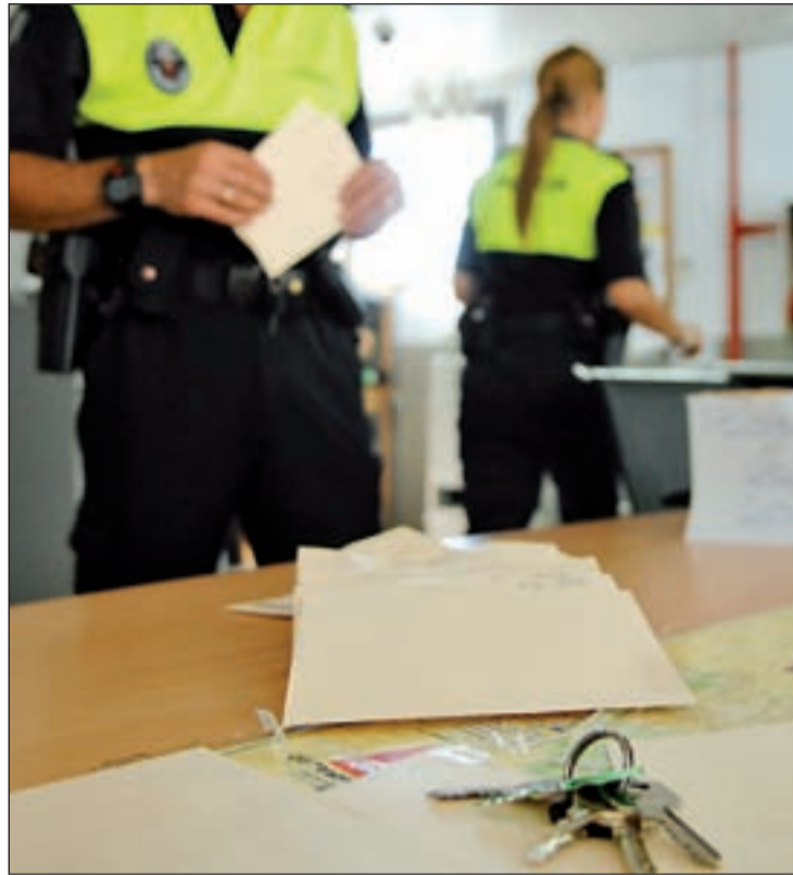
Un agente policial de Rivas recoge las llaves de un vecino.

Con un cuerpo actual de 130 agentes, Rivas fue uno de los primeros municipios de la región en poner en marcha este servi-