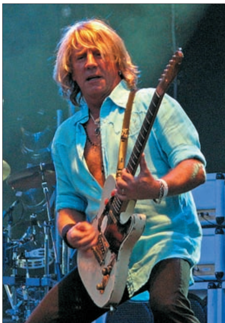
Richard John Parfitt disfruta como un adolescente tocando en directo.

A la banda británica siempre le han colgado el sambenito de que no ha variado su estilo musical, derecho que Parfitt defiende. "Si hacemos algo diferente, dirán que no deberíamos hacerlo. Lo que tenemos es un sonido individual, un tipo de música muy propia que nadie ha tocado. Con el paso de los años, también crece la dificultad para hacer algo nuevo. Puedes cambiar las letras y la temática principal de la canción, pero llegar con otro ti-