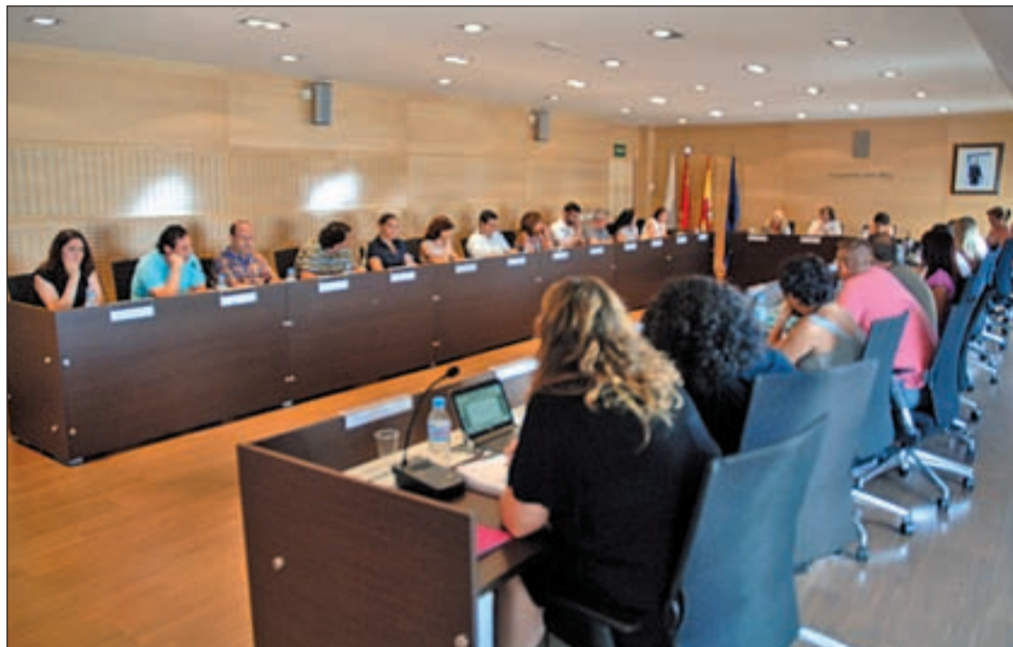
Un momento del Pleno extraordinario de Arganda del Rey