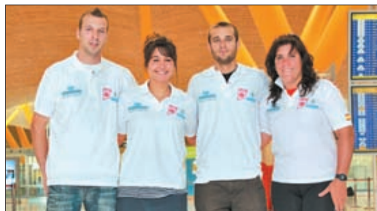
Los cuatro estudiantes, antes de partir hacia Rhode Island

besas, siendo el Deportivo, el Cagliari italiano y el Sporting de Gijón los otros rivales con los que comenzará a coger el pulso al ritmo de competición. Lo que parece más complicado es la renovación de la plantilla, sobre todo teniendo en cuenta los problemas económicos. Con la marcha de los jugadores cedidos y la venta de Koke, Sandoval sólo cuenta de momento con 17 jugadores de la primera plantilla, de los que sólo el brasileño Sueliton y Quero han causado alta respecto a la pasada temporada.