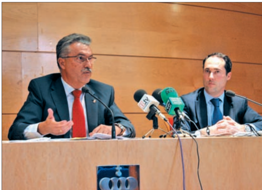
El alcalde y el concejal de Hacienda

El primer edil comparó la herencia recibida del anterior equipo de Gobierno por la que según el regidor dejó el PP tras la legislatura 2003-2007, "cuando el Partido Popular ingresó 13 millones más de lo que gastó". Además, declaró que no se recortarán las partidas a gasto social de primera necesidad. El nuevo Ejecutivo municipal adoptará medidas pa-