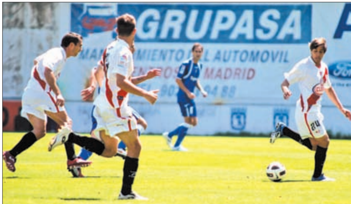
La permanencia será el objetivo de los jugadores franjirrojos

RAYO LOS PROBLEMAS ECONÓMICOS SE MANTIENEN EN EL EQUIPO VALLECANO