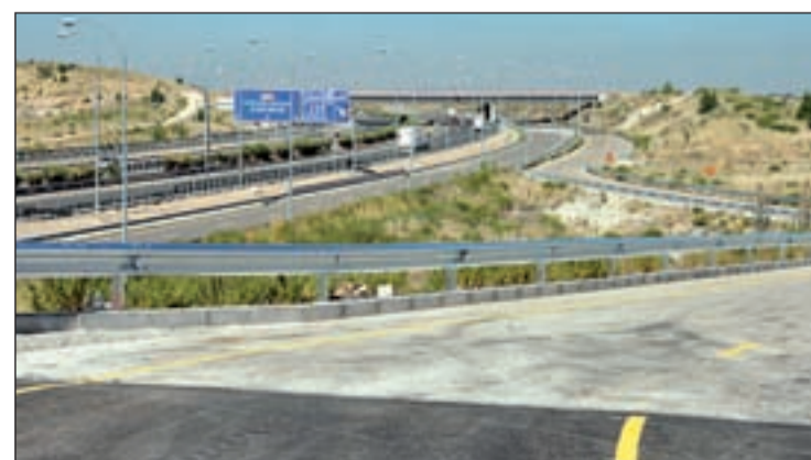
El enlace desde Coslada a la M-45