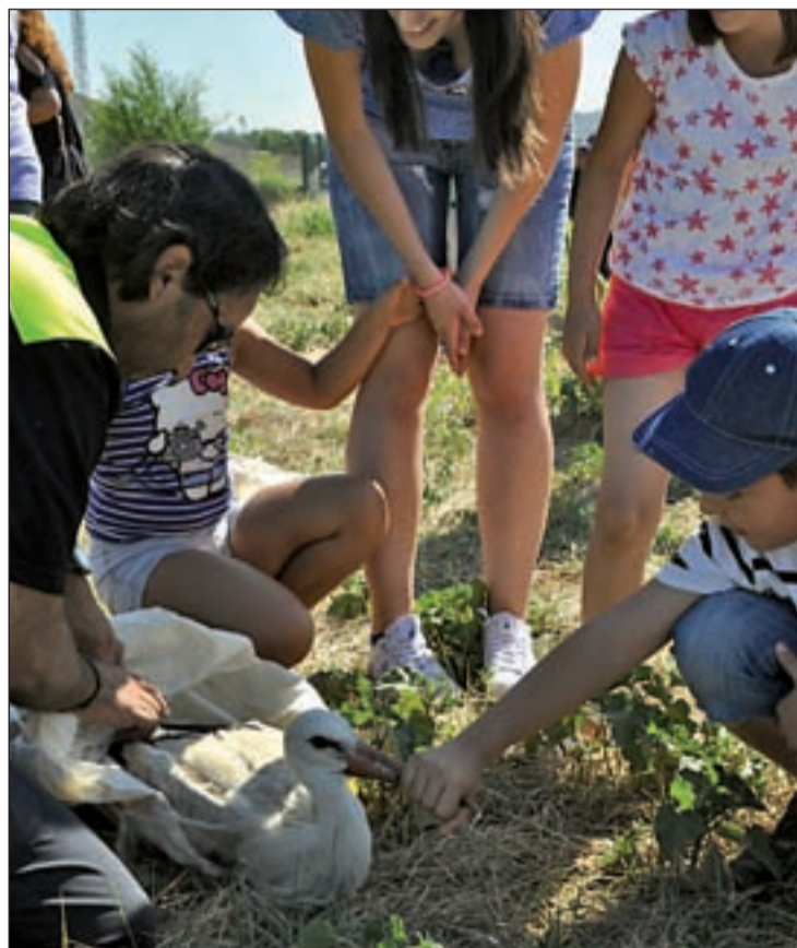
Varios escolares ayudan al agente a solar a una cigüeña

Las cigüeñas que se rescataron proceden de este municipio y son pollos volantones accidentados en sus primeros vuelos. Por ello, tras su recuperación en el Hospital de Fauna Salvaje de GREFA, las crías se devuelven a la ciudad una vez anillados. Posteriormente, emprenderán su viaje hacia el África transahariana,