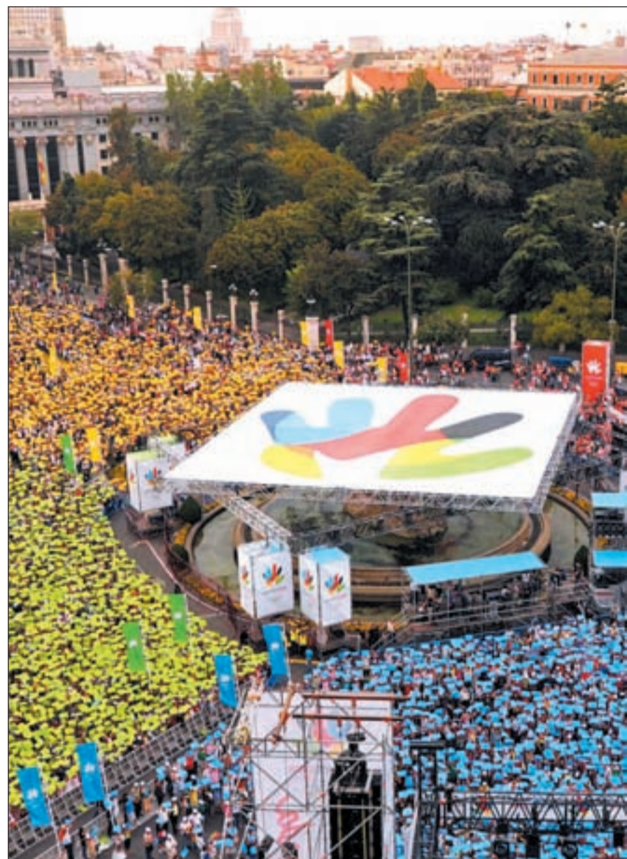
La candidatura de Madrid 2016 contó con un gran apoyo social

cambio, pero lo fundamental está hecho y muy bien hecho. Ninguna inversión de 2016 será desaprovechada", explicó el alcalde de Madrid en rueda de prensa. "Hemos invertido mucho en el pasado. No es un trabajo inútil o desaprovechado", indicó, apuntando que será a partir de esta base desde donde se empezará a trabajar.