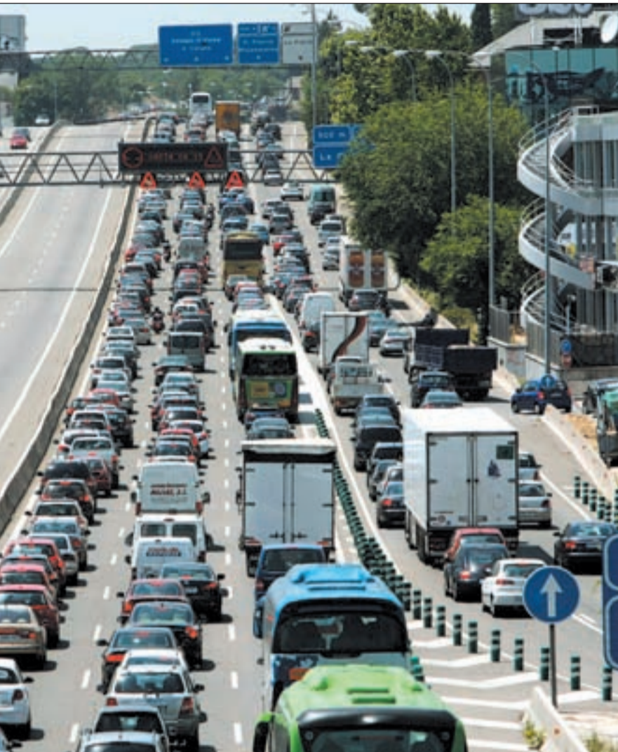
as vacaciones

ras del viernes y las 24 del domingo durante todo el verano.