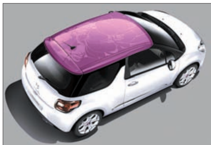
Uno de las posibles combinaciones personalizadas del DS3

El DS3 cuenta ahora con 11 colores de carrocería, al añadirse el nuevo tono Hickory, que está disponible como monotonó y asociado al color de techo negro Onyx y blanco Opalo. Al nuevo color para el techo se suman la nueva personalización Flower, que puede incorporarse con todos los colores de techo, y la denominada Flavio, diseño gana-