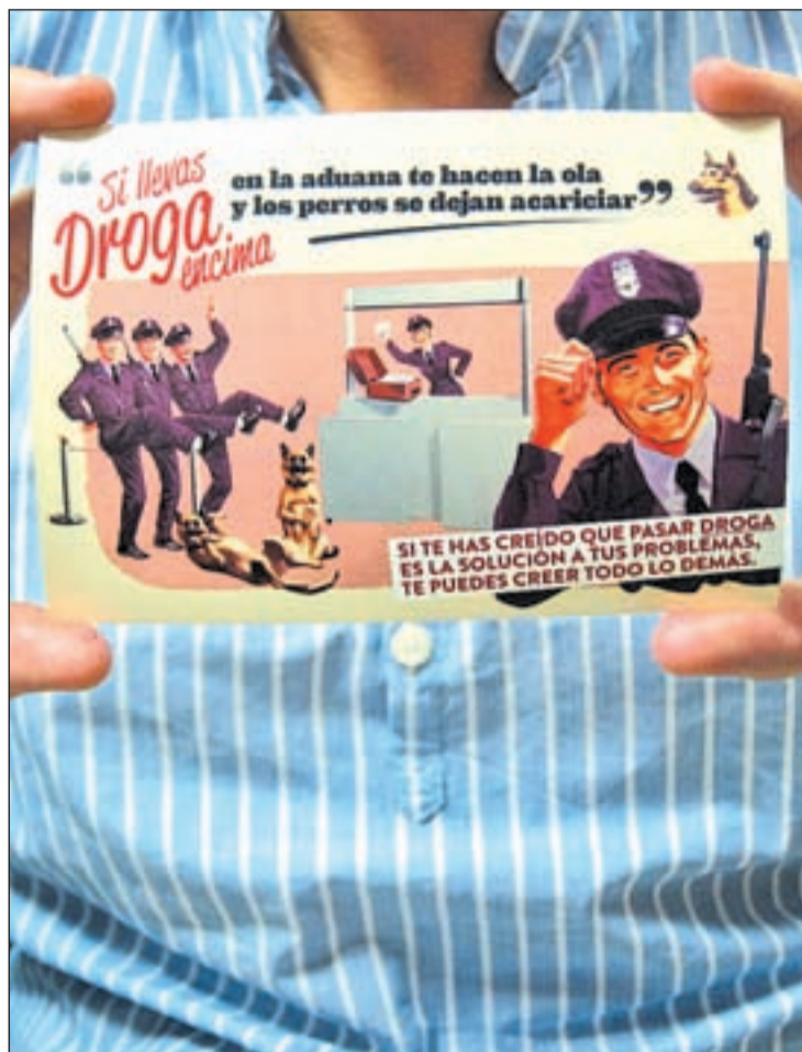
Cartel de la campaña de 2011