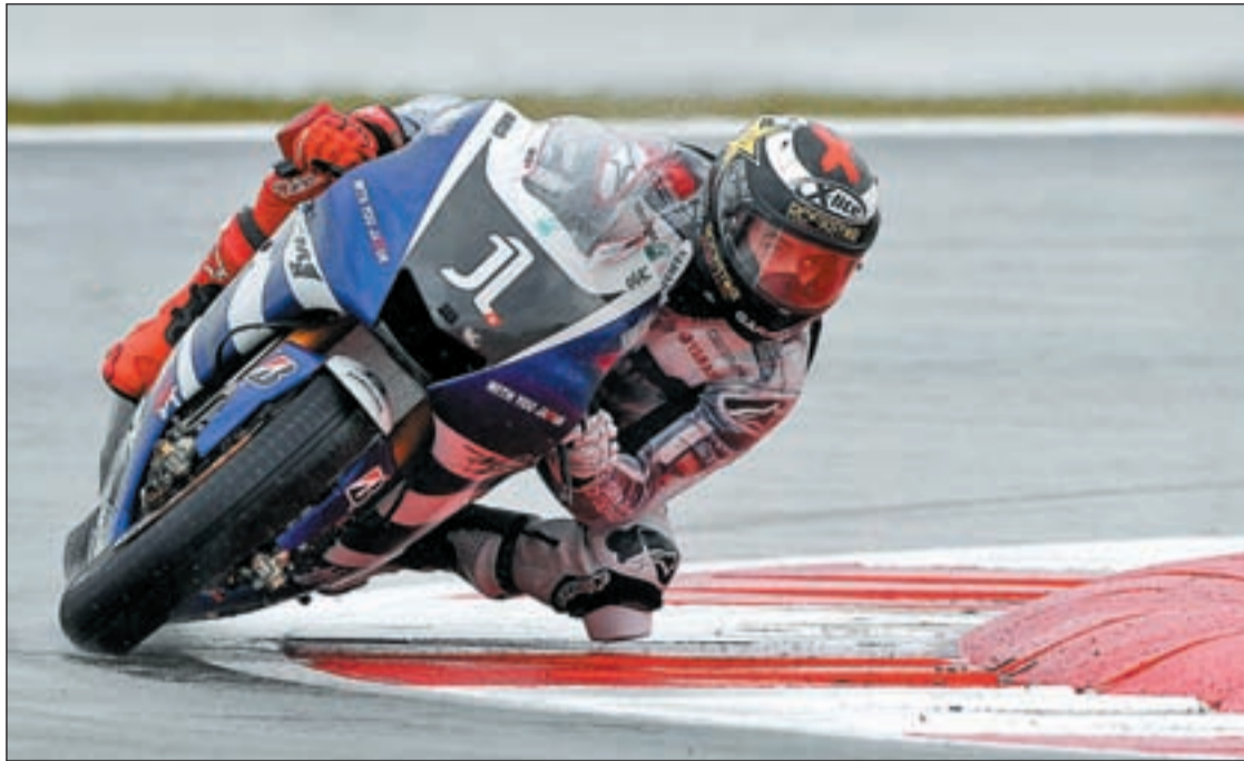
El piloto de Yamaha se reencontró con la victoria en el Gran Premio de Italia

MOTOCICLISMO EL TRAZADO DE SAJONIA ALBERGA EL GRAN PREMIO DE ALEMANIA