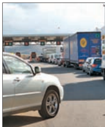
Un puesto de peaje

es necesario adquirir un dispositivo que tras adaptarlo a la luna delantera del vehículo emite el pago directamente. La recarga de saldo de Mobe se hace por Internet. Además de para el pago de peajes, se podrá utilizar en los aparcamientos provistos del sistema Vía-T de todas las ciudades españolas.