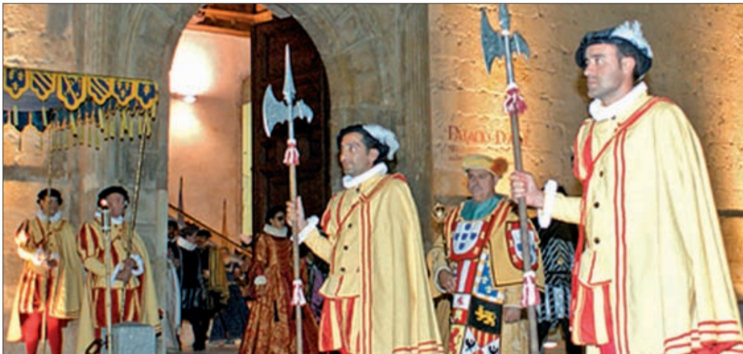
Teatro en la calle en Pastrana

La destacada pintora mexicana murió el 13 de julio de 1954. "Espero no volver jamás", escribió en su diario.