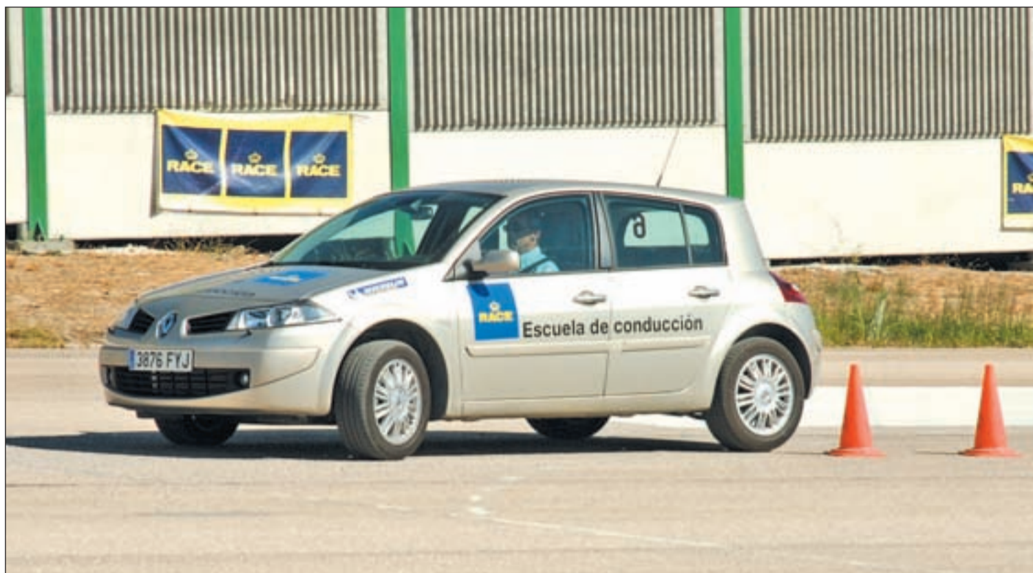
Uno de los cursos de conducción organizados por RACE