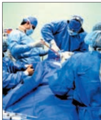
Médicos en plena intervención

Los cirujanos transplantaron a un paciente de 36 años, de origen africano, una tráquea artificial creada por científicos británicos, que después fue cubierta con células madre del paciente. Esta técnica no necesita donante