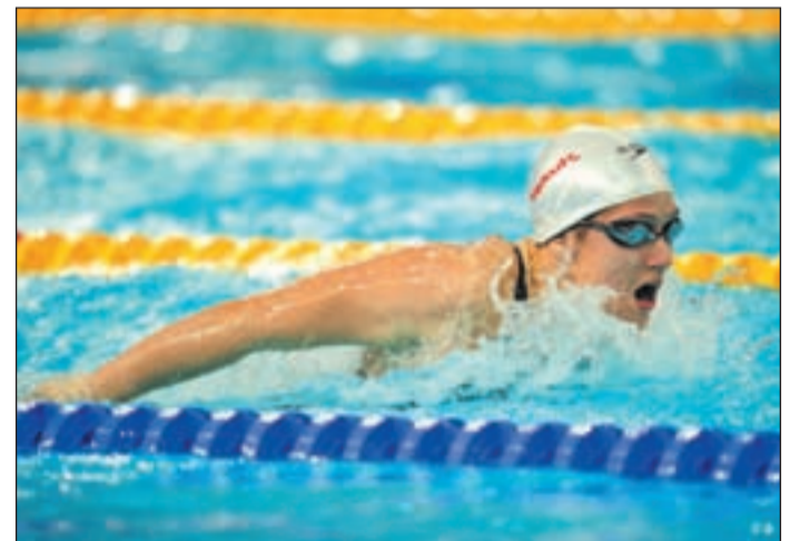
Belmonte, una de las esperanzas españolas

Aunque sin duda donde España tiene más posibilidades de subir al podio es natación sincronizada, donde los objetivos son "súper ambiciosos", según la directora Anna Tarrés.