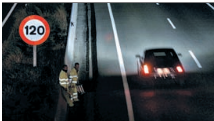
Una de las vías de la Red de Carreteras españolas

ciones, convirtiendo a Reino Unido en el país europeo con más atascos del 2011. En contraposición, viajar por países como España, Suiza, Noruega, Hungría o Irlanda implica un menor estrés ya que todos cuentan con sólo una ciudad entre las top 50. En concreto, en España esta ciudad es Barcelona, que ocupa el puesto 23 del ranking con un 25% de carreteras congestionadas. Aun así, Barcelona ha reducido los embotellamientos en un 1,3% desde 2010.