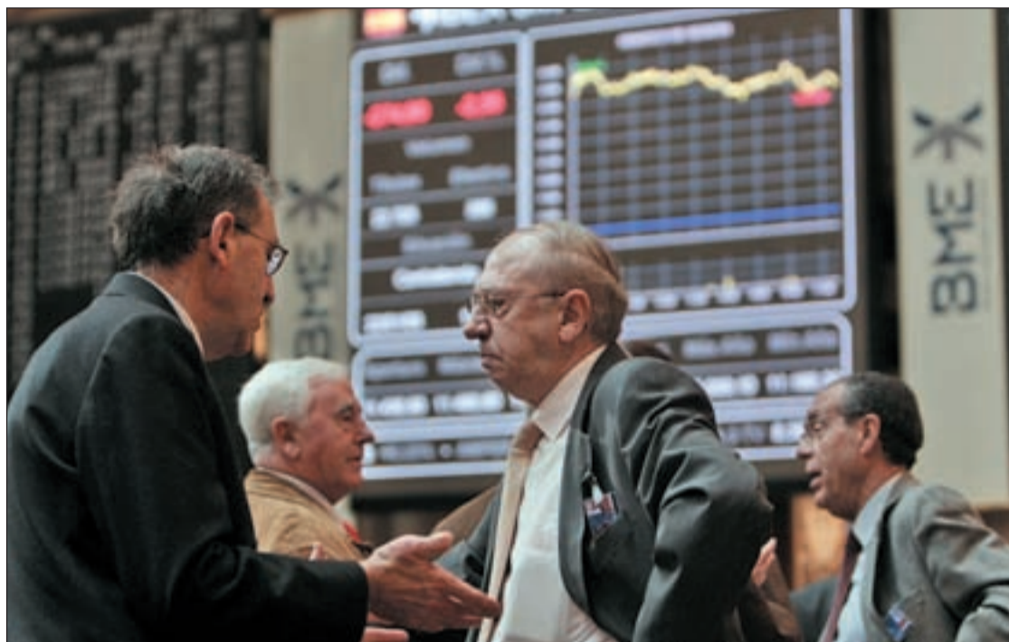
Los mercados bursátiles han sufrido de nuevo los embistes de la especulación

El presidente del Gobierno, José Luis Rodríguez Zapatero, ha pedido una respuesta europea "firme, articulada, clara y rápida" ante el aumento de la desconfianza en los mercados en los últimos días, y ha garantizado el "apoyo" de España al presidente del Consejo Europeo, Herman Van Rompuy, para afrontar esta situación. En una rueda de prensa tras reunirse con Van Rompuy, Zapatero ase-