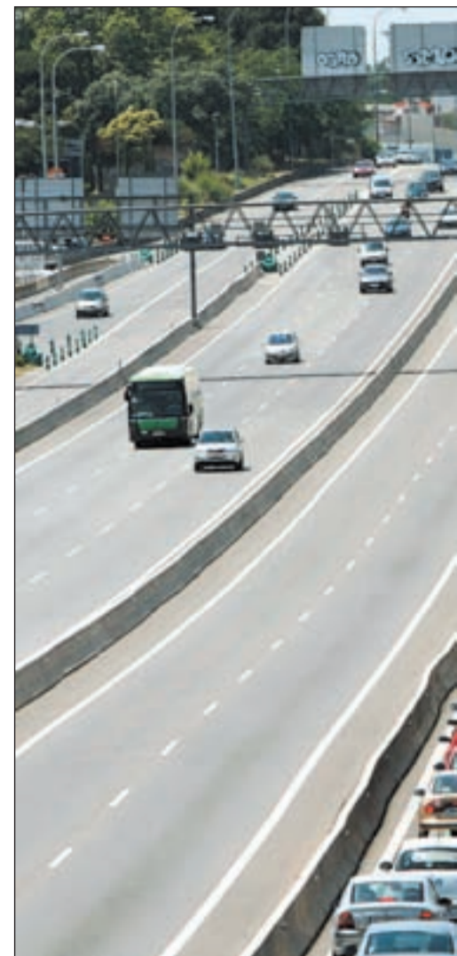
Atasco en la A-6 durante la operación salida en esta

Los camiones son uno de los vehículos más temidos por los conductores de los turismos. Para evitar anomalías y riesgo en el tráfico la DGT ha restringido la circulación de vehículos de mercancías peligrosas y transportes especiales, al igual que la de los camiones de masa máxima autorizada de más de 7.500 Kg en determinadas carreteras de especial intensidad, en horario y días determinados. Asimismo, se han suspendido las obras en fase de ejecución entre las 13 ho-