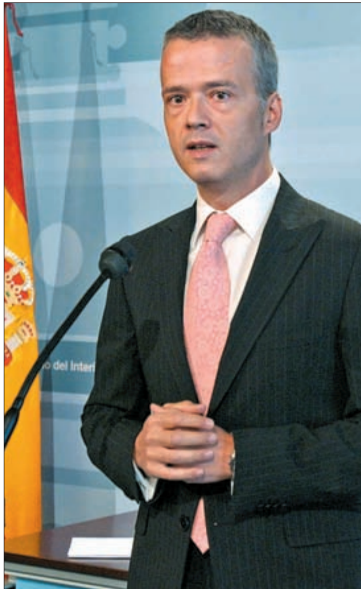
El nuevo ministro de Interior, Antonio Camacho

La única sorpresa en la remodelación que se ha llevado a cabo fue la decisión de nombrar portavoz del Gobierno al ministro de Fomento, José Blanco. Fuentes del PSOE y la mayoría de ministros daban por hecho que recaería en el titular de la Presidencia, Ramón Jáuregui, cuya capacidad para el diálogo es co-