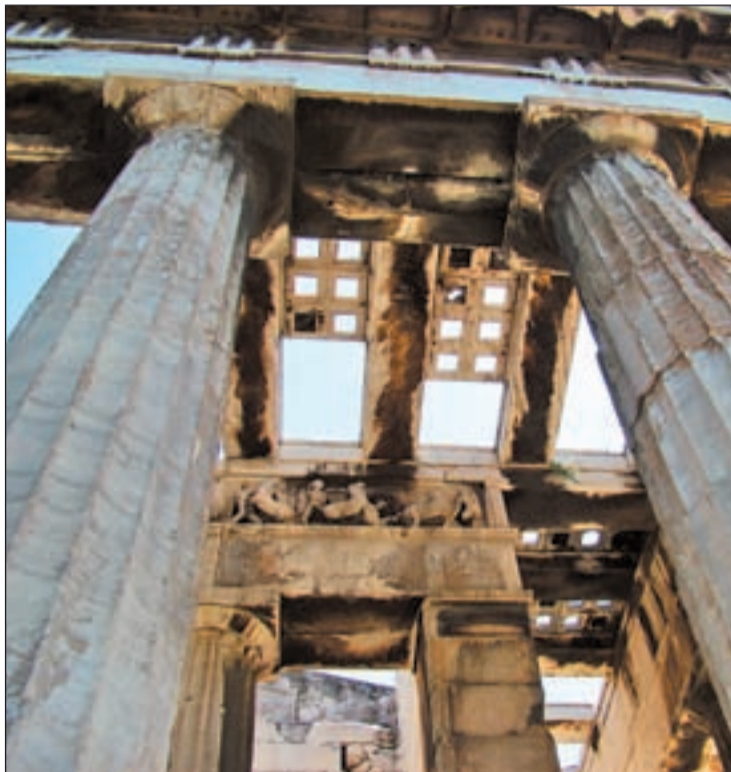
Las ruinas de Olimpia, Patrimonio Histórico de la Humanidad

“Tanto la composición y el espesor de los sedimentos que se encuentran en Olimpia no concuerdan con el potencial hidráulico del río Kladeos y el in-