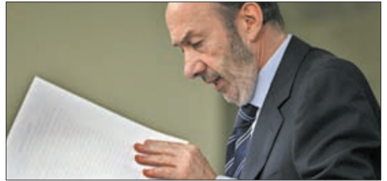
Alfredo Pérez Rubalcaba se ha vuelto crítico con los banqueros

nacio Fernández Toxo, no es suficiente decir "que los ricos paguen más". Para el sindicalista, hay que establecer "cuánto se quiere recaudar, para qué y con qué figuras fiscales hay que actuar", y no hacer declaraciones en la "zona de la demagogia".