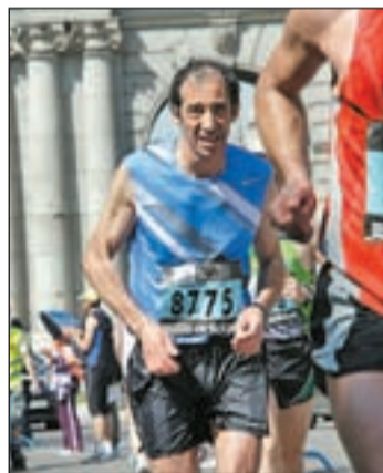
Maratonista en plena carrera

palabras, aquellas personas que están satisfechas con su vida tienen menos riesgo de padecer una enfermedad cardíaca. Y se detectaron cuatro de los aspectos vitales específicos: trabajo, familia, sexo y satisfacción en uno mismo. El resultado abarca tanto hombres como mujeres.