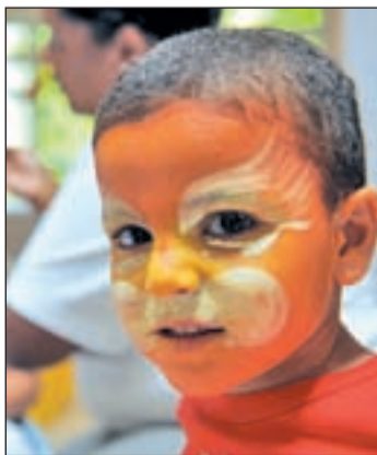
Descuentos a los más pequeños

Una oportunidad para conocer y disfrutar de las bellas playas de Isla Mauricio y Seychelles.