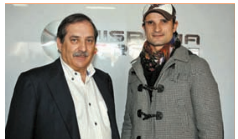
Carabante junto al piloto italiano Liuzzi

dera la compra de Hispania Racing "una oportunidad de entrar en un sector con grandes perspectivas de crecimiento, trabajará con el objetivo de reforzar la gestión estratégica del grupo". Este puede suponer un paso importante para el Hispania Racing que desde su debut en el campeonato del mundo aún no ha logrado sumar un solo punto.