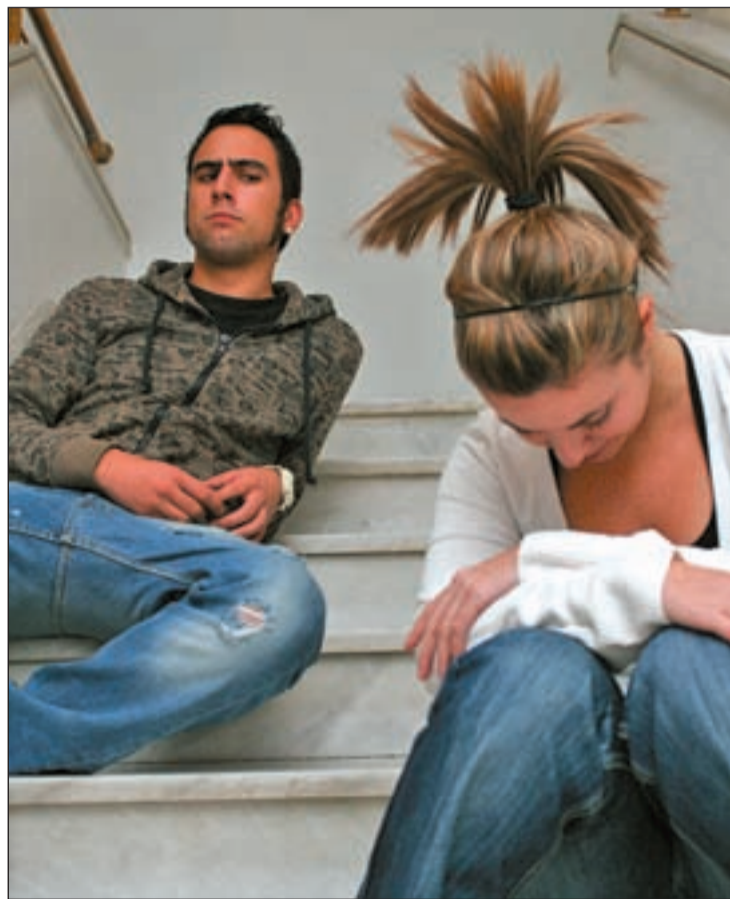
50.000 personas se han registrado ya en Ashley Madison MANUEL VADILLO

Parece que la empresa no se equivocó al apostar por España con una campaña de 3 millones de euros. No hay duda de que