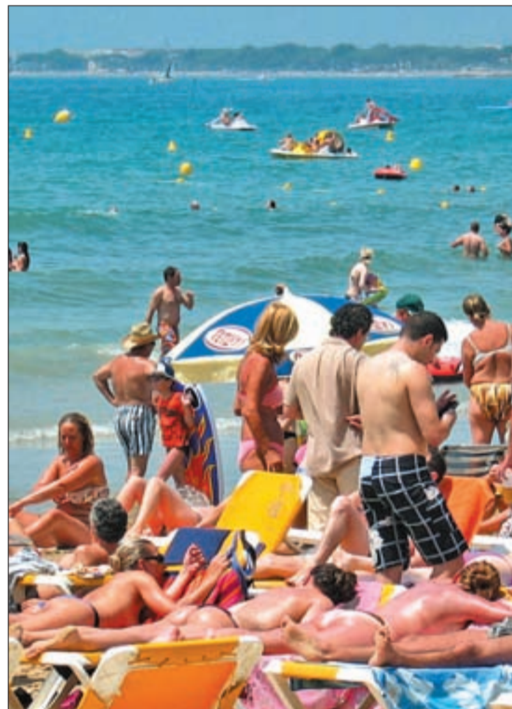
EL TURISMO DE SOL Y PLAYA NO DECAE. Las vacaciones de sol y playa siguen siendo las más demandadas. Las costas e islas españolas son los lugares más solicitados dentro del país, mientras que a nivel internacional destacan los viajes al Caribe.

Blasco destacó el "crecimiento elevado" en la recepción de turistas, que es "lo que nos interesa para el PIB", que irá desde del 5 al 12 por ciento, según las comunidades autónomas, y también de los ingresos, ya que la gente "gasta más". En este sentido, indicó que, debido a la situación que están viviendo países como Túnez, Egipto o Marruecos, "estamos recibiendo un turismo que quizás no hubiera pensado venir", y que hay que cuidar a estos turistas para no perderlos y que vuelvan el año próximo. "Tenemos que aprove-