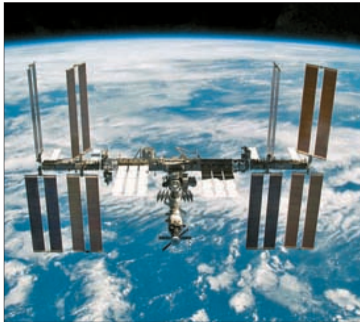
Alrededor de los satélites hay cerca de 700.000 fragmentos de basura

Por su parte, los investigadores de las principales agencias espaciales creen que los satélites