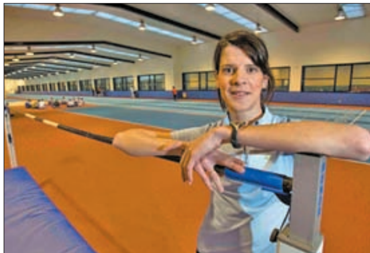
La atleta, durante la entrevista