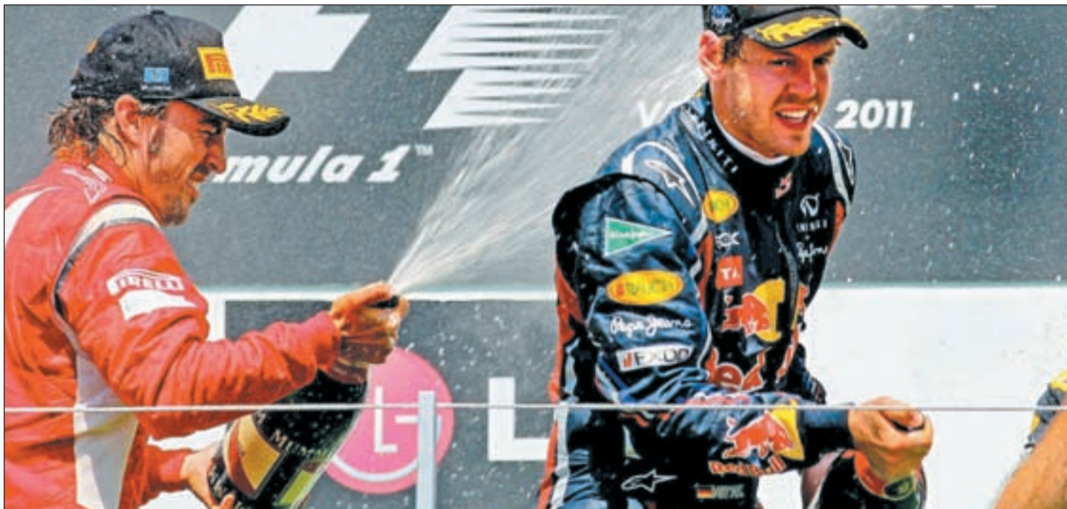
El piloto español salió reforzado moralmente del circuito de Valencia después de acabar en segunda posición

FORMULA 1 ALONSO LLEGA A SILVERSTONE PARA INTENTAR ACABAR CON EL DOMINIO DE VETTEL