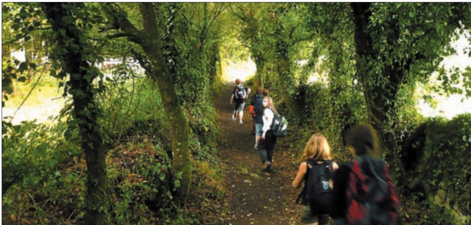
Uno de los frondosos parajes por donde discurre el Camino Primitivo

El 7 de julio de 1985 el tenista alemán Boris Becker se convertía en el más joven (17 años) en ganar Wimbledon.