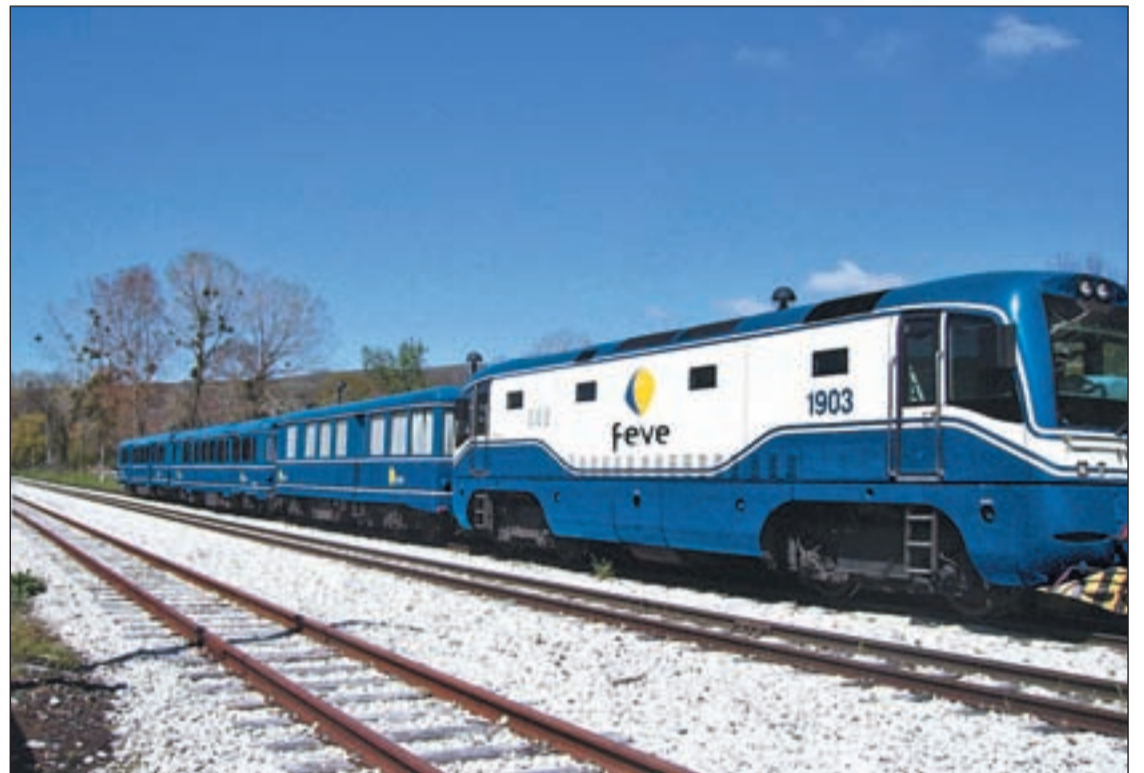
Los Trenes Turísticos del Norte son convoyes especiales de Feve que realizan excursiones de un día

El viaje comienza en la estación de Feve de Gijón-Sanz Crespo a las 9:40 horas. El tren emprende rumbo a Arriondas, y desde allí se accede en autocar al santuario de Covadonga. La mañana se remata con la comida en el Parador Nacional de Cangas de Onís. A continuación,