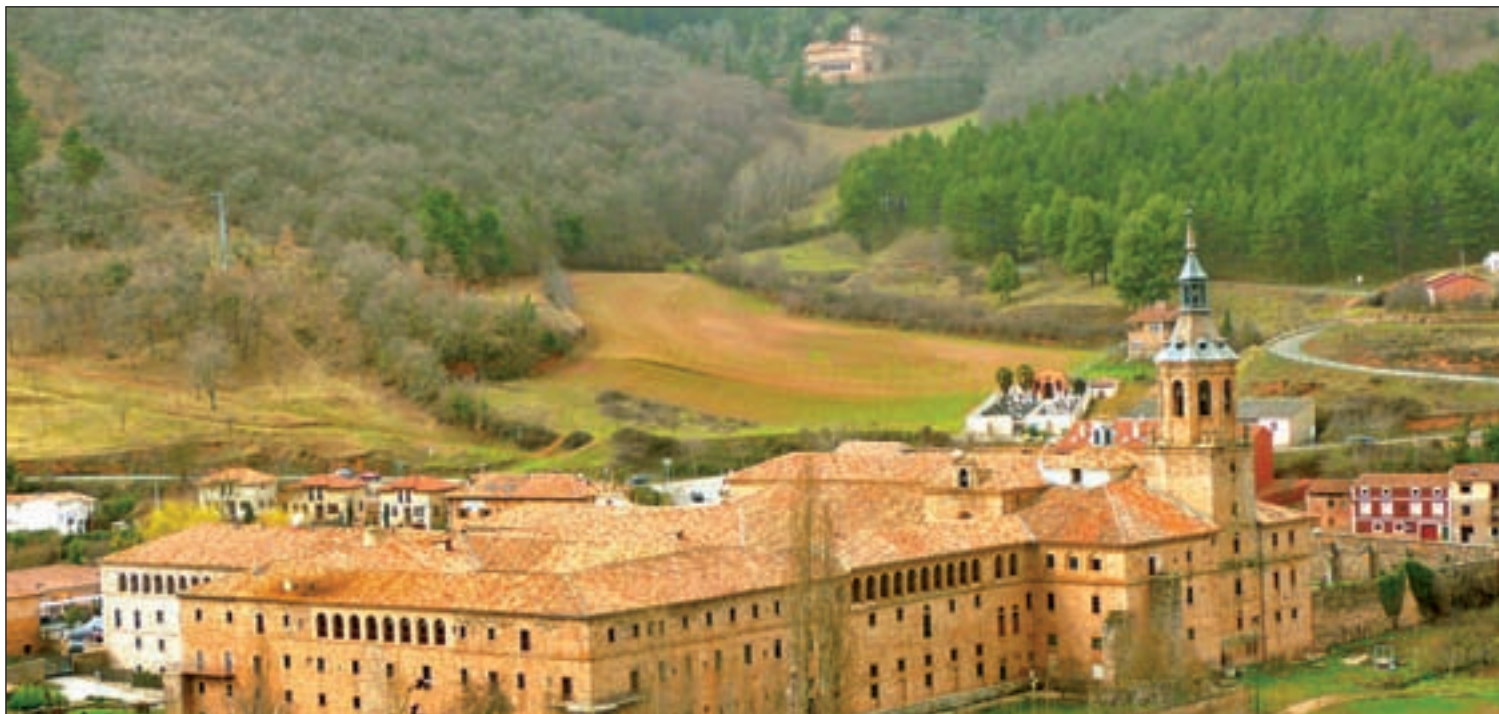
Yuso y Suso al fondo, en el Valle de Cárdenas