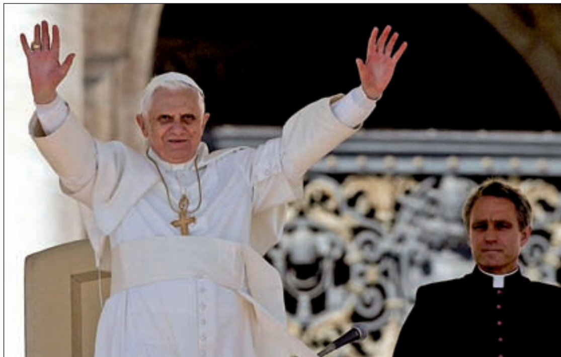
La JMJ, a la que acudirá el Papa, se celebra del 16 al 21 de agosto

Con respecto a la manutención, Sobrino explicó que durante la tercera semana de agosto funcionarán dos sistemas, uno de tickets restaurante hasta el viernes por el que se pretende que 4.000 restaurantes de la capital ofrezcan el Menú del Peregrino -