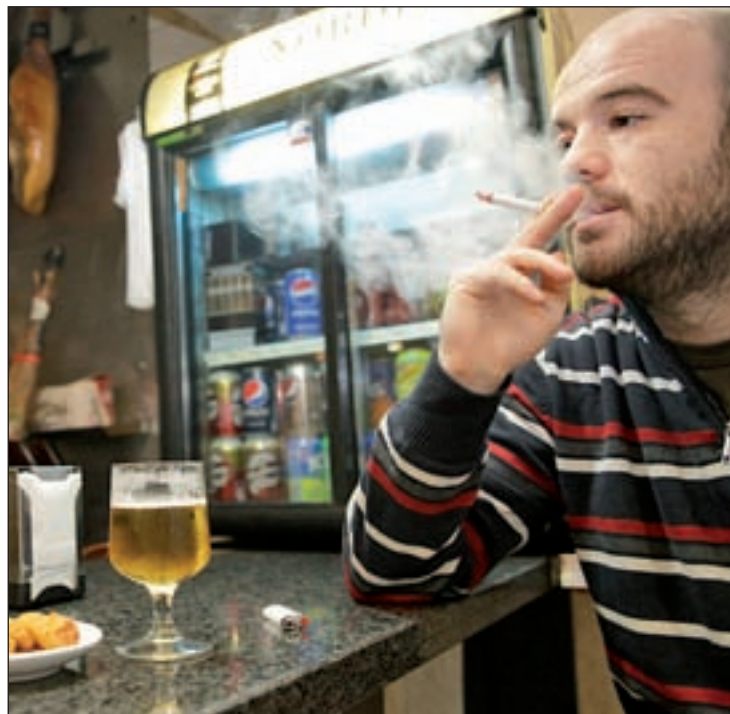
Cada español gasta 188 euros al año en tabaco MANUEL VADILLO

Respecto al consumo de bebidas alcohólicas, cada español consume al año 99,68 litros de media, 0,27 litros al día, cantidad