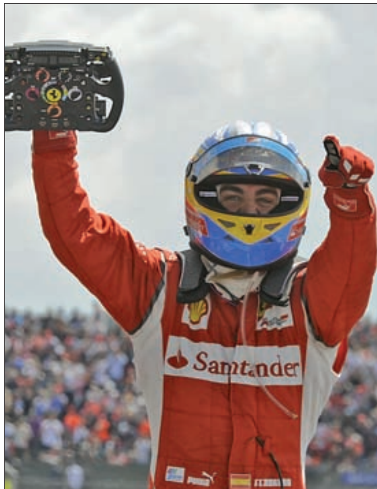
El piloto asturiano obtuvo el primer triunfo del año en Silverstone

Los pilotos volverán este fin de semana a correr sobre el trazado de Nürburgring. Después de un año de paréntesis en Hockenheim, el Mundial regresa a un circuito que forma parte de la historia de este deporte y que por tanto despierta un gran interés entre algunos pilotos como Jenson Button o Mark Webber, quienes ya han mostrado públicamente su satisfacción por rodar en Nürburgring. Una de las grandes incógnitas de este Gran Premio serán las condiciones