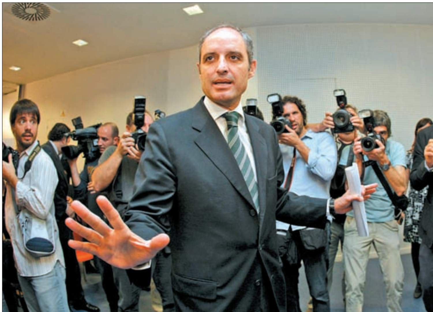
Camps ha sido presidente de la Generalitat Valenciana desde 2003

Se convierte en el primer presidente de una comunidad autónoma que dimite en España • Durante la escenificación de su renuncia las palabras más repetidas fueron "dignidad" y "honestidad" Pág. 4