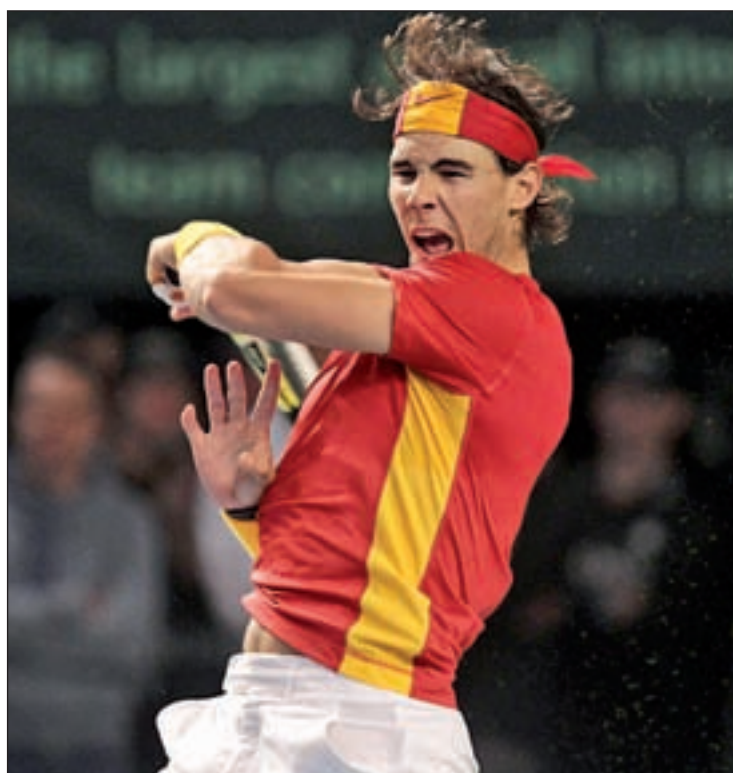
Rafa Nadal tratará de recuperar el número uno mundial

Los hombres de Sergio Scariolo arrancan la defensa de su título