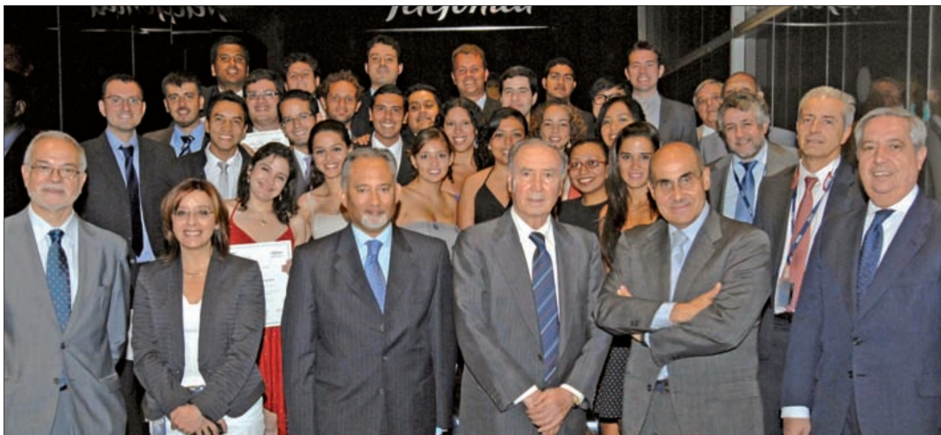
Los Directivos del Programa Balboa y de Telefónica junto a los 25 periodistas latinoamericanos seleccionados en esta edición