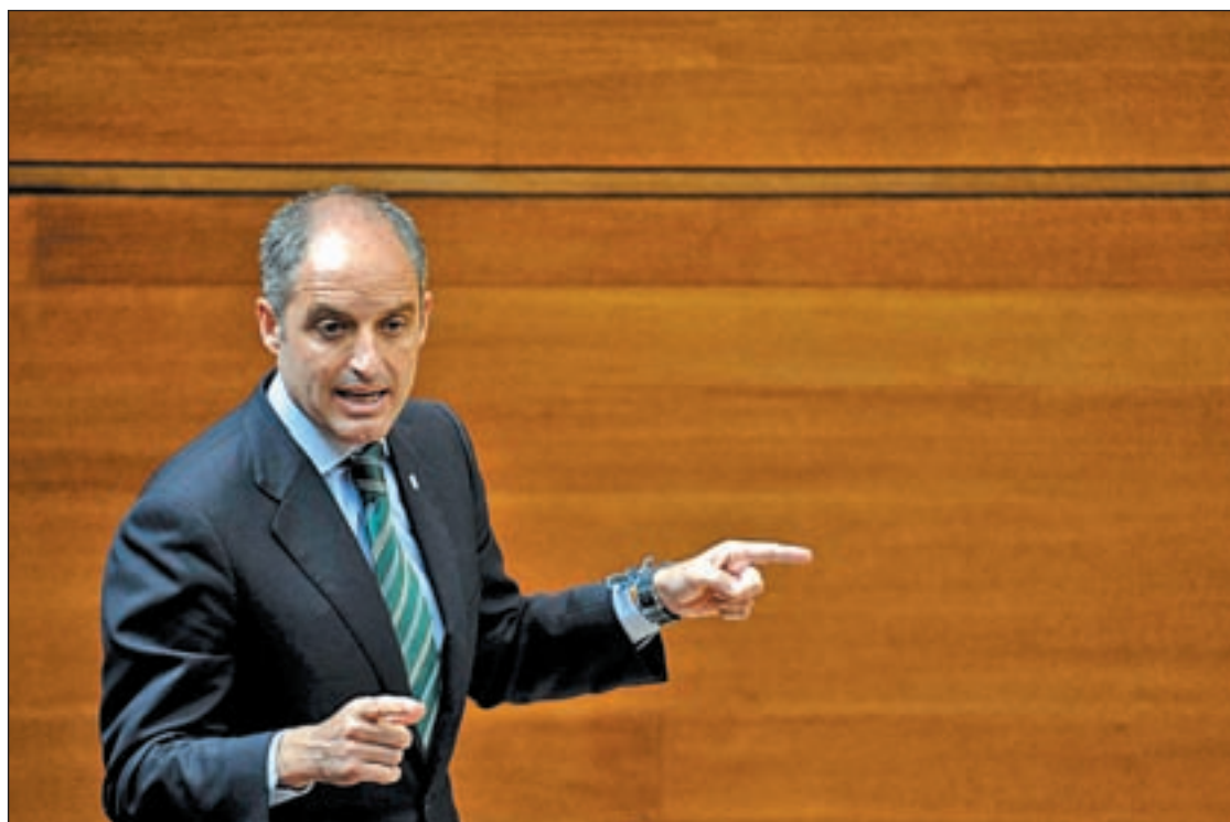
Camps cuando aún era presidente de la Generalitat

Así lo explicó el candidato socialista a la Presidencia del Gobierno, Alfredo Pérez Rubalcaba, quien argumentó que el país vecino está viviendo más turbulencias financieras desde que se produjo el cambio de Gobierno.