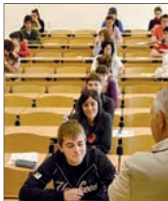
Estudiantes en clase OLMO GONZÁLEZ

En cuanto al nivel de Técnico Superior, incluirá las enseñanzas de Formación Profesional de Grado Superior, las Enseñanzas Profesionales de Artes Plásticas y Diseño de Grado Superior y las Enseñanzas Deportivas de Grado Superior. El nivel de Grado recogerá los Grados en Enseñanzas Artísticas, los Grados