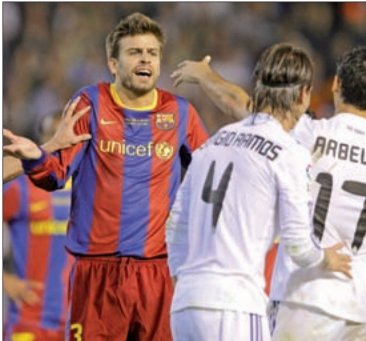
Los dos 'grandes' se jugarán el primer título de la temporada

Después de una temporada en la que se convirtieron en los grandes protagonistas y en la que compararon los títulos más importantes, azulgranas y merengues vuelven a cruzar sus caminos para decidir el primer título de un curso en el que prometen volver a estar en los primeros