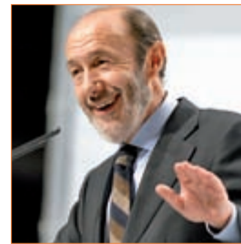
Alfredo Pérez Rubalcaba

diendo las medidas mencionadas, acusó a los bancos de “dar hipotecas al límite”. “Tienen necesidad de cobrar las hipotecas, pero no pueden hacerlo a coste cero y a costa de la gente”, a coste de personas que mañana podrían quedarse sin vivienda.