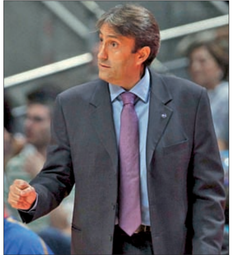
El técnico emprenderá una nueva aventura en el Valladolid