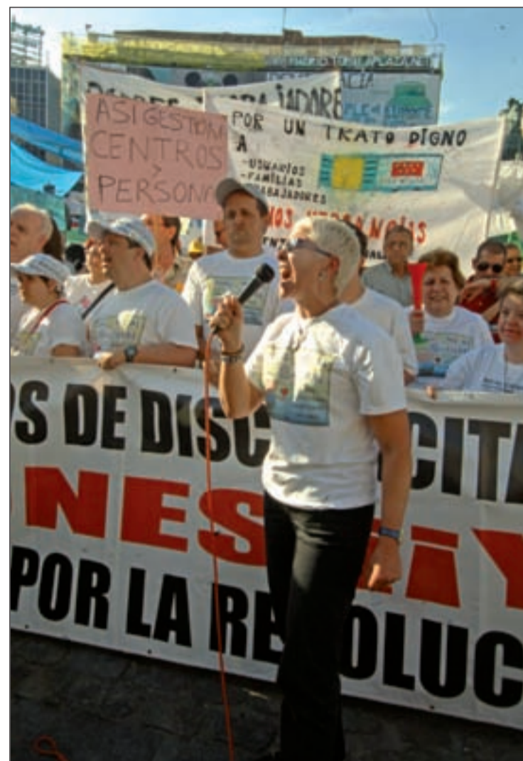
Protesta de los afectados del Magerit en Sol