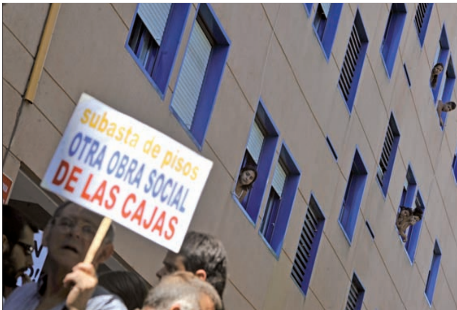
Intento de desahucio frenado por vecinos, amigos y diferentes movimientos sociales en Leganés