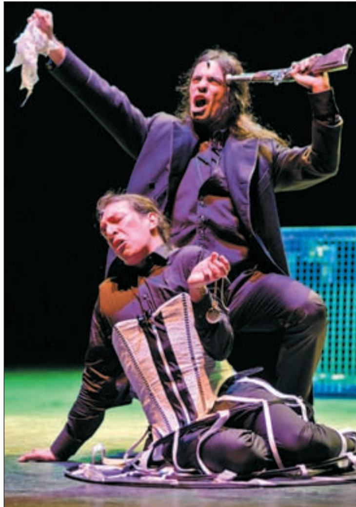
Un momento de la representación

El show va disparándose hasta llegar a la parodia de los musicales versión 3.0, el duelo oratorio entre Pasado, Presente y Futuro (canela fina) o los descaharrantes cantes del homo sapiens. Hay también dosis de lirismo, que alivian y dejan reposar todo lo demás. Emotivo lagrímón a punto de saltar de cada ojo en la escena chejoviana del abejorro y la margarita, o en el interludio poético del preso condenado a muerte al amanecer