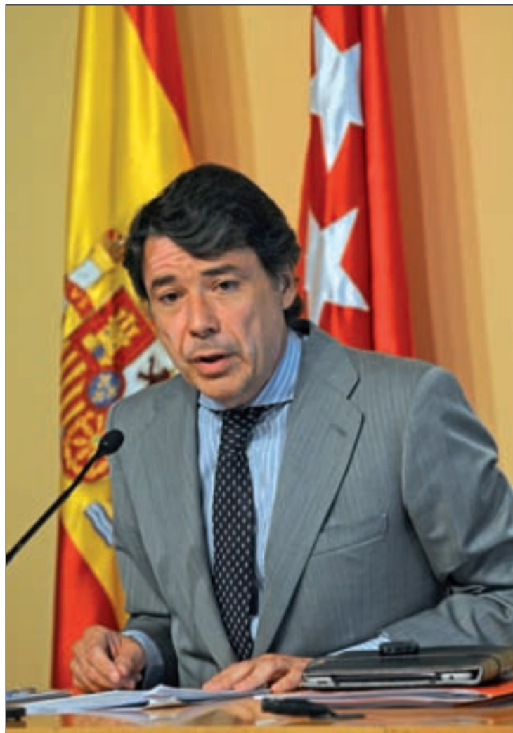
El vicepresidente regional comparecerá en comisión

El portavoz del PSOE en la Asamblea, Tomás Gómez, denunció que esta comisión es el primer incumplimiento y la primera mentira en esta legislatura de la presidenta regional. "Aguirre planteó la comisión como algo totalmente diferente, mixta y en la que participarían los ayuntamientos", recalcó Gómez, al