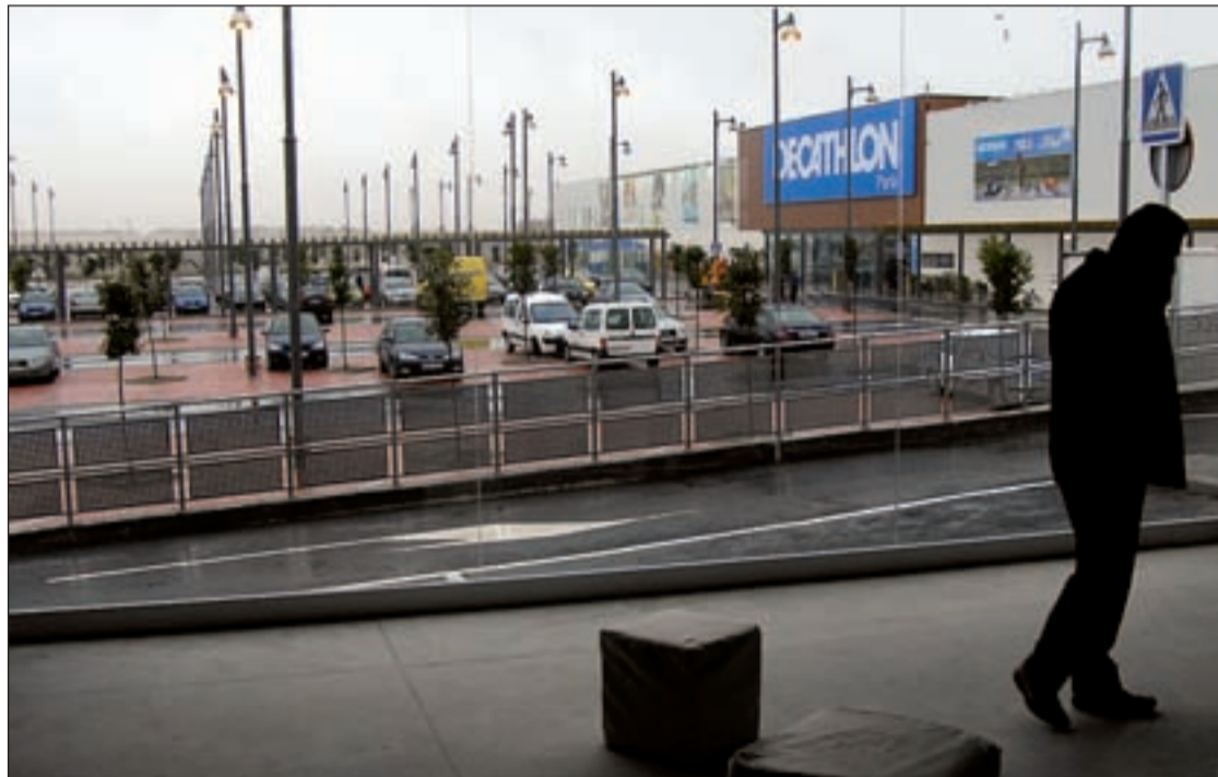
Decathlon busca trabajadores para su segunda tienda en Leganés