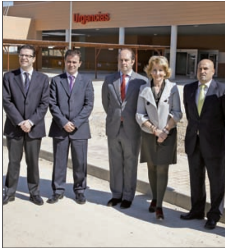
El hospital de Torrejón abrirá sus puertas tras el verano