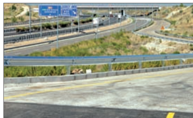
La M-45 ya está abierta al público

tección civil o emergencias) y limpieza. También pedían que se hicieran públicas las infraestructuras que han sido cedidas por el Ayuntamiento de Coslada, y el coste sufragado por el Consistorio, para su utilización por los participantes en la “Jornada Mundial de la Juventud”. PSOE e IU votaron a favor.