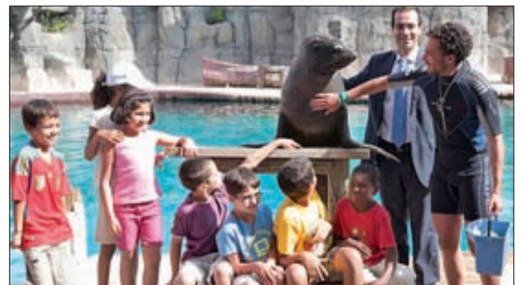
El consejero de Asuntos Sociales visita Faunia con los menores