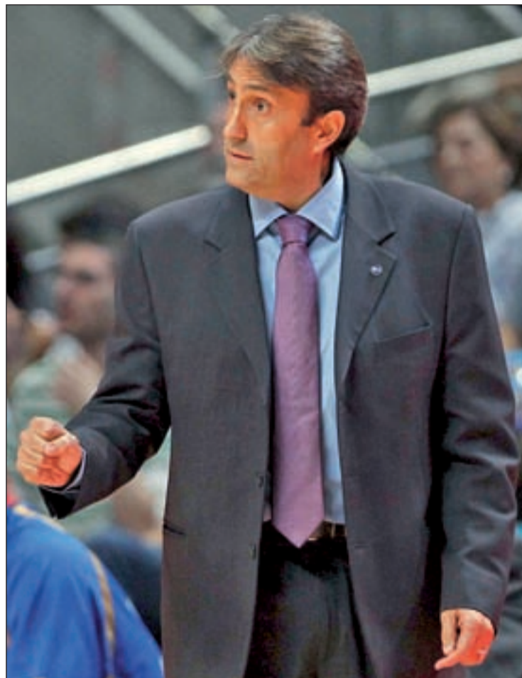
El técnico emprenderá una nueva aventura en el Valladolid