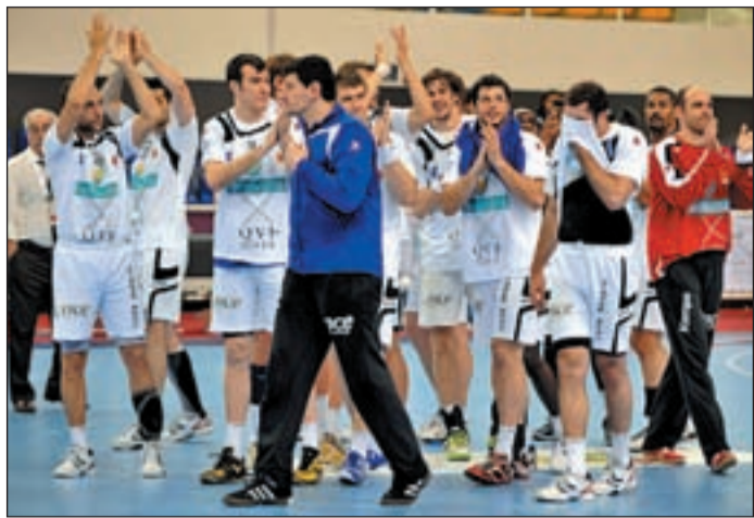
La plantilla de Dujshebaev regresa al trabajo

LA PLANTILLA PASARÁ RECONOCIMIENTO EL MARTES