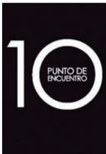
Imagen de la nueva plataforma

Artesanía, exclusividad, fabricación cien por cien española y una presencia internacional, son el denominador común de todas ellas.