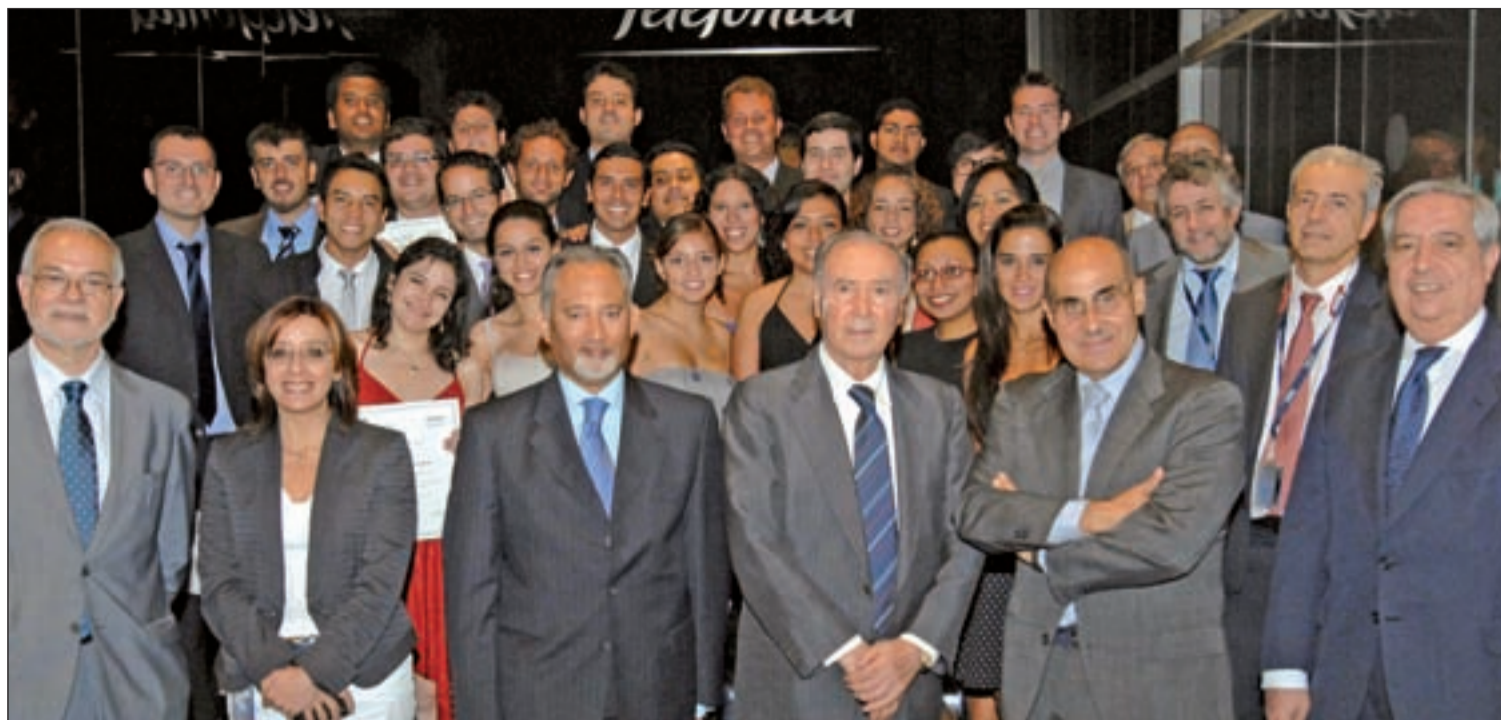
Los Directivos del Programa Balboa y de Telefónica junto a los 25 periodistas latinoamericanos seleccionados en esta edición