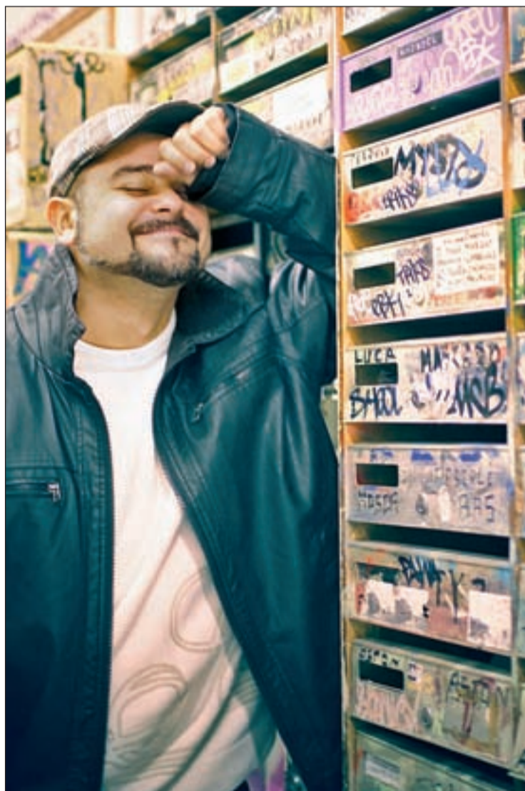
El artista acaba de presentar una gira que le llevará por todo el país

Han pasado tres meses desde que salió el disco y con la distancia Nach reconoce que "es el disco con el que me he quedado más tranquilo, satisfecho, por todo lo completo que está a muchos niveles", todo un logro "porque soy bastante crítico con lo mío". La gente se lo comenta por la calle. "Que alguien no te conozca de nada y te diga que tus canciones son especiales es algo que me hace feliz", comenta Nach. Probablemente, 'El idioma de los dioses' sea una de ellas. "Se trata de un homenaje a la música, a lo que me ha inspirado y quitado. Un repaso a mi infancia. La parte musical está muy elaborada", señala, extrapolando este caso concreto a todas las composiciones, en las que el pianista de jazz Moisés Sánchez tuvo mucho que ver. Entre las colaboraciones, destaca la de Wöyza ("es la reina del hip-hop/soul en España") en 'Disparos de silencio' o la de Ismael Serrano en 'Ellas' (creció escuchando a Serrat o Aute). "Habla-