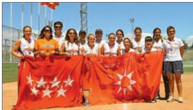
Las chicas del Dridma Rivas celebran su éxito

Las fechas y la sede en las que jugarán se conocerán en febrero del próximo año.