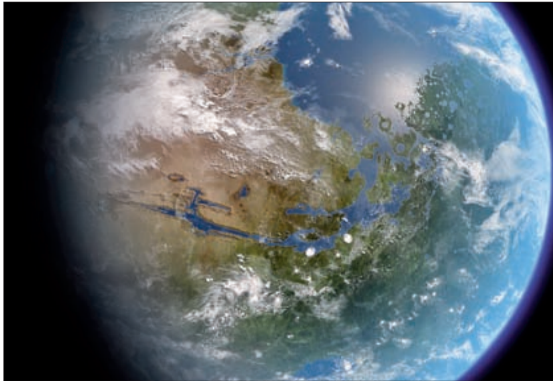
Hasta el inicio del nuevo año se explotarán los recursos por encima de lo que pueden producir