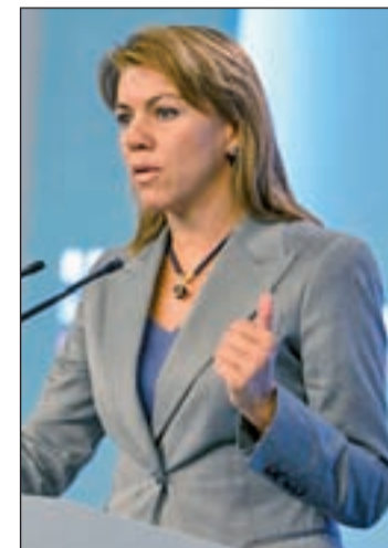
María Dolores de Cospedal

La secretaria general del PP y presidenta de Castilla La Mancha, María Dolores de Cospedal, no ha dado marcha atrás. Todo lo contrario. De este modo, ha creído oportuno suscribir las palabras de la exministra de Sanidad y coordinadora de participación social del PP, Ana Pastor, que este lunes aseguró que si los 'populares' ganan las elecciones del próximo 20 de noviembre derogarían la actual normativa de Aborto. De hecho, el Partido Popular ya ha interpuesto un recurso de inconstitucionalidad ante el Tribunal Constitucional tras la reforma de la Ley del Aborto a finales de 2009, al considerar que había aspectos de dicha modificación con los que no estaban de acuerdo.