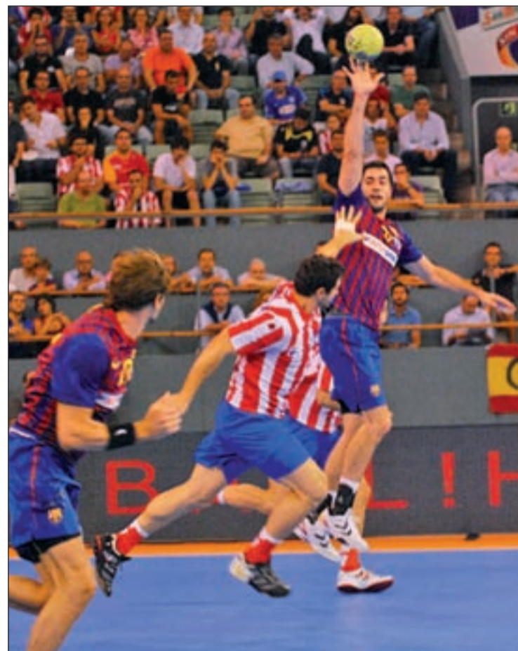
Ambos equipos durante la celebración de la Supercopa BM AT. MADRID

Ese historial reciente hace que tanto el Barcelona como el Atlético partan como grandes favoritos para acabar como líderes sus respectivos grupos. Sin embargo, los antecedentes también dejan un aviso claro a los equipos más importantes: la relajación se puede pagar muy caro. Buena fe de ello puede dar el Barça, que antes de iniciar su camino triunfal hacia Colonia, tuvo que jugarse todo a una carta en las jornadas finales de su grupo tras los tropiezos inesperados ante el Rhein-Neckar Löwen alemán y el Chambéry Savoie francés. Precisamente el conjunto galo será el primero de los rivales de los azulgranas en esta fase, antes de medirse al Croatia Osiguranje Zagreb de Ivano Balic, al Kadet-