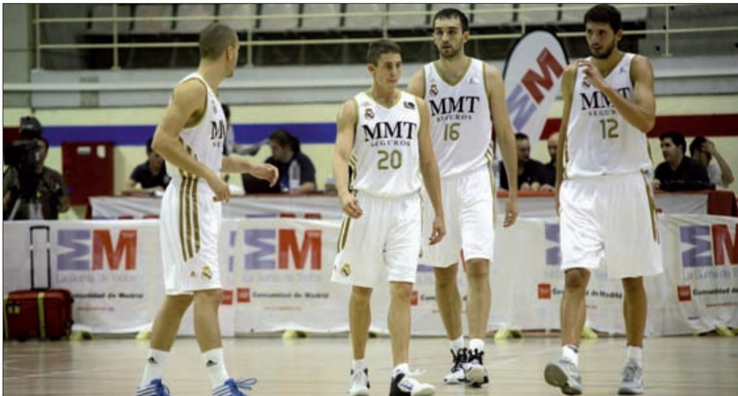
El Real Madrid se ha renovado con la intención de acabar con su sequía de títulos

CAJA LABORAL, MADRID, BARÇA Y BILBAO SE JUEGAN EL PRIMER TÍTULO DE LA TEMPORADA