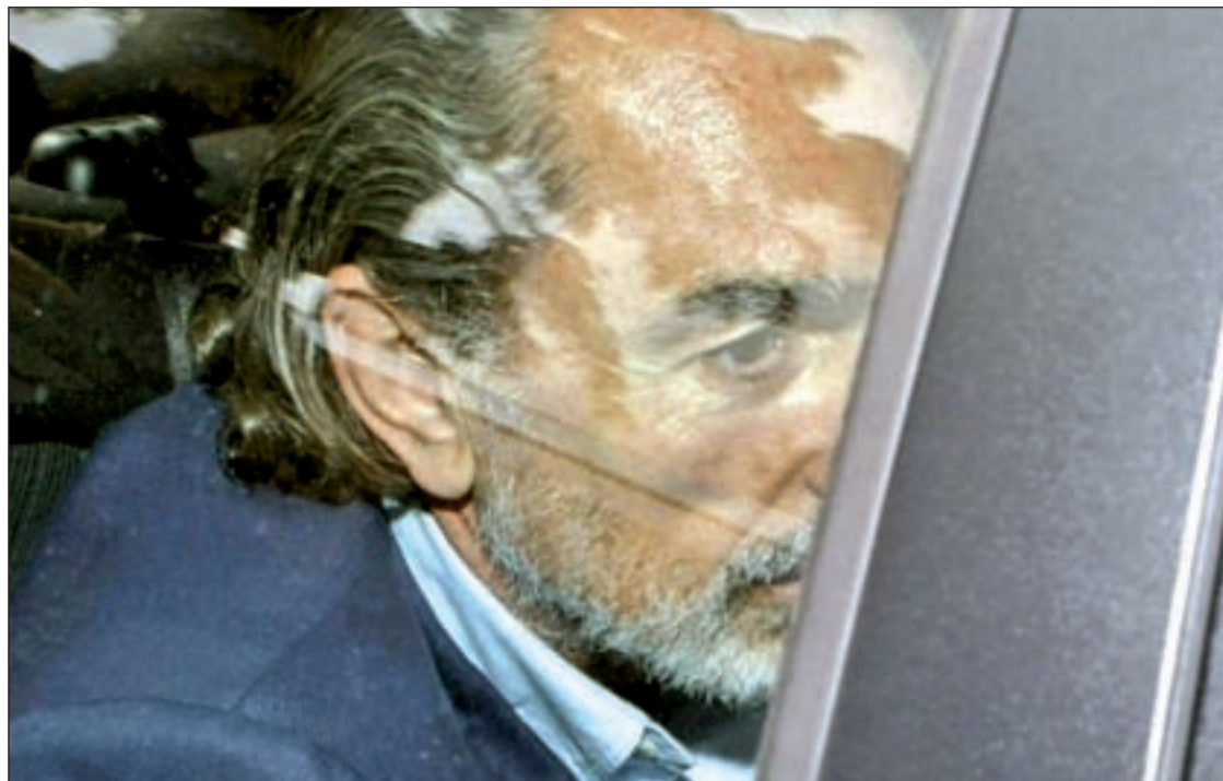
Francisco Correa, principal acusado del Caso Gürtel