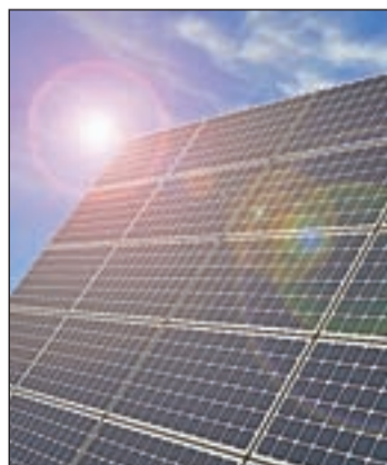
Una placa solar

sis. La investigación se basa en proporcionar un marco para diseñar sistemas de recolección de luz que permitan dirigir el flujo de energía de forma más sofisticada y a larga distancia, creando así una "matriz energética" microscópica para regular la conversión de energía solar.