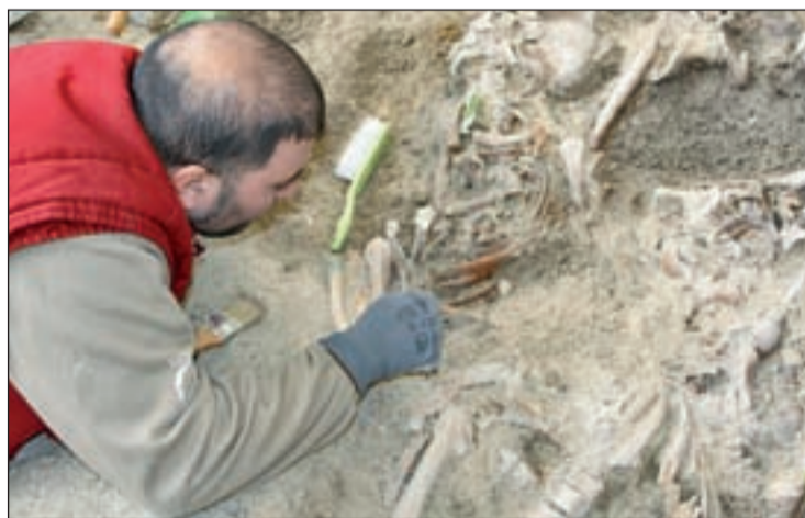
El esqueleto se encontraba sin envoltorio ni urna.

El esqueleto de la fémina se encontraba enterrado en la región italiana de la Toscana "sin envoltura ni urna", un hecho que reafirma la condición de "condena-