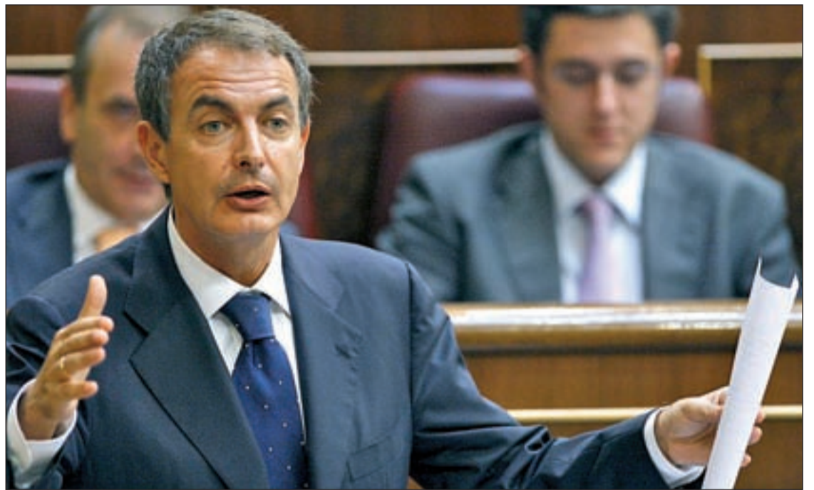
Zapatero vivió la semana pasada su última intervención parlamentaria

tan potente. No obstante, los dos candidatos con más opciones a la presidencia en las próximas elecciones, Mariano Rajoy y Alfredo Pérez Rubalcaba, se encuentran inmersos en una batalla por los recortes. Ambos aseguran que no congelarán ni las pensiones ni el salario de los funcionarios de llegar a alcanzar la presidencia. Y, curiosamente, los dos atacan al contrario con los mismos argumentos. Igual sucede con los representantes de sus respectivos partidos, que se han enzarzado en una curiosa carrera de dimes y diretes.