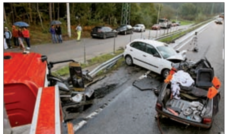
Los accidentes son la máxima expresión de las infracciones viales

Coincidiendo con esta problemática al volante, el pleno de la Eurocámara aprobó este martes un informe sobre seguridad vial en el que pide limitar a 30km/h la velocidad máxima en zonas residenciales. El texto, que no es vinculante, también propone un límite cero de alcohol en sangre para conductores profesionales y noveles. Además, reclama medidas para mejorar la formación automovilística, como la con-