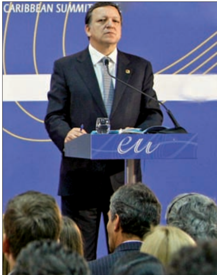
Durao Barroso se ha topado con la oposición del BCE

Los ingresos se destinarán a financiar el presupuesto de la UE, reduciendo así las aportaciones de los Estados miembros, y a los presupuestos nacionales. Los Estados miembros podrán decidir incrementar la parte de los ingresos gravando las transacciones financieras con un tipo más alto. La UE llevará su propuesta a la reunión del G-20 en Cannes, en noviembre, aunque Estados Unidos ha dejado claro que se opone a la iniciativa. "En los últimos tres años, los Estados