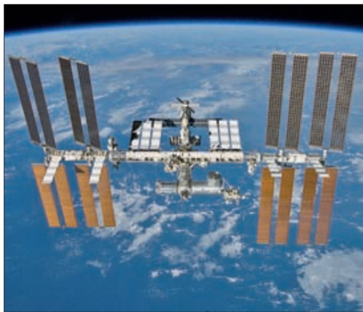
La caída del satélite fue descontrolada

Según informaciones oficiales, UARS pasó sobre la costa oriental de África en el Océano