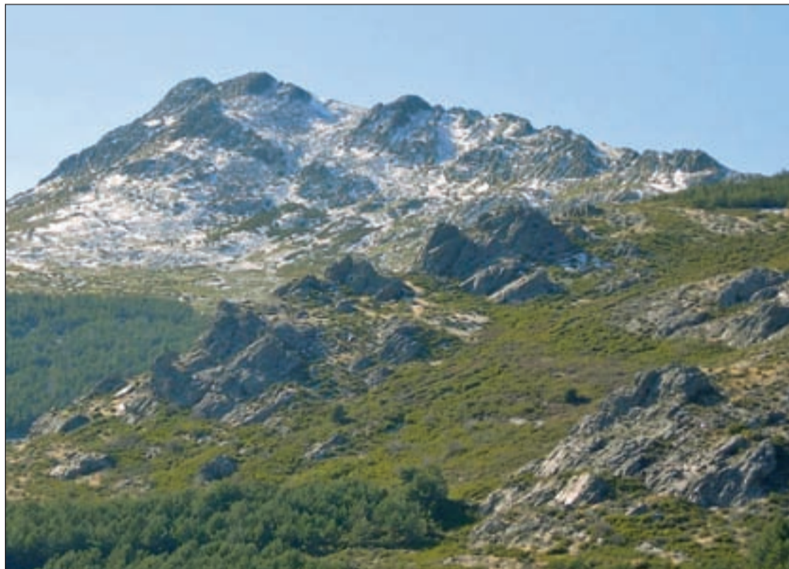
Majestuosa imagen del Ocejón salpicado de nieve

En Valverde de los Arroyos podemos subir a las Eras por el camino de la Chorrera de Despeñaelagua, disfrutando de la abrupta naturaleza, cruzamos la falla que da origen a la Chorrera, enclave vertiginoso con sus 100