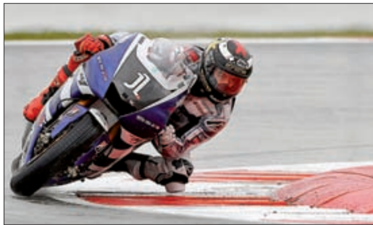
Lorenzo aún mantiene opciones de revalidar su título