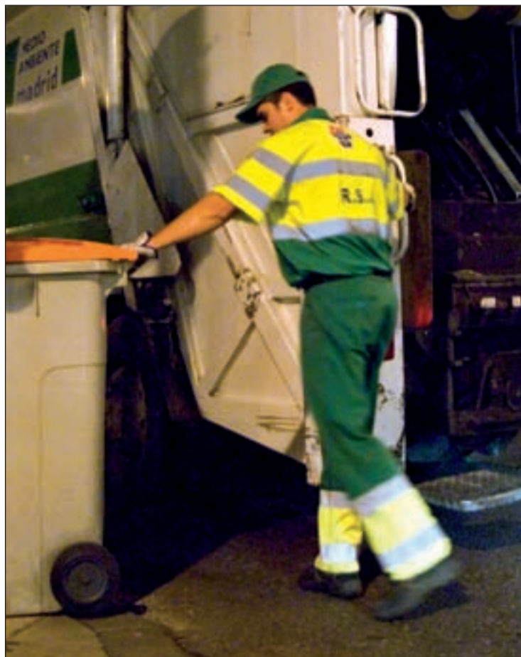
Un operario durante la recogida de basuras

"El PSOE sabe, perfectamente, en qué situación dejó las arcas municipales y, también sabe que el Ayuntamiento está intervenido. Próximamente vamos a tener que llevar a cabo una reduc-