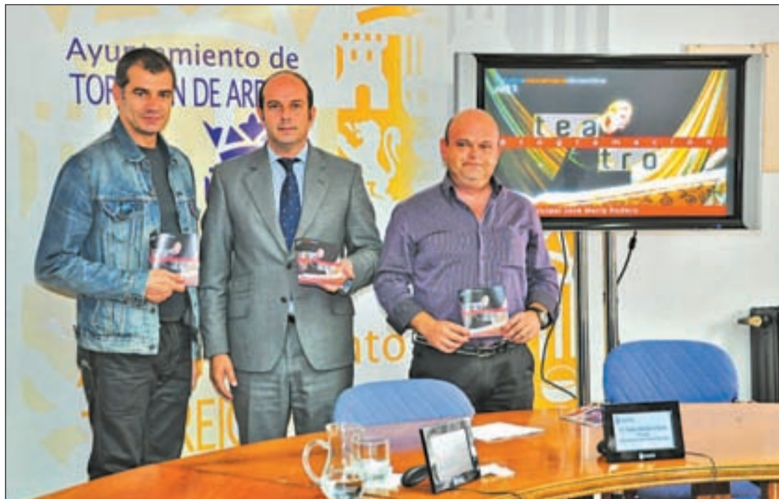
El actor Toni Cantó, en un momento de la presentación del teatro