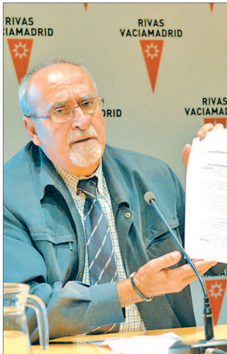
El alcalde de Rivas, José Masa, en rueda de prensa

El alcalde ha puntualizado que la defensa de los servicios públicos gratuitos, universales y de calidad seguirá siendo prioritaria para la ciudad y su Gobierno. "Nadie nos va a tapar la boca. Ni con todas las amenazas del mundo", declaró al respecto.