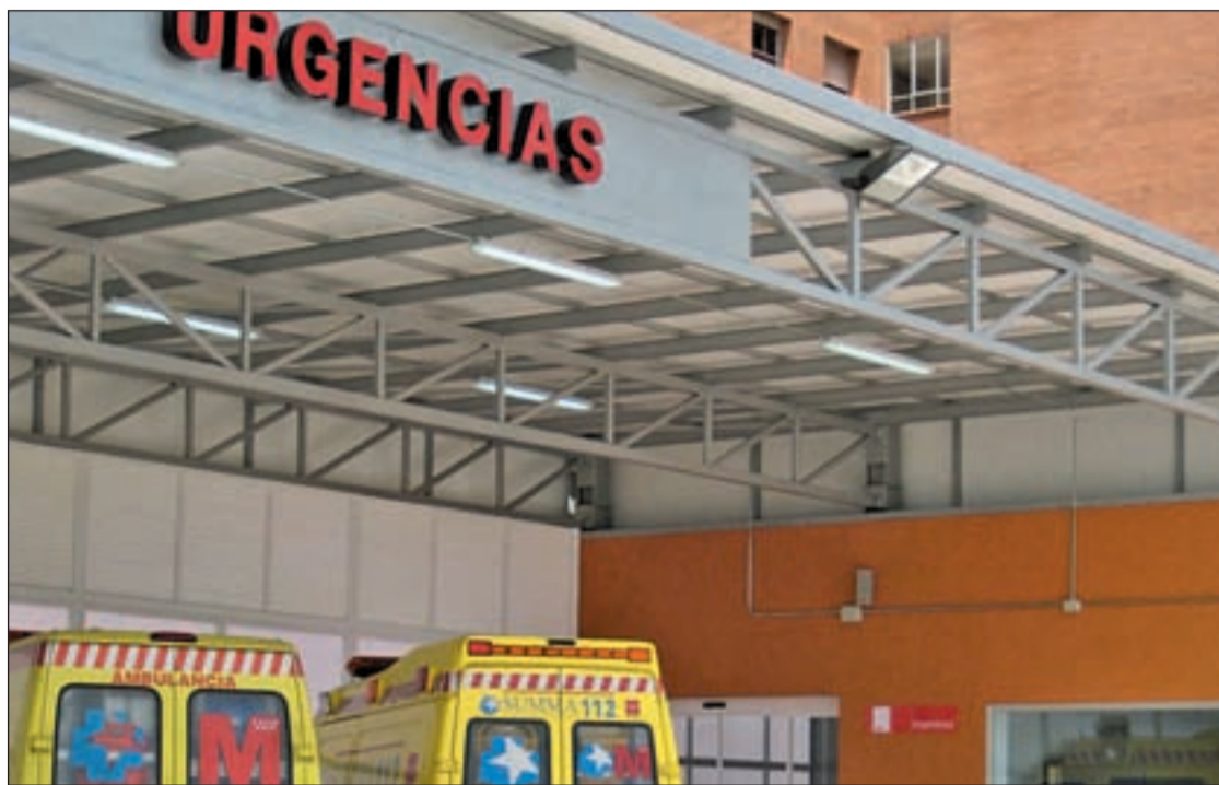
La reforma de las urgencias del Príncipe de Asturias se ha realizado en dos fases

El Servicio de Urgencias incorpora por primera vez una zona