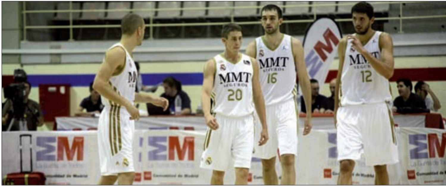
El Real Madrid se ha renovado con la intención de acabar con su sequía de títulos

CAJA LABORAL, MADRID, BARÇA Y BILBAO SE JUEGAN EL PRIMER TÍTULO DE LA TEMPORADA