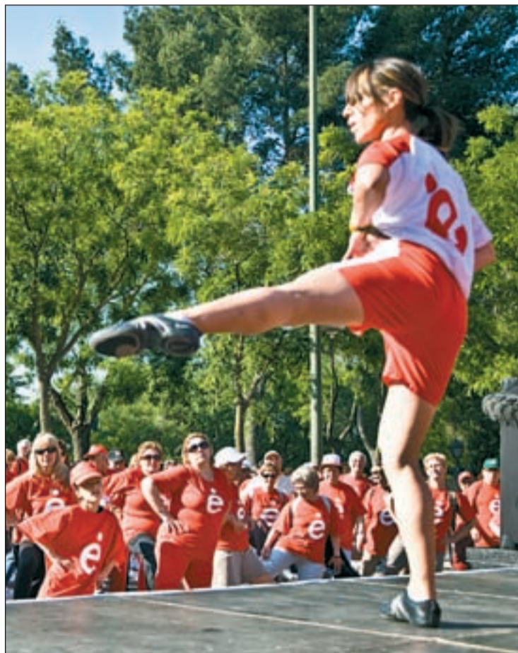
El objetivo del programa es fomentar la actividad física

Una sesión estándar se compone de 10 minutos de calentamiento, cuarenta minutos de actividad (basados en diversos ejercicios de fácil ejecución) y 10 minutos más de estiramientos. El programa "En Forma" es idóneo para todo tipo de personas, sin límites generacionales, pero