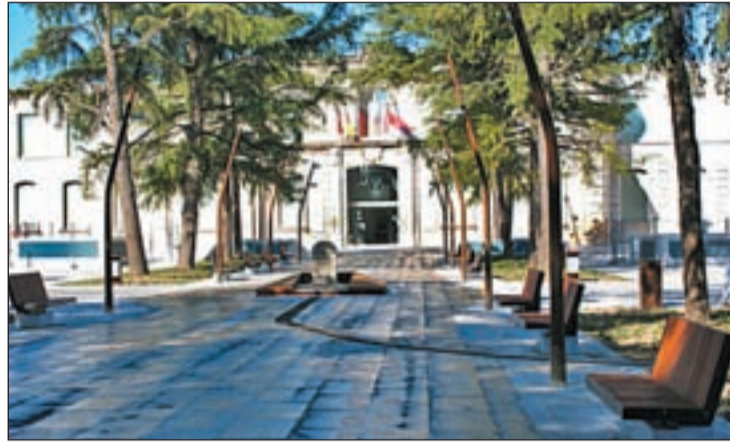
La Plaza de España, a punto de rematar sus obras

Esta -como aseguran- "falta de responsabilidad" y "dejación" ha supuesto la pérdida de unos ingresos de en torno a un millón de euros. "Ahora tendrán que explicar de dónde van a sacar los recursos económicos que no van a percibir por las diferentes administraciones por su mala gestión y por el incumplimiento de este convenio", aseguró el líder