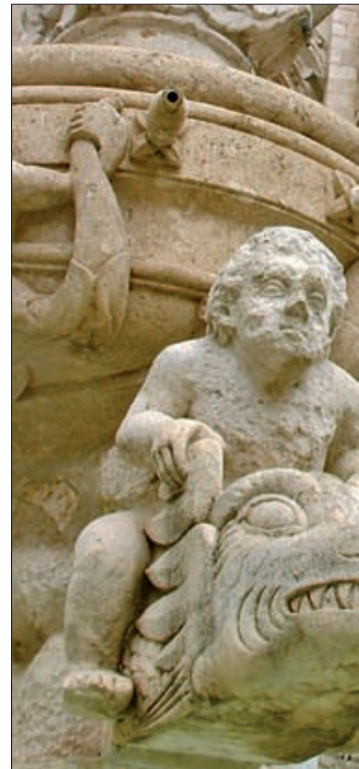
La catedral gótica de Burgos es una de las más rep...

A poco más de un kilómetro de la catedral se levanta el Real Mo-