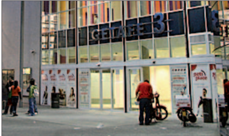
Grandes superficies, principal amenaza para los empresarios locales

ACOEG envió el pasado mes de mayo esta encuesta a todos sus asociados y recibió 180 respuestas. De ellas, las más relevantes son las de las grandes superficies ya que consideran que "hay demasiadas alrededor de Getafe". A eso suman la afluencia masiva de comercio asiático. "Dudamos del cumplimiento de las normas sanitarias, así como de las altas en la Seguridad So-