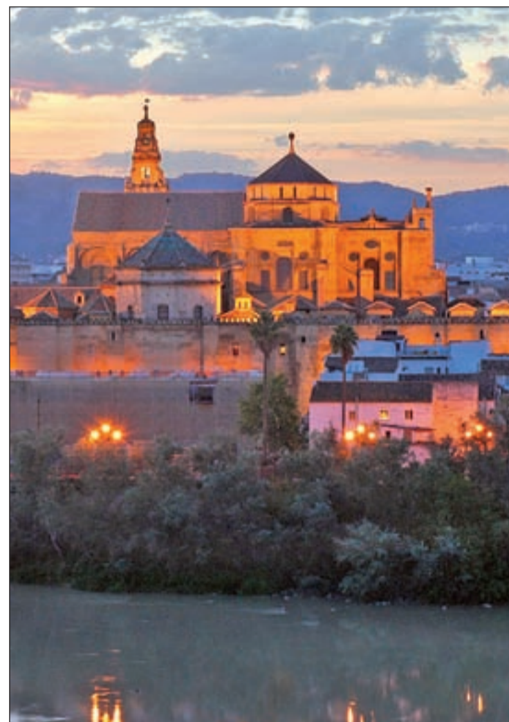
UN ENCLAVE DESEADO. Desde los primeros asentamientos, Córdoba se convirtió en un enclave deseado por sus pobladores, una ciudad que alberga un enorme patrimonio cultural y artístico.

íntimamente ligada al devenir de la ciudad cordobesa. Convertida en capital de Al-Andalus en el año 717, Córdoba escribirá una de las páginas más brillantes de su historia a partir de la proclamación del Emirato Independiente de Damasco de ma-