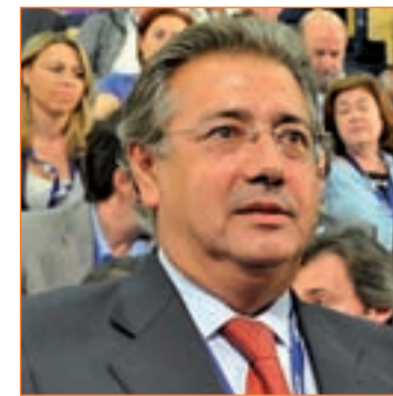
Presidente de la FEMP

nunció que el Ejecutivo esté pidiendo a los ayuntamientos la devolución de las cantidades que les prestaron en 2008 y 2009 porque recibieron esas sumas "infladas" de dinero como consecuencia de sus presupuestos "incorrectos".