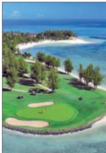
El proyecto de Beachcomber

Los amantes del Golf cuentan con un nuevo destino paradisíaco para disfrutar de su deporte preferido. Beachcomber Hotels, la principal cadena hotelera de Isla Mauricio, abrirá un nuevo campo de golf en 2013. El recorrido internacional de 18 hoyos Par 72 estará situado en la región de La Goulet, en la costa noreste de la isla, conocida por sus excelentes condiciones climáticas, a tan solo 15 minutos de otros dos hoteles del grupo, el 5* GL Royal Palm y el 5* Lujo Trou Aux Biches. Diseñado a imagen y semejanza del Paradis Golf Club -