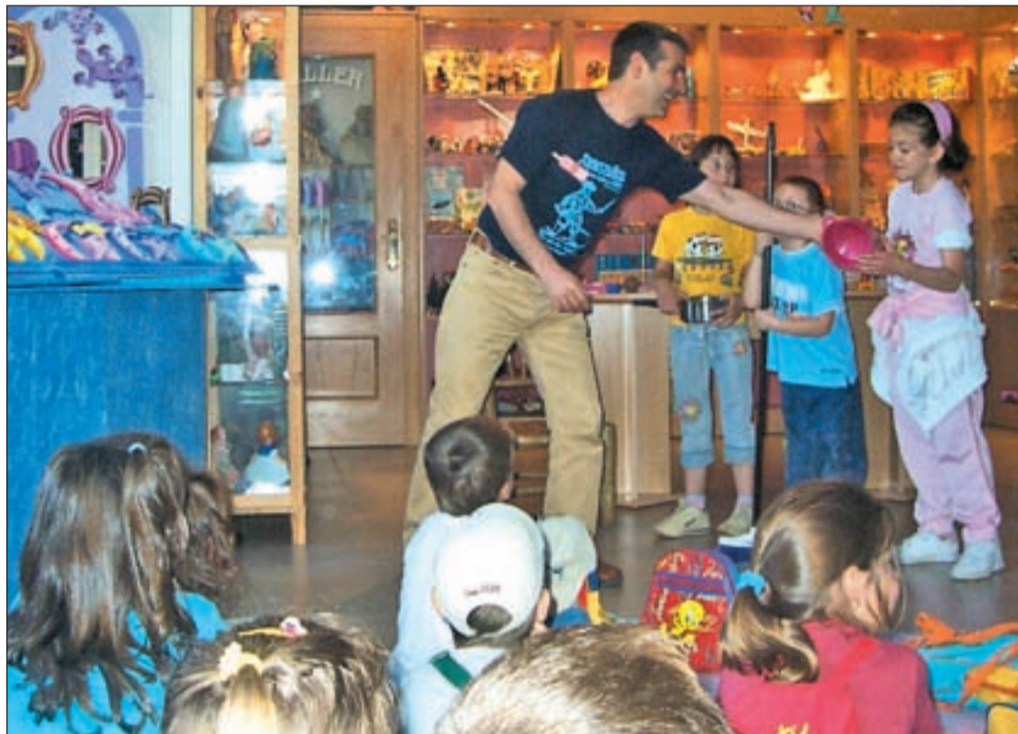
Visita al museo del Juguete de Poyales del Hoyo

El segundo, el Museo del Juguete, fue creado por dos artesanos fabricantes de juguetes de car-