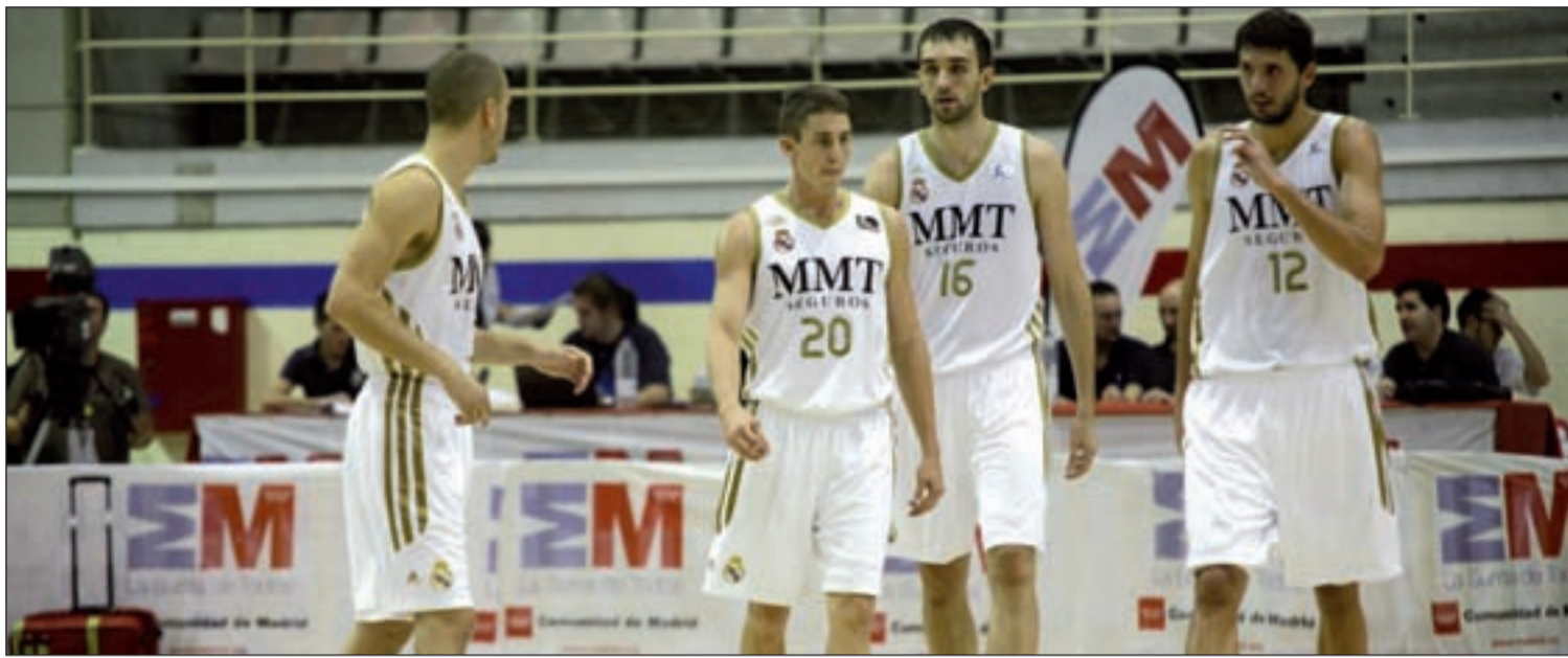
El Real Madrid se ha renovado con la intención de acabar con su sequía de títulos.

CAJA LABORAL, MADRID, BARÇA Y BILBAO SE JUEGAN EL PRIMER TÍTULO DE LA TEMPORADA