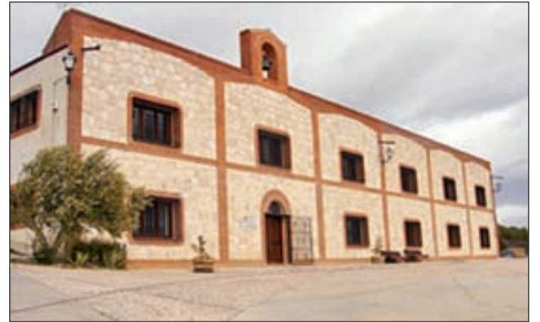
Bodega Matarromera, en el corazón de la Ribera del Duero

En la actualidad este bello conjunto gótico de finales del siglo XV está habitado por una veintena de monjes pertenecientes a la orden religiosa de la Cartuja que pasan sus días en el mausoleo.