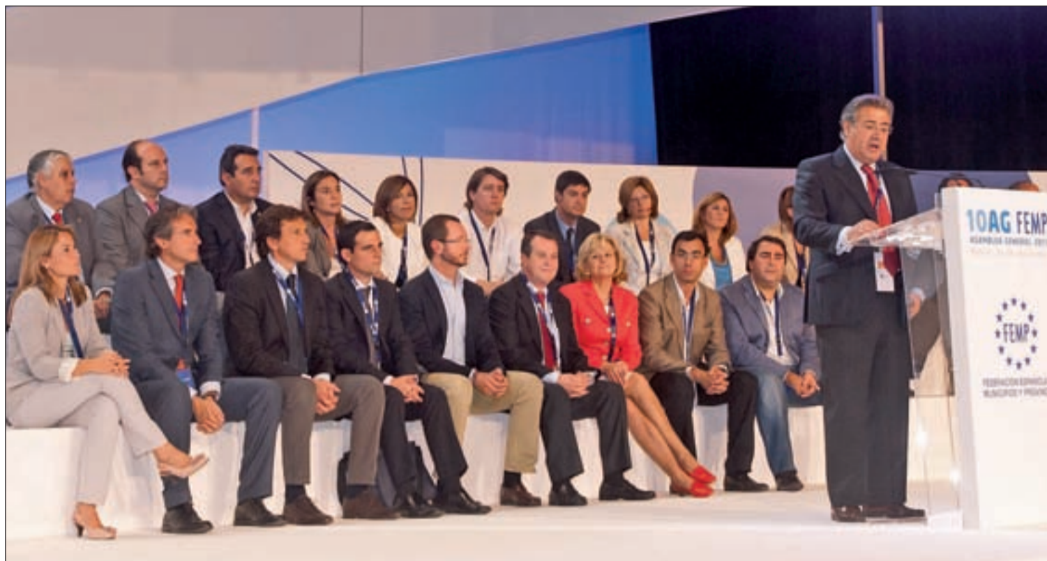
Juan Ignacio Zoido habla tras ser elegido presidente de la Federación Española de Municipios y Provincias