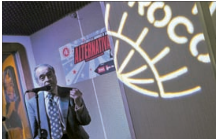
Presentación del ciclo Alternativas en Concierto

La séptima edición, que se celebrará del 13 al 30 de octubre, hace coincidir en los escenarios