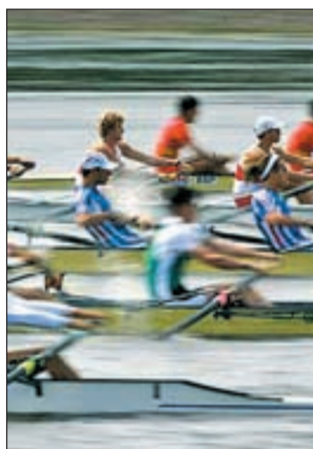
Deportista, en una prueba

En este sentido, el PSOE recordó este jueves, mediante un comunicado, que Getafe ya fue elegida como subsede olímpica en estas modalidades para la anterior candidatura de Madrid en los Juegos de 2016, lo que iba a suponer la construcción de un canal de remo cercano al río Manzanares a su paso por Perales del Río, y la rehabilitación de dicha zona dotándola de instalaciones deportivas, de ocio y re-