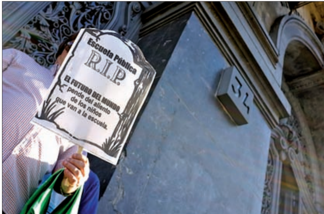
Una de las protestas de los profesores de Secundaria

"Dar 20 horas de clase no justifica esta huelga salvaje que puede dejar sin derecho a la Educación a miles de alumnos en la Comunidad de Madrid", aseguró Figar, que acusó a los organizadores de estas protestas de actuar "de manera irresponsable" y de moverse "exclusiva-