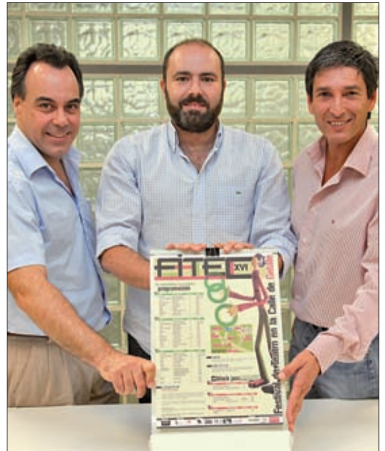
Presentación de FITEC

La programación del FITEC incluye espectáculos para todas las edades con propuestas variadas: circo, malabares, clown, danza, teatro, cine, pasacalles, títeres, magia... Además, el Festival cuenta con varios apartados como Art Fitec o Fitec Gastronomía. Art Fitec es un encuentro de