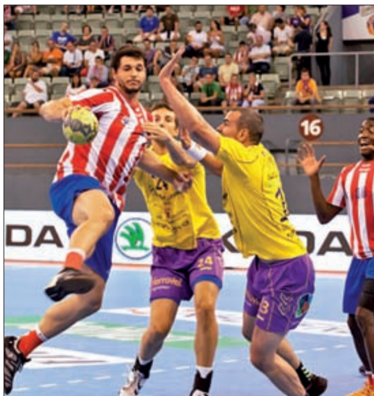
Entrerrios durante el partido ante el Cuatro Rayas Valladolid

Sin embargo, el calendario ha querido que no sea en Vistalegre, sino en la localidad danesa de Silkeborg donde arranque este domingo a las 16:50 horas la andadura del BM Atlético de Madrid en esta edición de la Liga