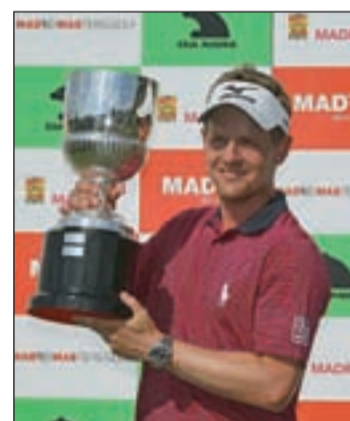
Donald con su título de 2010

pasada edición, aunque para ello deberá superar a otros golfistas como José María Olazábal, Miguel Ángel Jiménez o Gonzalo Fernández-Castaño. Más allá del plano competitivo, el Bankia Madrid Masters también sirve de reclamo para la realización de actividades en paralelo al torneo: zona de ocio y entretenimiento, campos de putt , simuladores e incluso analizadores de swing . Los precios oscilan entre 15 euros por jornada y los 10 que pagan los federados.