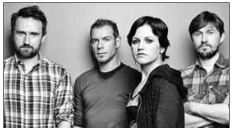
Dolores O'Riordan es la vocalista y líder de esta formación

tions', 'So Good' y 'Roses' serán los temas incluidos en el álbum. Dolores O' Riordan (vocalista y líder del grupo), Noel Hogan, Mike Hogan y Fergal Lawler se reunieron el pasado año para hacer una gira que visitó España. Su popularidad en nuestro país comenzó tras la publicación de 'No need to argue' (1994).