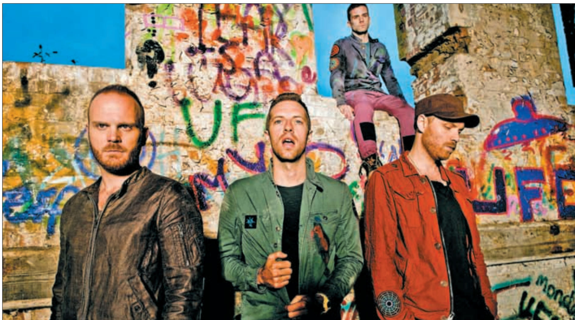
De izquierda a derecha, Will Champion, Chris Martin y Jonny Buckland. Arriba, Guy Berryman. Los cuatro integran uno de los grupos más internacionales del siglo XXI.