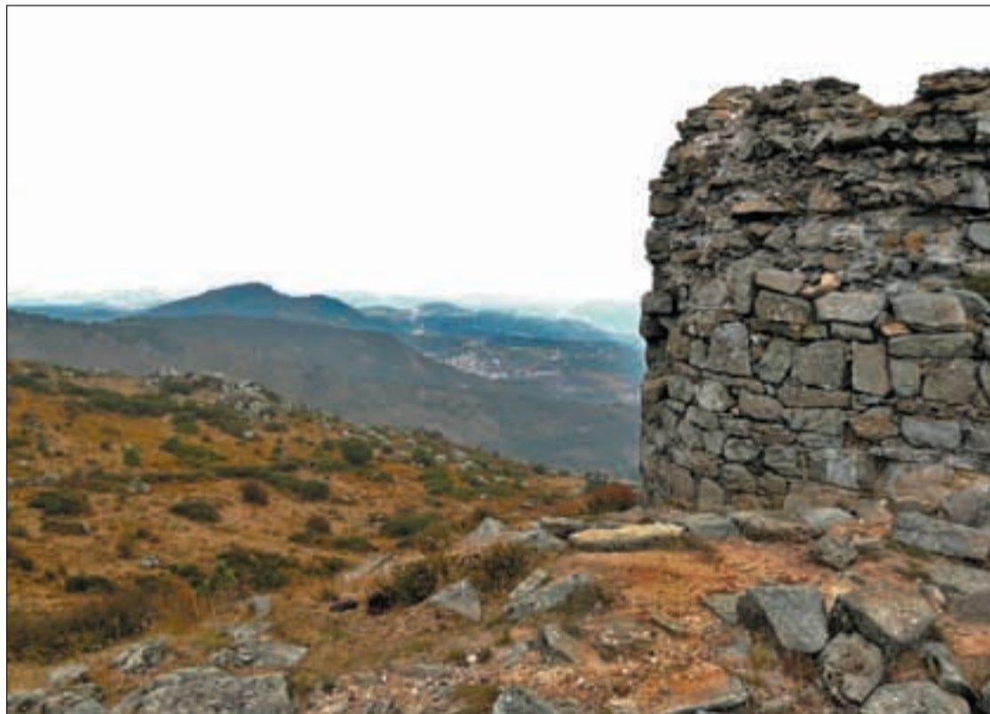
Panorámica de la sierra desde el monte de San Vicente

Uno de los mayores atractivos de estos montes son sus bosques de castaño común ( Castanea sativa ) que en otoño se visten de los colores propios de esta estación; anunciando la pronta llegada del invierno, el suelo se cubre de un manto de bolas pinchudas que protegen el preciado fruto. De hecho la castaña es una de los recursos económicos más importantes de la mancomunidad de pueblos a pie de la sierra.