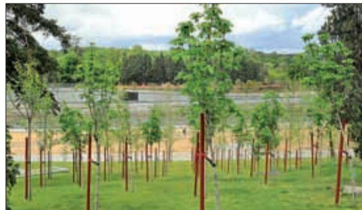
Una zona verde de la capital

árboles en sus calles. Cerca de 300.000 ejemplares forman parte del arbolado de alineación del viario público de la ciudad. Garantizar la conservación de este patrimonio, aplicando para ello criterios de sostenibilidad con el fin de optimizar el consumo de recursos, es uno de los objetivos principales en los que trabaja el Ayuntamiento que se ocupa de la conservación durante todo el año, además del mantenimiento de infraestructuras de riego, la limpieza, etc.