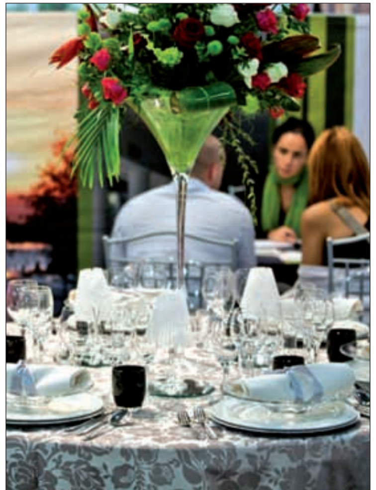
Un menú apto para el bolsillo, el formado por platos tradicionales

El banquete representa el principal gasto de la boda y el precio por invitado puede oscilar entre los 48 y los 100 euros, a lo que habría que sumar el coste de la música y la barra libre, que tiene un coste que oscila entre los 950 y los 1.800 euros. Para reducir costos en la factura, muchos expertos recomiendan además sustituir al clásico conjunto de