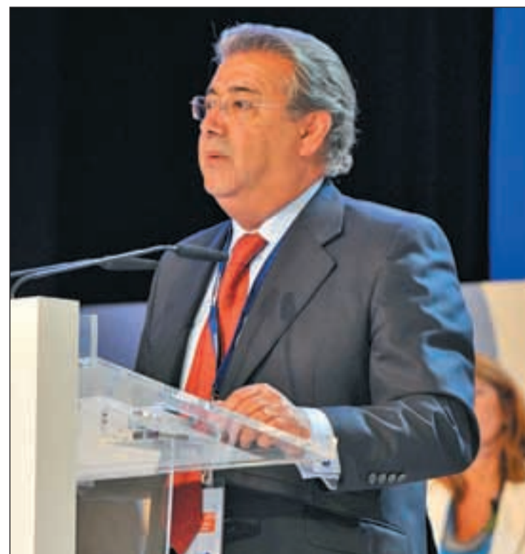
Juan Ignacio Zoido, presidente de la FEMP

Así, el Ministerio de Economía dio de plazo hasta el 30 de septiembre a las entidades locales para enviar esta información del año 2010, aunque, transcurrido ese periodo, 7.092 municipios (el 87,4 por ciento del total) enviaron la información preceptiva,