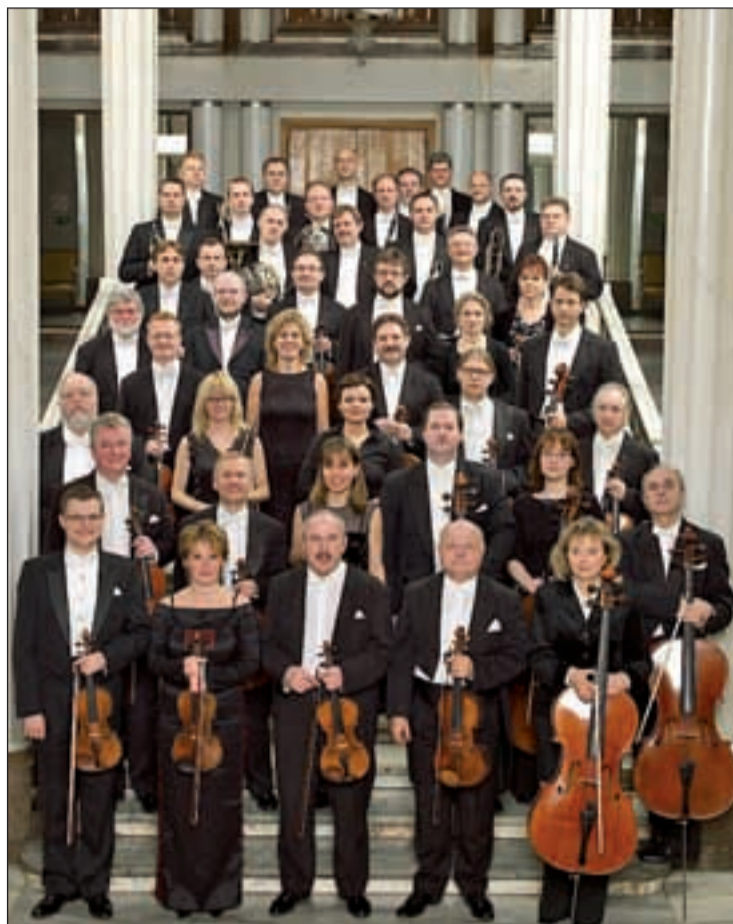
La Orquesta Sinfonía Varsovia actuará el día 28 de noviembre

Por su parte, el Festival de Música Contemporánea 2011 está organizado por la Asociación Madrileña de Compositores (AMCC) y su repertorio se basa en la obra de autores nacidos o residentes en Madrid. Con dos conciertos ya celebrados, dará paso a un tercero el 30 de octubre, a cargo del Cuarteto Areteia, de cuerda, viento y percusión. En cuanto al homenaje a Szymanowski, cuyas obras suenan en las salas europeas para conmemo-