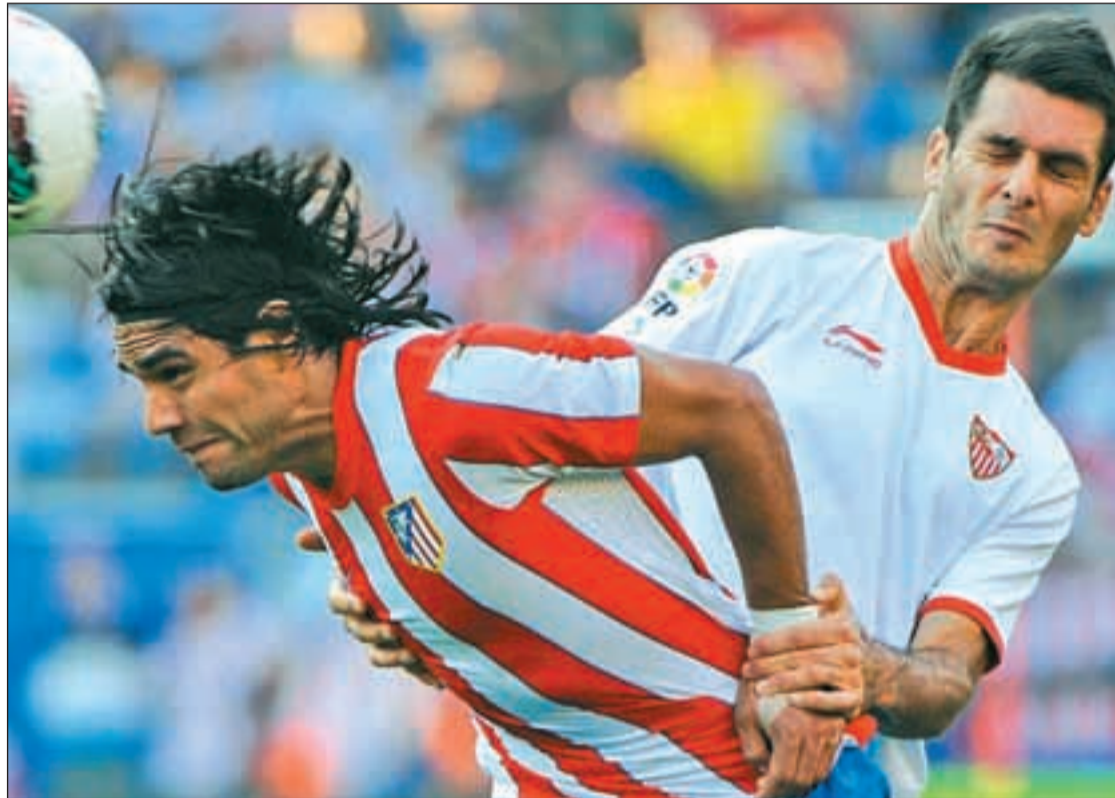
Falcao, uno de los fichajes estrella del Atlético de Madrid, durante un encuentro del presente curso

La lista de equipos que han dejado desnuda la parte delantera de su zamarra incluye nombres de equipos cuyo destino parece estar ligado a los puestos bajos de la clasificación, como Osasuna o Rayo Vallecano; aunque tampoco escapan a esta tendencia otros clubes con mayor presupuesto como Atlético de Madrid, Sevilla, Valencia o Villarreal. Especialmente llamativo es el caso de estos dos últimos. Los dos equipos levantinos pasean su nombre en la presente edición de la Liga de