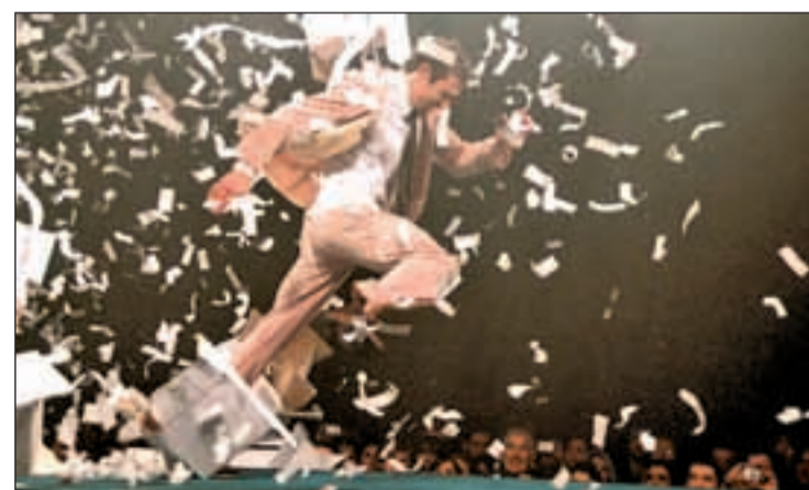
Habrará funciones hasta el próximo día 23

En 'FuerzaBruta', una de las cosas más importantes es el "ritmo" y uno de los retos para los actores y bailarines es "ir más rápido que la mente de los espectadores, para que lo instintivo salga primero". "Cuando veo que alguien discute acerca de si se