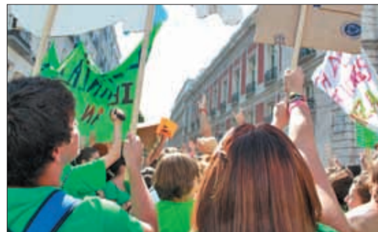
El estado de construcción de los colegios preocupa a los progenitores

En el mismo acto reivindicativo estarán presentes padres y alumnos de los colegios Anto-