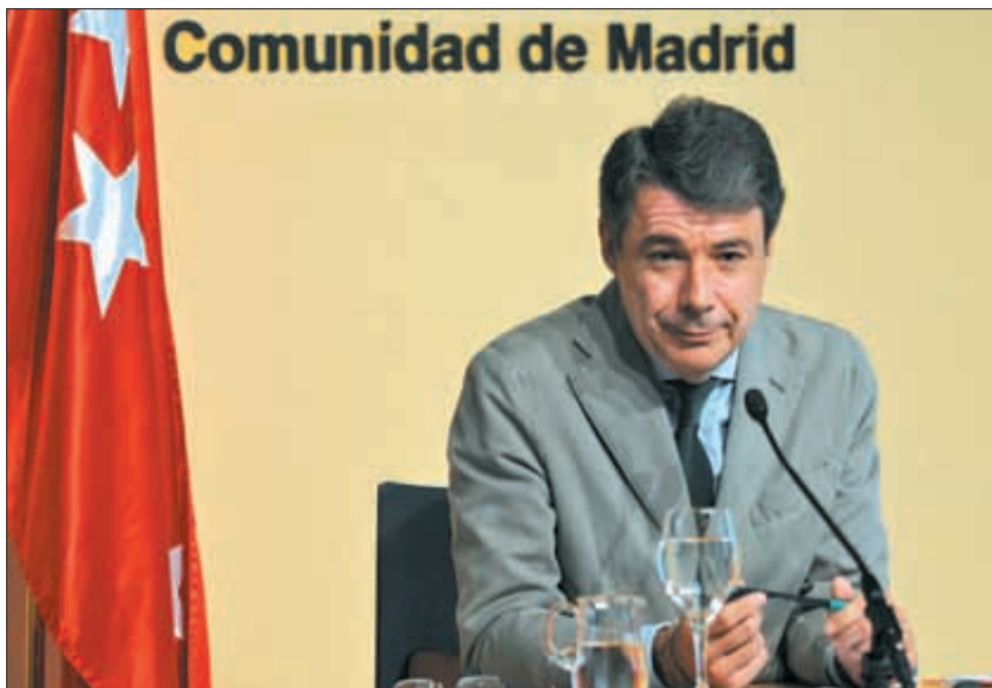
Ignacio González, vicepresidente de la Comunidad, en rueda de prensa

González explicó, además, que, a través de la futura norma que aprobará el Consejo de Gobierno, "se podrá abrir de forma inmediata un nuevo negocio al