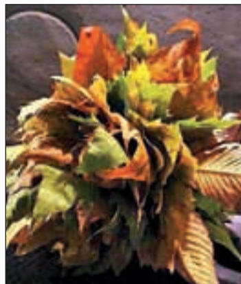
Un ramo de temporada

del año y ahora toca el otoño y sus flores. Los girasoles, las rosas y las margaritas, son las claves de la elegancia otoñal, aunque no pueden faltar las hojas rojizas o marrones de los árboles para dar el toque final. En los centros de mesa los naranjas, calabazas, amarillos y verdes oscuros ofrecen el éxito seguro.