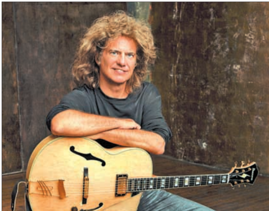
El afamado guitarrista de jazz Pat Metheny actuará el 21 de noviembre en el Circo Price

El Teatro Circo Price acogerá las actuaciones de Anoushka Shankar 'Traveler' el día 15 de noviembre. Según Javier Estrella, este concierto de música llegada desde India es uno de los ejemplos que se unen a la mezcla del jazz y sonidos de otros lugares del planeta. Rodrigo y Gabriela,