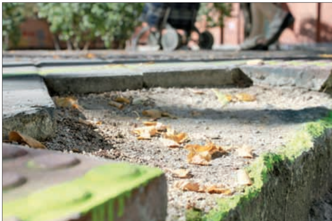
Una de las calles del barrio de Meseta de Orcasitas