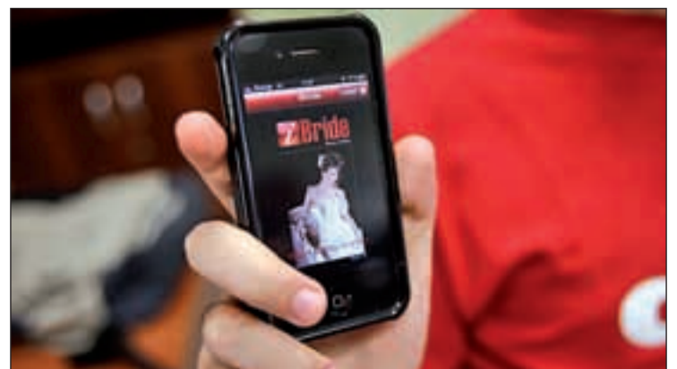
Imagen de una de las aplicaciones móviles para organizar una boda

aquello que buscan. Pero no es el único. BlackBerry planificador de boda, Wedding Plannin, iWedding iPhone Wedding Planner o iBride Wedding Planner ayudan a planificar al detalle toda boda. También la tecnología cuida tu bolsillo gracias a la aplicación Money Saver. Aliados 2.0 siempre disponibles.