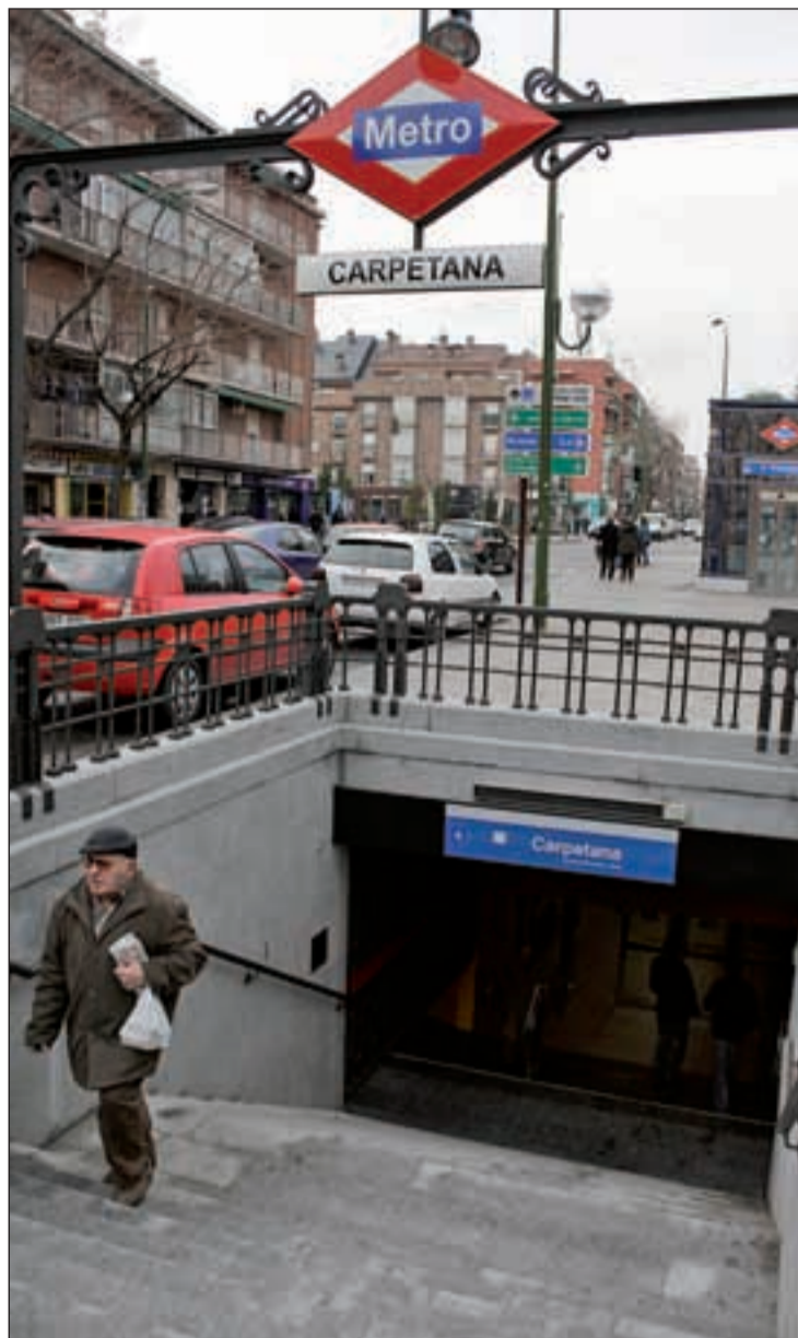
Una boca de Metro en Madrid

Mientras los portavoces de los Grupos Parlamentarios de PSOE y UPyD en la Asamblea de Ma-