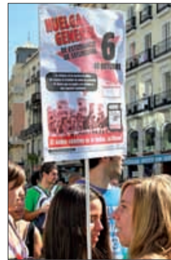
Protestas por la educación

“Después del día 20 de noviembre seguiremos convocan-