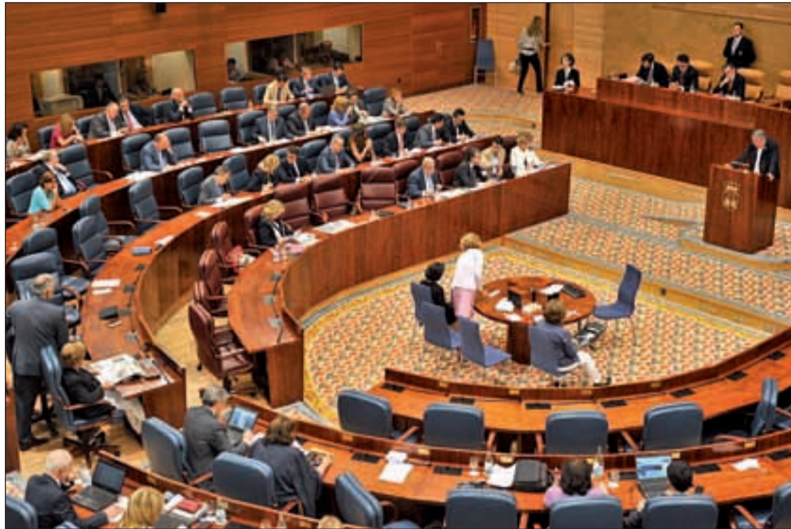
Una imagen de la Asamblea de Madrid