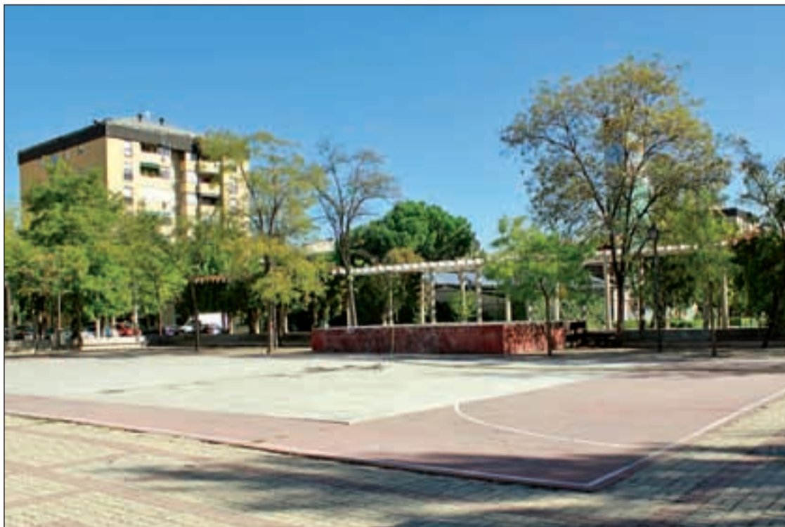
Una calle de Meseta de Orcasitas

Los vecinos ya han adelantado 1.500 euros de sus bolsillos para ejecutar la primera fase de una remodelación que debe subvencionar la Comunidad Pág. 5