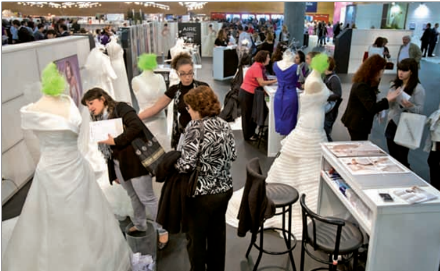
Miles de visitantes recorren cada año el Salón 'Las Mil y Una Bodas' de IFEMA