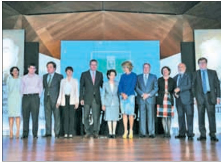
Manzano, Gallardón y Aguirre, en el homenaje a Rodríguez Sahagún