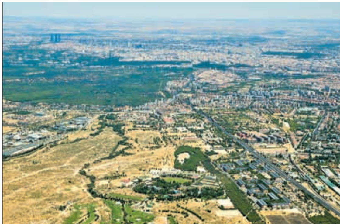
Una vista aérea de los terrenos situados en el distrito de Latina