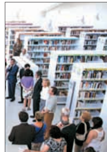
La biblioteca Luis Rosales

Además de estas cuatro bibliotecas que permanecen abiertas toda la semana y los festivos de todo el año, excepto el 25 de diciembre, el 1 de enero y el 1 de mayo, otras ocho prestan servicio de lunes a sábado, mientras que las cuatro restantes lo hacen de lunes a viernes. La directora general de Archivos,