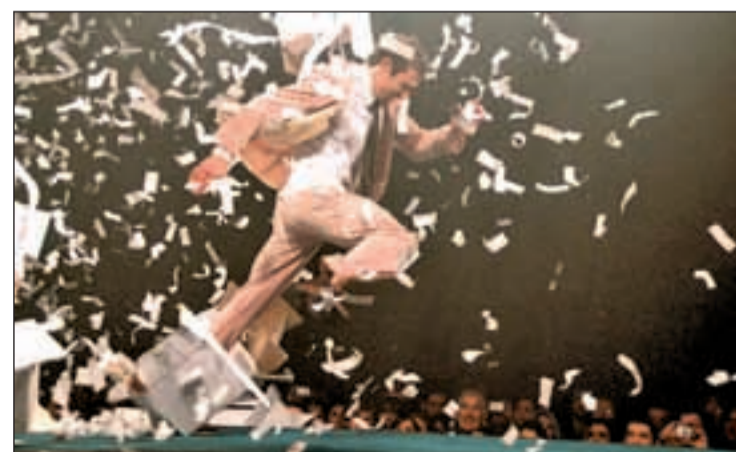
Habrará funciones hasta el próximo día 23

En 'FuerzaBruta', una de las cosas más importantes es el "ritmo" y uno de los retos para los actores y bailarines es "ir más rápido que la mente de los espectadores, para que lo instintivo salga primero". "Cuando veo que alguien discute acerca de si se