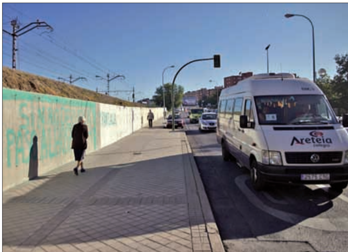
El lugar donde los vecinos quieren que se construya el túnel