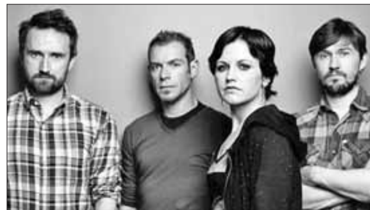
Dolores O'Riordan es la vocalista y líder de esta formación

tions', 'So Good' y 'Roses' serán los temas incluidos en el álbum. Dolores O' Riordan (vocalista y líder del grupo), Noel Hogan, Mike Hogan y Fergal Lawler se reunieron el pasado año para hacer una gira que visitó España. Su popularidad en nuestro país comenzó tras la publicación de 'No need to argue' (1994).