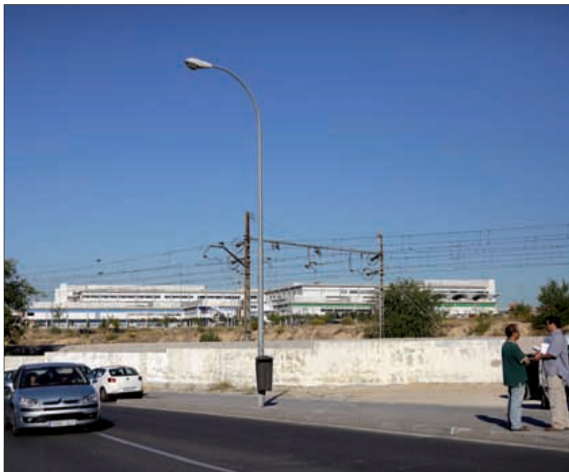
Los vecinos quieren un paso subterráneo por debajo de las vías del tren

Tardan alrededor de 40 minutos en recorrer menos de un kilómetro. Planean protestas para finales de octubre y principio de noviembre Pág. 5