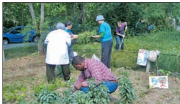
El huerto urbano comunitario del barrio del Lucero

Actualmente, ambas administraciones están trabajando en el desmantelamiento de un ámbito de infravivienda, el Ventorro, en Villaverde y un barrio chabolista, el de Puerta de Hierro. En el primero de ellos, se han iniciado los trámites, mientras que el último ya tiene fecha para su desaparición. El Ayuntamiento, encargado de actuación, tiene previsto concluir el desmantelamiento a finales de 2011.