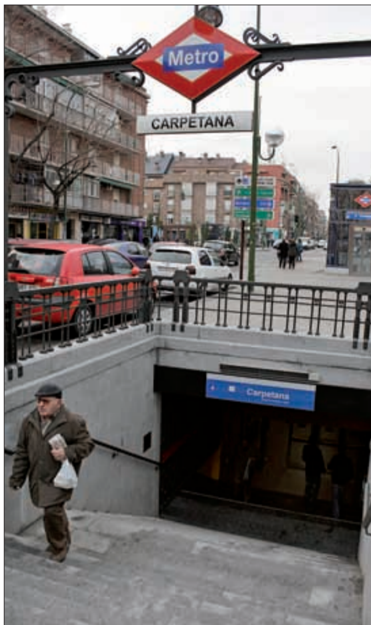
Una boca de Metro en Madrid

Mientras los portavoces de los Grupos Parlamentarios de PSOE y UPyD en la Asamblea de Ma-