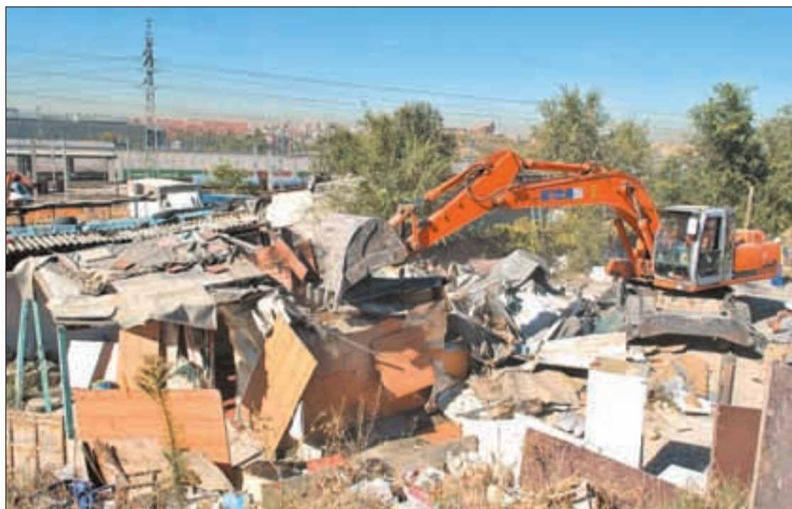
Las excavadoras derribaron 13 infraviviendas el pasado 11 de octubre

Valdearados, 15- un miércoles cada 15 días en horario de 18:00 a 20:00, previa cita mediante llamada telefónica, o rellenando el formulario en la página www.paudevallecas.org . En todos los casos es necesario indicar nombre, apellidos, teléfono de contacto y una breve indicación del asunto a tratar, como por ejemplo, divorcio, familia o hipotecas.