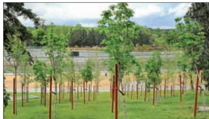
Una zona verde de la capital

árboles en sus calles. Cerca de 300.000 ejemplares forman parte del arbolado de alineación del viario público de la ciudad. Garantizar la conservación de este patrimonio, aplicando para ello criterios de sostenibilidad con el fin de optimizar el consumo de recursos, es uno de los objetivos principales en los que trabaja el Ayuntamiento que se ocupa de la conservación durante todo el año, además del mantenimiento de infraestructuras de riego, la limpieza, etc.