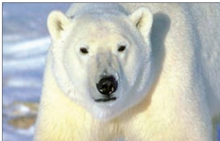
Un oso polar

Llamado 'Episodios de nado de larga distancia en hembras adultas de oso polar', el estudio