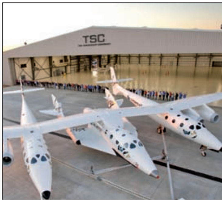
Avión de pruebas de Virgin Galactic

Está previsto que la terminal, bautizada como 'Virgin Galactic Gateway to Space', albergue las naves de la compañía (dos naves nodriza WK2 y hasta cinco naves espaciales SS2), el centro de control y un área de entrenamiento para los futuros turistas espaciales. "Hoy es un día histórico para Virgin Galactic", asegu-