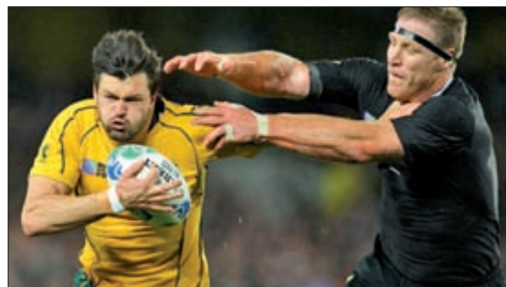
Los 'All Blacks' buscan su segundo título en casa

previas (frente a la propia Nueva Zelanda y ante Australia en 1999), intentará aprovechar la ausencia de presión para sorprender a un equipo que parece tenerlo todo a favor. Auckland será testigo de la reedición de la final de 1987. Curiosamente aquel encuentro se disputó en la misma ciudad.