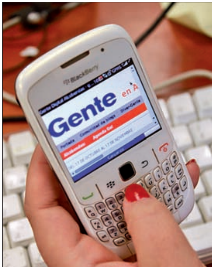
Una usuaria sostiene una BlackBerry

Dado el volumen de aplicaciones que se podrán a dispo-