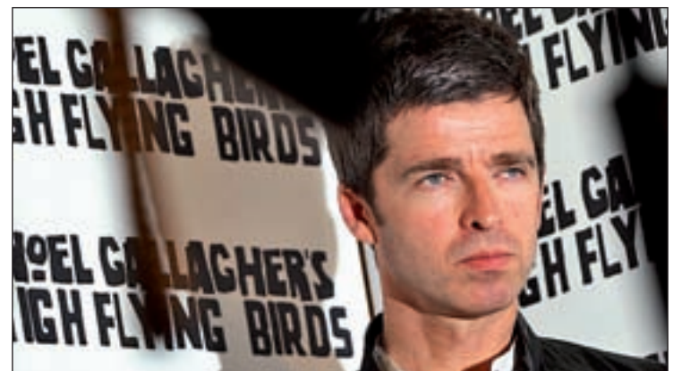
El que fuera componente de Oasis vendrá a España en noviembre