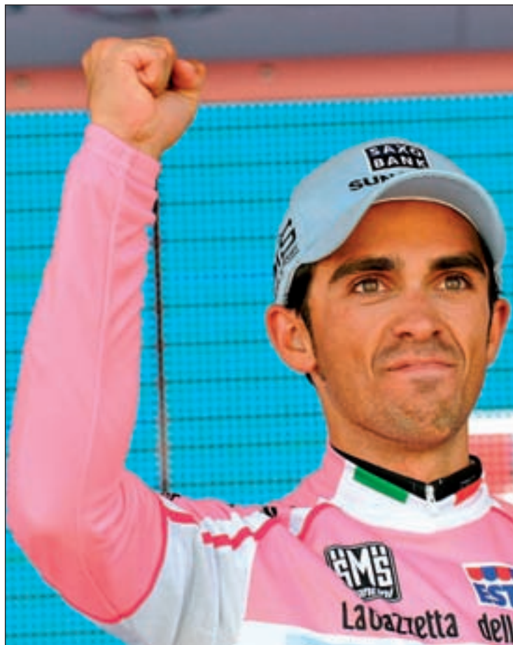
Los últimos precedentes juegan en favor del ciclista español

Este precedente podría jugar en favor de Contador, ya que este caso guarda numerosas similitudes con el suyo. Por si esto fuera poco, en los últimos días se ha dado a conocer otro caso que podría suponer un nuevo giro en el del ciclista de Pinto. Durante la celebración de la Copa Mundial de la FIFA en la categoría sub-17, hasta 109 jugadores dieron positivo en los controles antidopaje por clenbuterol. Ante la generalización del número de positivos, la FIFA ha decidido no