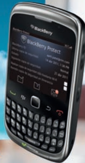
BlackBerry® Curve™ 3G 9300

900 10 10 10 Tiendas Movistar www.movistar.es