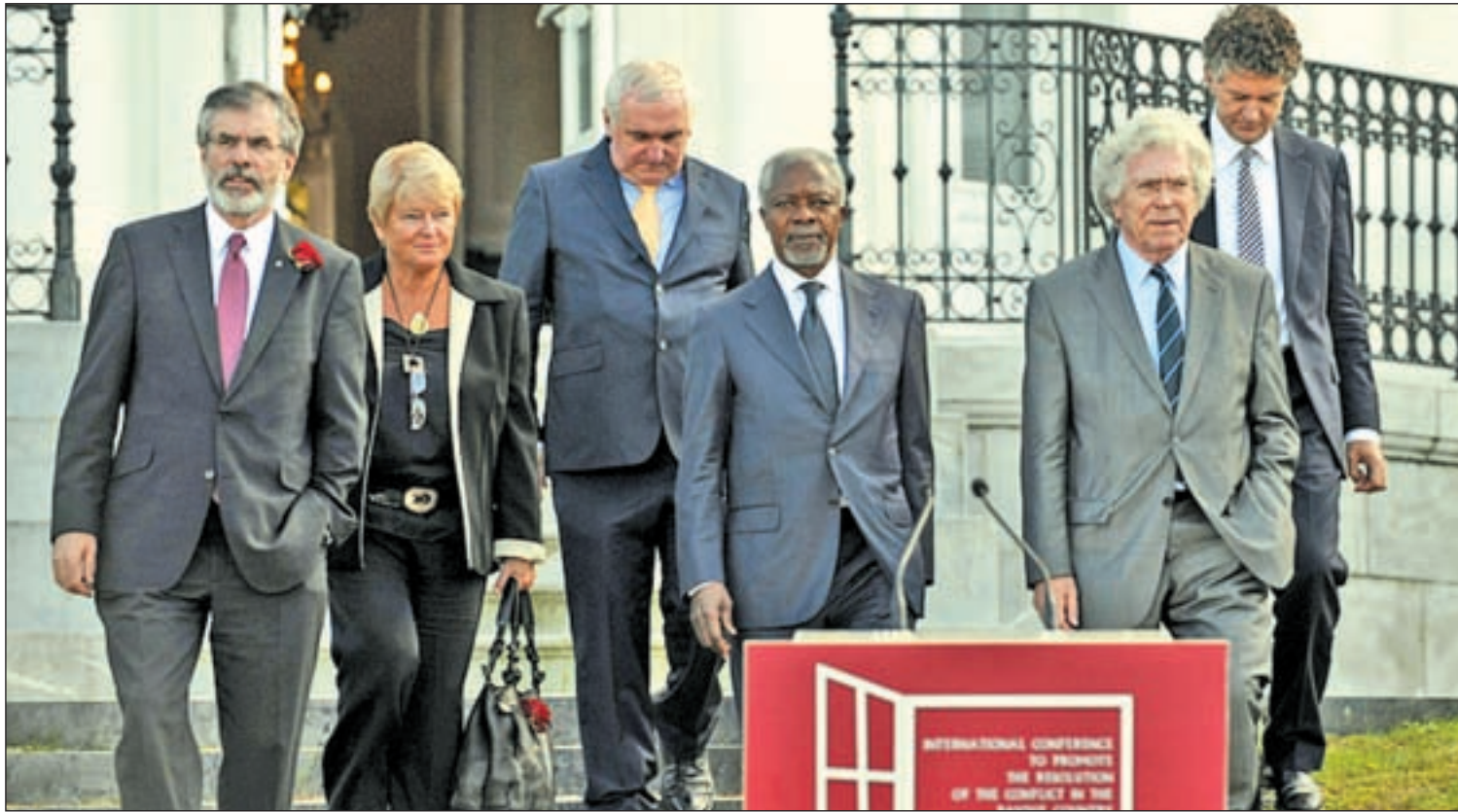
Líderes internacionales participan en la Conferencia de Paz en San Sebastián