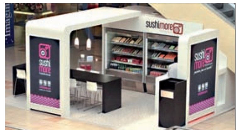
Espacio Sushimore en un centro comercial

El sushi es un producto japonés sano, nutritivo, sabroso y bajo en grasas y calorías que cada vez cuenta con más adeptos.