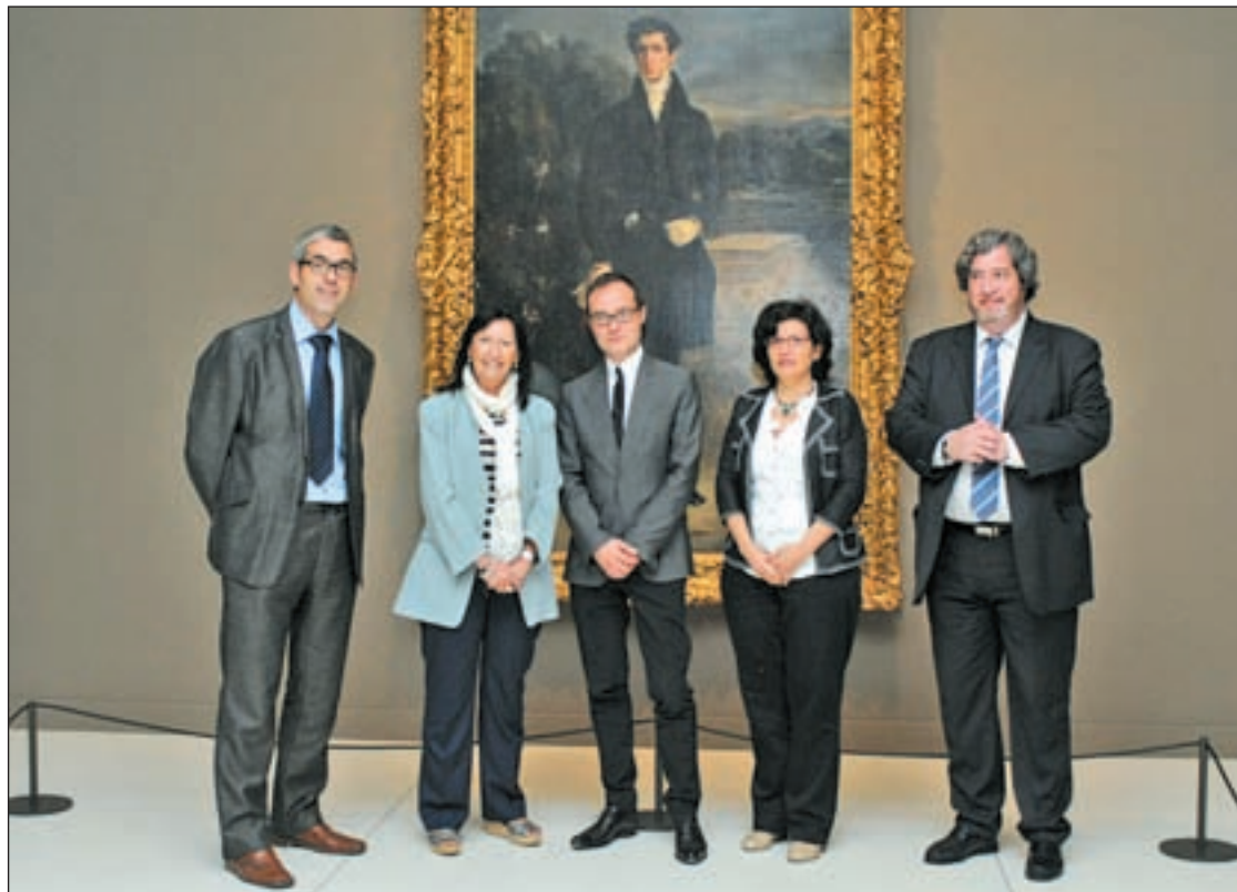
Presentación de la exposición en CaixaForum

Se trata de un recorrido por las diferentes etapas de la producción de Delacroix, desde las