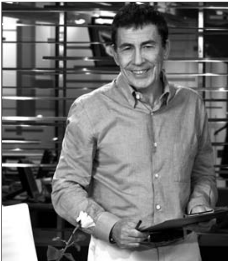
Es habitual ver al literato en los platós de televisión

es el color de la felicidad", declaró. "Ya que el tonto ese de Hessel ha publicado ¡Indignaos!, un insulto a la inteligencia donde no dice nada, y además el tío se está forrando, yo estoy a punto de escribir dos libros iguales de 28 páginas que se llamarán: ¡Resignados; y ¡Divertidos!"; señaló el escritor. En las páginas de este libro confiesa: "Nací libertino y libertino moriré". Dragó no se cansa de afirmar lo "contentísimo" que se siente cuando sale a la calle y señala que se le van los ojos detrás de las chicas. "Cruzo la carretera aunque la carretera esté llena de coches y el semáforo esté en rojo", indicó el escritor.