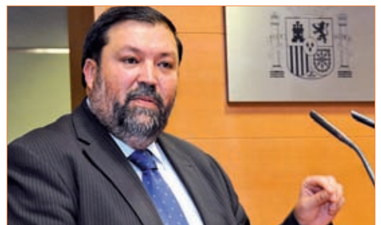
Francisco Caamaño, ministro de Justicia

de la confusión y sólo se pronunciará "si se produce un comunicado de ETA diciendo que abandona de manera definitiva e incondicional la actividad criminal". Además, insistió en que "desde la ley, desde el Estado de Derecho y desde la fuerza de la democracia se puede derrotar también a una organización terrorista".