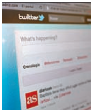
La red social Twitter

en iOS 5. El CEO de Twitter, Dick Costolo, confirmó que a principios de 2011, la red registró 100 millones de 'tuits' al día. Seis meses después, esta cifra se duplicó hasta llegar a los 200 millones. Pero durante los últimos cuatro meses, la red ha conseguido pasar a los 250 millones.