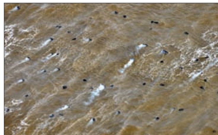
Vista de la mancha provocada por la erupción cerca de La Restinga

A pesar de desconocer todavía como evolucionará la situación de la erupción, se reanudó el "acceso controlado" de los vecinos a La Restinga y se informó a los vecinos de que se estudiará ampliar la ampliación del tiempo de permanencia.