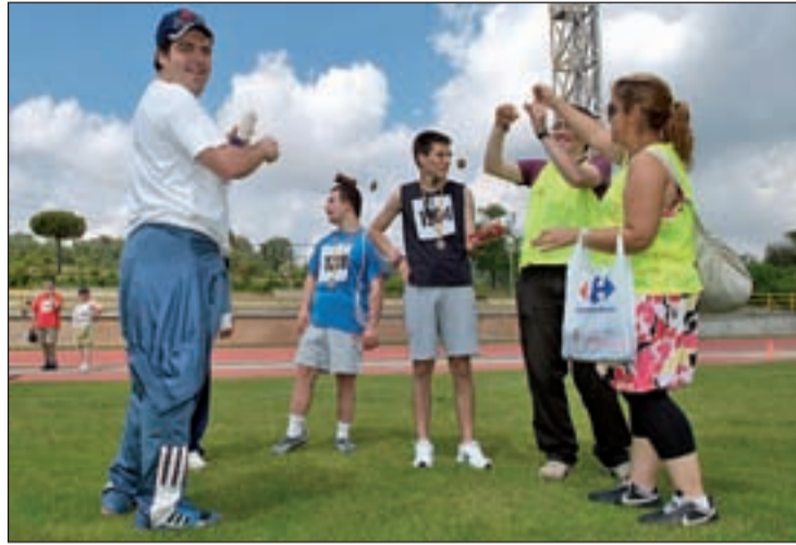
Estas iniciativas tienen una buena acogida dentro de este colectivo

Las actividades pueden durar una mañana, una tarde, un día completo o todo el fin de semana, según sus gustos y grado de autonomía. Asimismo, los participantes se dividen en diferentes grupos en función de la edad y grado de independencia. Cada uno de ellos realiza sus propias