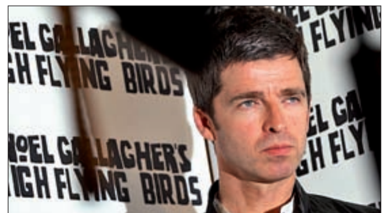
El que fuera componente de Oasis vendrá a España en noviembre

Mike Rowe, Jeremy Stacey o Lenny Castro para la grabación de sus canciones. Noel mantiene la esencia instrumental en guitarras y pianos de su etapa anterior, pero realiza positivos experimentos, tanto estilísticos como vocales. Sólo visitará Madrid en su gira europea y las entradas están agotadas para el 26-N.