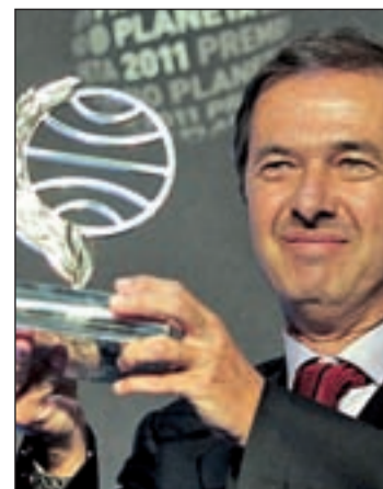
figura de Pedro I, el primer emperador de Brasil, un hombre "que estuvo siempre del lado de la historia, del lado de la libertad, en una época de monarquías absolutas", señaló al lado de los Príncipes de Asturias y de Girona. La novela se centra, sobre todo, en el ambiente "estrafalario" de la corte portuguesa, que trasladó la capital del imperio de Lisboa a Río de Janeiro, convirtiendo la ciudad brasileña en un escenario propicio a todo tipo de aventuras, con tratantes

de esclavos, militares codiciosos y músicos exquisitos, entre otros personajes.