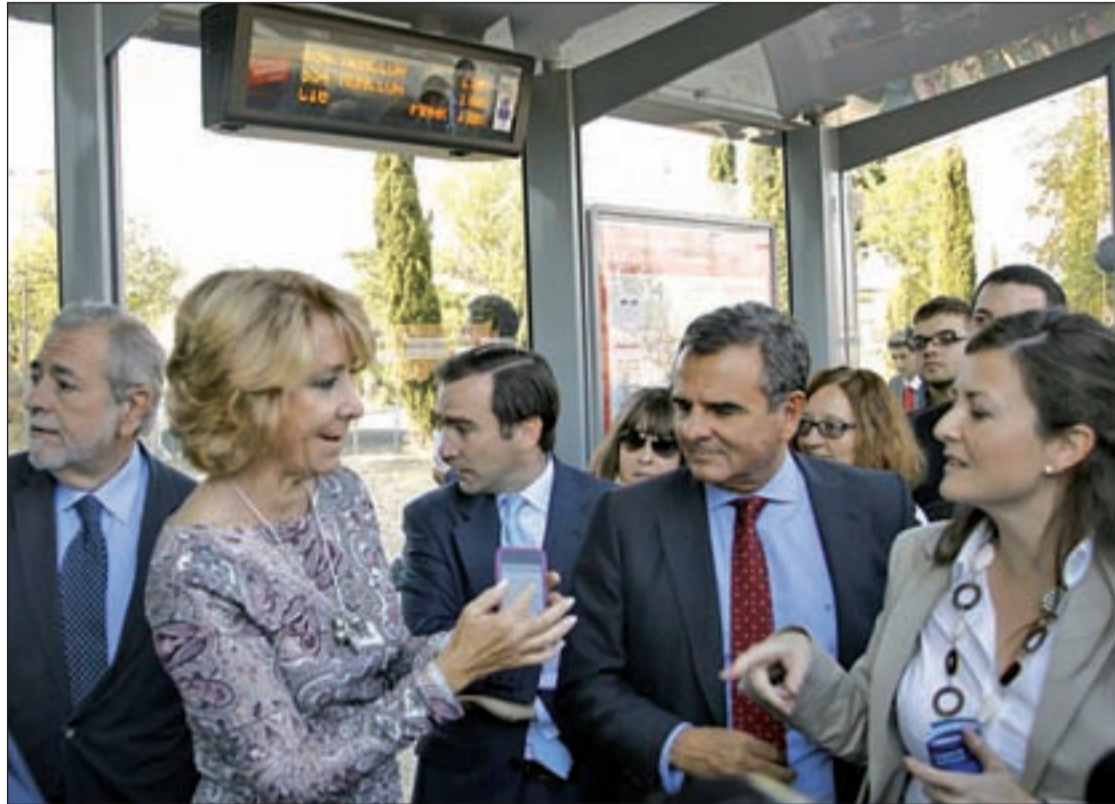
La Presidenta, Esperanza Aguirre, y el alcalde de Majadahonda, Narciso De Foxá, en un 'autobús del futuro'

De esta manera, el estudio europeo, que cuesta 26 millones de euros de los que la Unión Eu-