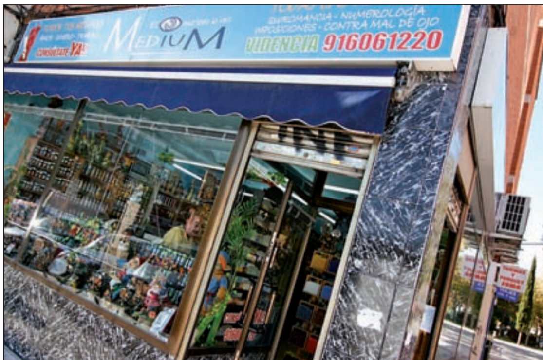
Las tiendas de barrio podrán elegir cuándo quieren abrir

La modificación de las ordenanzas contempla también la adecuación de las prestaciones al IPC, con lo que también se incrementa su cuantía.