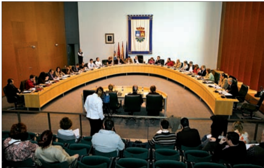
Sesión plenaria en el Ayuntamiento de Fuenlabrada