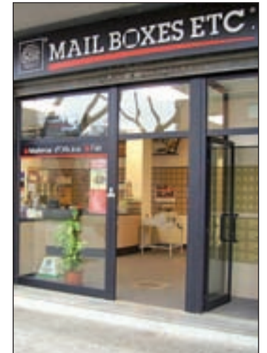
Establecimiento MBE a pie de calle

De este modo, alcanza ya los 175 establecimientos y continúa desarrollando su ambicioso plan de expansión que le permite abrir franquicias en poblaciones donde aún no tienen presencia, así como ampliarla en las provincias donde ya existe. Sus previsiones apuntan a los 200 centros abiertos a corto plazo y hay