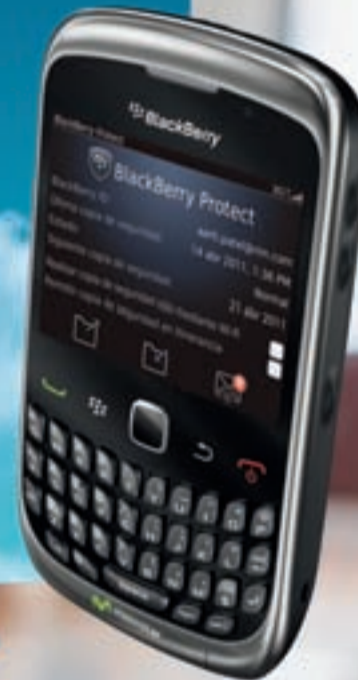
BlackBerry® Curve™ 3G 9300

900 10 10 10 Tiendas Movistar www.movistar.es