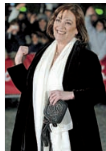
La actriz Carmen Maura

Josep María Pou ha protagonizado una cincuentena de montajes teatrales a lo largo de su carrera y en 2006 fue galardonado con el Premio Nacional de Teatro. Rafaela Carrasco comenzó a pisar los escenarios en 1991 con Mario Maya para luego ingresar en la Compañía Andaluza