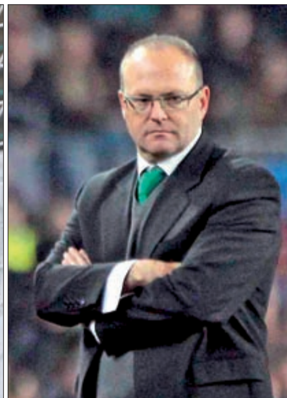
Manuel Pellegrini y Pepe Mel se vuelven a cruzar en los caminos del Real Madrid y el Rayo Vallecano