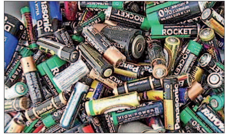
Pilas para reciclar

"Está claro, el tablero se les ha quedado pequeño y tienen menos sitio para mover sus fichas, pero esta situación debe acabar de inmediato", ha puntualizado el portavoz popular.