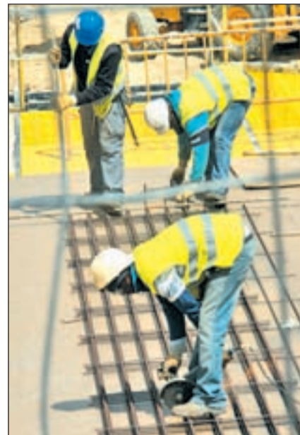
Trabajadores de la construcción

El consejero puso encima de la mesa algunas cifras como los