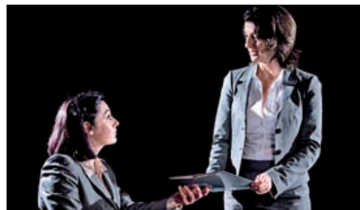
Escena de la obra “ContraAcciones”

Los responsables de “ContraAcciones” la catalogan como una obra que “atrapa desde el primer minuto”, con un lenguaje conciso, “cortado a cuchillo”.