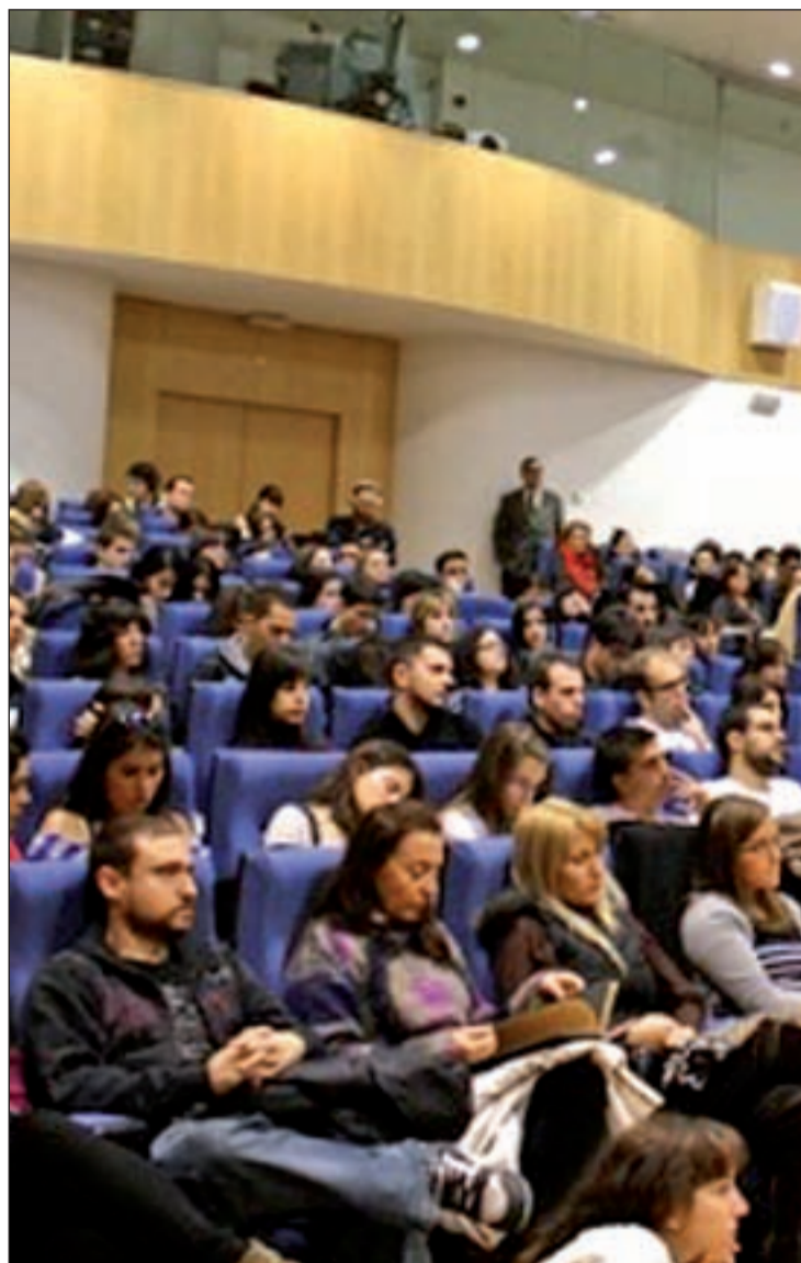
Estudiantes en el Salón de Actos del Campus de Fuenlabrada

El decano de la Facultad de Ciencias de la Comunicación,