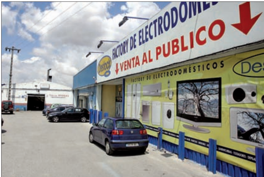
Las compañías estatales consiguen externalizar su presencia más allá de las fronteras europeas