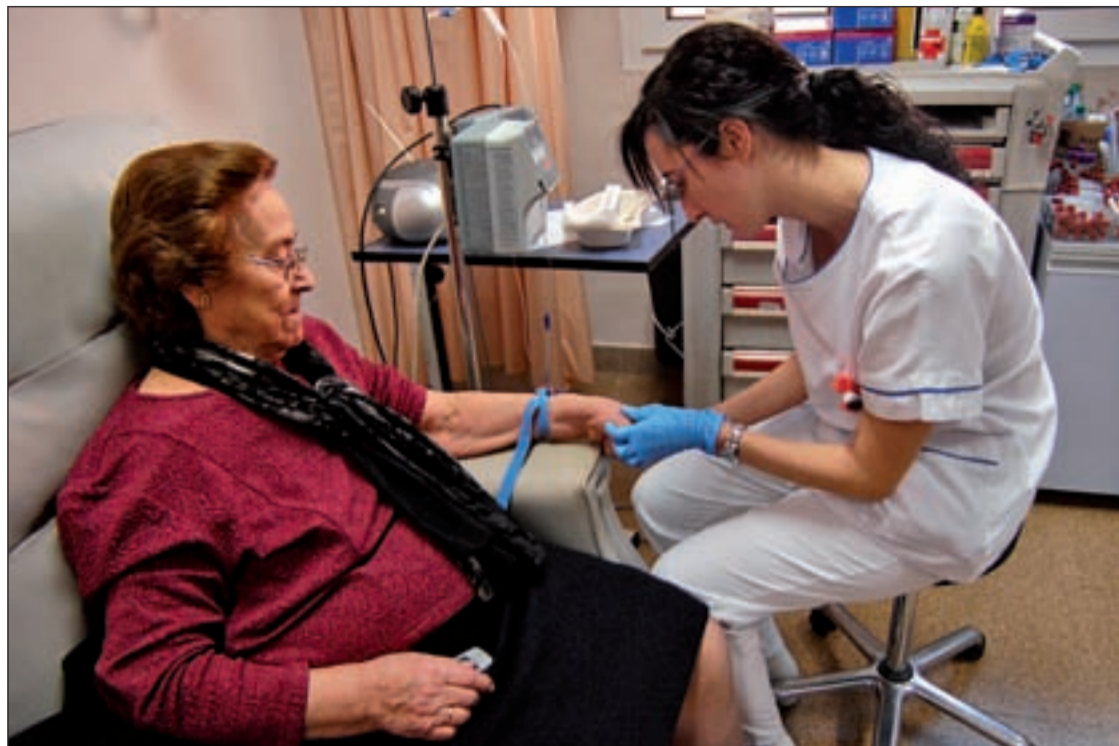
Una profesional sanitaria atiende a una persona mayor