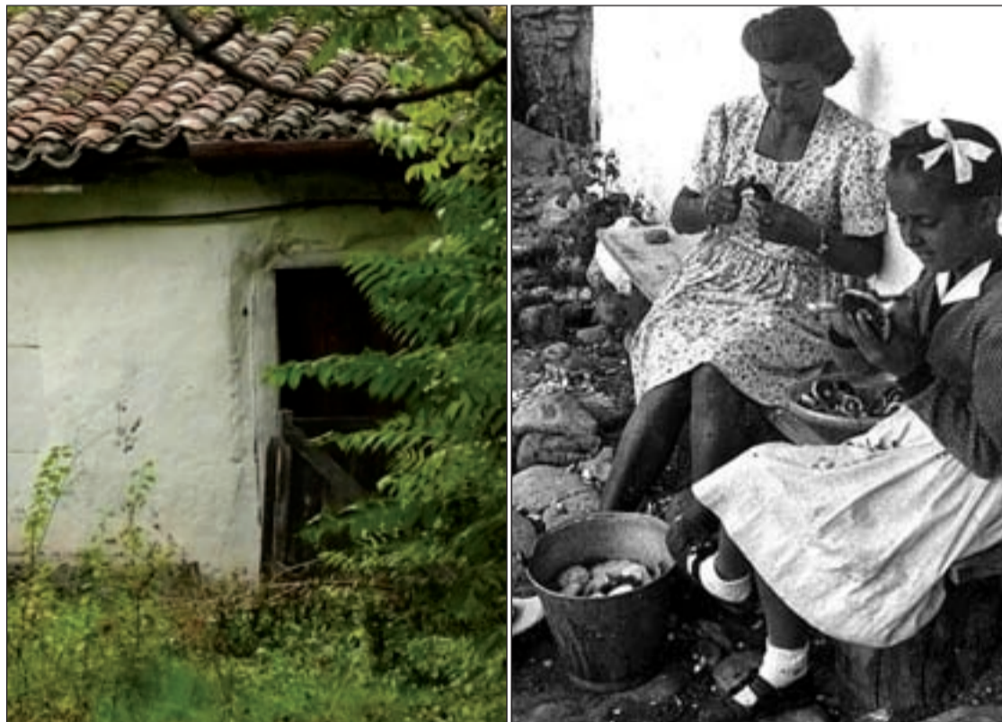
Vieja casa en el Valle de Lozoya. Al lado, dos mujeres limpian setas en la misma casa

El valle de Lozoya es, bajo mi punto de vista, la auténtica perla de la sierra de Guadarrama, pues esta escoltado por las más altas cumbres del Sistema Central, el Peñalara de 2429 metros de altitud, los Claveles, Las Cabezas de Hierro, la Najarra, etc. Fuimos en otoño y nos costó encontrar aquella casita, pensábamos que podía haber sido suplantada por alguna moderna fila de adosados, pero no, finalmente la encontramos gracias a que la cancela de entrada era todavía la misma y a que un banco de madera en la puerta de la casa que mi madre recordaba estaba todavía allí, qué milagro. El entorno estaba un tanto comido por la maleza, yo pensaba todo lo que estaría aconteciendo en el pensamiento de mi madre, qué torbellino de recuerdos, ¡esta-