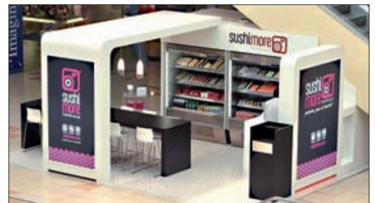
Espacio Sushimore en un centro comercial

El sushi es un producto japonés sano, nutritivo, sabroso y bajo en grasas y calorías que cada vez cuenta con más adeptos.