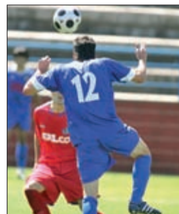
El Fuenla estrena técnico