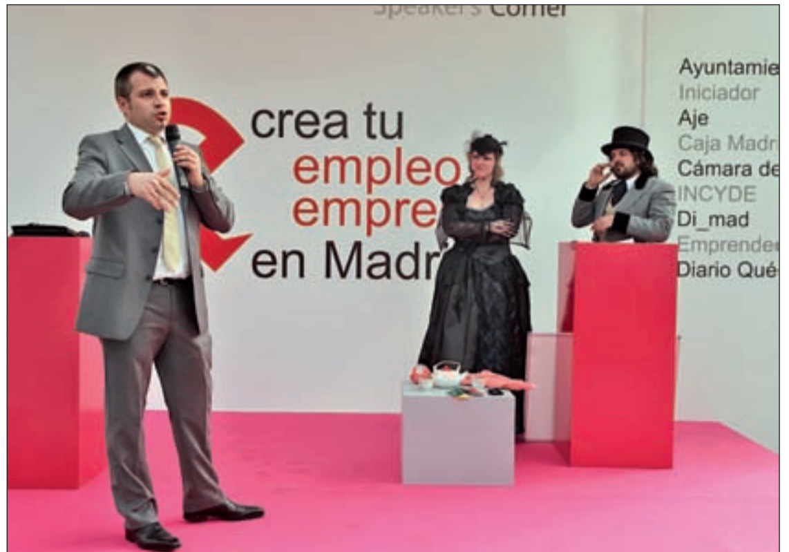
Un encuentro de emprendedores para fomentar la creación de empresas e impulsar la actividad económica

Entre los temas que se abordarán desde una perspectiva práctica figuran las claves para saber si un negocio es franquiciable o los sectores que más y mejor crecerán en los próximos años. Asimismo, se presentarán diversas opciones de inversión y autoempleo que, a día de hoy, están funcionando y creciendo en una coyuntura tan adversa como la actual. Por último, los empresarios obtendrán intere-