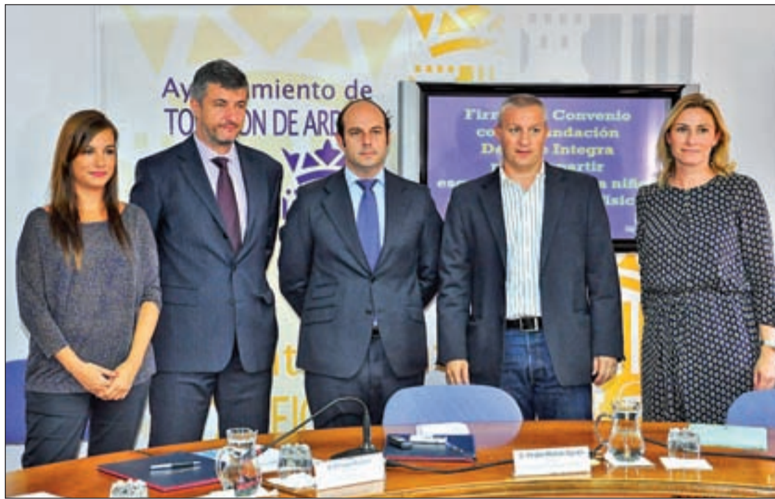
El acuerdo suscrito por ambos organismos tendrá vigencia durante dos años

Pero desde el ala del PSOE local han querido salir al paso de estas acusaciones. Viveros culpó al Ejecutivo del PP de la situación actual de este espacio verde y añadió que, si el proyecto se llevó a la Junta de Gobierno en lugar de al pleno, fue por indicaciones del Secretario General.