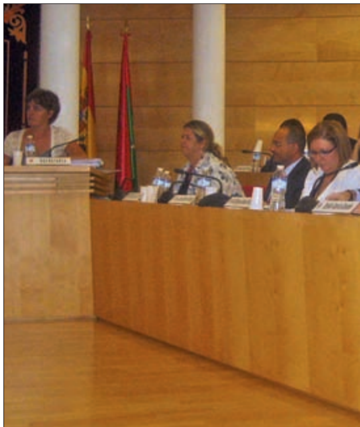
Miembros de la Corporación Municipal en un momento del pleno