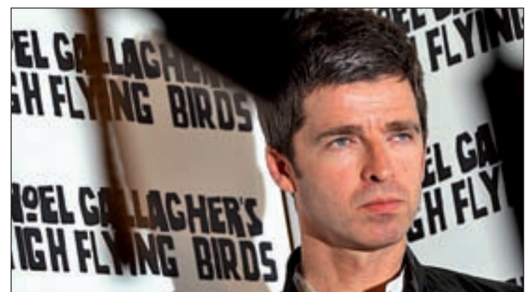
El que fuera componente de Oasis vendrá a España en noviembre