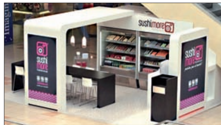
Espacio Sushimore en un centro comercial

El sushi es un producto japonés sano, nutritivo, sabroso y bajo en grasas y calorías que cada vez cuenta con más adeptos.