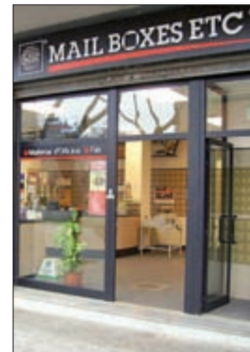
Establecimiento MBE a pie de calle

De este modo, alcanza ya los 175 establecimientos y continúa desarrollando su ambicioso plan de expansión que le permite abrir franquicias en poblaciones donde aún no tienen presencia, así como ampliarla en las provincias donde ya existe. Sus previsiones apuntan a los 200 centros abiertos a corto plazo y hay