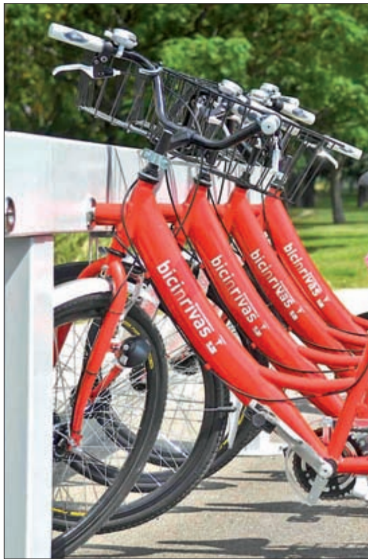
El alquiler está fijado entre los 30 y los 30 euros

Asimismo, tal y como han confirmado desde la administración