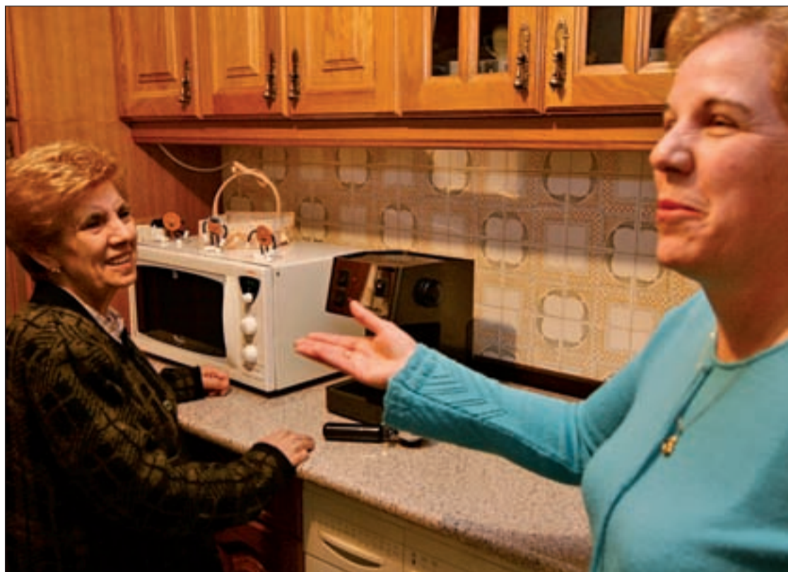
Alrededor de 450 personas están recibiendo atención de Ayuda a Domicilio y en el Centro de Día

Por todo ello, y según las últimas informaciones, el Ayunta-