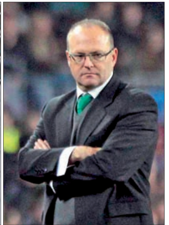
Manuel Pellegrini y Pepe Mel se vuelven a cruzar en los caminos del Real Madrid y el Rayo Vallecano