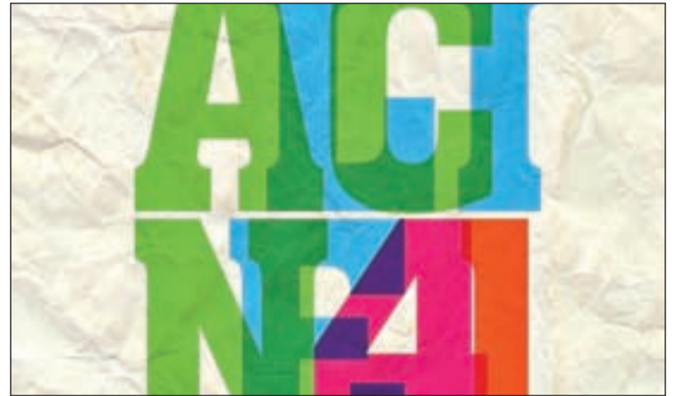
El certamen aglutinará también propuestas musicales y talleres

Las "Jornadas Gastronómicas Cervantinas" ya se han convertido en todo un clásico. Estos días de disfrute se prolongarán hasta el próximo 23 de octubre y, aquellos que quieran darse un paseo entre los pucheros más cuidados podrán consultar la oferta en la página web www.ayto-alcaladehenares.es y también en www.fomentur.es . En cuanto al precio, será de 38 euros por persona.