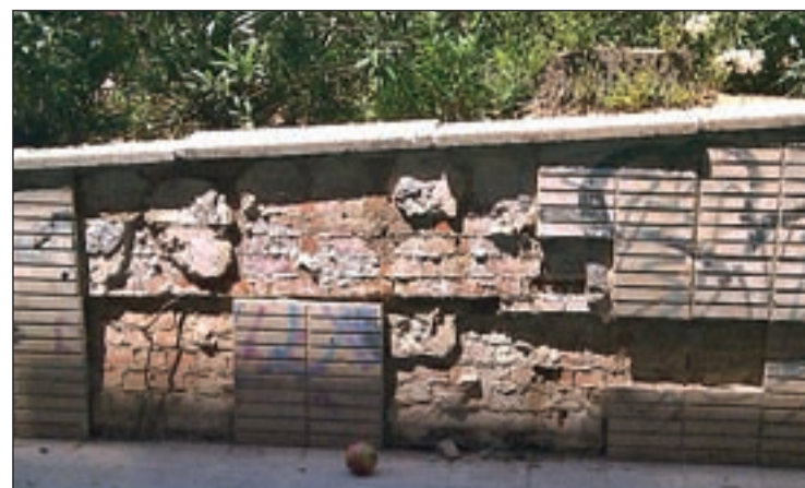
Los populares aseguran que existen importantes deterioros

Además, UPyD volvió "a la carga", presentando una iniciativa sobre la transparencia en la gestión del Ayuntamiento.