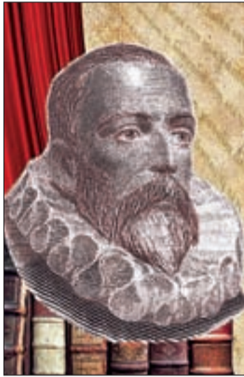
Hasta el próximo 23 de octubre