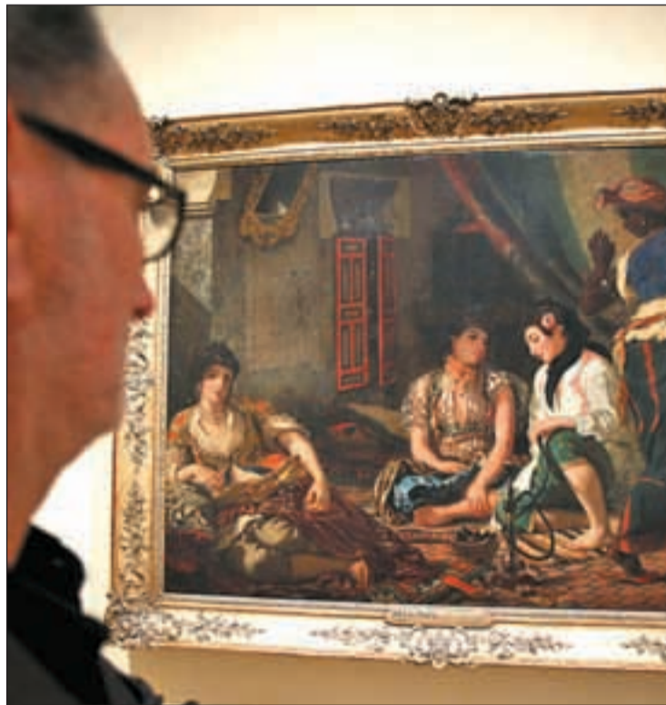
El francés es un gran exponente del romanticismo artístico

De hecho es "la muestra más importante de Delacroix desde la que organizó el Louvre en 1963 con motivo del centenario de la muerte del artista", recordó Sébastien Allard, comisario de la exposición. Para Allard esta retrospectiva podría decirse que es "un homenaje póstumo de Delacroix a España" ya que la influencia española se deja notar en el recorrido circular de la muestra. Así, afirmó que el artista francés hizo tres escalas en España tras su viaje a Marruecos. "Soñaba con España y fue de los primeros en descubrir los 'Caprichos' de Goya y ese color negro en el que se sumergió y del