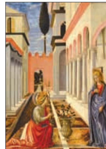
Uno de los cuadros de la muestra