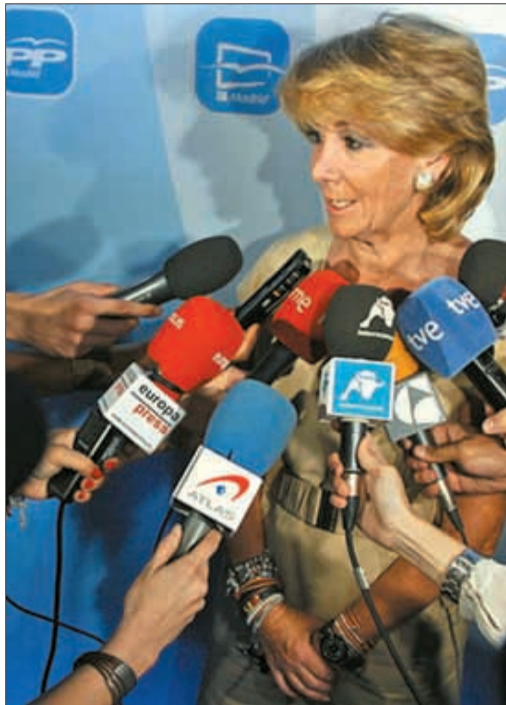
La presidenta regional no descarta que quisiesen 'okupar' su casa

Asimismo, Aguirre añadió que, teniendo en cuenta el atestado,