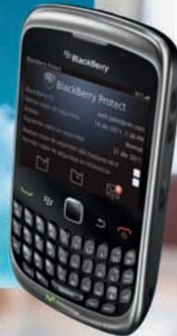
BlackBerry® Curve™ 3G 9300

900 10 10 10 Tiendas Movistar www.movistar.es