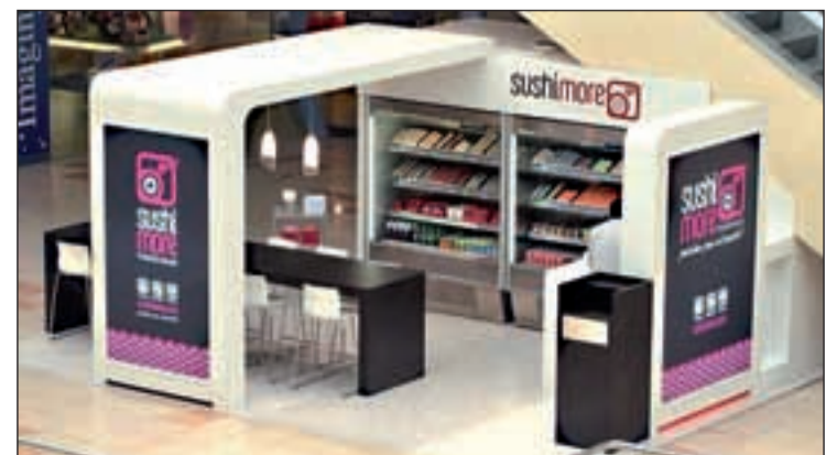
Espacio Sushimore en un centro comercial

El sushi es un producto japonés sano, nutritivo, sabroso y bajo en grasas y calorías que cada vez cuenta con más adeptos.