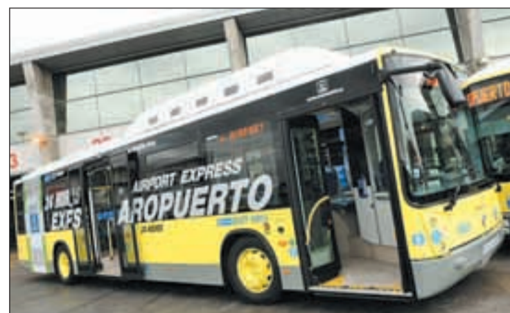
Trabajadores del aeropuerto y viajeros 'low cost' utilizan el transporte

La delegada de Medio Ambiente y Movilidad, Ana Botella,