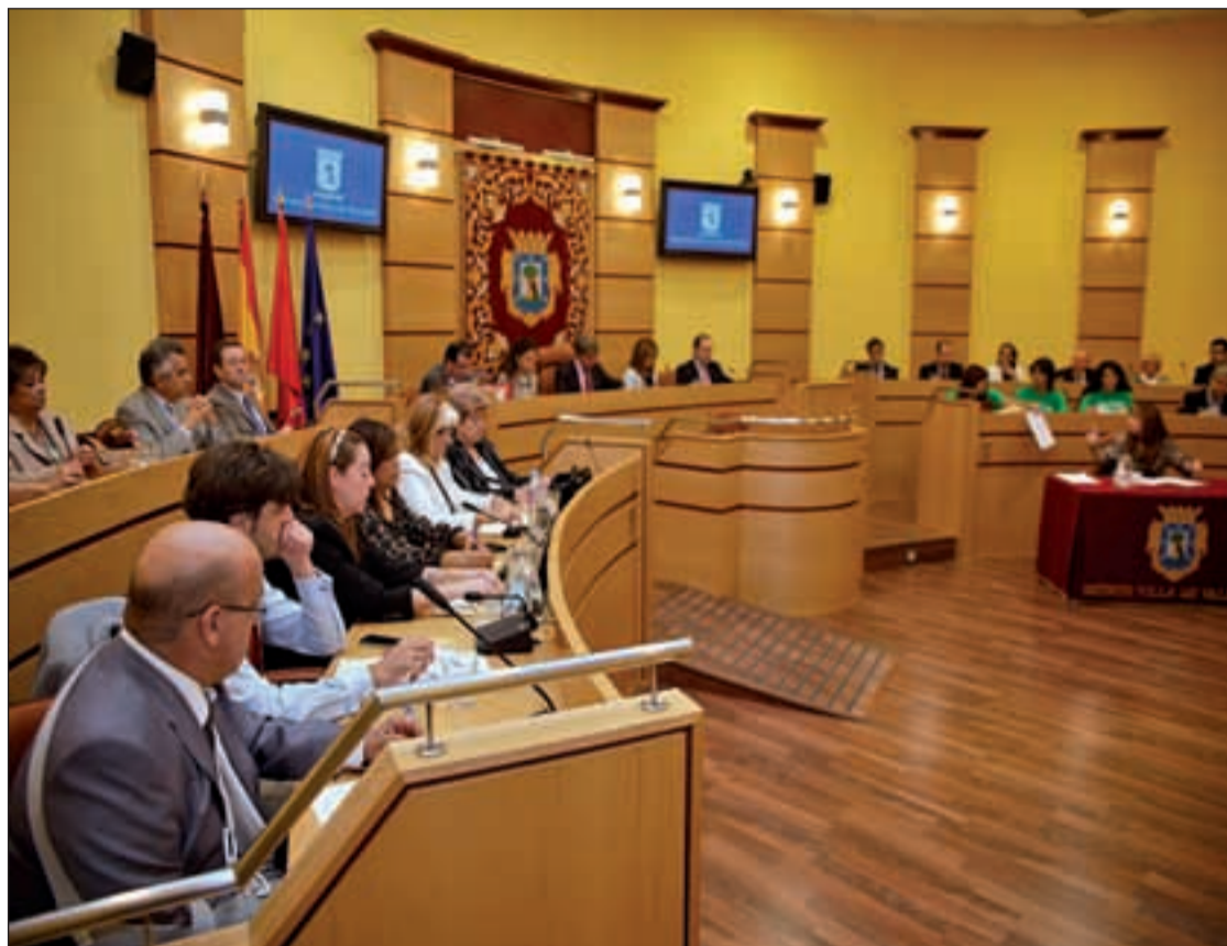
La composición de las Juntas de Distrito se está produciendo de forma progresiva

De esta manera, al PP le corresponden 14 representantes, al PSOE seis, a IU-Los Verdes tres y a Unión Progreso y Democracia dos miembros de su formación. Cada grupo municipal designará, a su vez, un portavoz y un portavoz adjunto. En los distri-