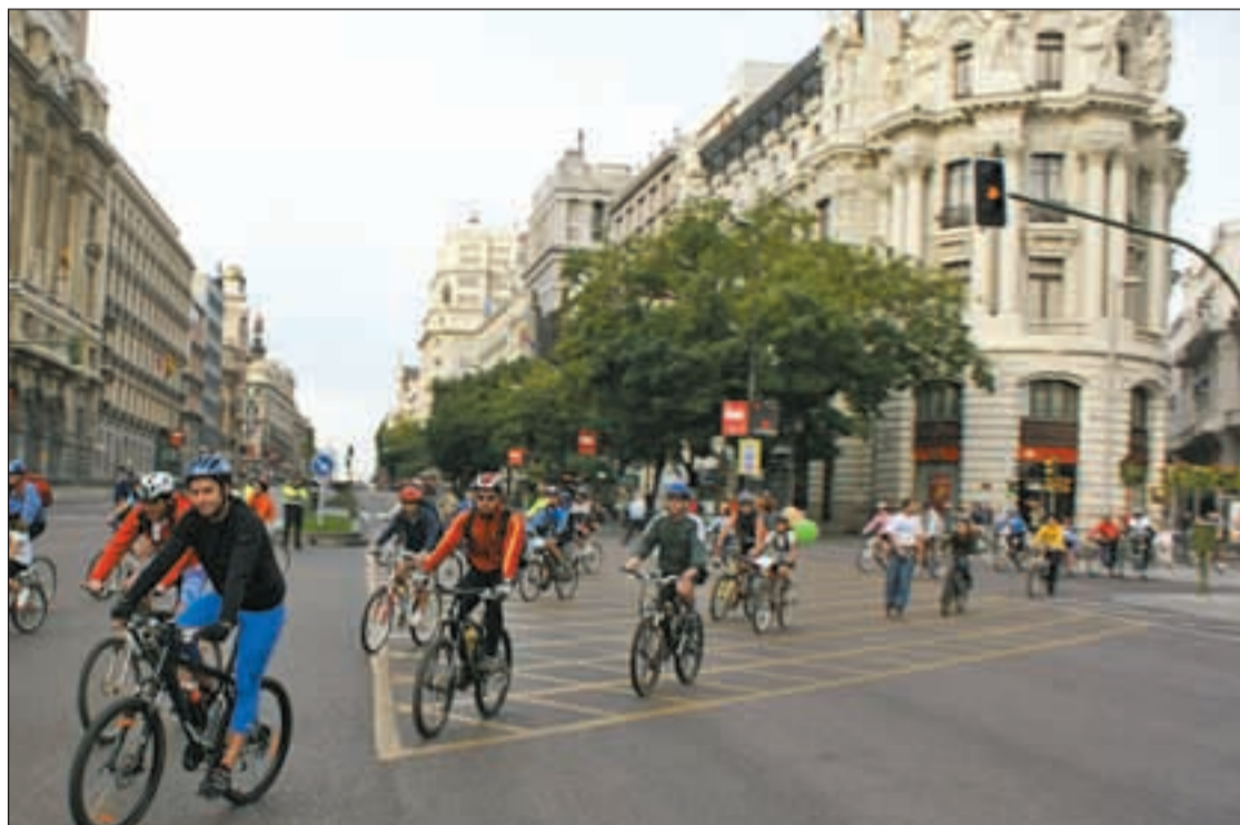
El Consistorio pretende que los ciclistas puedan utilizar con normalidad vías como la calle Alcalá

En este trazado coexistirán tanto zonas de carril bici como de cicocalles "en función de las características del viario existente". El espacio para colocar este carril reservado se detraerá del que actualmente está destinado a la circulación de vehículos. De esta manera se unirá el Anillo Verde Ciclista, ya existente, con otros carriles bici que actualmente permanecen sin conexión con el centro histórico, tales como los de O'Donnell, Madrid Río o el Pasillo Verde Ferroviario. Además, también se conseguirá conectar la red ciclista con la red de Metro y Cercanías en las estaciones de Sol, Delicias, Pirámides y el intercambiador de Príncipe Pío, dando así respuesta a "una aspiración altamente demandada". El objetivo es "avanzar en la idea de hacer de la bici-