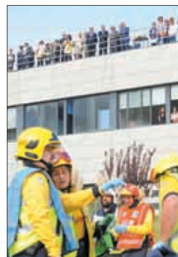
Imagen de la presentación

El PIC detalla funciones y competencias de los diferentes