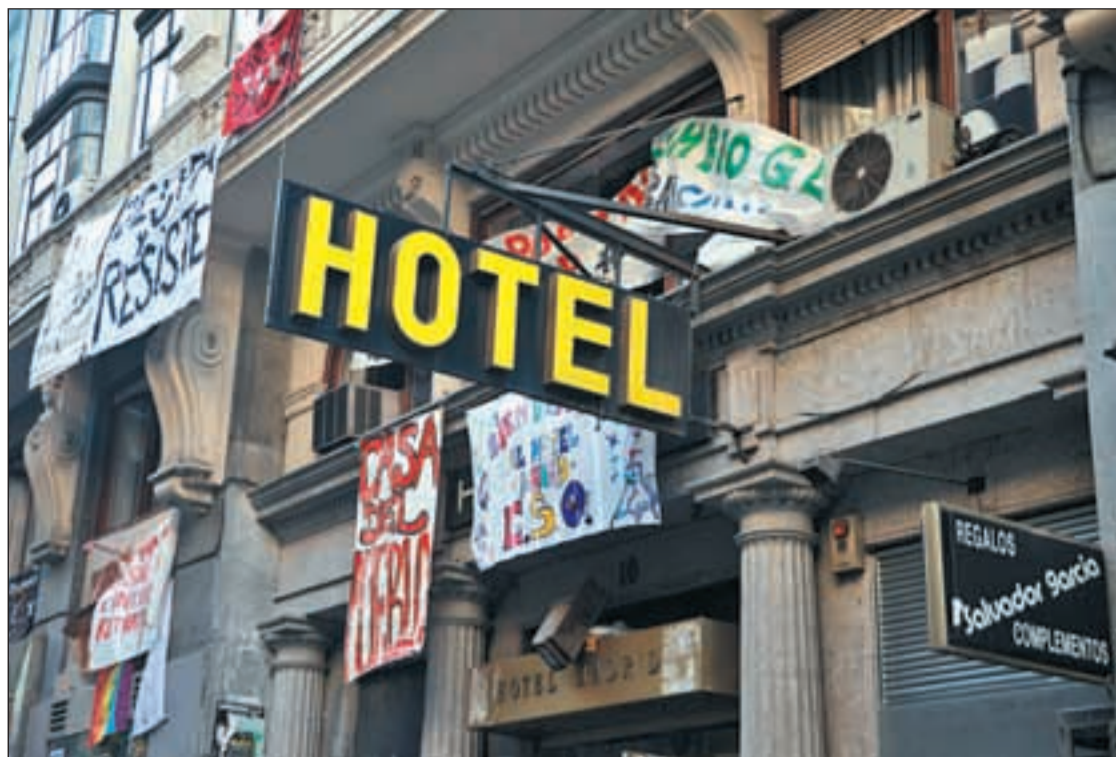
La actividad no cesa en el interior y en el exterior del número 10 de la calle Carretas

tivo homosexual y los atractivos turísticos de la ciudad ha sido "determinante" para esta concesión. El delegado de Economía, Empleo y Participación Ciudadana, Miguel Ángel Villanueva, ha expresado su satisfacción por acoger el primer encuentro de estas características en España.