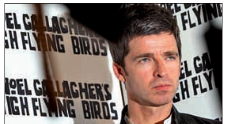
El que fuera componente de Oasis vendrá a España en noviembre