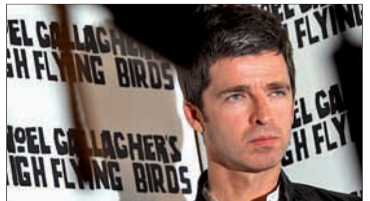
El que fuera componente de Oasis vendrá a España en noviembre