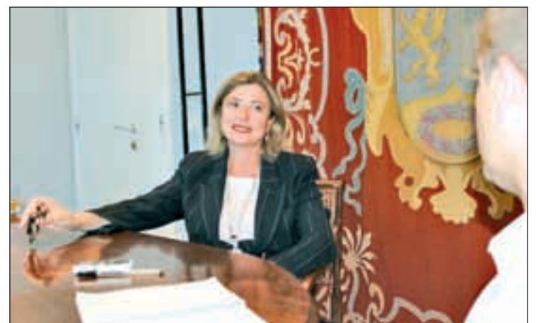
La edil, durante el transcurso de la entrevista

Tenemos unas carencias de financiación que hacen que no podamos atender todo lo que nos gustaría. Es necesario que el Ayuntamiento tenga una participación en el IVA y en el IRPF importante, cosa que ahora carece y que es imprescindible para tener la ciudad en las condiciones que todos deseamos”, argumenta la edil.