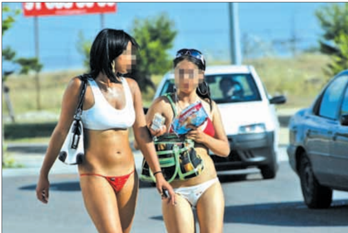
Prostitutas en el polígono Marconi del distrito de Villaverde