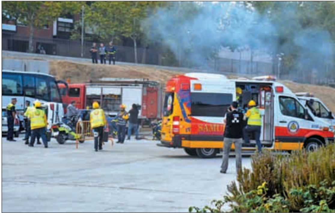
Un momento del simulacro realizado en presencia del alcalde de Madrid