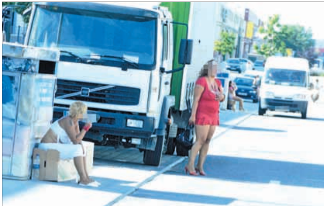
Meretrices de diferentes nacionalidades ejercen la prostitución en el polígono de Villaverde