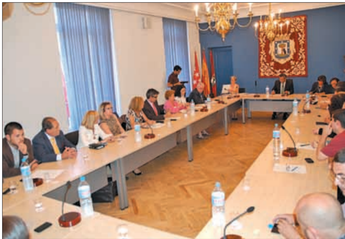
Un momento de la constitución de la Junta de Carabanchel

De esta manera, al PP le corresponden 14 representantes, al PSOE seis, a IU-Los Verdes tres y a Unión Progreso y Democracia, dos miembros de su formación. Cada grupo municipal designará, a su vez, un portavoz y un portavoz adjunto. En los distri-