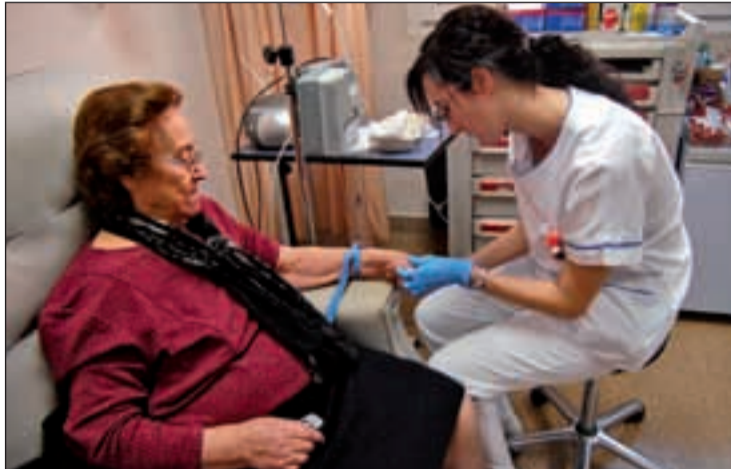
Una profesional sanitaria atiende a una persona mayor

Desde la entrada en vigor de la libre elección en Atención Primaria el 15 de octubre de 2010, un total de 279.050 de personas han elegido médico, pediatra y enfermera. En total, en Primaria el número de solicitudes de cambios de profesional son 467.359, de las que 198.166 son