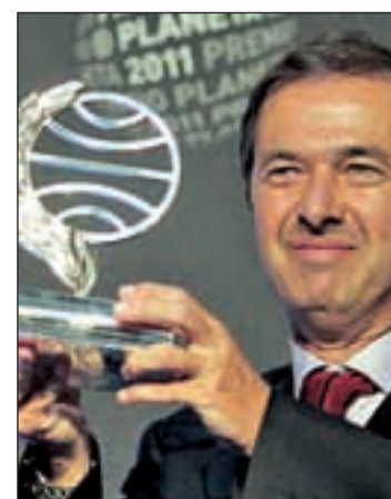
figura de Pedro I, el primer emperador de Brasil, un hombre "que estuvo siempre del lado de la historia, del lado de la libertad, en una época de monarquías absolutas", señaló al lado de los Príncipes de Asturias y de Girona. La novela se centra, sobre todo, en el ambiente "estrafalario" de la corte portuguesa, que trasladó la capital del imperio de Lisboa a Río de Janeiro, convirtiendo la ciudad brasileña en un escenario propicio a todo tipo de aventuras, con tratantes

de esclavos, militares codiciosos y músicos exquisitos, entre otros personajes.