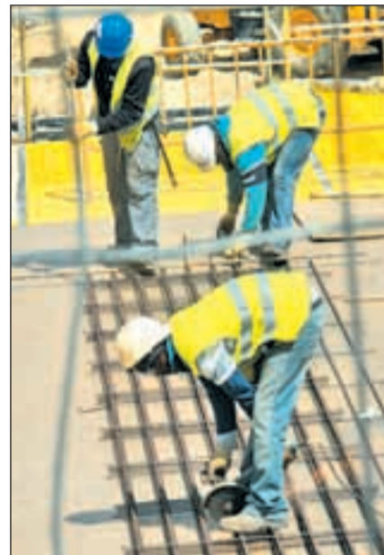
Trabajadores de la construcción

El consejero puso encima de la mesa algunas cifras como los