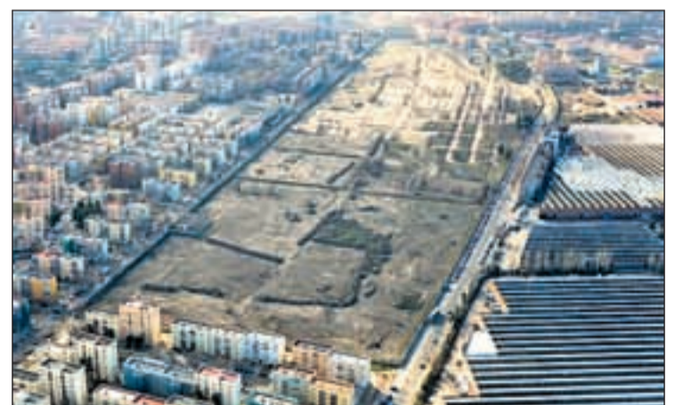
Una vista aérea de los terrenos del antiguo Cuartel de Ingenieros

En la parcela 3, Casalar construirá 202 viviendas; en la número 4, Vitra construirá 186 y en la 6.1, Quinta Los Molinos edificará 77 viviendas, todas ellas protegidas y en régimen de cooperativa. Estas 465 viviendas son las primeras de un total de 1.700 viviendas protegidas que tendrán cabida en este ámbito, en el que también se crearán 22.500 metros cuadrados de zonas deportivas y un parque de siete hectáreas.