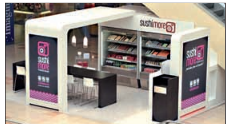
Espacio Sushimore en un centro comercial

El sushi es un producto japonés sano, nutritivo, sabroso y bajo en grasas y calorías que cada vez cuenta con más adeptos.