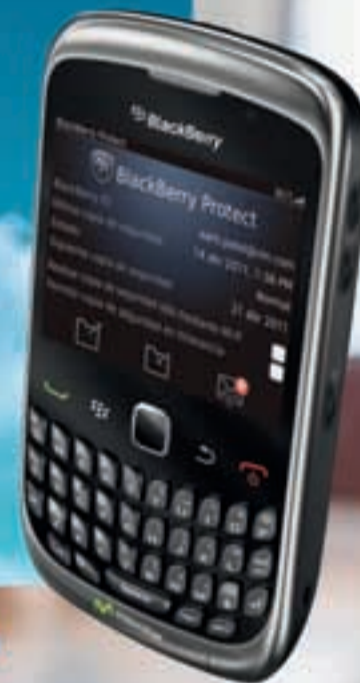
BlackBerry® Curve™ 3G 9300

900 10 10 10 Tiendas Movistar www.movistar.es