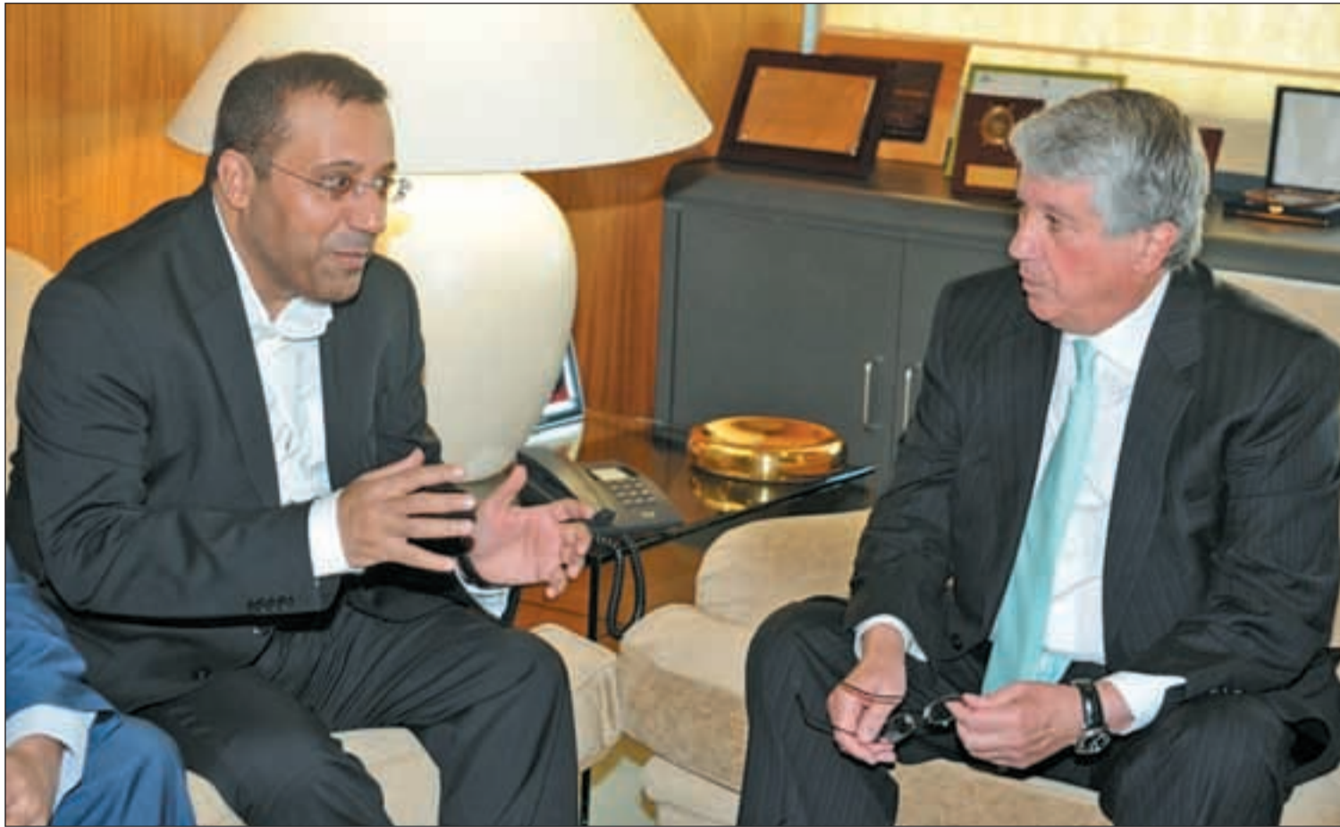
Arturo Fernández, presidente de la Confederación de Empresarios Madrileños, en una reunión