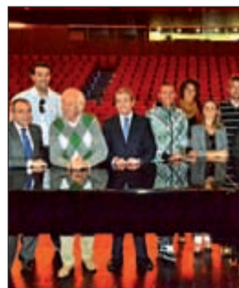
Foto de familia de los asistentes

Todos ellos pudieron contemplar las condiciones de las diferentes salas que componen el teatro y charlar con artistas como Víctor Ullate, antes de que Albert Boadella pusiera el broche final subrayando "la cercanía que existe entre el deporte y la danza y lo mucho que comparten" ambas disciplinas.