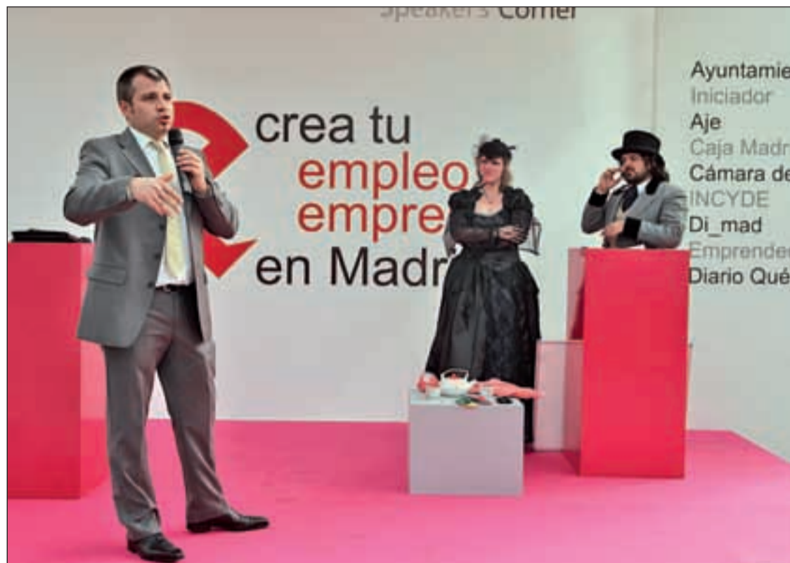
Un encuentro de emprendedores para fomentar la creación de empresas e impulsar la actividad económica

Entre los temas que se abordarán desde una perspectiva práctica figuran las claves para saber si un negocio es franquiciable o los sectores que más y mejor crecerán en los próximos años. Asimismo, se presentarán diversas opciones de inversión y autoempleo que, a día de hoy, están funcionando y creciendo en una coyuntura tan adversa como la actual. Por último, los empresarios obtendrán intere-