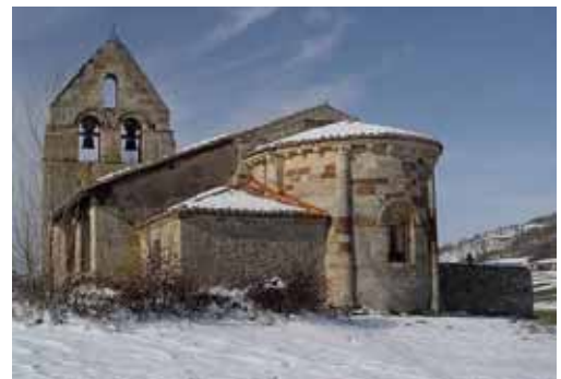
En la imagen una de las iglesias pertenecientes al Románico Norte.

comisión de Cultura que si la Junta no actúa en este sentido e incoa los expedientes de las iglesias, que configuran el románico norte de Burgos y Palencia, pedirán la declaración BIC de todas y cada una de las iglesias que componen este conjunto singular.