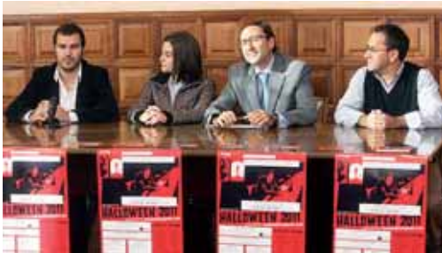
Dinamizar el sector de la hostelería y la ciudad son los objetivos.

Además, las salas de cine de la capital organizarán un ciclo de películas de terror y el grupo Alkimia ofrecerá sesiones de teatro infantil para los niños.