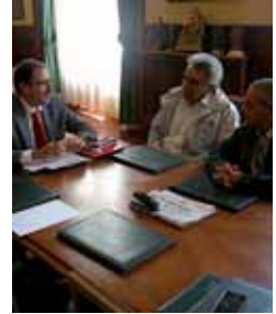
Un momento de la reunión.

Asimismo, el alcalde comprometió a estudiar todas las propuestas que se le hagan llegar desde el club para ayudar a