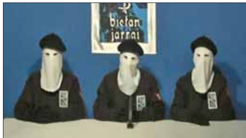
Integrantes de la banda terrorista, leyendo un comunicado.

También colaboraron en la confección del texto el ex jefe del gabinete de Tony Blair, Jonathan Powell; al ex primer minis-