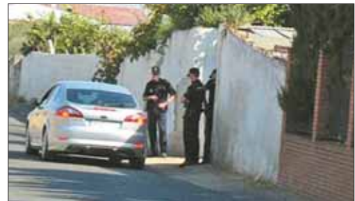
Agentes de Policía frente a la finca familiar donde se busca a los niños.

De hecho, la semana pasada, un testigo que estaba en el parque donde supuestamente desaparecieron los hermanos aseguró que había visto al hombre aquel sábado, "muy nervioso", buscando a sus hijos. Sólo él pudo corroborar la versión del