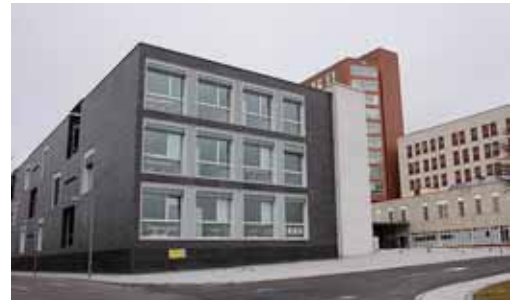
Imagen de archivo del Complejo Hospitalario de Palencia.

Por otro lado, es importante la modificación de la ordenanza de equipamientos del propio PGOU para parcelas de más de 25.000 m 2 , que afectará al nuevo Hospital, para adaptarla a las necesidades del mismo, sin que los límites de edificabilidad u ocupación máxima supongan un problema para desarrollar el