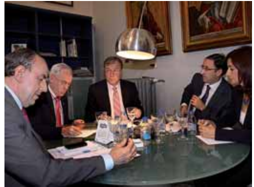
Silván con los responsables del Ayuntamiento, la Diputación y la Junta.

En lo que respecta al nuevo hospital, Silván manifestó que se ha comprometido con Polanco a agilizar al máximo la aprobación de la modificación del Plan General de Ordenación Urbana. El consejero recordó además que se sigue apostando por la promoción de la vivienda protegida tanto en el sector 8 de la capital como en algunos pueblos de la