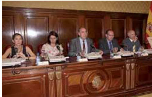
Imagen de archivo de un pleno celebrado en la Institución Provincial.