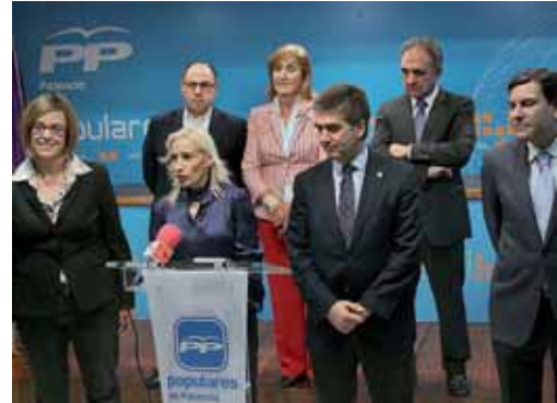
El PP presentó en rueda de prensa a sus candidatos.

La atleta que se mostró humilde y agradecida a los presidentes provincial, regional y nacional del