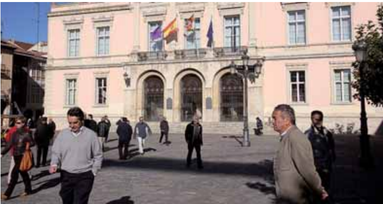
La petición supondrá un nuevo ahorro para las arcas municipales.

Tras ser velado su cuerpo en el Tanatorio de Palencia, el jueves 20 de octubre fue enterrado en su localidad, tras el funeral que dio comienzo a las 17.30 horas en la Colegiata de San Miguel.