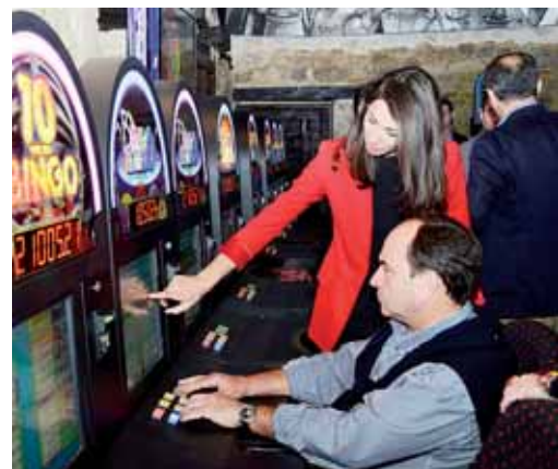
El VIII Congreso analizará la situación de los diferentes subsectores.

El congreso será clausurado por el presidente de la Diputación de Palencia y el director general de Ordenación del Territorio y Administración Local.