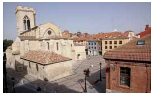
Imagen de los entornos de la Iglesia de San Miguel.

Desde esa fecha el único tráfico rodado al que se le permitirá el paso será al de los propietarios de plaza de aparcamiento en cualquiera de los vados existentes en la zona, ya que el pavimento de dicha plaza, reformada integralmente hace no mucho tiempo por la Junta de Castilla y León, está previsto para otro tipo de usos y, en consecuencia, los gastos derivados de la reposición y rehabilitación del mismo son casi permanentes. Asimismo desde el Consisto-