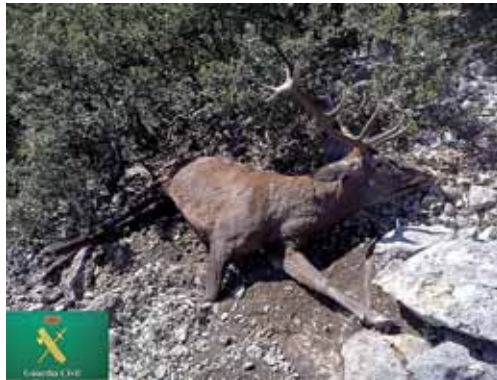
Trofeo de caza intervenido en una operación en la Montaña Palentina.

Comenzó el pasado 22 de septiembre, se denunció a un vecino de Madrid, al haber sido sorprendido transportando partes identificables de un ejemplar de cierva en un vehículo todo terreno, caza ilegalmente en un coto privado en el término municipal palentino de Dehesa de Montejo.