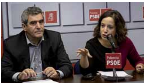
García aseguró que es importante escuchar a todas las partes implicadas.

implicadas en el sector agrario y ganadero. García señaló que el documento presentado por Dacian Ciolos es "decepcionante" y en algunos de sus aspectos, como la definición de agricultor activo "una broma pesada". Un documento que ha puesto de acuerdo a todos los ámbitos del sector en España y a países con tanto peso en Europa como Francia, Alemania y los estados del arco mediterráneo. No obstante, la eurodiputada socialista recaló que esta será la primera reforma de la PAC en la que el Parlamento Europeo "tiene mucho que decir", ya que tras presentar la Comisión su planteamiento, ahora el trabajo lo recorren los eurodiputados y "lo debaten y discuten, para llegar a un acuerdo y sacarlo adelante". Todo ello, en una votación que se celebrará en verano y donde podrá ser modificado.