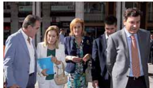
Un momento de la visita de Ana Pastor a la capital palentina.

En este sentido, el programa del Partido Popular propondrá, entre otras cuestiones, "reforzar las materias instrumentales como lengua y matemáticas, fomentar la FP e implantar un sistema educativo de un Bachillerato de tres años", ya que a su juicio, "el actual no garantiza a nuestros alumnos la formación necesaria".