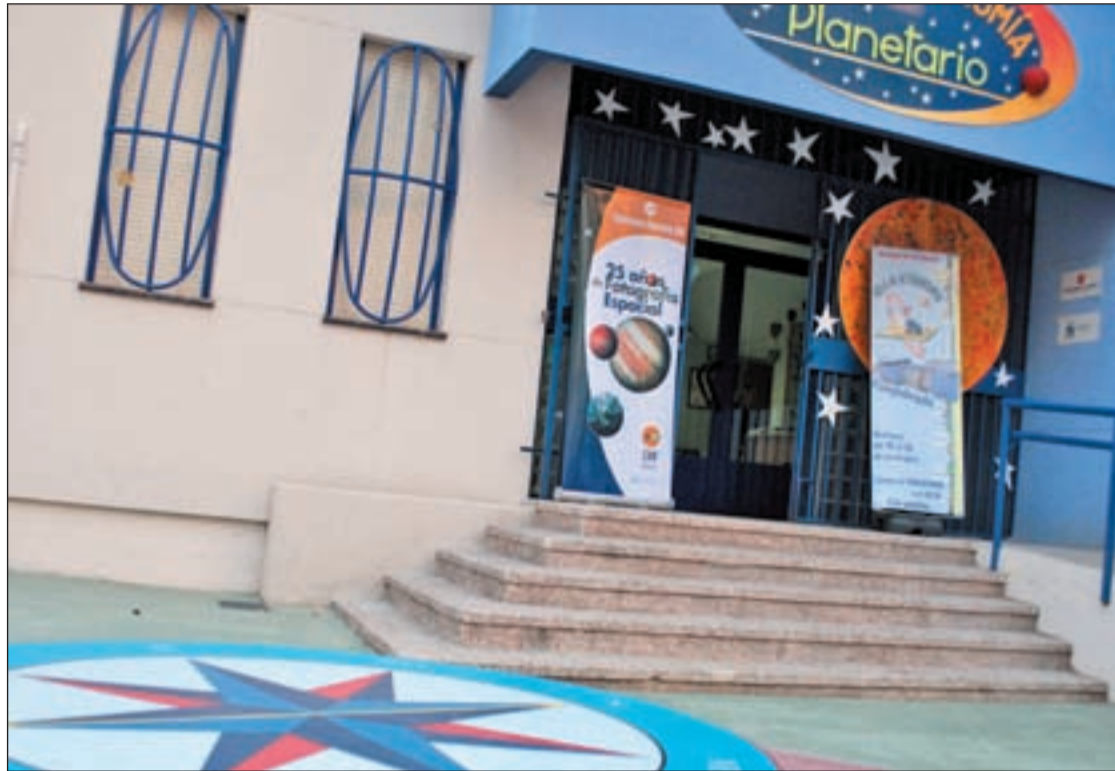
Sede del Aula de Astronomía de Fuenlabrada