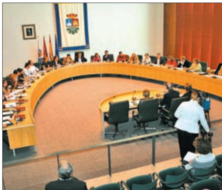
Pleno del Ayuntamiento, en una imagen de archivo

Desde el PP de Fuenlabrada consideran que este Pleno "está perfectamente justificado", y subrayan que los defectos de forma detectados por la Secretaría