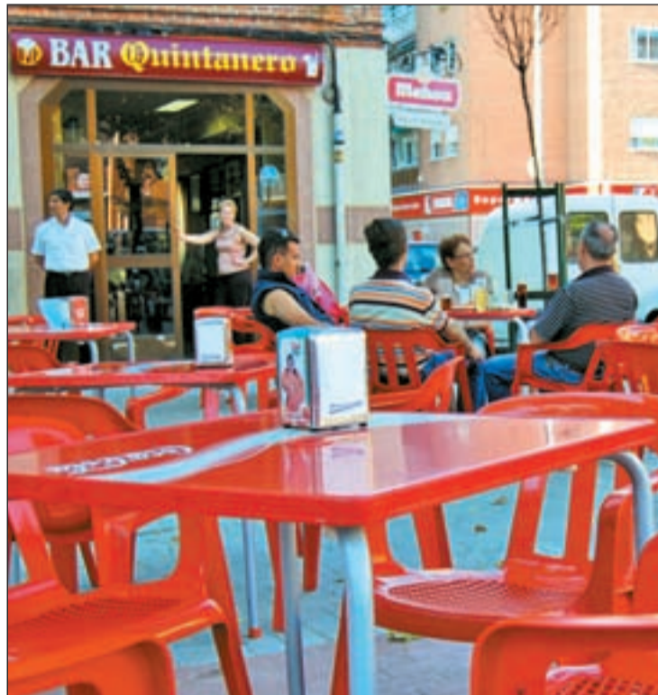
Los 2.814 comercios de la ciudad generan casi el 56% del PIB

El alcalde, por otro lado, ha mostrado su desacuerdo ante la decisión del Gobierno regional de liberalizar los horarios de los establecimientos con una superfi-