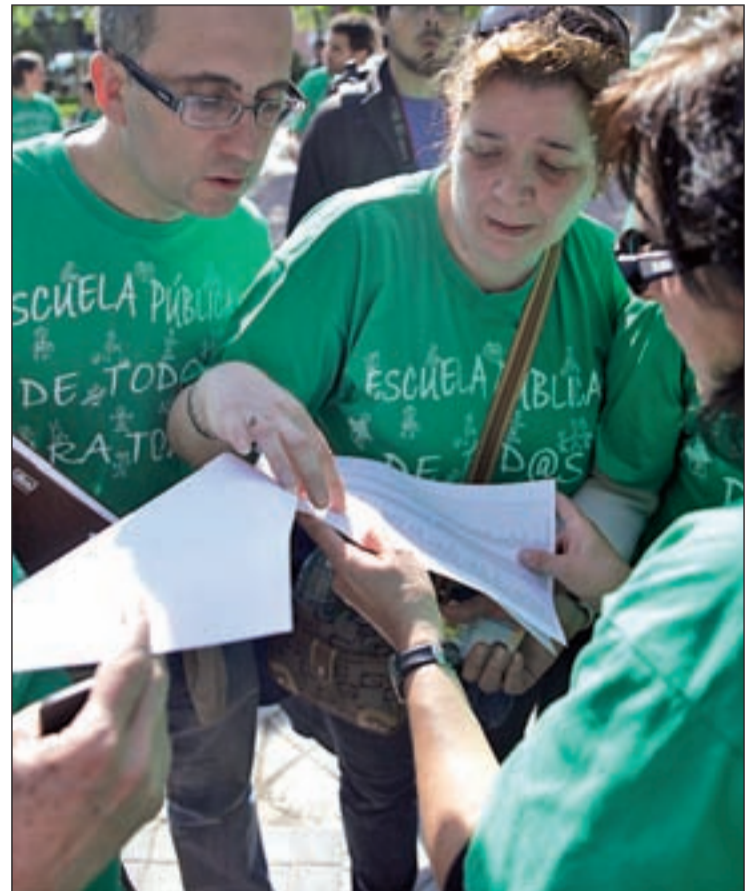
Profesores durante una protesta

Los sindicatos tomaron esta decisión al considerar que Rajoy preside el partido que "sustenta políticamente el Gobierno de la Comunidad de Madrid", según dijo el vicepresidente de ANPE