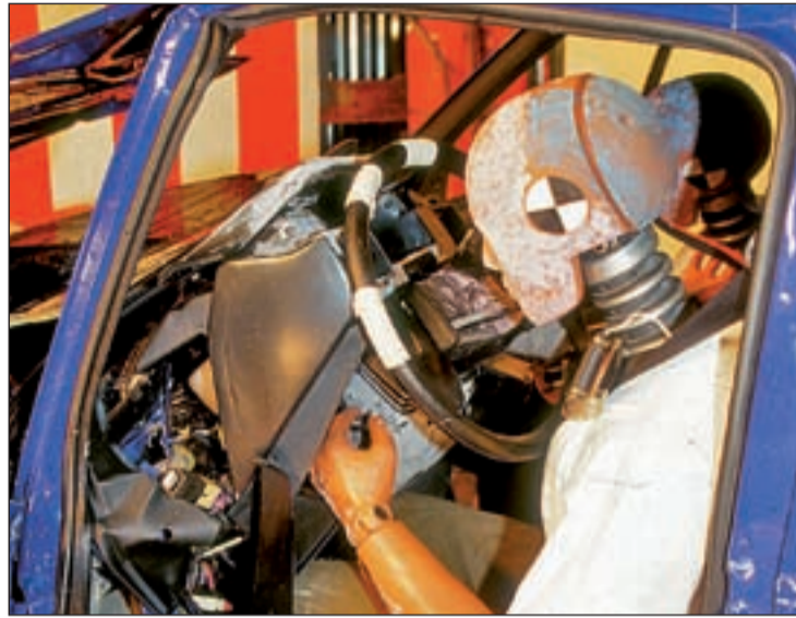
Pruebas de los dispositivos de seguridad de los automóviles

Pero las cifras negras esconden más causas que se sustentan en la desobediencia de las obligaciones viales. En España, cada