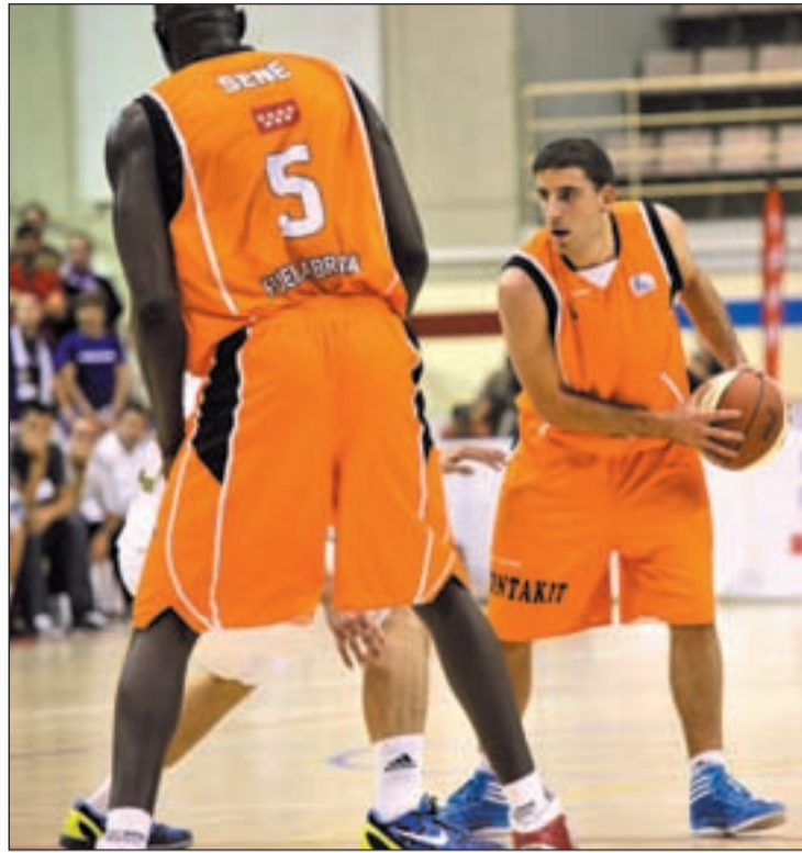
Semana cargada de partidos para el Fuenlabrada

Tras ese partido clave en la carrera por la permanencia, al Baloncesto Fuenlabrada le llegará el momento de debutar en la Eurochallenge. Esa cita histórica tendrá lugar el próximo martes