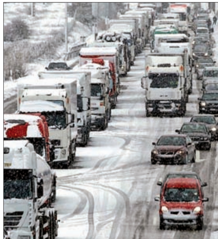
Los neumáticos de invierno contribuyen a una mayor adherencia al firme

Ahora es un buen momento para realizar el cambio. El mal tiempo se nos echa encima y la seguridad que ofrecen estos neumáticos nos hará ir un poco