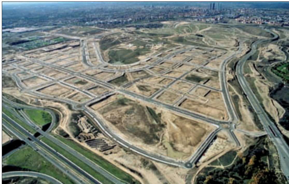
Vista área de la zona de Valdebebas