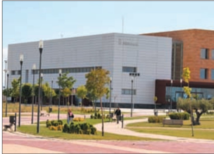
Campus de Fuenlabrada

La Semana de la Ciencia, que se prolongará hasta el 20 de noviembre, acerca la ciencia y la tecnología a la sociedad, y la Universidad Rey Juan Carlos participa de manera activa en el evento. En esta undécima edición, que se desarrolla bajo el lema "Química: soluciones para un mundo sostenible", y que coordina la Consejería de Educación de la Comunidad de Madrid, el centro organiza en sus campus (Alcorcón, Fuenlabrada, Móstoles y Vilcálvaro) más de 100 actividades relacionadas con ciencia, salud, cultura, arte e innovación tecnológica.