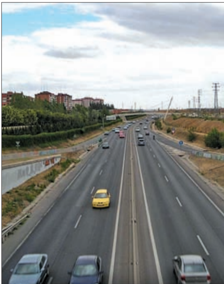
La M-506, a su paso entre las localidades de Móstoles y Fuenlabrada

El Gobierno municipal ha denunciado que los tramos de dicha vía que están alumbrados a su paso por la ciudad "lo están porque el Ayuntamiento se está haciendo cargo del pago de las facturas correspondientes a la compañía eléctrica". En concreto, del tramo frente al barrio de Loranca, se ha facturado entre enero y septiembre la cantidad de