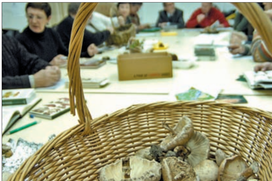
Cada vez son más los aficionados que acuden a este tipo de talleres para conocer más sobre la micología

La Asociación Micológica de Fuenlabrada ha recordado también cuáles son las normas básicas