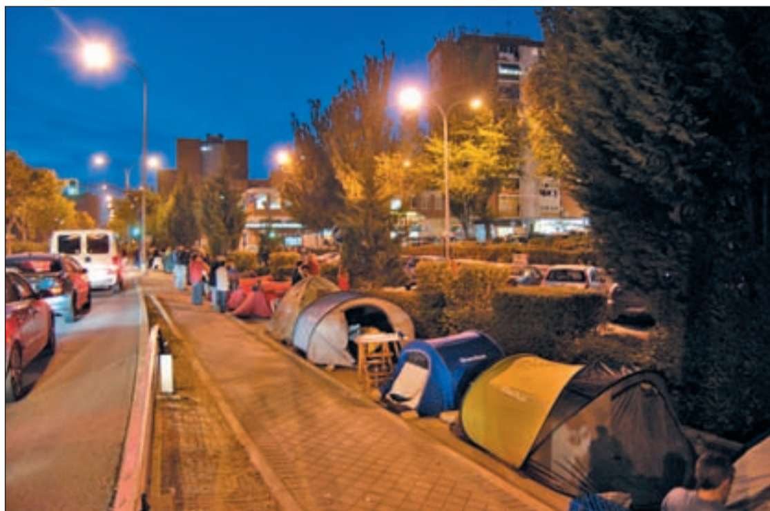
Miles de personas hicieron cola a la intemperie en 2008

Por otro lado, en la moción se pide que se agilice la concesión de la renta a los beneficiarios, porque los perceptores tienen que esperar una media de 4 o 5 meses, lo que supone que, en muchos casos, tengan que actualizar la documentación presentada por caducidad de la misma.