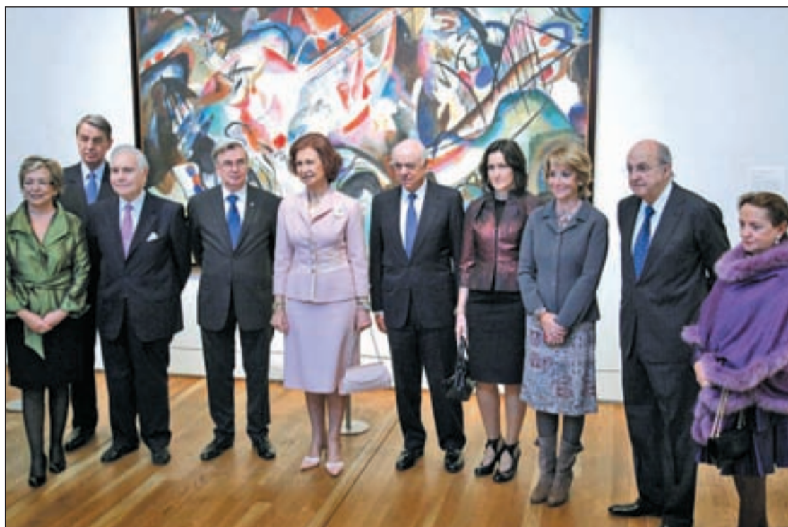
La reina doña Sofía y Esperanza Aguirre, durante la inauguración de la exposición en el Museo del Prado