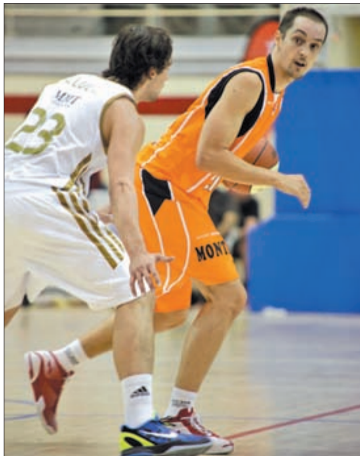
Cortaberría, en un partido de la pretemporada

zona que el Fuenla, el calendario ha deparado por segunda semana consecutiva otro partido a domicilio para el equipo de Porfirio Fisac y para colmo, ante otro de los hipotéticos rivales por la permanencia. El Blusens Monbus empezó la temporada de modo fulgurante, con dos triunfos en las tres primeras jornadas, aunque dos derrotas consecutivas han llevado a los hombres de Moncho Fernández a la zona media baja de la clasificación. Los gallegos sólo han recibido