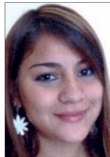
Imagen de la joven desaparecida

En el momento de la desaparición, L.M.G. llevaba puesto un