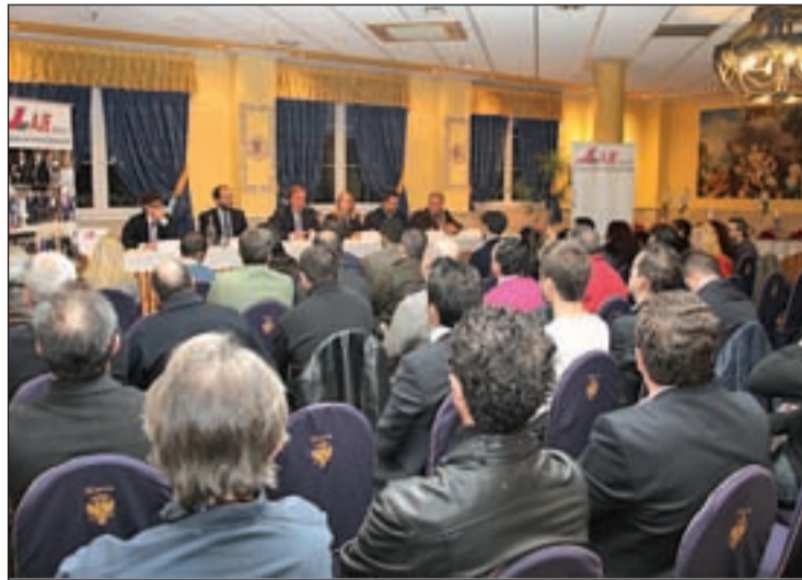
El acto estuvo organizado por AJE