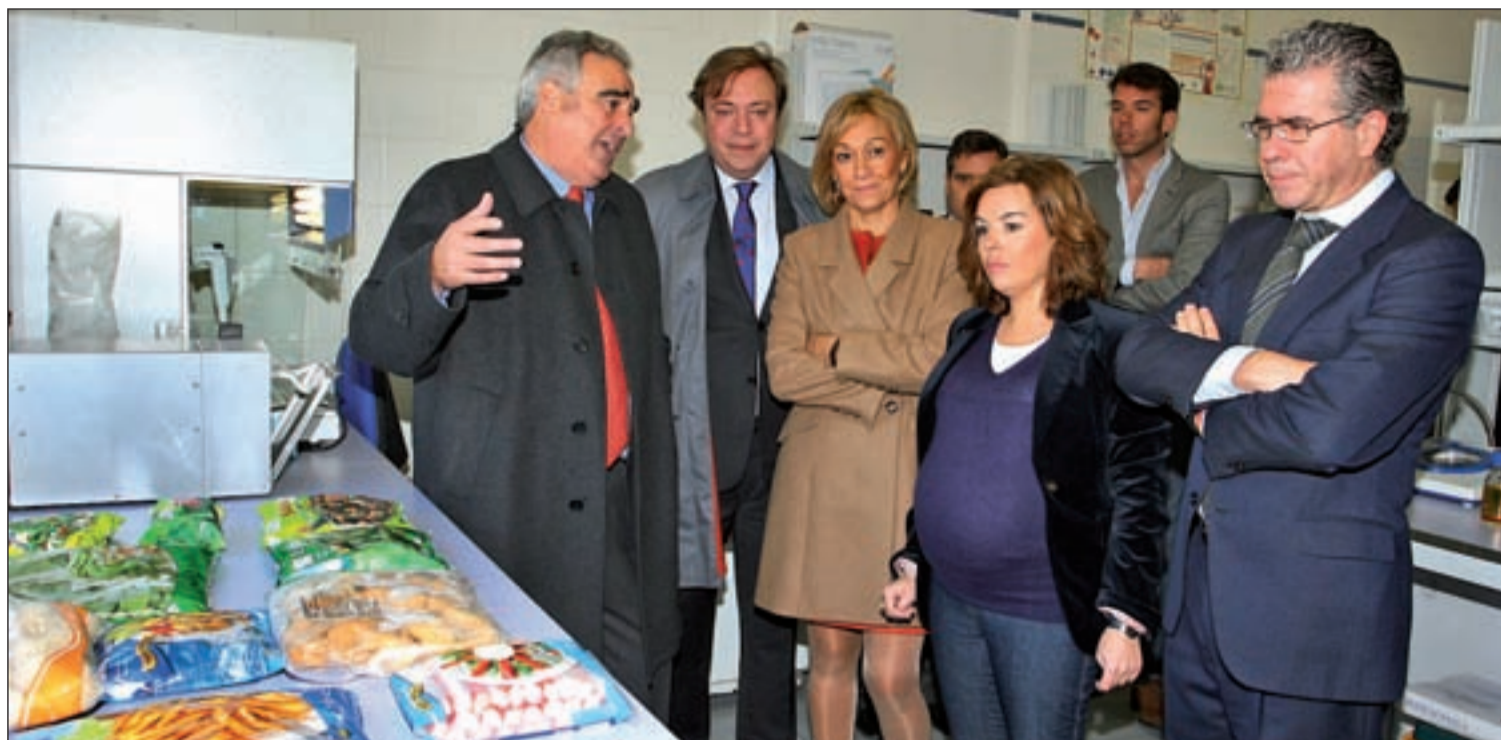
Soler, Sáenz de Santamaría y Granados, este miércoles en la fábrica Confremar Congelados y Frescos del Mar

“La salida de la crisis no es la del PP, y a los que utilizan el voto para que nadie esté mucho tiempo en el Gobierno les digo que este no es el momento”, dijo.