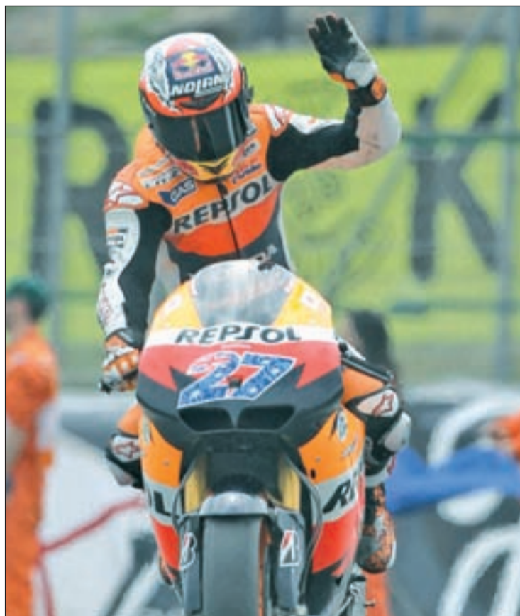
El piloto de Honda corroboró en Cheste su dominio

Ambos pilotos siguen barajando diversas opciones, aunque en el caso del manresano una de esas alternativas podría pasar