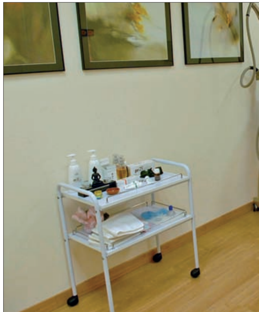
Las clínicas de estética ofrecen diversos tratamientos contra las alteraciones dermatológicas