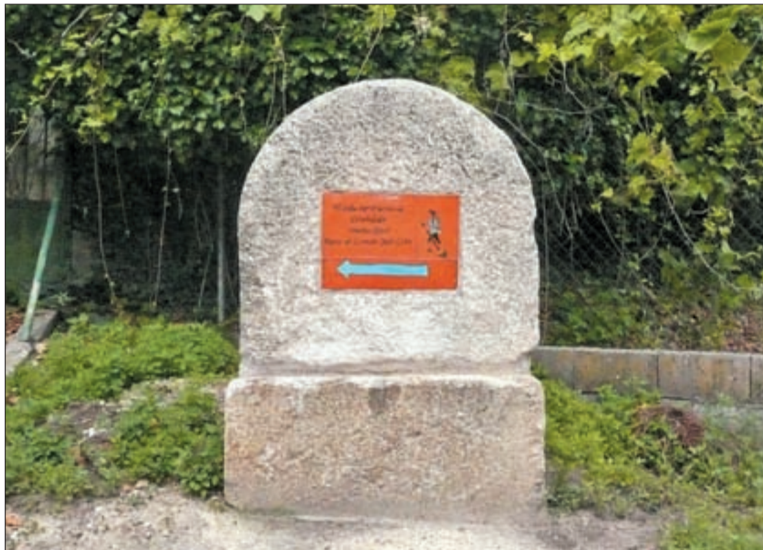
Mojón que marca en el camino la Ruta de Camilo José Cela

Sin duda, Camilo José Cela fue uno de esos caminantes dignos de admiración, que supo aprovechar bien las musas del lindero, pues tiene libros y obras magistrales como el Viaje a la Alcarria, el Diario del Guadarrama, Judíos, moros y cristianos, en el que nos da esas claves de nuestra historia y de nuestra ontología y del que podemos seguir sus