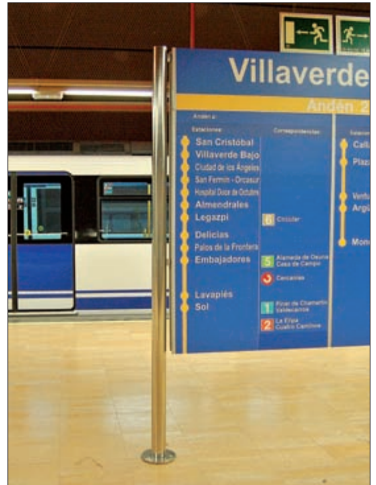
La línea 3 unirá Villaverde con el barrio getafense

El alcalde indicó que el Ayuntamiento se puede hacer cargo de ese porcentaje del 50% al que se había comprometido el anterior regidor Pedro Castro, "y que ahora significa menos que cuando se firmó el convenio en 2005".