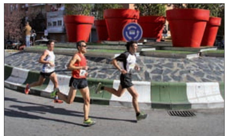
Un momento de la competición

El C.D.E. Pool Xetaffe Baloncesto recuerda que aún hay plazas en algunos equipos. La oferta es la siguiente: para la Escuela Municipal, en sus equipos mixtos de Alevín/Benjamín (martes y jueves, de 17:00 a 18:00, en el Pabellón Juan de la Cierva). Para la Escuela Municipal, en sus equi-