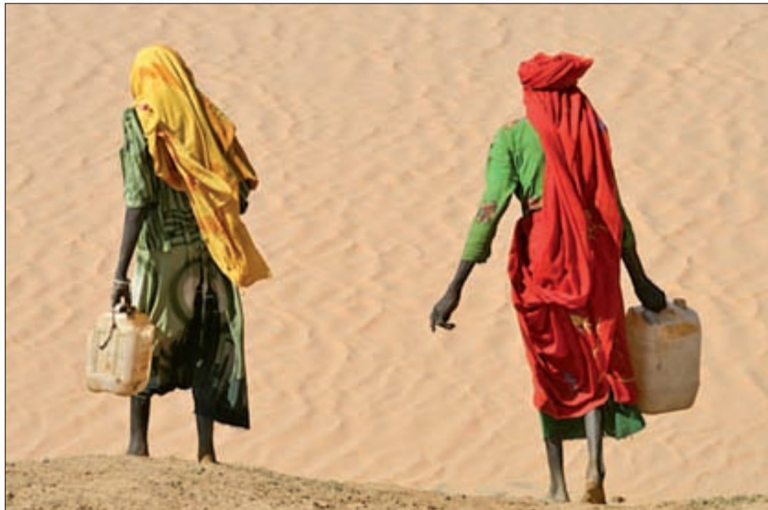
La exposición permanecerá hasta el 17 de noviembre en el CC Juan de la Cierva

El V Certamen de Creaciones Artísticas de Redint-Getafe abre su plazo de inscripción hasta el 18 de noviembre. El concurso, que está dirigido a los usuarios de las salas Redint de acceso público a Internet, tiene por temática 'Crea contra la violencia de género', en las modalidades de fotografía digital, dibujo por ordenador y relato corto. Se han establecido varias categorías: Infantil (menores de 15 años) y Juvenil/Adulto (a partir de los 15). Más información sobre la convocatoria en el portal en Redint-getafe.com.