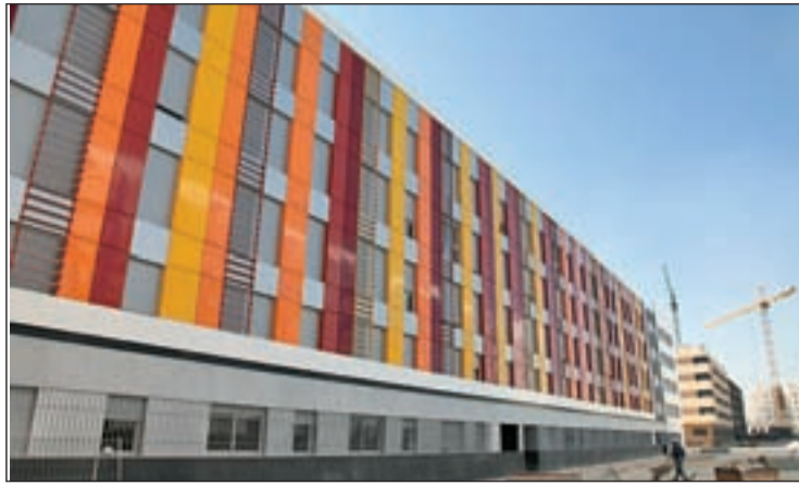
Vivienda en Getafe

TAMBIÉN PLANTEA UNA OFICINA PARA ATENDER A LAS FAMILIAS