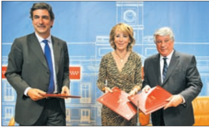
La presidenta regional presidió la firma del convenio