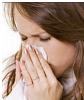
Vitamina C y B12 contra el catarro

algunos alimentos puede facilitar su aparición. Para evitar estas carencias debes saber que las vitaminas y los minerales antioxidantes aumentan la resistencia a las infecciones y protegen a las células del sistema inmune de los daños provocados por los radicales libres. Por eso procura tomar vitamina C, B12 y E.