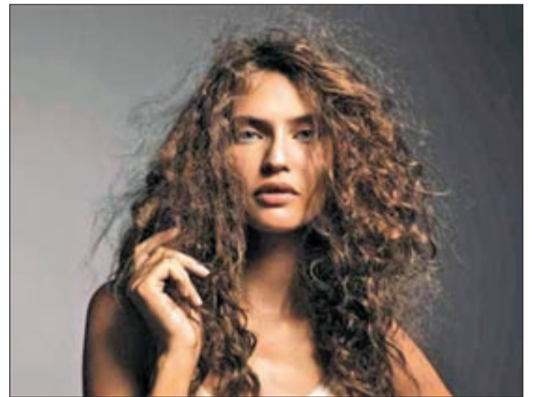
El pelo encrespado es común en los días de lluvia

Por otra parte, un uso excesivo de la plancha o de aparatos de calor nunca es buen consejero pero, a veces, por causa de la llu-