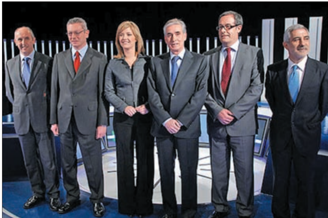
Erkoreka, Gallardón, Jáuregui, Macías y Llamazares posan antes del debate junto a la moderadora

A diferencia que Mariano Rajoy, Gallardón se mostró más preciso en cuestiones como la subida del IVA, que también rechazó. Asimismo, apostó firmemente por una "reforma fiscal que no castigue" como una de las vías claves para salir de la crisis. En cuanto a la mención de Jáuregui sobre las cuentas madrileñas, el alcalde sacó pecho y le respondió que la ciudad tiene menos paro que la media nacional y