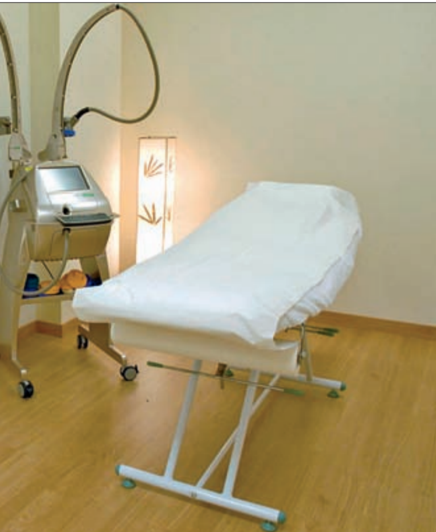
cas en invierno y para frenar las marcas del tiempo en la piel