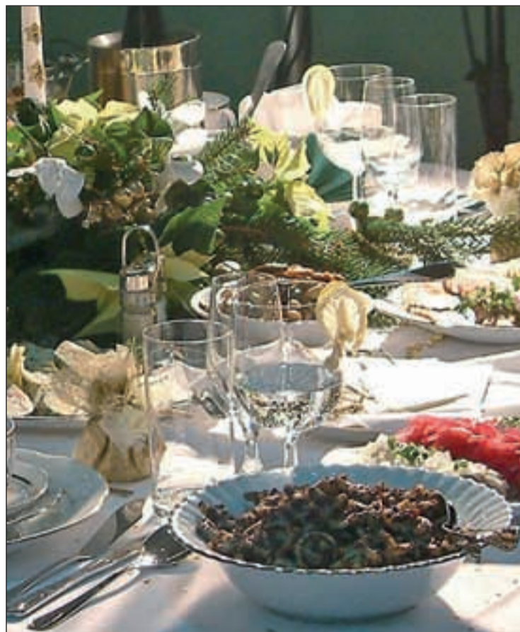
Las copiosas cenas de Navidad se deben evitar por motivos de salud

Como dice nuestro médico, “la falta de costumbre en el consumo de determinadas bebidas alcohólicas, además de generar un importante aporte calórico nos puede traer verdaderos proble-