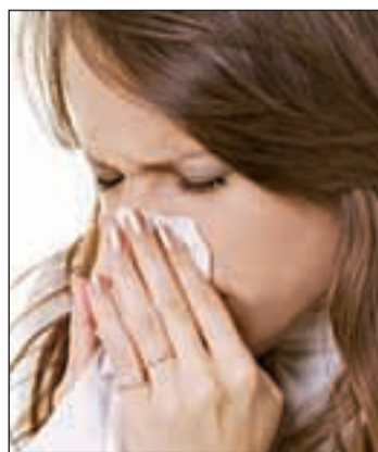
Vitamina C y B12 contra el catarro

algunos alimentos puede facilitar su aparición. Para evitar estas carencias debes saber que las vitaminas y los minerales antioxidantes aumentan la resistencia a las infecciones y protegen a las células del sistema inmune de los daños provocados por los radicales libres. Por eso procura tomar vitamina C, B12 y E.