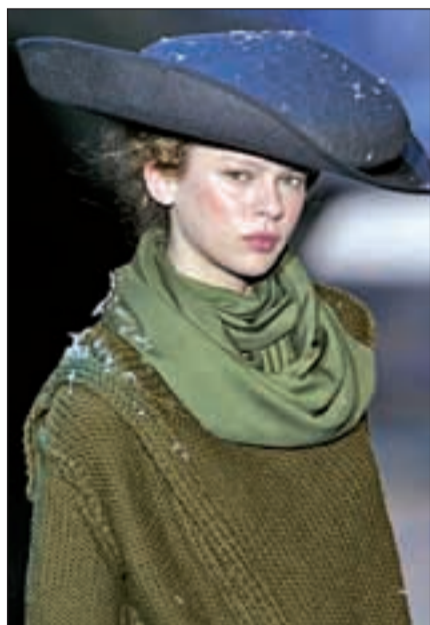
Abrigarse, el mejor escudo para la piel

Sin embargo, los efectos de la microdermoabrasión van más allá porque también ayuda a eliminar las arrugas de la piel, tiene un coste bajo y asequible para