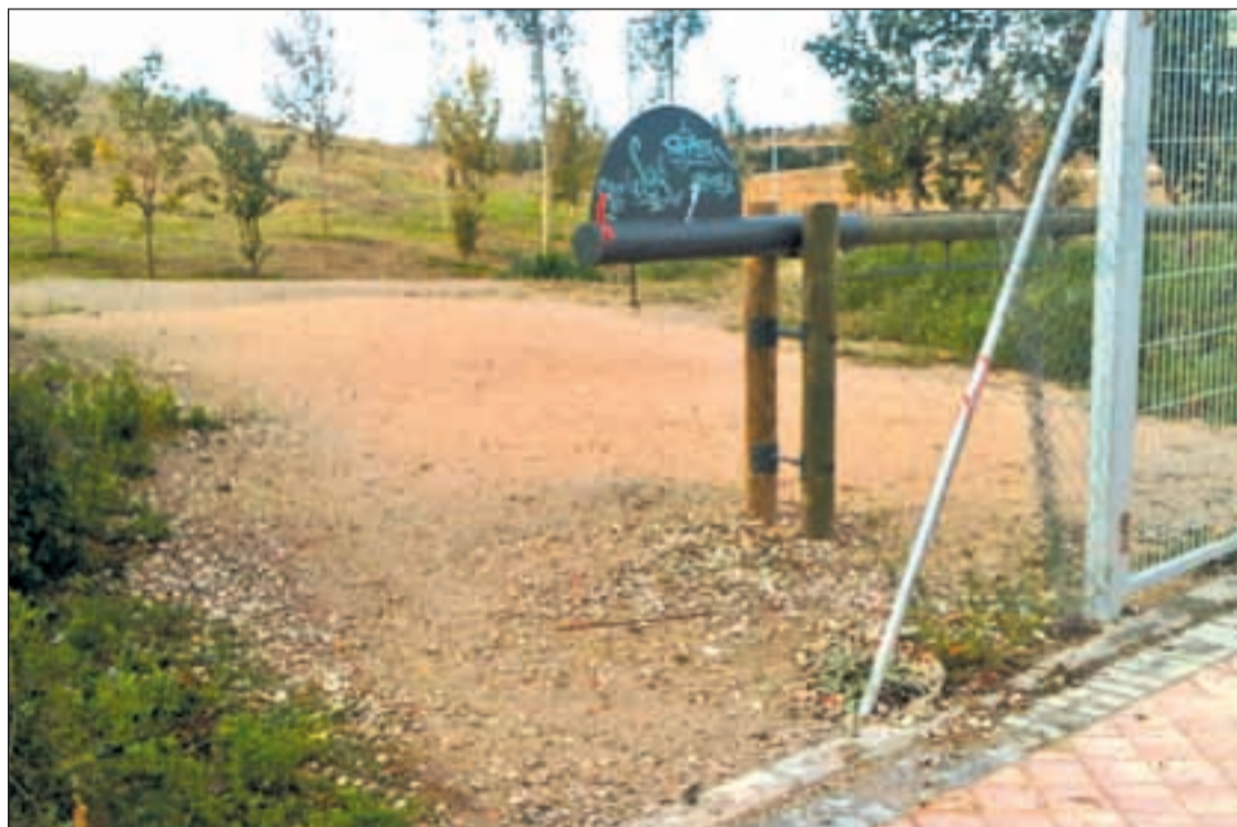
La entrada improvisada a la zona verde del Ensanche de Vallecas