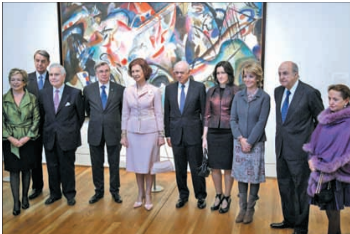
La reina doña Sofía y Esperanza Aguirre, durante la inauguración de la exposición en el Museo del Prado