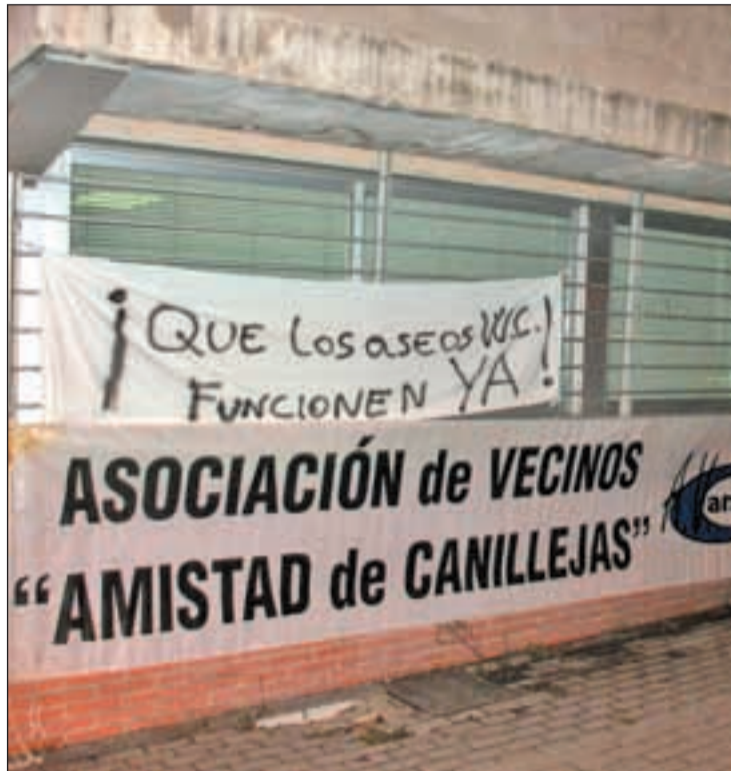
Los vecinos ya se manifestaron el pasado 3 de noviembre