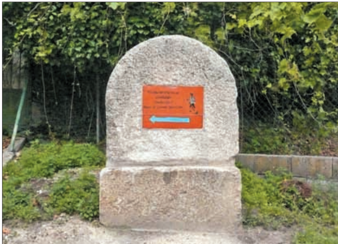
Mojón que marca en el camino la Ruta de Camilo José Cela

Sin duda, Camilo José Cela fue uno de esos caminantes dignos de admiración, que supo aprovechar bien las musas del lindero, pues tiene libros y obras magistrales como el Viaje a la Alcarria, el Diario del Guadarrama, Judíos, moros y cristianos, en el que nos da esas claves de nuestra historia y de nuestra ontología y del que podemos seguir sus