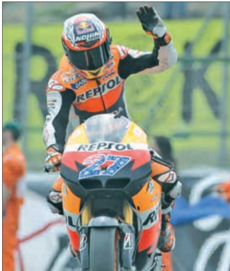
El piloto de Honda corroboró en Cheste su dominio

Ambos pilotos siguen barajando diversas opciones, aunque en el caso del manresano una de esas alternativas podría pasar