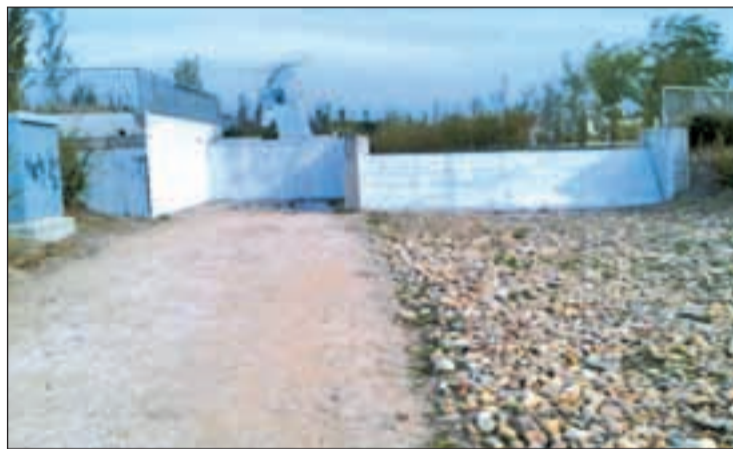
EN PROCESO DE CONSOLIDACIÓN Fuentes del Área de Medio Ambiente del Ayuntamiento de Madrid dicen que el parque no está abierto al público y que en la actualidad sus especies están en proceso de consolidación