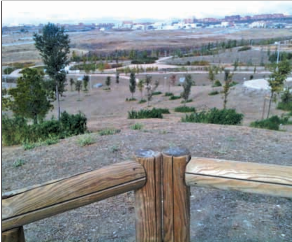
Vista del Parque de la Gavia en el Ensanche de Vallecas

Los vecinos de Vallecas acceden a la zona verde a través de un agujero en la alambrada. Todavía está pendiente la tercera fase del proyecto Pág. 6