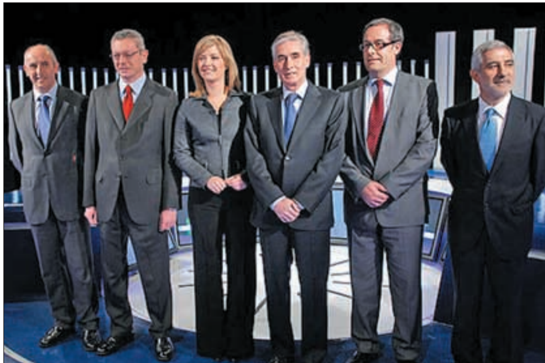
Erkoreka, Gallardón, Jáuregui, Macías y Llamazares posan antes del debate junto a la moderadora

A diferencia que Mariano Rajoy, Gallardón se mostró más preciso en cuestiones como la subida del IVA, que también rechazó. Asimismo, apostó firmemente por una "reforma fiscal que no castigue" como una de las vías claves para salir de la crisis. En cuanto a la mención de Jáuregui sobre las cuentas madrileñas, el alcalde sacó pecho y le respondió que la ciudad tiene menos paro que la media nacional y