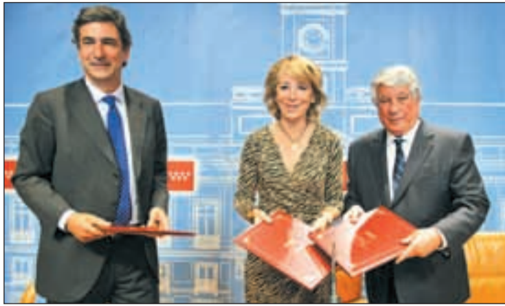
La presidenta regional presidió la firma del convenio