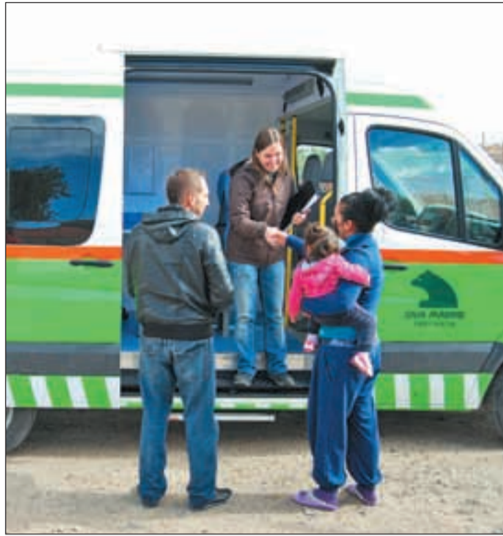
La unidad móvil de la Fundación Secretariado Gitano

FSG realizó un estudio previo donde detectó las principales problemáticas de Cañada Real.