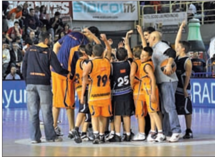
Niños en una actividad del club

Las actividades se desarrollarán en el polideportivo municipal El Arroyo entre los días 26 y 30 de diciembre, donde los chavales, por un precio de 75 euros, podrán disfrutar de entrenamientos y juegos, además de participar en competiciones organizadas para la ocasión. Los chicos contarán con la supervisión de entrenadores de la cantera del club y se les hará entrega de las