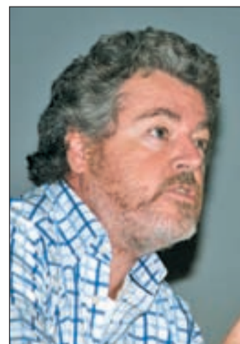
Juan López de Uralde

Entre sus propuestas principales proponen un nuevo modelo económico y energético que apueste por las renovables, el fomento de la agricultura ecológica y que impulse un turismo sostenible y responsable.