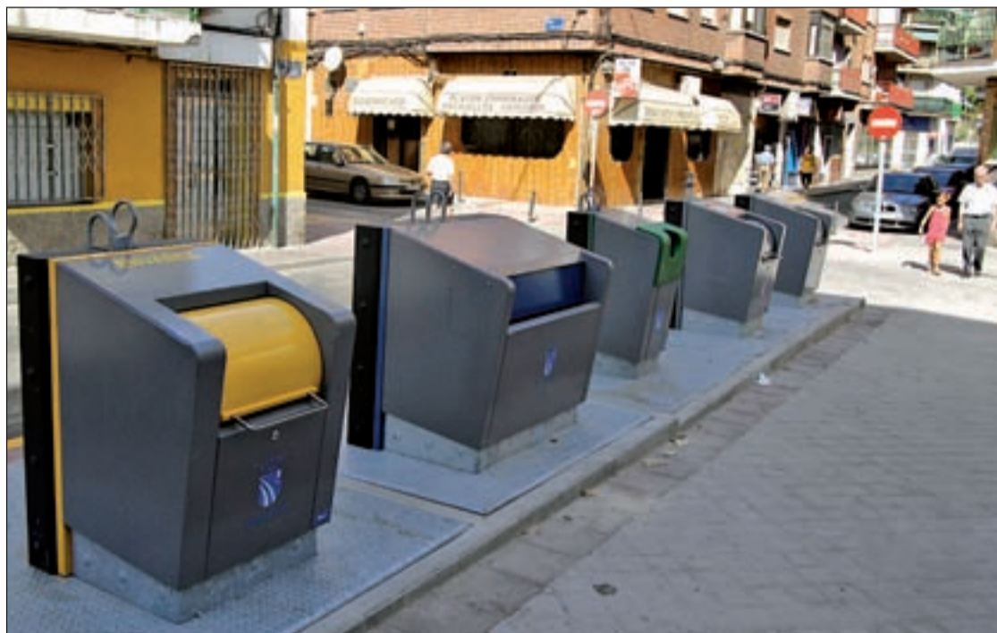
Contenedores de residuos en una calle de Fuenlabrada

Para el PP de Fuenlabrada, "los responsables municipales tienen abandonado este barrio en muchos aspectos y en este especialmente a pesar de que los vecinos tienen una alta conciencia de reciclado", lo que puede gene-