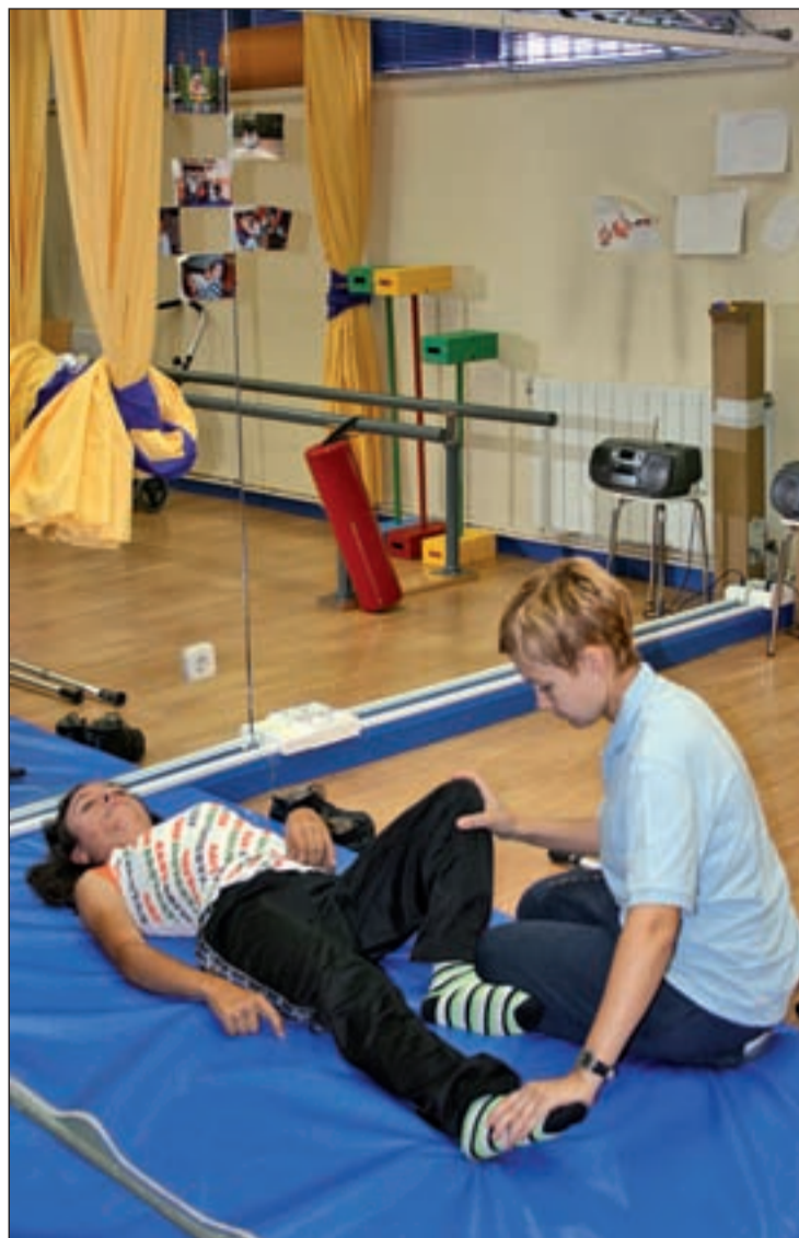
Instalaciones de ASPANDI en Fuenlabrada

ASPANDI es una asociación sin ánimo de lucro que trabaja en Fuenlabrada desde 1987, cuyo objetivo principal es la integración social y laboral de las personas con minusvalía psíquica, física o sensorial, o de cualquiera que tenga unas necesidades especiales. Además de los talleres y programas habituales que organiza la asociación para la integración del colectivo, como talleres ocupacionales, pro-