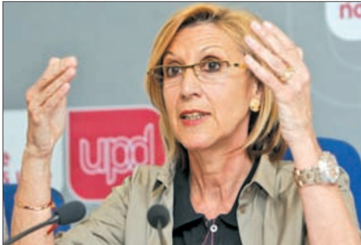
Rosa Díez apuesta por la "ciudadanía de lo común"