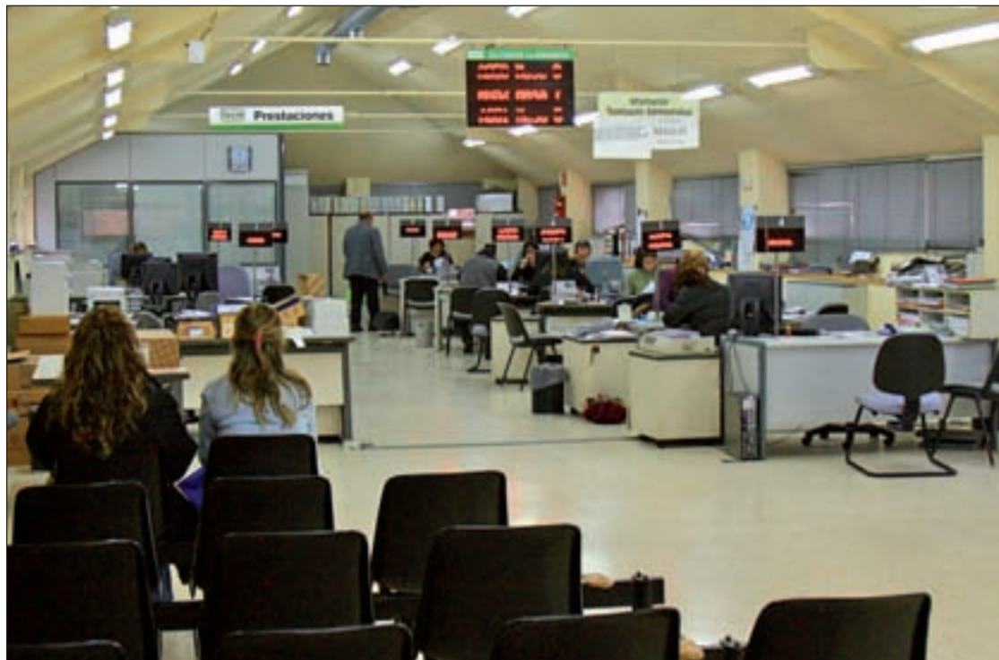
La localidad cerró el mes de octubre con 617 parados más, con respecto al mes de septiembre

Profesores, padres y alumnos de la región celebraron el pasado 17 de noviembre una nueva jornada de huelga. En este sentido, la FAPA Giner de los Ríos de Fuenlabrada y la Asamblea de Profesores de Getafe organizaron en los días previos a esta nueva protesta dos charlas-coloquio para informar sobre cuál es su situación dos meses y medio después de haberse iniciado las primeras movilizaciones en contra de los recortes de la Comunidad de Madrid, de quien critican su negativa a sentarse a negociar.