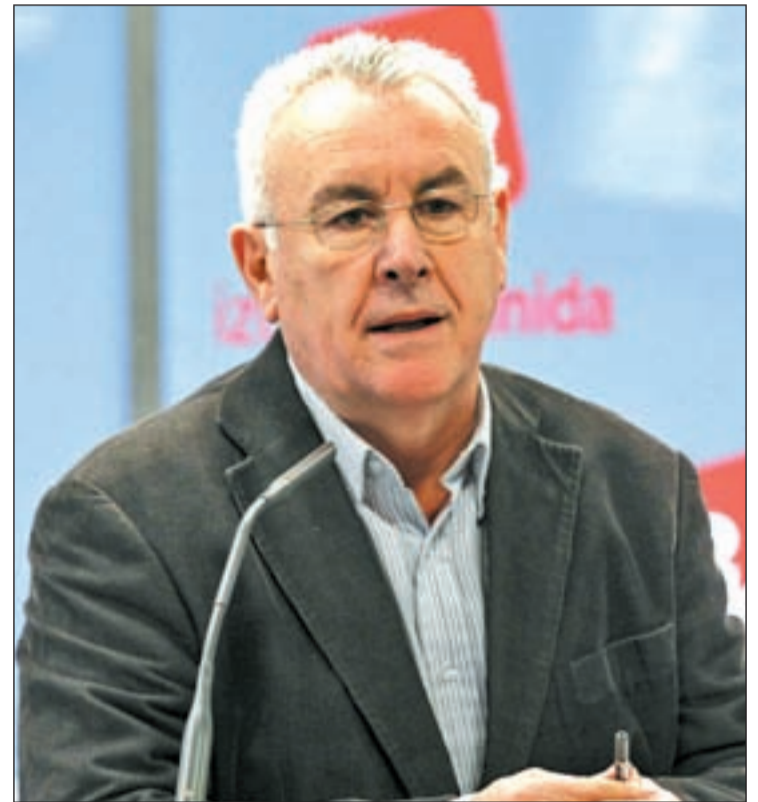
Cayo Lara, candidato de Izquierda Unida

El partido de Cayo Lara defiende una fiscalidad justa y equitativa, donde "las rentas de capital tengan los mismos impuestos que