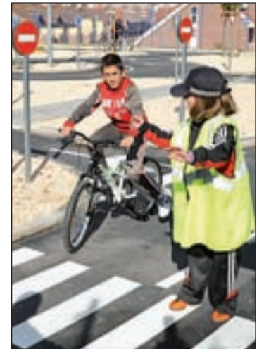
Escolares recorriendo el circuito

El centro, que está ubicado en la calle Los Arados esquina con Fuentevaqueros, reproduce una ciudad, con calles, semáforos, señales verticales y horizontales, en la que parte de los niños serán los peatones, otros los policías y el resto, los conductores. Para ello, los escolares utilizarán las bicicletas de las que dispone el centro en sus instalaciones.