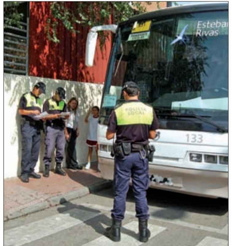
La Policía comprueba la documentación de un autobús escolar