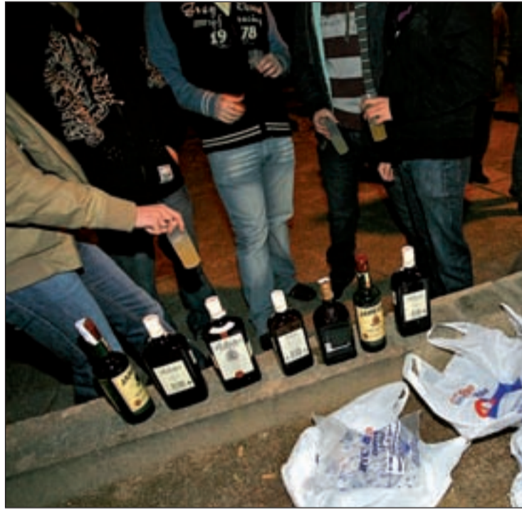
Unos jóvenes beben alcohol en la calle

Por otro lado, el 14 por ciento de los madrileños entre 15 y 64 años afirma haber consumido seis o más copas en un mismo día en el último mes. En el caso de la población escolar de la Comunidad de Madrid, el consumo de alcohol entre los adolescentes madrileños en los últimos 30 días, lo que se considera consumo habitual, es menor que la media nacional, según los últimos datos disponibles en la En-