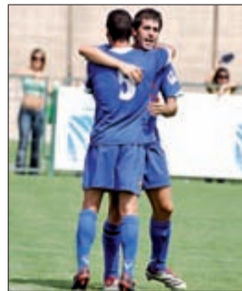
El Fuenla está en racha