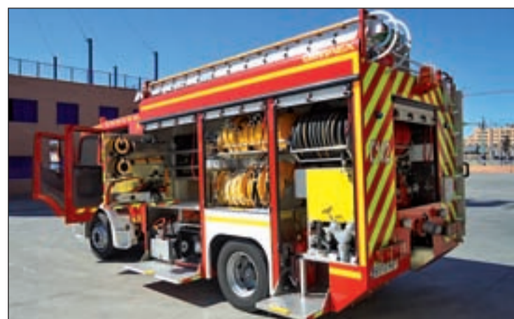
El nuevo camión de extinción en el Parque de Bomberos de la localidad

El próximo año, se incorporará a la flota otro nuevo camión. Se trata de un vehículo equipado para la intervención en desniveles, dotado de brazo telescópico de 44 metros de altura y adaptado para el rescate de personas con movilidad reducida. El Parque de Bomberos de Fuenlabrada, uno de los pocos de titularidad municipal de la región, tiene una dotación con más de 70