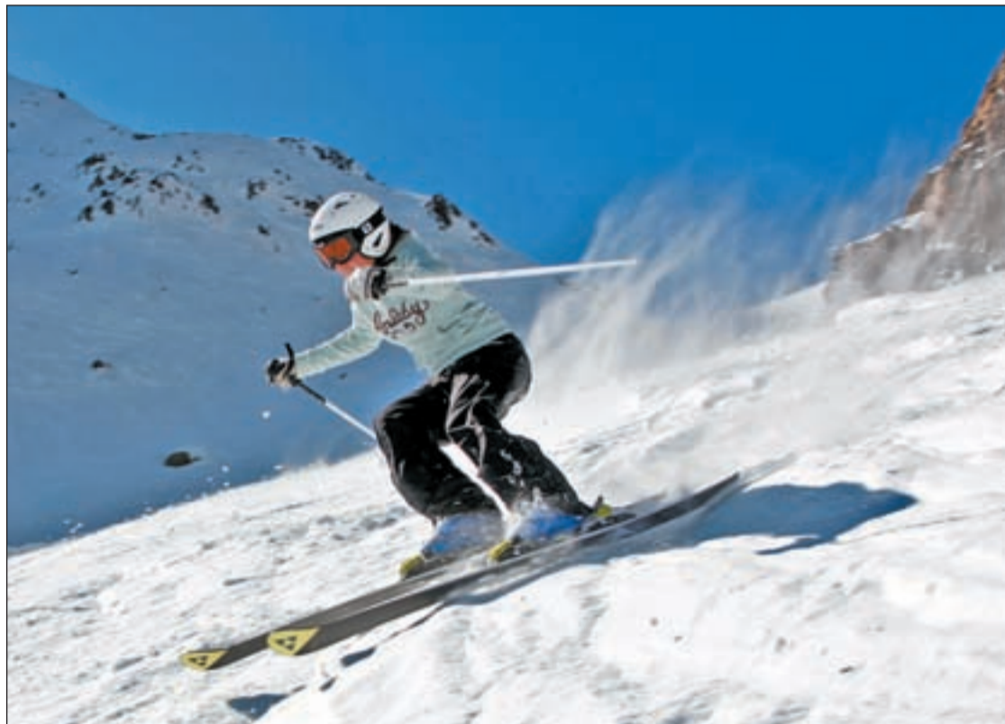
El dominio Vallnord incluye los sectores de Pal, Arinsal y Arcalís (en la foto)

Pero en Arinsal y Pal también existen zonas interesantes para experimentar y practicar el freeride dentro del dominio esquiabile. En Arinsal es posible hacerlo en la cara norte del Alt de la Capa y en Pal, en el margen de la Comellada, también de orientación norte y con zonas boscosas y pendientes pronunciadas.