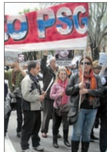
Concentración de PSG

Los afectados, convocados por UNEXCO, expresaron a través de varias pancartas la indignación y desamparo que sufren con HCC Europe, "al no querer responsabilizarse de las cantida-