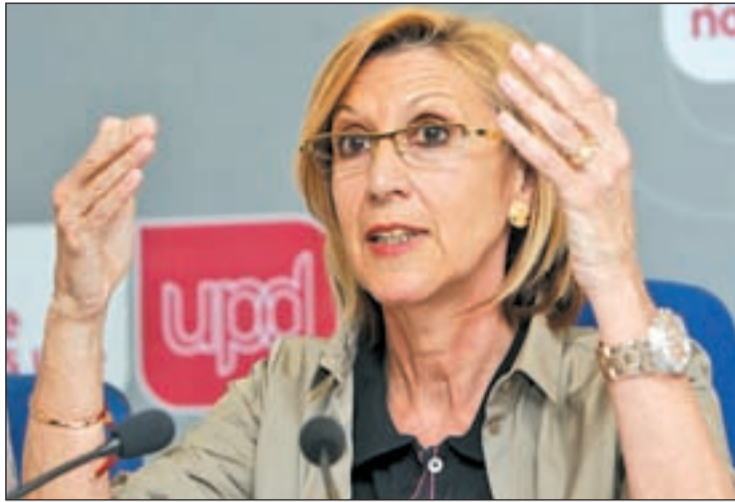
Rosa Díez apuesta por la "ciudadanía de lo común"