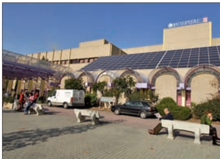
Hospital Universitario de Getafe

Los hechos ocurrieron sobre las 10 horas del día 2 de abril de 2008 en el Área de Urgencias del Hospital Universitario de Getafe. La acusada acompañó a su madre a la consulta del doctor y, una vez finalizada, la acusada "con total desprecio a las funcio-