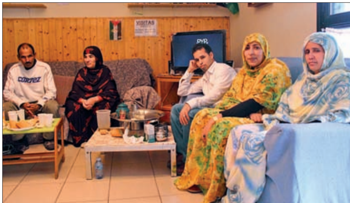
Un momento de la fiesta