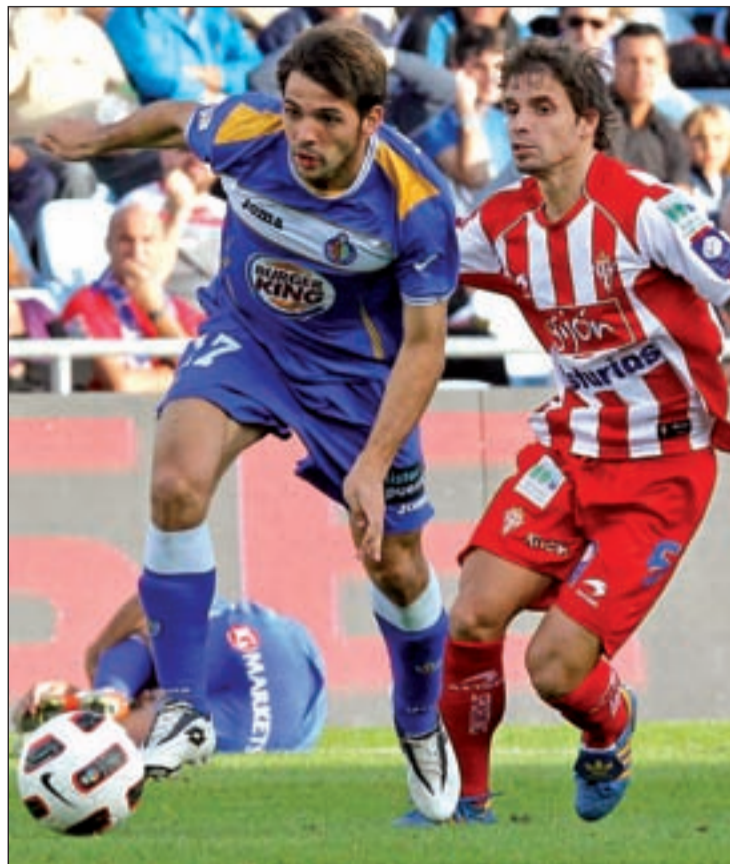
Imagen del encuentro entre ambos equipos la pasada temporada

La otra duda aparece en la línea de jugadores que actúa por detrás del delantero. En ella sue-