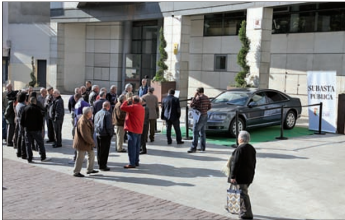
Subasta del vehículo