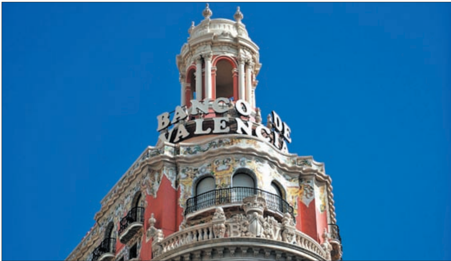
Fachada de la sede central de Banco de Valencia