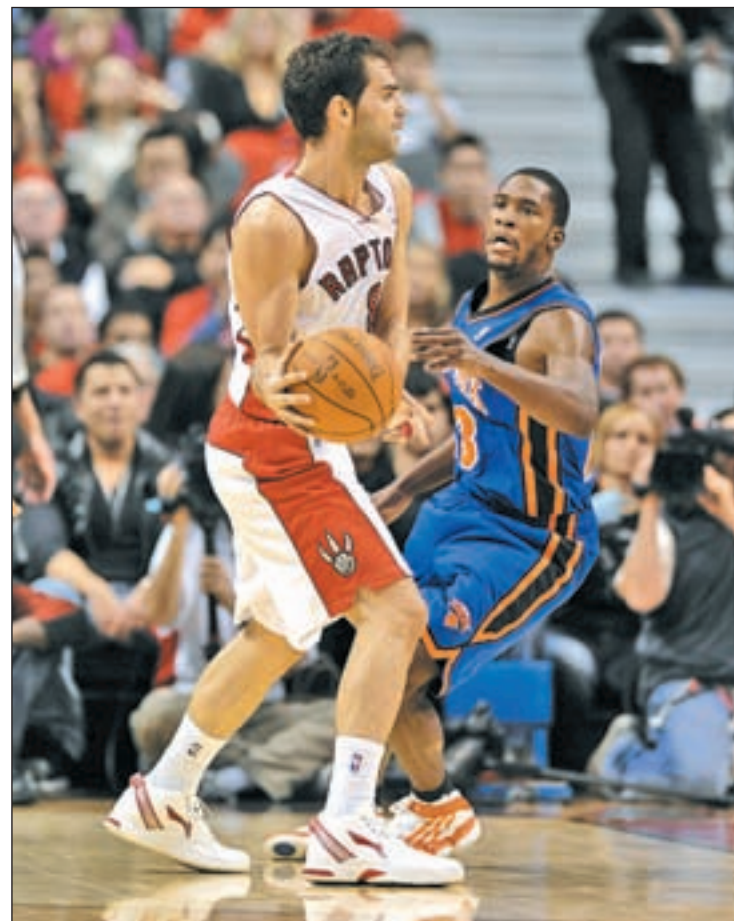
El nombre de Calderón es uno de los que suena con más fuerza

Los últimos nombres en salir a la palestra son los de Dirk Nowitzki y Paul Pierce. El jugador alemán, MVP de la última final de la NBA, ha asegurado que el "El Real Madrid es un gran club con una gran tradición. Si el interés es cierto, es algo que tendría que estudiar seriamente". Con estas declaraciones, Nowitzki deja claro que una de sus primeras preferencias en caso de descartar finalmente la opción de la NBA sería el Real Madrid, una alternativa que también ha sonado para dos habituales de la selección española como es el caso de José Manuel Calderón y Marc Gasol. Pero en el baloncesto, que parece seguir los mismos derroteros que el campeonato de Liga de fútbol, también hay que mirar al otro lado del puente aéreo. En el Barcelona se frotan las manos ante la posibilidad de volver a reunir a los hermanos Gasol para completar una plantilla que ya es muy potente. Esos mismos pasos podrían ser seguidos por uno de los últimos españoles que ha dado el salto a la NBA. Ricky Rubio ya ha manifestado su deseo de regresar al Pa-