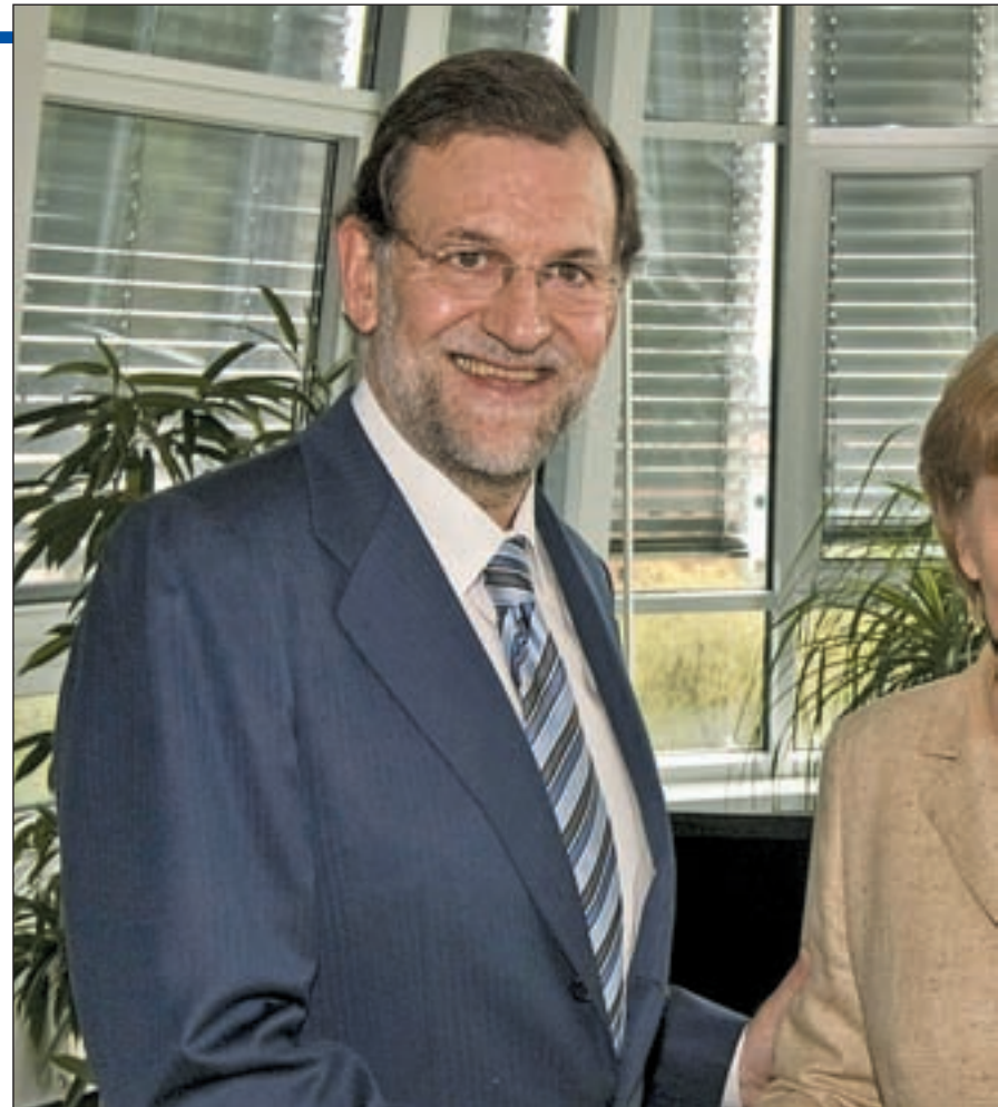
Rajoy y Merkel en una foto de archivo

Fuentes del PP han explicado que Rajoy intervendrá ante el plenario el día 8 a mediodía, unas horas antes de que los mandatarios europeos viajen a Bruselas, pues el presidente del Consejo, Herman Van Rompuy, tiene previsto convocar una reunión previa a la Cumbre europea