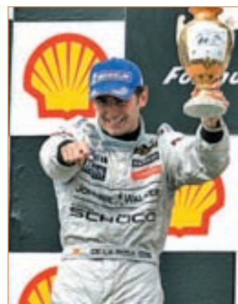
De la Rosa deja McLaren