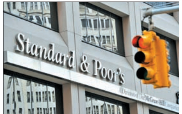
La sede de Standard & Poor's

La agencia de calificación Standard & Poor's ha mantenido la nota de 'AA-' de la solvencia española, una calificación entre el 'bien' y el 'notable', aunque la