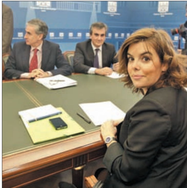
Soraya Sáenz de Santamaría y Ramón Jáuregui en su primer encuentro

El ministro de Presidencia en funciones, Ramón Jáuregui, y la portavoz del PP en el Congreso, Soraya Sáenz de Santamaría, han iniciado esta semana en el Palacio de La Moncloa las negociaciones para el traspaso de poder. Está previsto que Sáenz de Santamaría y Jáuregui mantengan varios encuentros hasta la investidura del líder del PP, Mariano Rajoy, como presidente del Gobierno. Los 'populares' quieren que el nuevo Gobierno quede constituido antes de Nochebuena, por lo que trabajarán para que la investidura se lleve a cabo "lo antes posible", confirmó