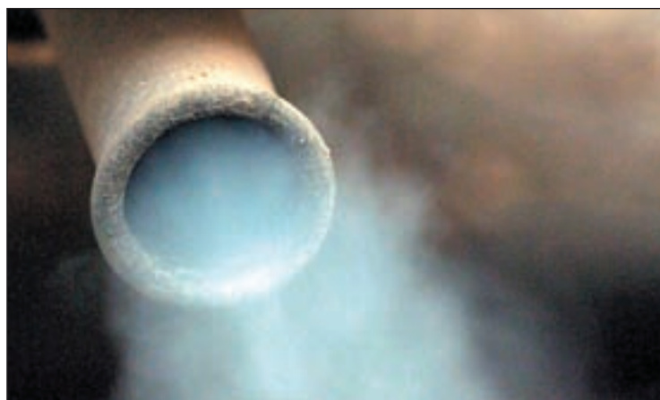
Un tubo de escape de un vehículo