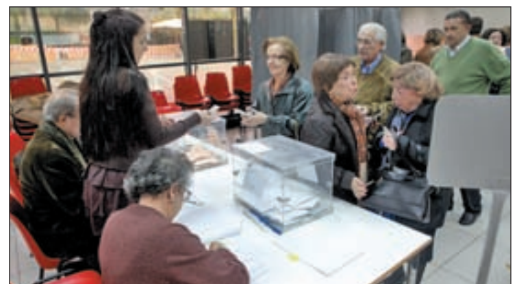
La participación en estas elecciones fue del 71,69%