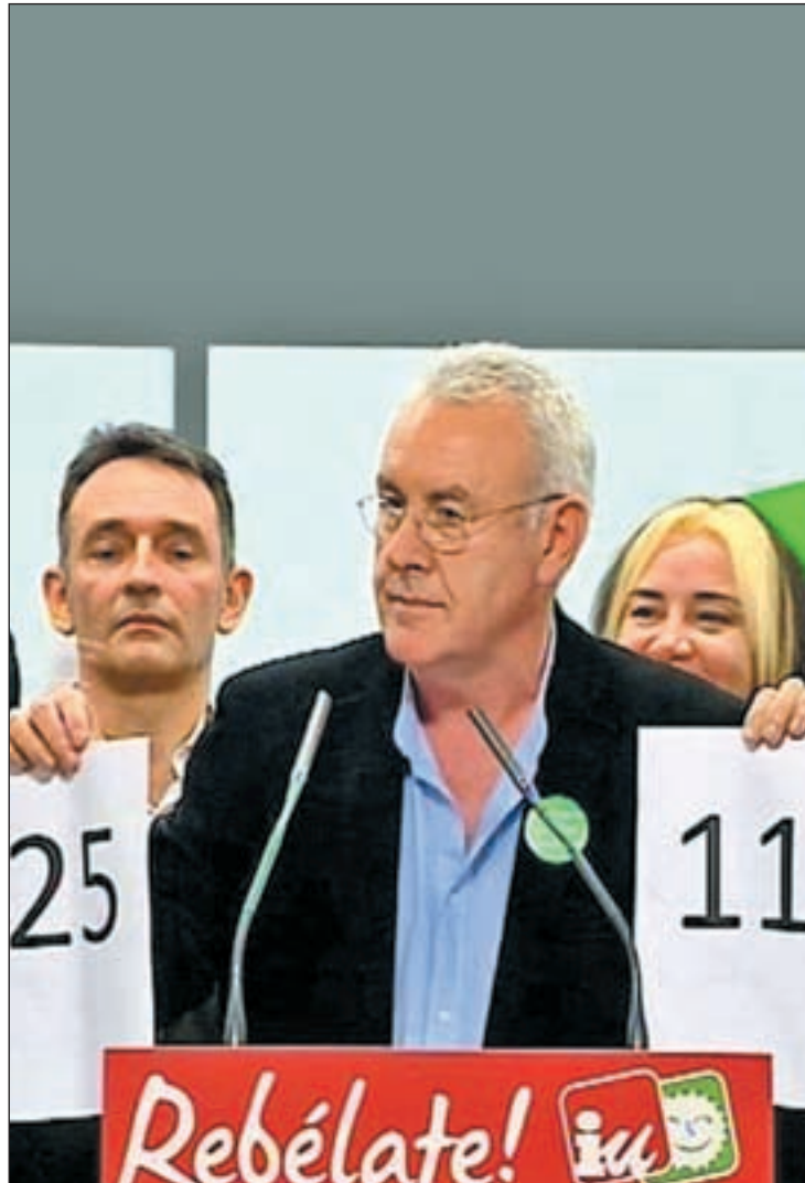
Cayo Lara denuncia la "injusticia" de la Ley D'Hont

Una de las fuerzas políticas que también se han visto beneficiadas por esta ley ha sido Amaiur, que se ha convertido en la única nueva fuerza política