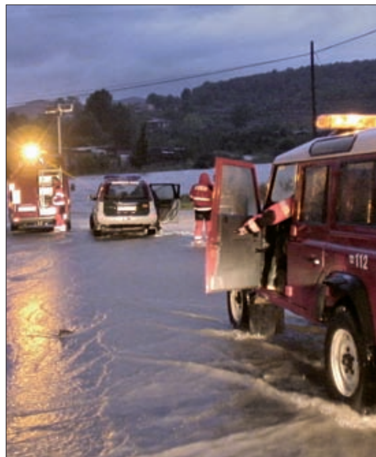
Efectos de la lluvia en Castellón