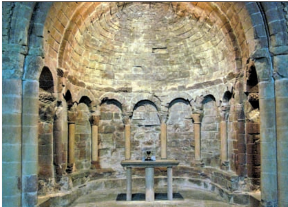
El Santo Grial de San Juan de la Peña

Uno de estos recónditos escondites del santo Grial durante siglos fue el vetusto monasterio de San Juan de la Peña cerca del pueblo de Santa Cruz de la Serós en el pie del Pirineo oscense en un boscoso paraje natural.