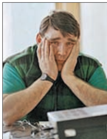
Una persona decaída

Para detectar el estado emocional del usuario, los científicos se centraron en las emociones negativas que pueden hacer que se frustré al hablar con un siste-