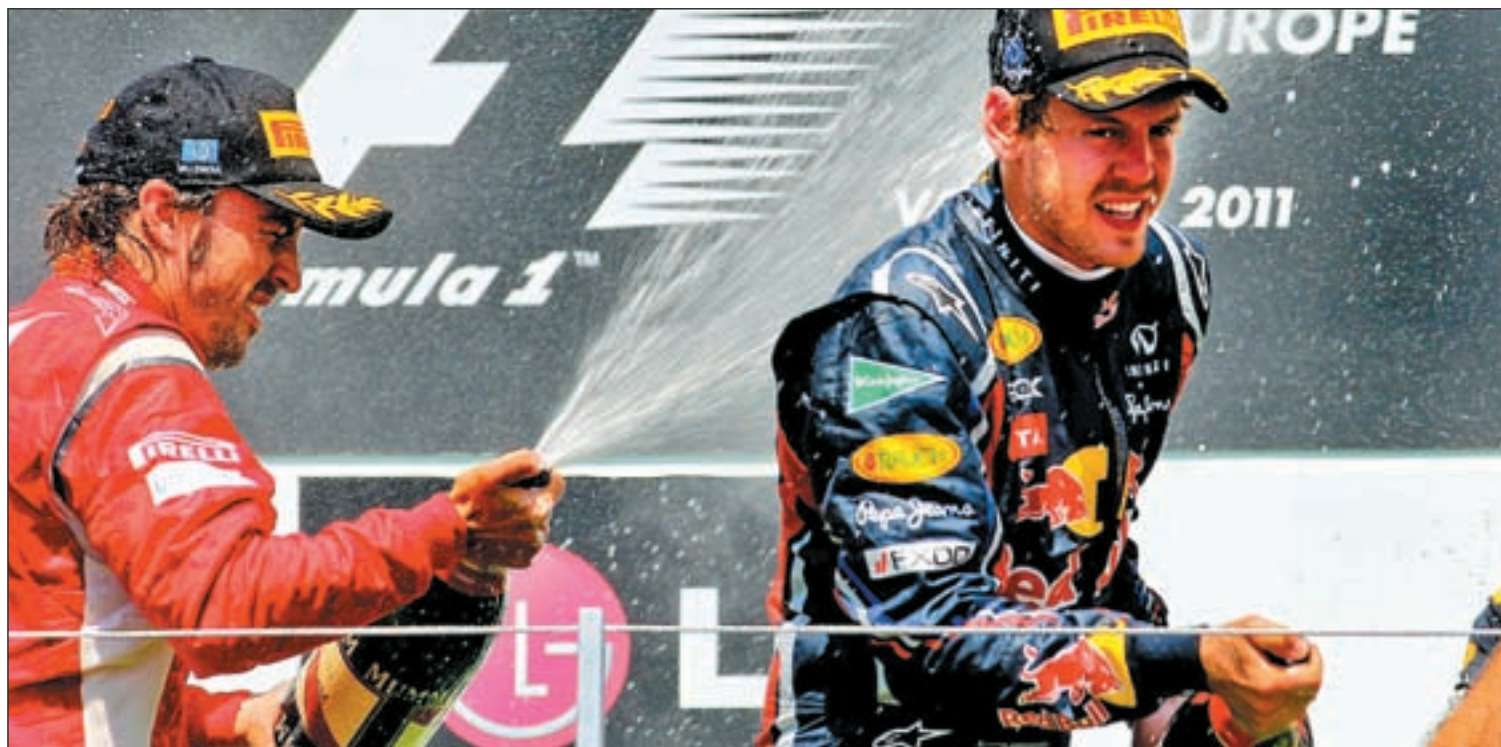
Fernando Alonso aspira a terminar la temporada con un buen sabor de boca

EL MUNDIAL DE F1 BAJA EL TELÓN ESTE DOMINGO CON POCAS INCÓGNITAS POR RESOLVER