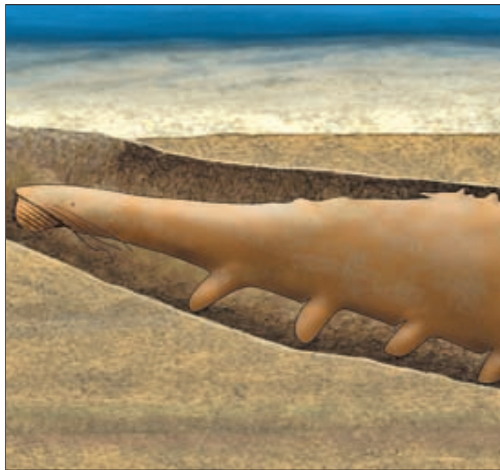
Reconstrucción del fósil descubierto en Murero (Zaragoza)

Con esta pieza única, el Museo Paleontológico de Zaragoza re-