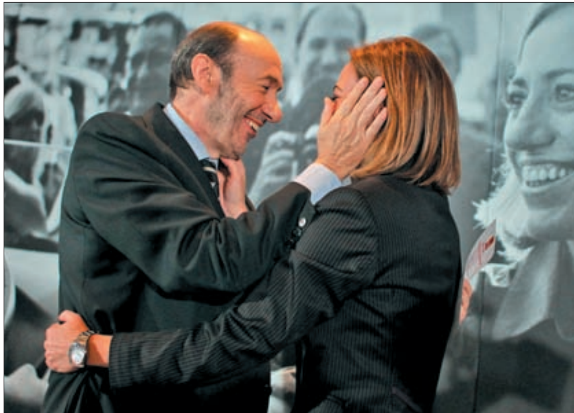
Los dos candidatos para ostentar el cargo de secretario general durante un mitin de campaña

Pero sin duda, la X a despejar en la nueva etapa que debe afrontar el PSOE reside en el nombre de la persona que sucederá a Zapatero al frente del partido. Tanto la militancia como los barones socialistas ya han empezado a hacer sus quinielas para señalar a un posible candidato a coger el timón del PSOE. Aunque de nuevo vuelve a planear la posibilidad de que el enigma sucesorio se resuelva por cooptación, tras el acuerdo previo y necesario de los secretarios generales, los afiliados reiteran su rechazo a que la designación sea por dedazo y nominal. Dos son los nombres