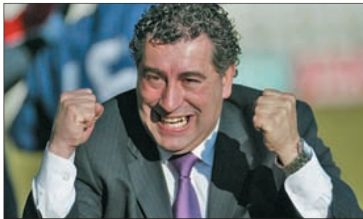
El técnico de Basauri triunfa en Congo GENTE

FÚTBOL PODRÍA RENOVAR POR OTRA TEMPORADA