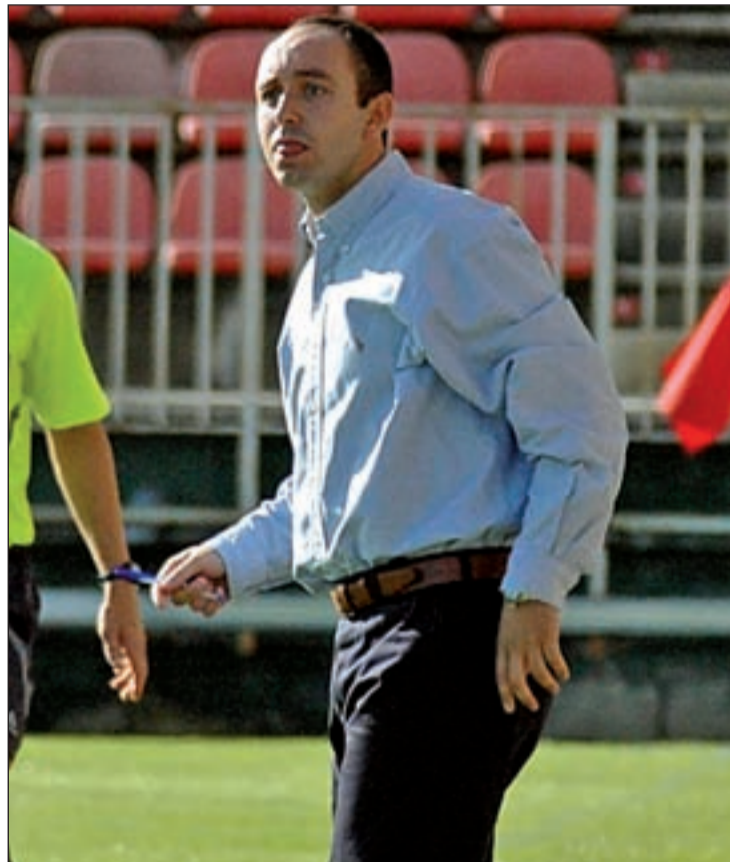
El técnico majariego se fija objetivos ambiciosos

Ajenos a los agobios del Villaviciosa y a los sueños del Rayo Majadahonda, los jugadores del Pozuelo buscan una buena racha que les asienten en la zona media e incluso que les permita mirar con optimismo a la segunda vuelta del campeonato. Tras no pasar del empate la semana pasada ante el Colmenar, los