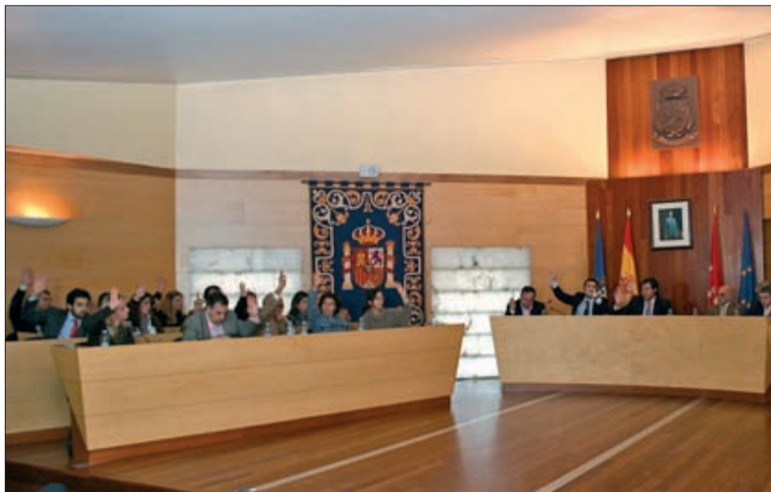
Momento de la votación de los presupuestos en el Pleno del Ayuntamiento de Las Rozas

En Majadahonda, Las Rozas y Pozuelo los presupuestos han sido estudiados con lupa por la oposición tras las sentencias del TSJM que declaraban "nulos" diversas partidas públicas de años anteriores aprobadas por gobiernos populares. En el caso de Las Rozas, el equipo liderado por el alcalde, Ignacio Fernández Rubio, ha reducido un 7,36% la cuantía final de las cuentas públicas. En concreto, según fuentes institucionales, "se contempla un gasto de 110.035.986 euros compensado por unos ingresos previstos que ascienden a 110.067.492 euros". Uno de los puntos más polémicos radica en