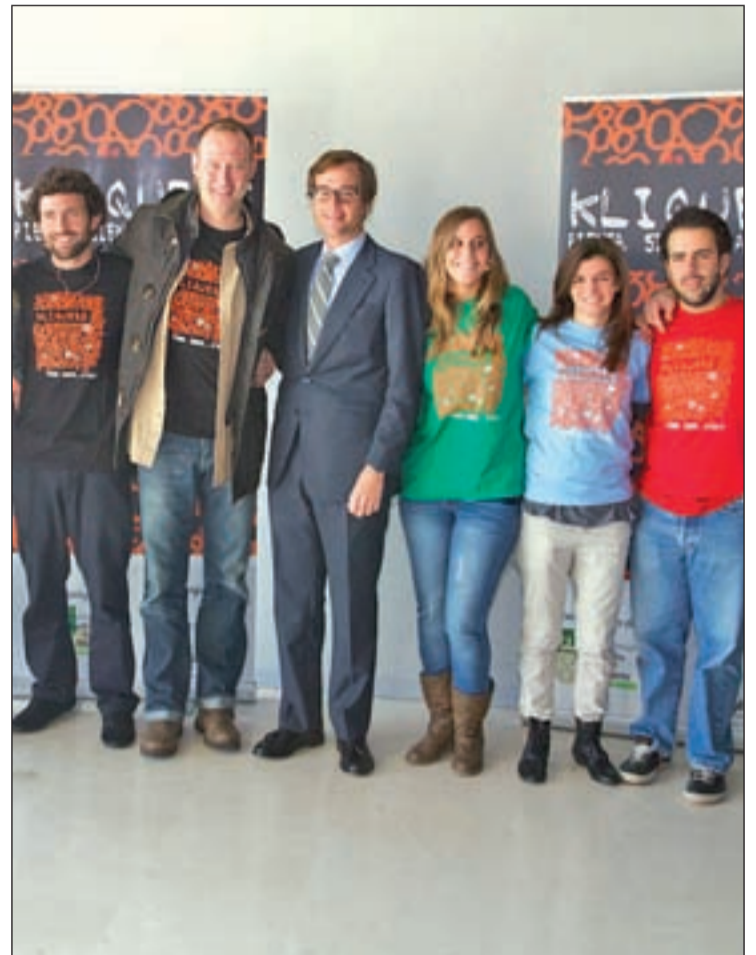
El alcalde y el campeón olímpico junto a alumnos que fueron al taller

Boadilla ha sido el escenario que ha albergado este proyecto pionero que apuesta por la educación en valores como herramienta imprescindible y clave para complementar la formación de los jóvenes: el proyecto 'Kliques'. A través de charlas, performances y otras actividades lúdico-educativas que enseñan a los adolescentes lo que de verdad importa en la vida, cerca de 400 alumnos de distintos centros educativos de Boadilla reflexionaron sobre sus comportamientos y actitudes. La empatía, el esfuerzo y la asertividad fueron los valores de base sobre los que trabajaron los jóvenes de entre 14 y 18 años del municipio.