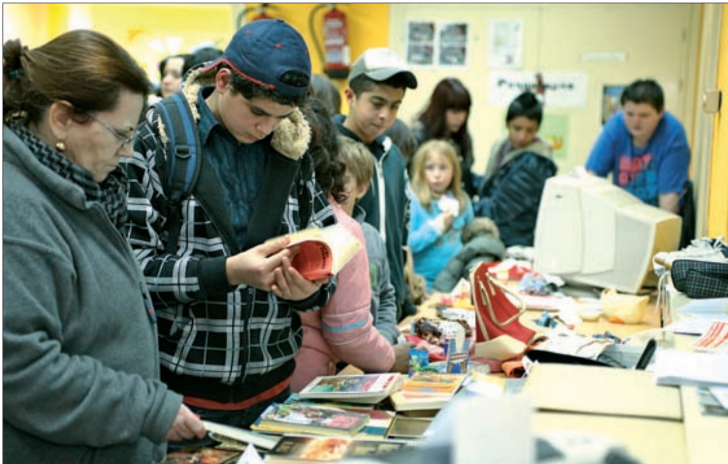
Los mercadillos de trueque o los rastrillos se erigen como una alternativa 'anticrisis' y solidaria frente a las grandes superficies