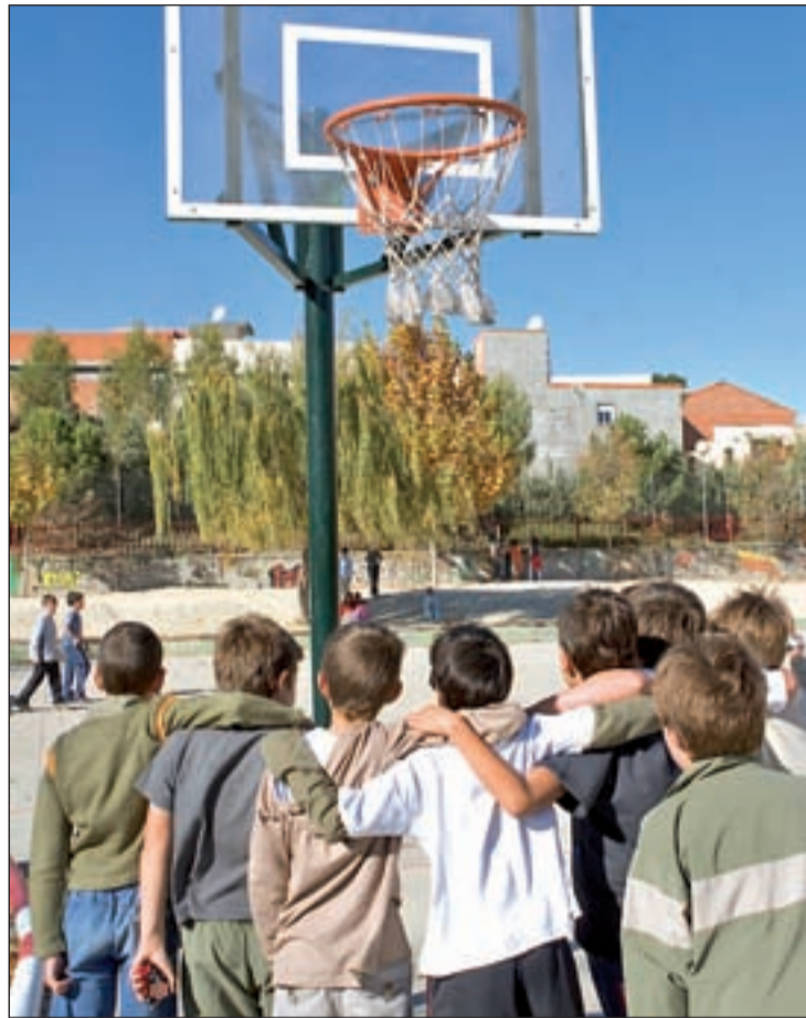
Niños durante el recreo en las instalaciones de una escuela pública

ropea, han firmado la renovación del convenio de colaboración para la continuidad del Servicio de Prevención y Atención al Acoso Escolar (SERPAE) que se desarrolla en Pozuelo. Este servicio, que comenzó su actividad en el año 2008, tiene como finalidad la prevención, orientación y actuación directa ante cualquier dificultad de convivencia escolar y posibles situaciones de acoso dentro de las aulas de cualquier