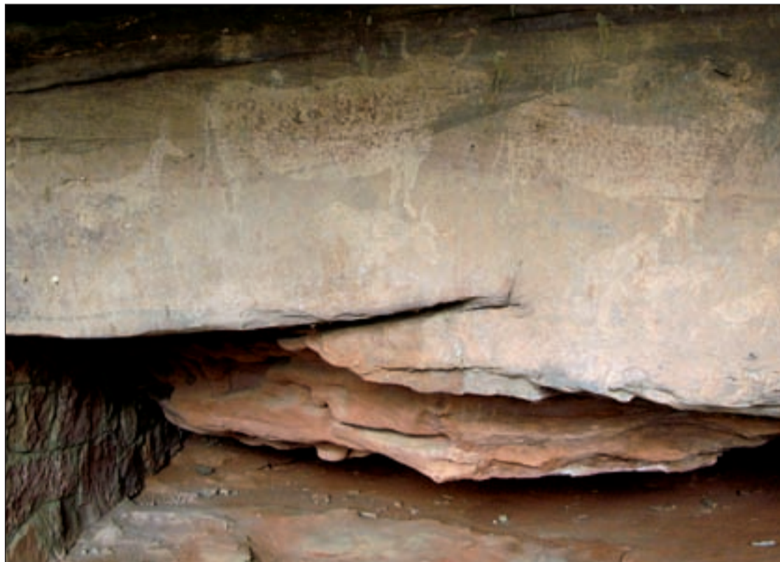
Muestras de arte rupestre en el Pinar de Rodeno

Generalmente para observar pinturas o grabados rupestres tenemos que adentrarnos en un hábitat natural, seguramente intrincado y complejo en el que están presentes el agua, la roca,