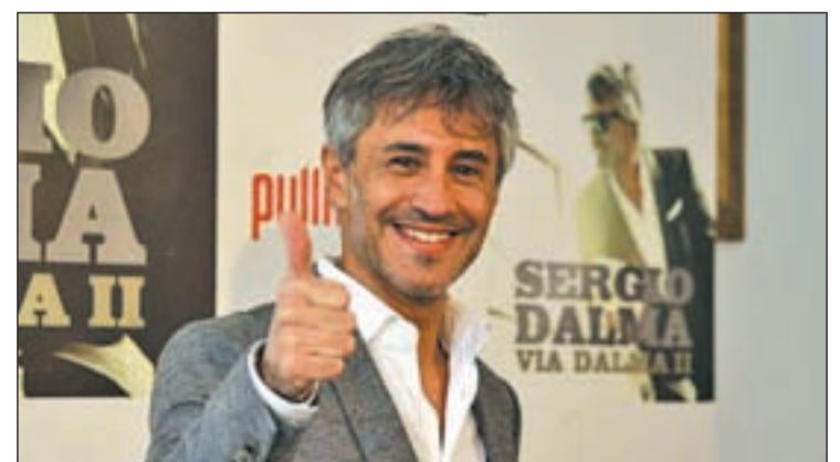
El artista catalán asegura estar en manos del público

más cercanos en el tiempo como 'Senza a una Donna' de Zucchero, 'La Fuerza de la Vida' de Paolo Vallesi, 'Te Enamorarás' de Marco Massini o 'La Cosa Más Bella' de Eros Ramazzotti. "No sé si habrá una tercera parte, pero en esto al final es el público el que tiene la última palabra", asegura el cantante.