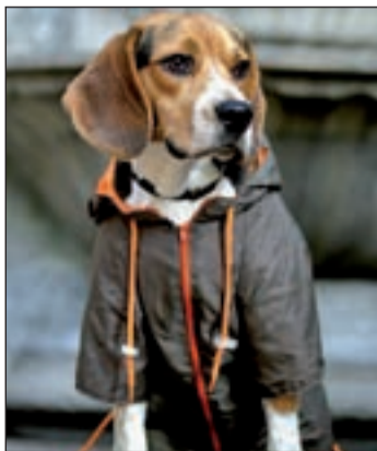
La ropa de mascotas está de moda

Y, por último, aunque un poco más arriesgado, el print animal (estampados animales) está en pleno auge este invierno entre las mujeres.