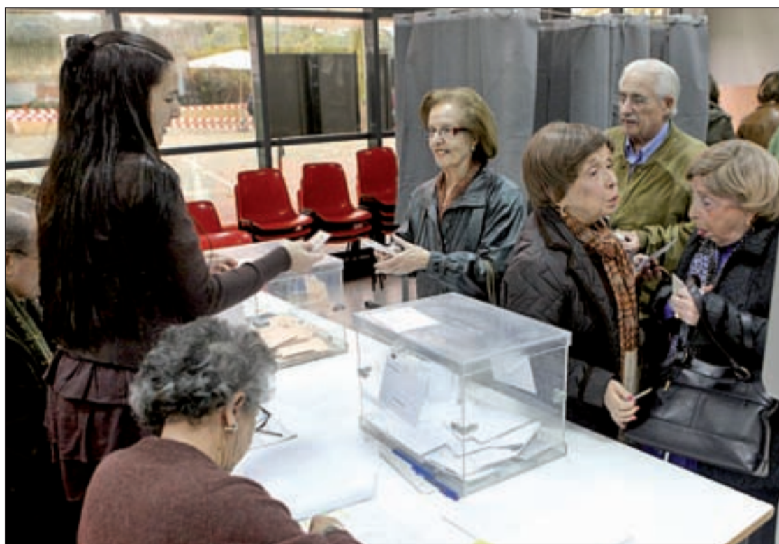
Madrileños ejercen su derecho al voto

Los criterios son los que se han dividido las circunscripciones son de carácter geográfico y socioeconómico, si bien se ha intentado que estén en torno a 150.000 habitantes. De las 43 circunscripciones, 19 pertenecen a Madrid capital y el resto están