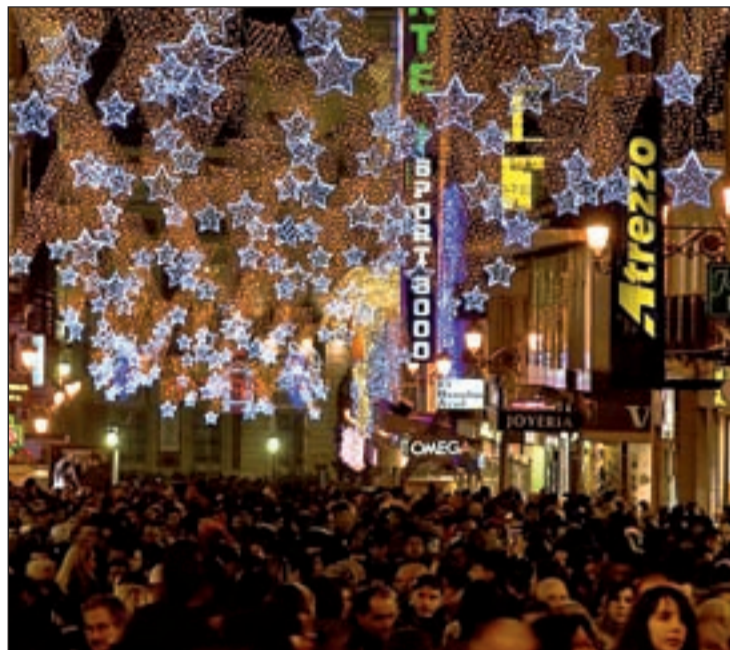
Las calles se llenan estos días de personas comprando

Los productos más regalados serán perfumes y cosméticos, se-