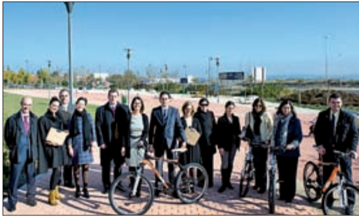
La comitiva que inauguró el Parque Canadá

EL PARQUE TIENE CERCA DE UNA HECTÁREA DE SUPERFICIE