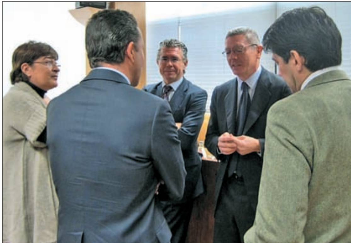
Alberto Ruiz-Gallardón, en su comparecencia en la comisión de duplicidades

Frente a eso, el regidor madrileño consideró que deben quedar en manos del Gobierno autonómico los centros residenciales, "porque tienen un impacto supramunicipal"; las escuelas infantiles, al tener la Comunidad las competencias en educación; y la atención sanitaria y a drogodependientes, excepto en prevención. "Todos los servicios de Atención Primaria o Especializada, todos, deben integrarse en el servicio autonómico. Para esto no hace falta ninguna modificación legal. Pero los ayuntamientos deberían mantener la prevención en materias de salud en todos los ámbitos, transfiriendo