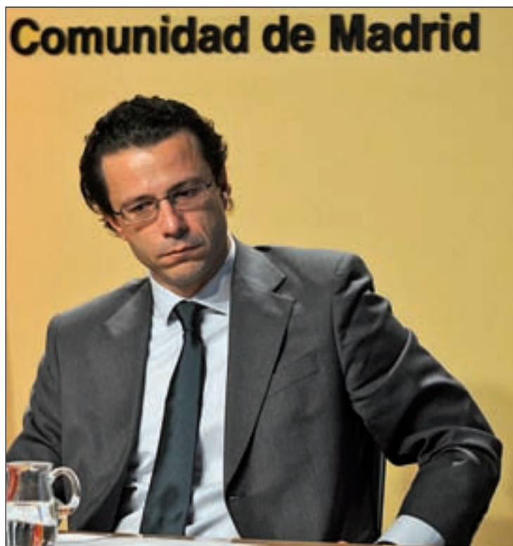
Javier Fernández Lasquetty, en un Consejo de Gobierno

También se continuará con la "implantación progresiva" de la Factura Sanitaria Informativa, que con medio millón de euros de presupuesto, se empezará a enviar por correo ordinario a