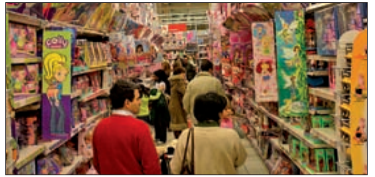
Los juguetes son los protagonistas de las cartas a los Reyes y Papá Noel

ra y de antes. Por eso, El Corte Inglés de Las Barriguitas (29,95 euros) seguro que les encanta. Otra opción es la edición de juguetes Carrera, del piloto asturiano Fernando Alonso que cuenta con pistas, coches o cuentavueeltas. Y por último, este 2011 han resultado muy deseadas las terroríficas -a la par que adorables- Monster High, con un precio de 19,99 euros cada muñeca o 39,99 euros la pareja.