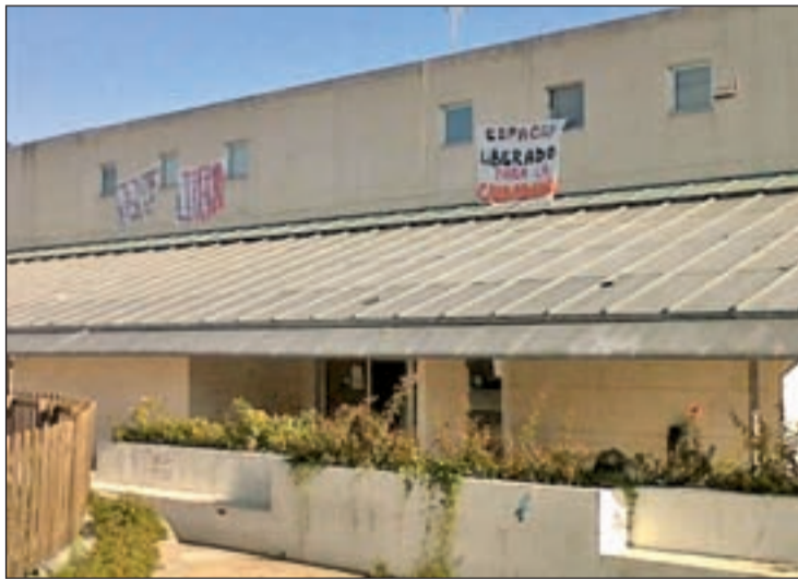
Los okupas han programado diversas actividades sociales en el centro

La razón de "liberar este edificio público" responde a "la negativa constante del Ayuntamiento de