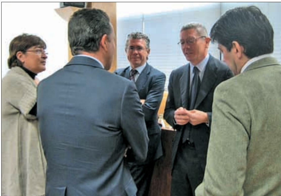
Alberto Ruiz-Gallardón, en su comparecencia en la comisión de duplicidades

Frente a eso, el regidor madrileño consideró que deben quedar en manos del Gobierno autonómico los centros residenciales, "porque tienen un impacto supramunicipal"; las escuelas infantiles, al tener la Comunidad las competencias en educación; y la atención sanitaria y a drogodependientes, excepto en prevención. "Todos los servicios de Atención Primaria o Especializada, todos, deben integrarse en el servicio autonómico. Para esto no hace falta ninguna modificación legal. Pero los ayuntamientos deberían mantener la prevención en materias de salud en todos los ámbitos, transfiriendo