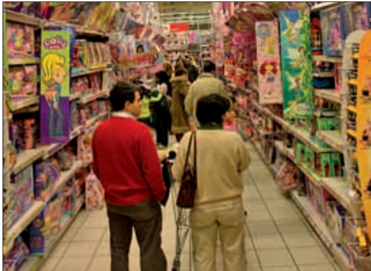
Los juguetes son los protagonistas de las cartas a los Reyes y Papá Noel

Una buena opción son los juguetes educativos. Con ellos el niño aprende a la par que disfruta. Un buen ejemplo de ellos es la línea Fluff, compuesta por cuatro muñecos que ayudan a los niños a superar inseguridades o ansiedad durante sus primeros años. Cada uno de ellos (Gamberro, Culito Rana, Edredón y Colchón) va acompañado