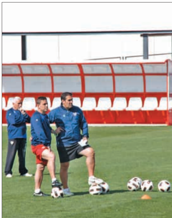
Sandoval espera que su equipo saque algo positivo

Por su parte, el Atlético de Madrid llega al que será su segundo derbi en una semana con varias secuelas del encuentro del Santiago Bernabéu. A la derrota frente a sus vecinos blancos se suman las sanciones a dos de los jugadores con más peso en la parcela defensiva, como es el caso del guardameta Courtois y del central uruguayo Godín. Esto provocará que Gregorio Manzano deba introducir cambios en