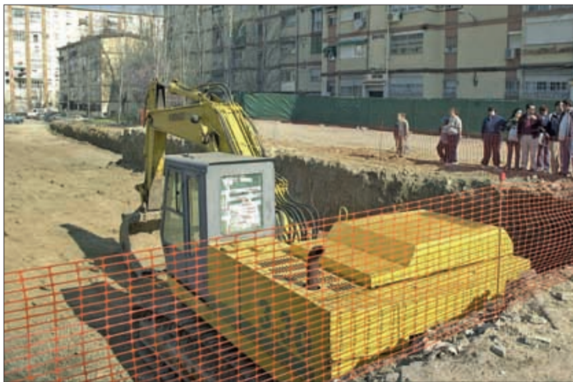
San Cristóbal de los Ángeles es el barrio más al Sur de la ciudad de Madrid

Referente a la urbanización y a las infraestructuras del barrio, se han renovado las redes de alumbrado público, saneamiento y riego, actualizándose las de gas, energía eléctrica y abastecimiento de agua. Asimismo, en lo que se refiere al espacio público, se han mejorado 90.000 metros cuadrados de calzadas y 177.000 de aceras, ajardinándose 29.000 de zonas terrazas, donde se han