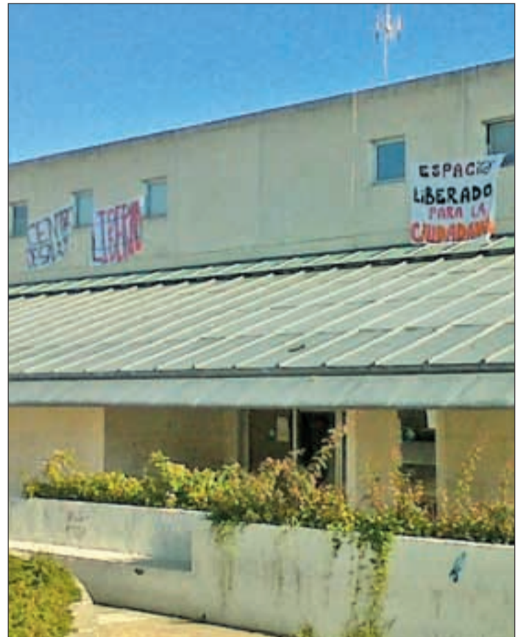
Carteles de los okupas desplegados en el centro de salud

La razón de "liberar este edificio público" responde a "la negativa constante del Ayuntamiento que ha denegado el uso de otros espacios públicos municipales, como las plazas, para hacer actividades informativas, sociales o asambleas", alegan desde este colectivo. Por ello, "tras agotar todas las vías" han optado por okupar este "espacio abierto para la ciudadanía". Asimismo, han denunciado que en esta superficie, ubicada sobre una vía pecuaria protegida por la ley "y que prohíbe la construcción con fi-