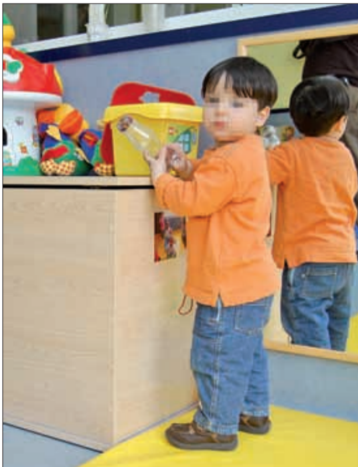
La futura escuela infantil de Butarque tiene presupuesto en 2012

Respecto al conjunto del distrito, dicen que en Villaverde la caída del presupuesto es de un 4,84 por ciento al quedarse en 29,3 millones de euros. "Esto se notará especialmente en las actividades extraescolares, con un 8,8 por ciento menos, las actividades culturales, que pierden un