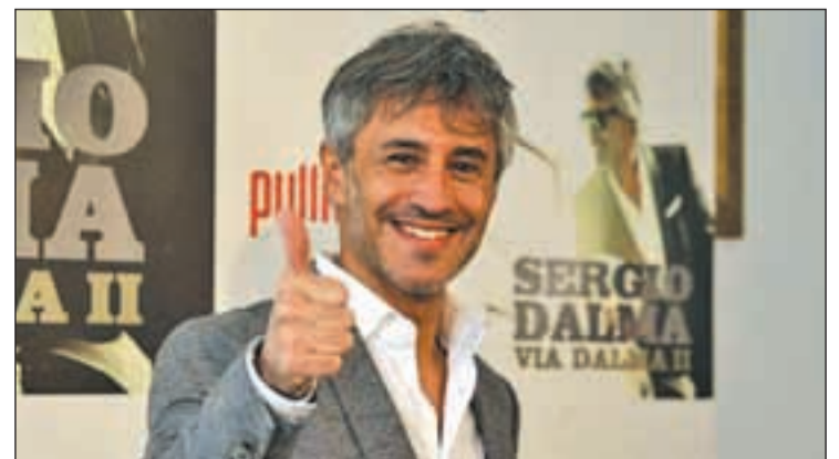
El artista catalán asegura estar en manos del público

más cercanos en el tiempo como 'Senza a una Donna' de Zucchero, 'La Fuerza de la Vida' de Paolo Vallesi, 'Te Enamorarás' de Marco Massini o 'La Cosa Más Bella' de Eros Ramazzotti. "No sé si habrá una tercera parte, pero en esto al final es el público el que tiene la última palabra", asegura el cantante.