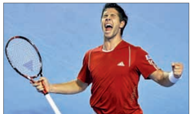
El madrileño vuelve a verse las caras con Argentina

Ese éxito tan importante serviría para poner un final alegre a una temporada en la que la irregularidad ha acompañado al jugador que creciera de la mano del Club de Tenis Chamartín.