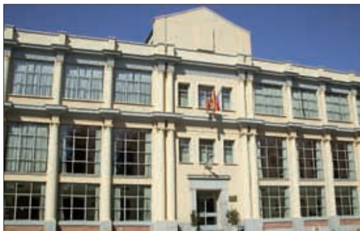
La Finca de Vista Alegre, en el corazón del distrito de Carabanchel