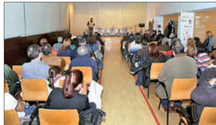
Un momento de la ceremonia de clausura