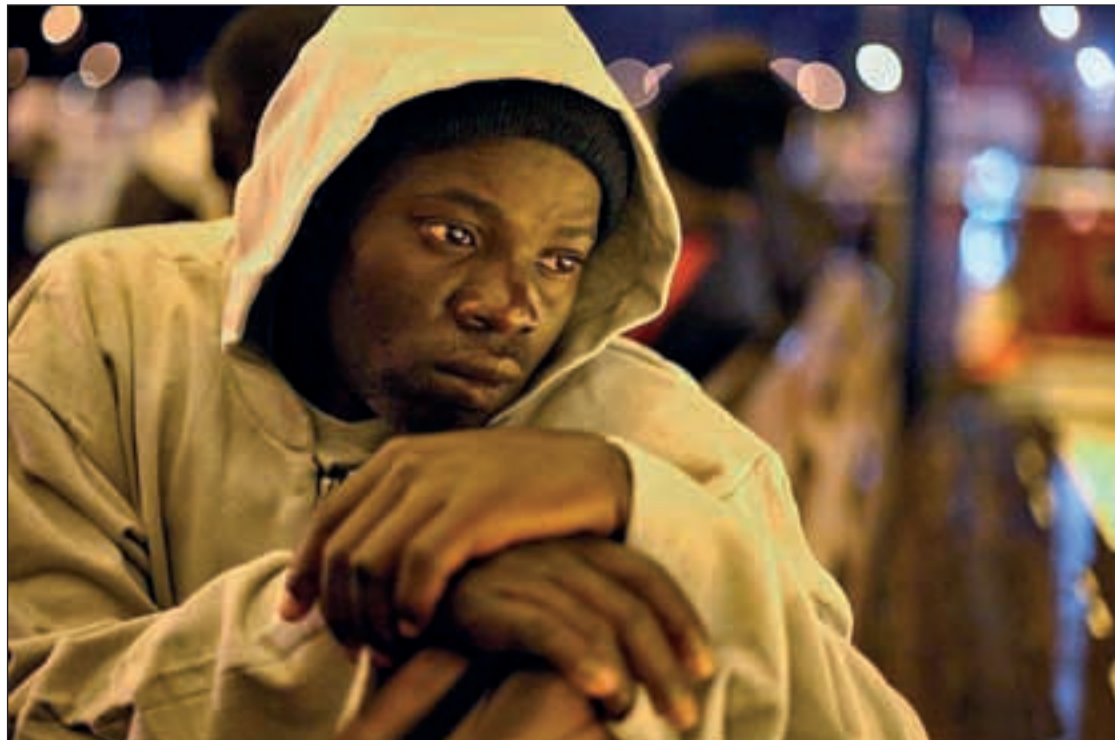
Usara es el segundo distrito en población inmigrante de la capital

Este nuevo "espacio liberado" supone la cuarta 'okupación' en la ciudad de Madrid en el último mes, tras las acciones que tuvieron lugar en la calle Concepción Jerónima, en Corredera Baja de San Pablo y la calle Carretas.