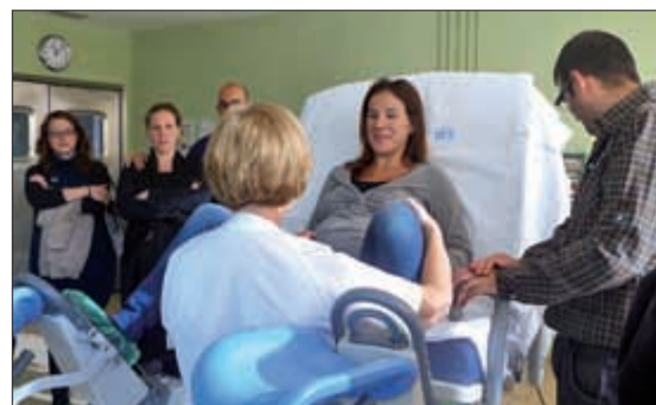
Una mujer embarazada en un momento de la visita guiada

Las mujeres en cinta que deseen asistir pueden hacerlo cualquier jueves de 10 a 12 horas, excepto el primero de cada mes, cuyo horario es de 16 a 18 horas. Una vez en el hospital, son recibidas por una matrona, quien les explica el programa de