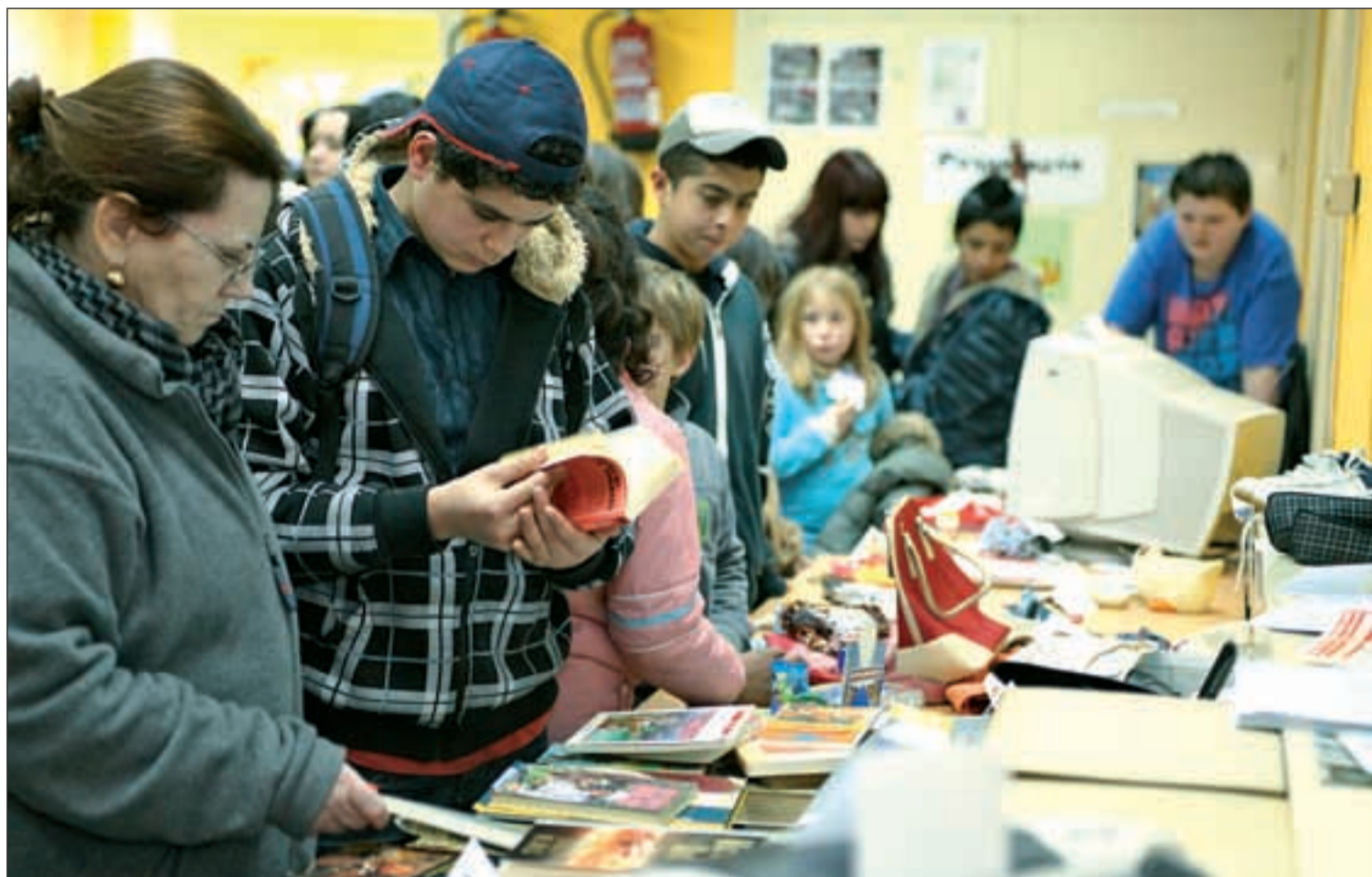
Los mercadillos de trueque o los rastrillos se erigen como una alternativa 'anticrisis' y solidaria frente a las grandes superficies