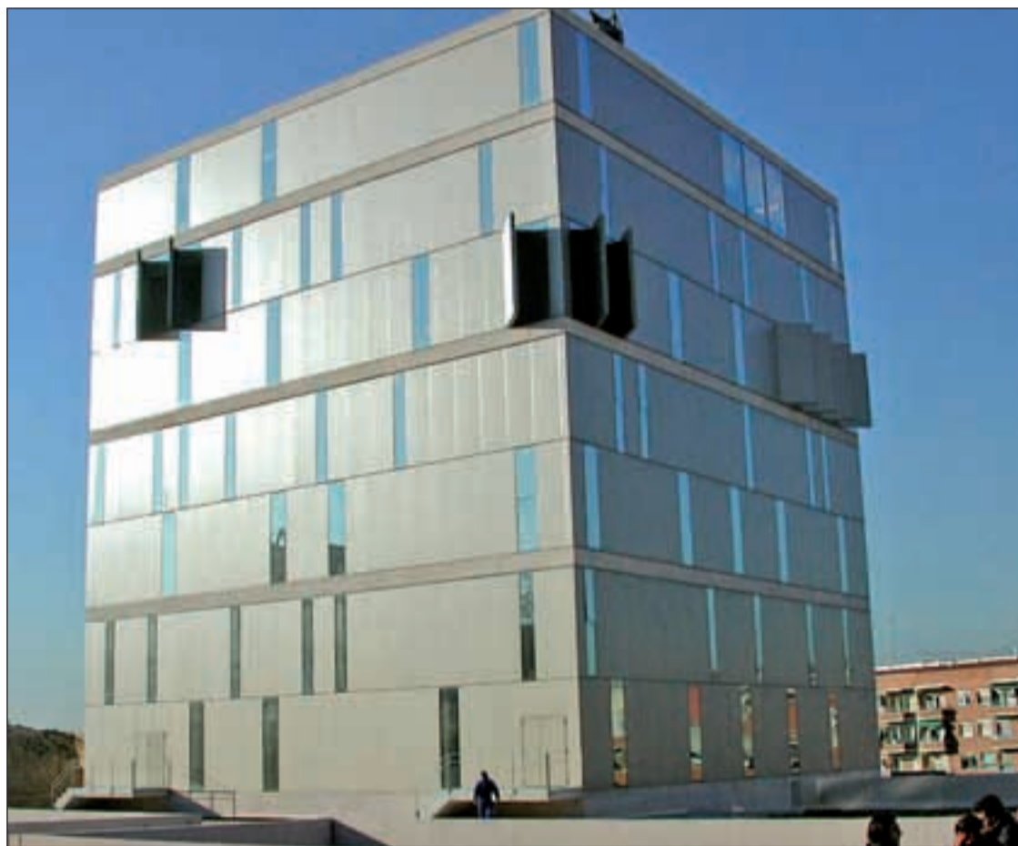
Fachada de la biblioteca José Hierro del distrito de Usera

Critican la existencia de graves problemas en la cubierta de la biblioteca de Usera. La Comunidad ya cuenta con un proyecto para arreglarla Pág. 5