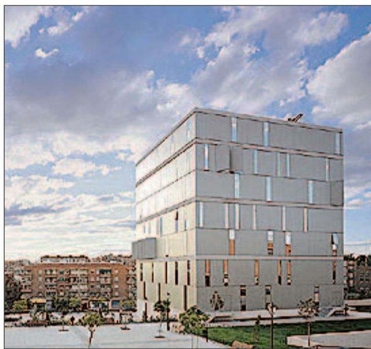
La biblioteca José Hierro, propiedad de la Comunidad de Madrid

"La situación es complicada y el problema va para largo, ya que