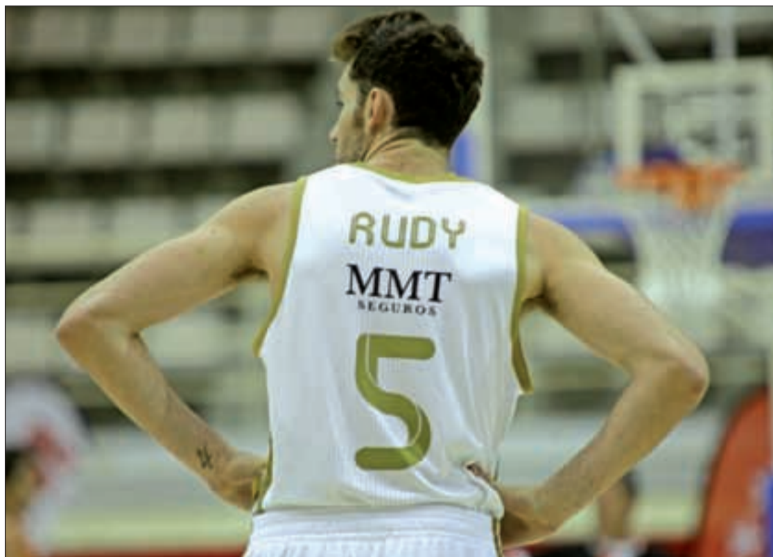
La aventura de Rudy en el Real Madrid ha llegado a su fin, al menos de momento

El final del cierre patronal en la NBA hará que tanto Ibaka como Rudy jueguen previsiblemente