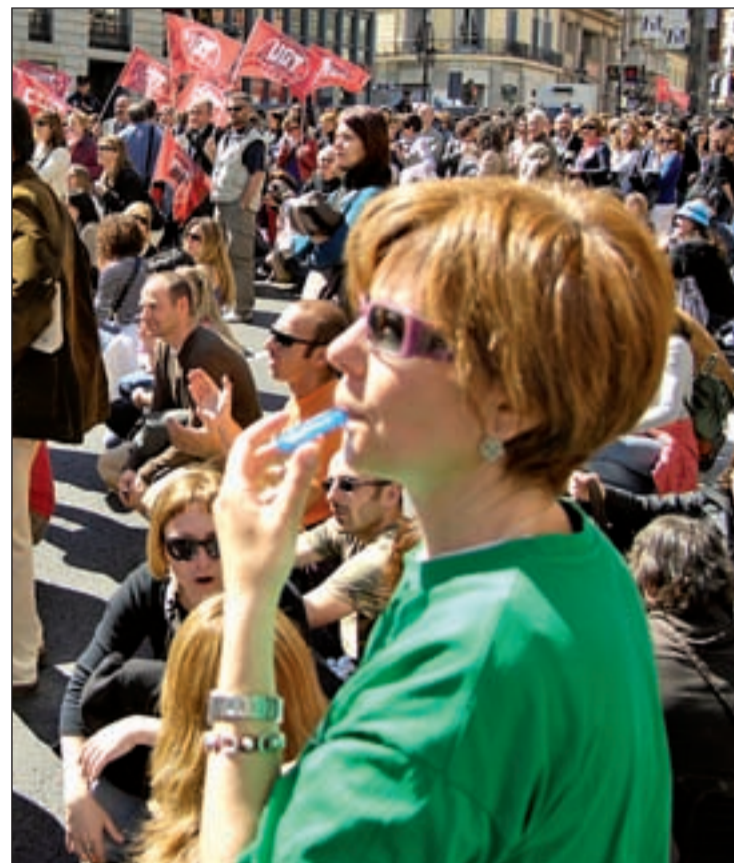
La marea verde

Asimismo, criticaron que este conflicto "parece irresoluble" por "la negativa al necesario diálogo entre las partes y su rechazo a la búsqueda de soluciones consensuadas en defensa del bien común de la ciudadanía, y muy especialmente de los intereses y futuro del alumnado", según reza el 'Manifiesto por el