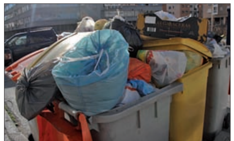
Los vecinos piden la retirada de la tasa de basura

Los escritos, por otro lado, abordan el impuesto sobre el Incremento del Valor de los Terrenos de Naturaleza Urbana, conocido como plusvalía, que se incrementará “de media un 70 por ciento” también por la revisión de los valores catastrales, que ha