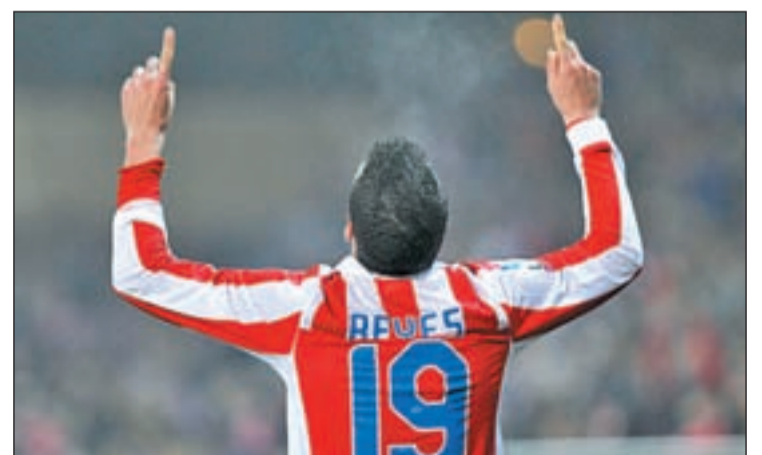
Reyes está siendo protagonista en las últimas jornadas

Por su parte, Mauricio Pochettino espera que sus jugadores se recuperen del golpe anímico que supuso perder dos puntos en Mestalla a pesar de haber ofrecido una buena imagen ante el Valencia. Romaric podría regresar a la lista de convocados una vez que parecen resueltas sus desavenencias con el técnico perico. El centrocampista africano podría suplir la baja de Javi Márquez, tras confirmar-