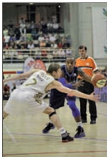
El Estu busca su cuarto triunfo

Ese buen momento contrasta con la situación que vive el conjunto colegial. La derrota de la semana pasada en el Palacio de los Deportes ante el Unicaja podría entrar en el capítulo de probabilidades, ya que el conjunto malagueño se ha fijado unos objetivos mayores a causa del po-