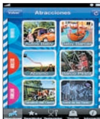
Parques de Atracciones de Madrid