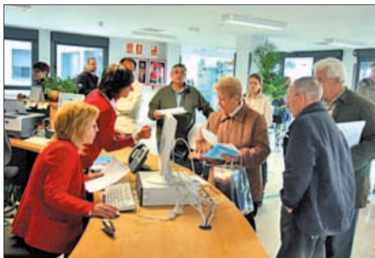
Un centro de salud

Por otro lado, el número de denegaciones para cambiar de profesional ascendió a los 10.286, lo que supone el 1,79 por ciento de las citas. Las razones, entre otras, se han debido principalmente a la salvaguarda de