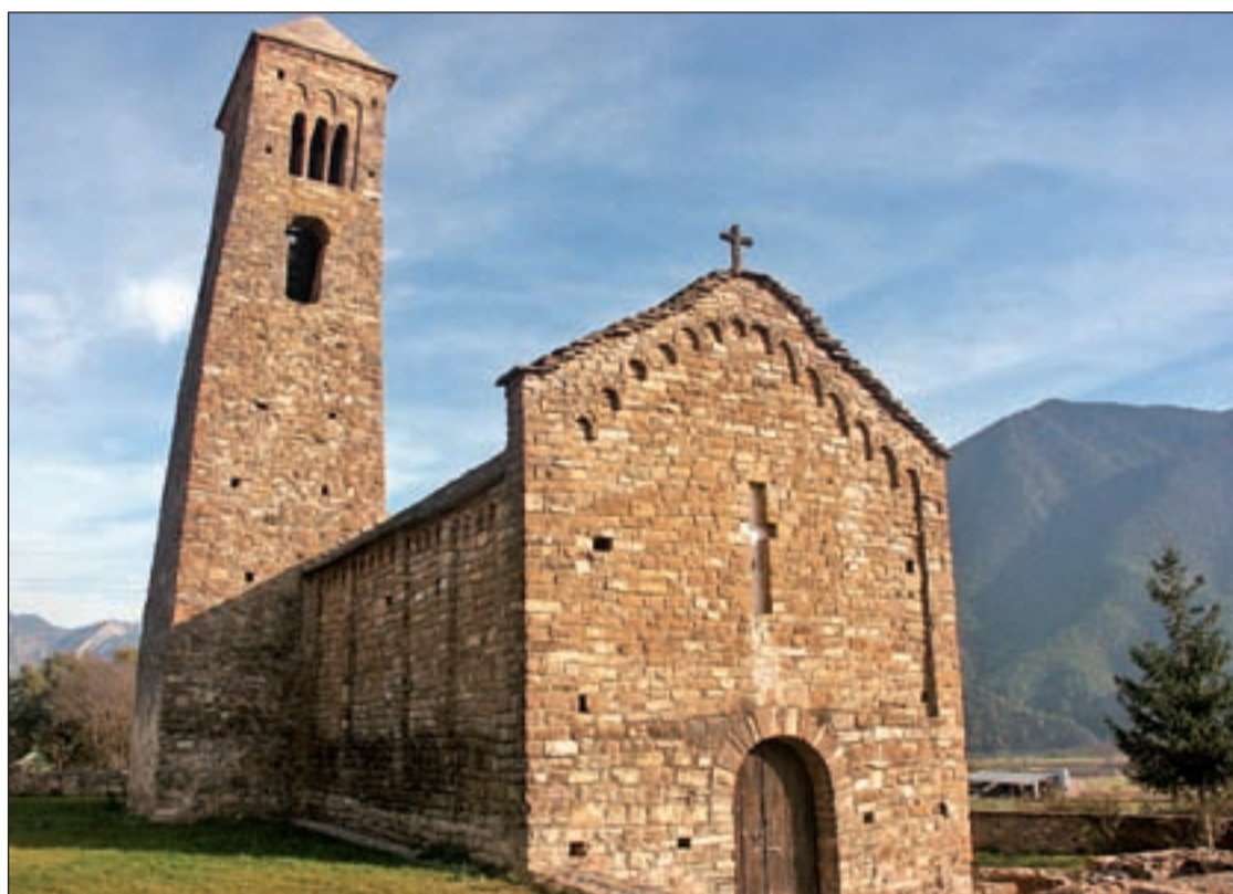
Majestuosa iglesia románica de Sant Climent

Hace unos días, y de camino a Andorra ascendíamos al Pirineo por esa fantástica carretera que desde Lleida a la Seo de Urgell remonta el río Segre entre impresionantes cortados calizos y tortuosas quebradas que el río ha excavado en la montaña. De repente al pasar por el pueblo del Coll de Nargó nos ha llamado la atención una arquitectura que destaca sobre todo lo demás por su exquisita factura: la Iglesia Románica de Sant Climent o San Clemente, del siglo XI, que nos muestra un inusual camp-