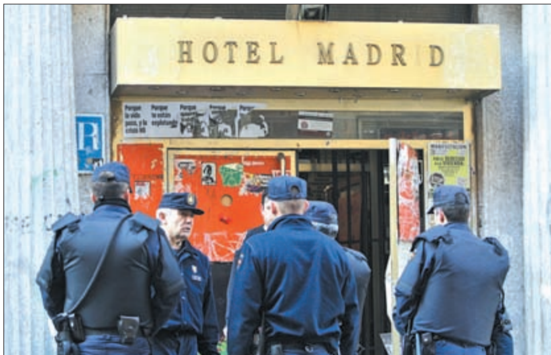
La policía a las puertas del Hotel Madrid tras producirse el desalojo

También, tras el desalojo protagonizaron una marcha por las principales calles del centro de la capital, que fueron improvisando hasta que la policía les dio el alto en la Puerta del Sol, donde se vieron obligados a poner fin a su manifestación. Eso sí, en el transcurso de la marcha, volvieron a dejar claros algunos de sus lemas como 'Nada se crea, nada se destruye, nada se abandona'. Además, también horas