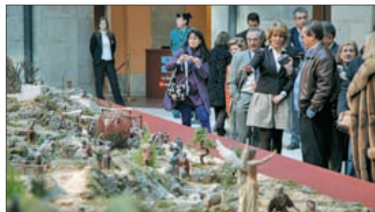
Esperanza Aguirre en la inauguración del Nacimiento

Más de 600 figuras componen este excepcional Nacimiento, pertenecientes al fondo artístico de la Asociación de Belenistas de Madrid. Pequeñas obras de arte que tienen a sus espaldas más de 70 años y que ocupan los más de 150 metros cuadrados que dispone la exposición situada en uno de los patios de la Casa Real de Correos.