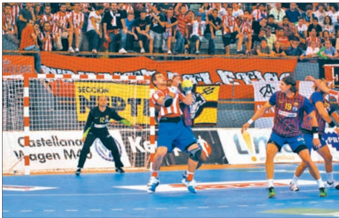
Los rojiblanco ya superaron a los azulgranas en la pasada edición de la Supercopa

Las dos plantillas se conocen al detalle, ya que en los últimos años se han visto las caras en repetidas ocasiones tanto en la Asobal como en la Liga de Campeones. Además, se da la curio-