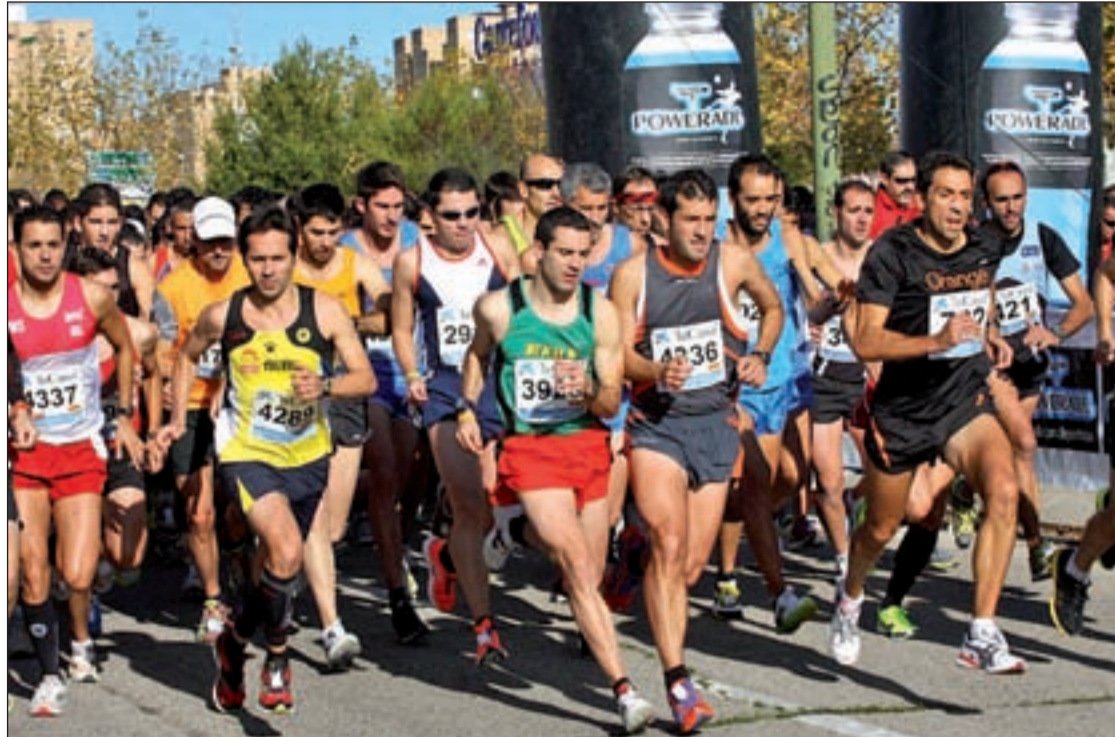
El club de atletismo de la asociación promueve entrenamientos para preparar la prueba

El objetivo es dar a conocer la gastronomía de otoño e invierno de Galicia: desde el caldo o el cocido, pasando por las carnes, las setas, las empanadas, los mariscos de temporada y los postres tradicionales caseros. Todo ello complementado con vinos y caldos que acompañan el festival de sabores de las estaciones más frías del año, sin olvidar un apartado especial para la cocina menos tradicional a través de los menús diarios de degustación.