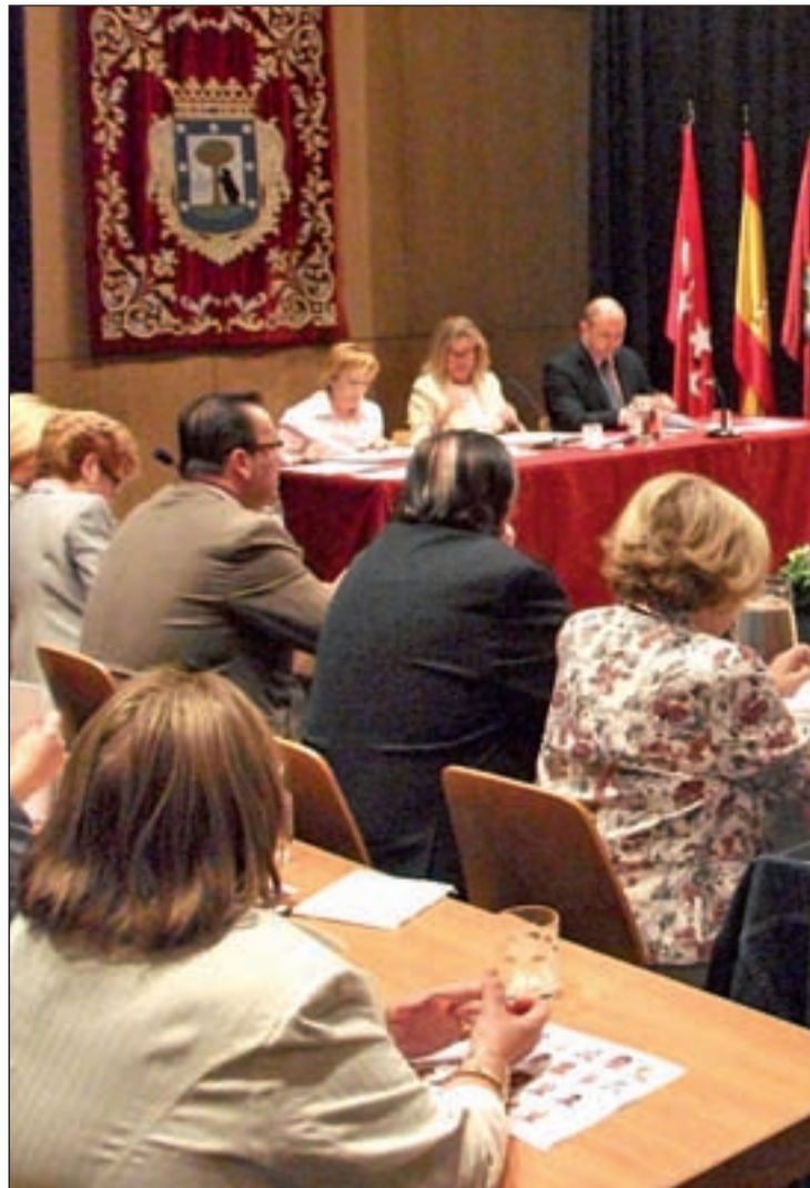
El Pleno de Latina, en una imagen de archivo

“En el capítulo de inversión real no ha bajado ni subido, se mantiene con respecto al presupuesto de 2011 que ya había bajado un 18,90 por ciento con respecto a 2010”, dicen los socialistas. “En este distrito- prosiguenha aumentado de forma desmesurada el capítulo del programa de Familia, Infancia y voluntariado, de 80.000 € en el 2011 a 368.484 € para el 2012, concretamente un 360,61 por ciento. Si los indicadores de atención han