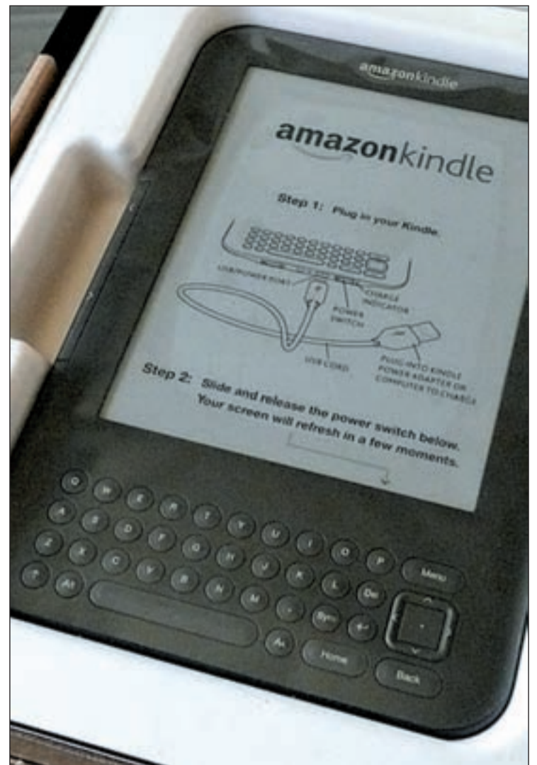
El Kindle ofrece la posibilidad de descargar libros en 60 segundos

Por otro lado, a través de Amazon Whispersync, este libro se sincronizará automáticamente con todos los dispositivos, lo que significa que se podrá recuperar la página donde se quedó la lectura. Igualmente, la compañía ha dejado ya a disposición de sus usuarios más de un millón de libros gratuitos en español con la posibilidad de ajustar la