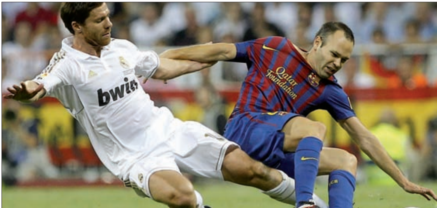
Xabi Alonso e Iniesta, dos de las piezas clave de los principales aspirantes al título liguero

EL CLÁSICO REAL MADRID Y BARCELONA SE VEN LAS CARAS EN EL SANTIAGO BERNABÉU