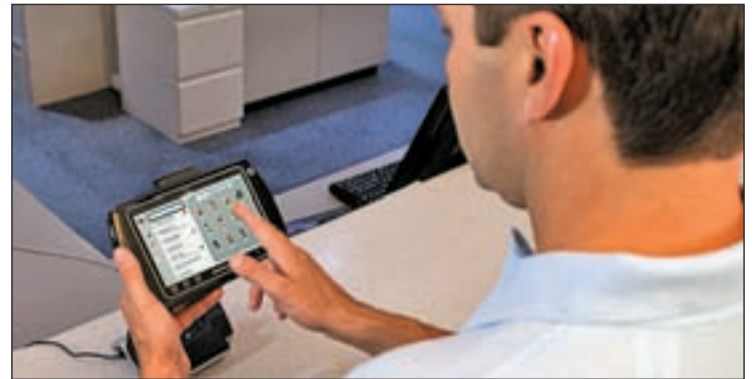
El consumidor habitual es hombre entre 18 y 34 años

Una de las grandes ventajas de las tabletas electrónicas es su encendido instantáneo, su tamaño y su peso. Además son totalmente transportables. ¿Desbancarán del mercado definitivamente los tablets al viejo PC, netbooks o smartphones?.