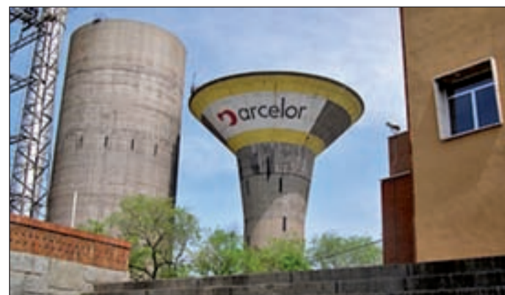
La planta de Arcelor en el distrito de Villaverde

La planta de Villaverde es la única que el grupo tiene en Madrid con una plantilla de más de 300 personas. Desde hace años, la sección sindical de CCOO exige al grupo Arcelor un plan de inversiones, "para adecuar y modernizar la empresa y, en consecuencia, garantizar su viabilidad".