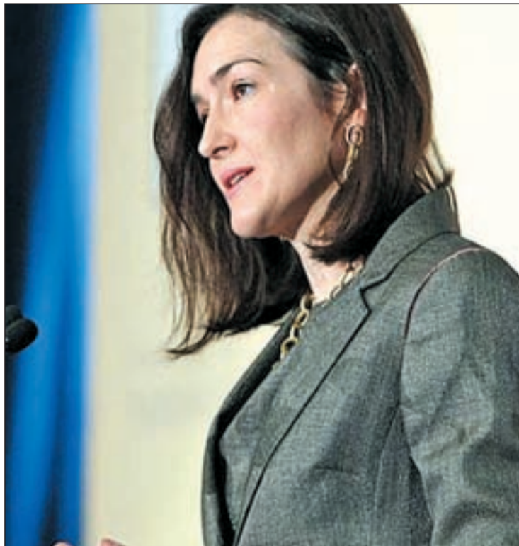
LEY SINDE: DESCARGA INCOMPLETA Con la paralización de la norma en el Consejo de Ministros, ahora es el futuro Gobierno del PP el que toma el relevo para resolver uno de los conflictos que más ha incendiado la Red

De hecho Twitter antes, durante y después de la reunión ministerial volvió a erigirse como la plataforma de los detractores de la Ley de Economía Sostenible de la ministra de Cultura. Usuarios, blogueros, activistas, periodistas y creadores de Internet volvieron a suscribir un manifiesto en defensa de los Derechos fundamentales en la Red. Diez fueron los puntos que el mundo 2.0 esgrimió para oponerse a la Ley Sinde. Argumentos como que "los derechos de autor no pueden situarse por encima de los derechos fundamentales de los ciudadanos" o que "la supresión de derechos es competencia ex-