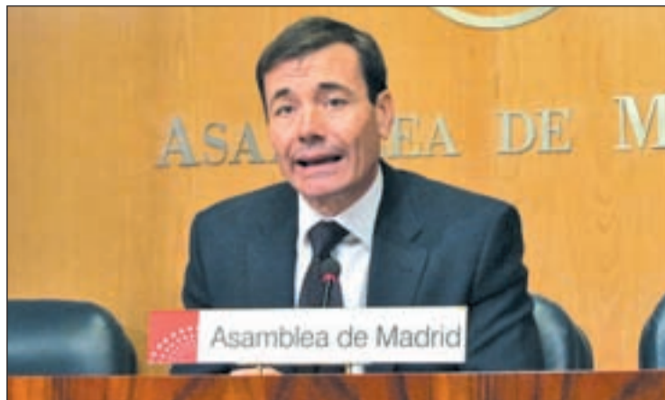
Tomás Gómez, secretario general del PSM

TRAS SALIR DE LA JUNTA DE PORTAVOCES EN LA ASAMBLEA