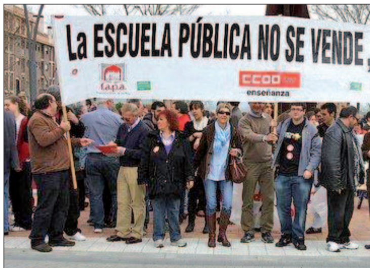
Una de las manifestaciones contra las políticas de la Comunidad

Latina tiene cada vez más cerca contar con una plataforma para defender la Enseñanza Pública en el distrito. A comienzos de diciembre, una treintena de personas, con representación de asociaciones de padres y madres (Ampas) de doce centros públicos, profesores, vecinos particulares, las asociaciones ciudadanas de Lucero y de Aluche, Comisiones Obreras de Educación e Izquierda Unida, mantuvieron la primera reunión que marca el punto de partida de la futura organización. Y llegaron a acuerdos. El primero de ellos, "la elaboración de un manifiesto de constitución con las ideas que se debatieron más las que se vayan