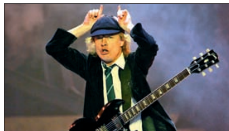
Mítico gesto del guitarrista Angus Young durante un concierto

El último trabajo discográfico del grupo australiano, 'Black Ice', se publicó en 2008 y estuvo de gira por España en 2009 y 2010. Vendieron más de 250.000 entradas para sus diversos conciertos en nuestro país.