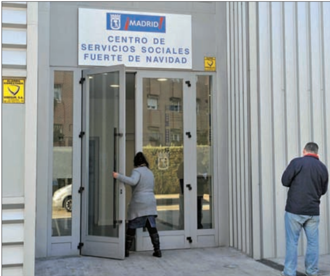
Una usuaria entre en el centro de servicios sociales Fuerte de Navidad, situado en el barrio de Las Águilas