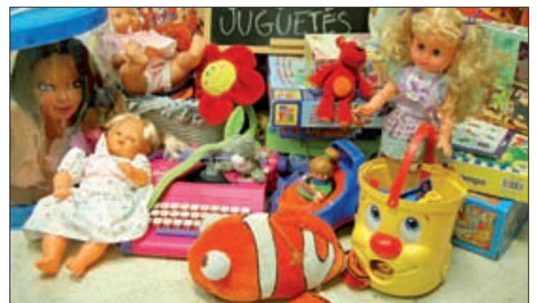
Dos camiones multiusos recogerán los juguetes

recogidos los juguetes se inspeccionarán para seleccionar los que se encuentren en perfecto estado, y éstos se entregarán a Cruz Roja, a Cáritas y a familias a través de los Servicios Sociales municipales. La recogida comienza el 12 de diciembre por la mañana en Miguel Hernández, Av. Reyes Católicos, Alhóndiga, Rosalía de Castro, Vereda de Camuerzo y 4 Sector III. Continuará por la tarde en Manuel Núñez de Arenas y Av. Arcas de Agua, entre otras direcciones.