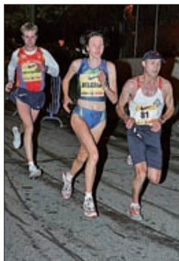
La San Silvestre, un clásico

La cuota de inscripción es de 49 euros, aunque los miembros inscritos en el club gozarán de un descuento de siete euros. La