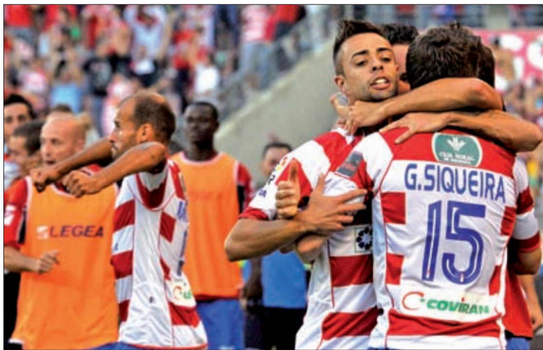
El Granada ha enderezado su rumbo después de un mal comienzo de temporada