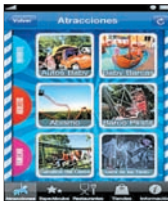
Parques de Atracciones de Madrid