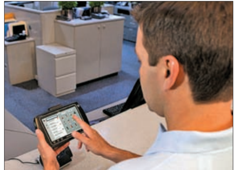
El consumidor habitual es hombre entre 18 y 34 años

Por otra parte, según el estudio de Vertic, es sorprendente la evolución de la cantidad de