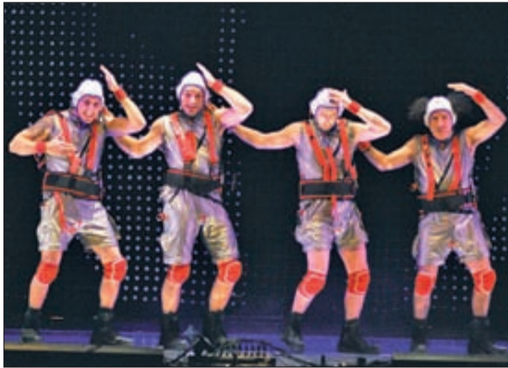
Una escena de la obra

Yllana, creada en 1991 como compañía de teatro de humor gestual, centra su apuesta en un humor sin palabras, irónico e