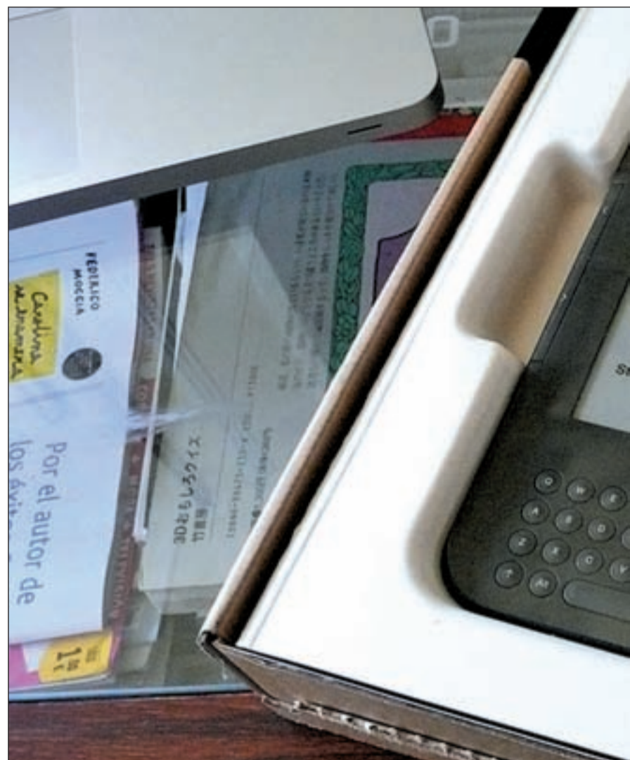
El dispositivo Kindle de Amazon ofrece la posibilidad de descargar libros en tan sólo 60 segundos

Por otro lado, a través de Amazon Whispersync, este libro se sincronizará automáticamente con todos los dispositivos, lo que significa que se podrá recuperar la página donde se quedó la lectura. Igualmente, la compañía ha dejado ya a disposición de sus usuarios más de un millón de libros gratuitos en español con la posibilidad de ajustar la