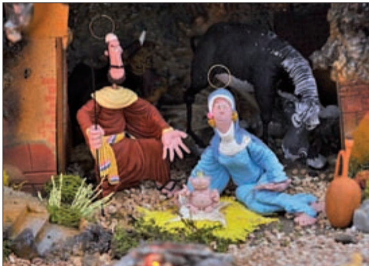
Un belén expuesto en años anteriores

35 montajes participan este año en el tradicional Concurso de Belenes del municipio, que llega a su novena edición. Singular, y novedoso es el viviente que la Casa Regional de Extremadura montará en la plaza de la Magdalena, y que estará los días 17 y 18 de diciembre de seis a ocho de la tarde. En él se representa la Anunciación, habrá animales vivos, Reyes Magos, castañas, churros y caramelos. Además, durante las representaciones actuarán los Coros Miel y Espiga de la Casa Regional de Extremadura y la Escolanía de la Catedral. Paralelamente al Belén Viviente, se instalará el Mercado Hebreo, en la Plaza del Beso y alrededor