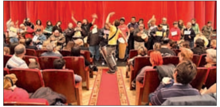
Un momento de la gala

Más de mil millones de personas viven en todo el mundo con alguna forma de discapacidad. Esta fue una de las conclusiones del informe elaborado recientemente por la OMS y el Banco Mundial sobre la discapacidad a nivel mundial. La falta de servicios y los múltiples obstáculos en su vida diaria elevan aún más su riesgo de exclusión.