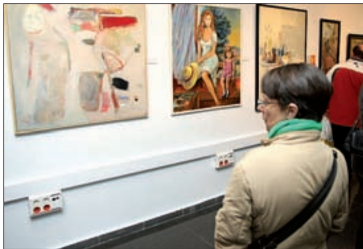
Visitantes recorren la muestra en la Sala de Exposiciones municipal

Egipto de Estudios Islámicos y el Ayuntamiento de Getafe, impulsará una exposición de pintura y escultura en la sala de exposiciones del Instituto de Estudios Islámicos de Madrid, en la calle Francisco de Asís Méndez Casariego, 2, entre los días 15 de diciembre de 2011 y 15 de enero de 2012. Constará de 28 pinturas (óleos, acuarelas, dibujos y grabados) y cuatro esculturas. Lleva como título 'Culturas Milenarias', en referencia a la temática de las obras. Entre ellas se realizará una selección que engrosará una segunda muestra que se podrá ver en El Cairo en abril de 2012.