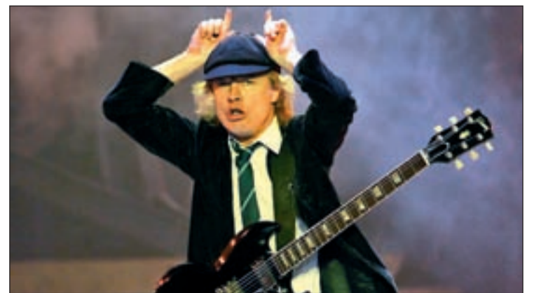
Mítico gesto del guitarrista Angus Young durante un concierto

El último trabajo discográfico del grupo australiano, 'Black Ice', se publicó en 2008 y estuvo de gira por España en 2009 y 2010. Vendieron más de 250.000 entradas para sus diversos conciertos en nuestro país.