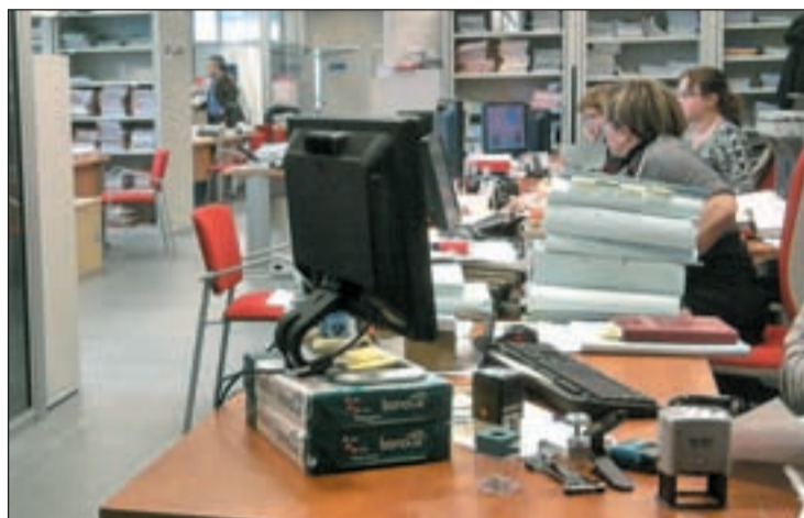
Funcionarios en su puesto de trabajo

En el caso de Comisiones Obreras, la denuncia ha ido más allá. Ya han adelantado que convocarán movilizaciones contra la destrucción del empleo público