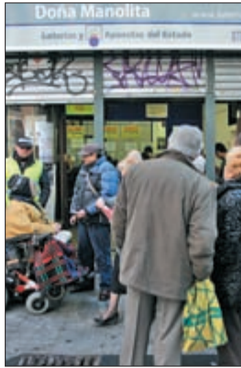
Curiosos ante el local

La aparente normalidad presidía la céntrica administración a la finalización del sorteo, justo antes del cierre. Numerosos curiosos se acercaban a observar los números agraciados y para invertir una vez más en la suerte. El suelo mojado y dos botellas vacías invitaban a pensar que la fiesta ya se había acabado. "Estamos muy contentos porque hemos dado un tercero y cuatro