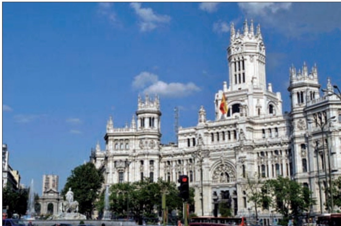
Las críticas hacia Cibeles señalan el "derroche" municipal como consecuencia de la actual situación

En cuanto a los recortes, "el PP recorta justo donde no debe y desde 2009 ya ha reducido el gasto social en 183 millones en partidas tan necesarias como la formación para el empleo, la salud o las becas de comedores escolares". En el ámbito social, Lissavetzky defiende un incremento de 33,6 millones de euros que potenciaría programas como el Servicio de Ayuda a Domicilio o el Samur Social.