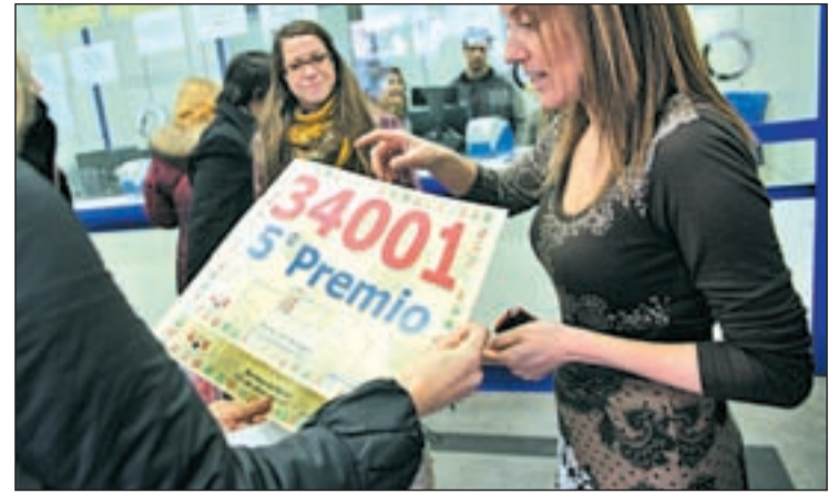
Uno de los décimos agraciados en el sorteo

En total, han vendido 19 millones de euros, "muy repartidos" para "que se cumplan mucha ilusiones". El pasado año tocó allí el segundo premio y hace dos fueron agraciados con el 'gordo' navideño.