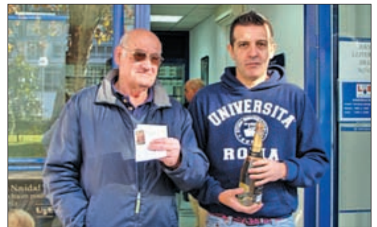
Alcorcón repartió 60.000 euros de un quinto premio