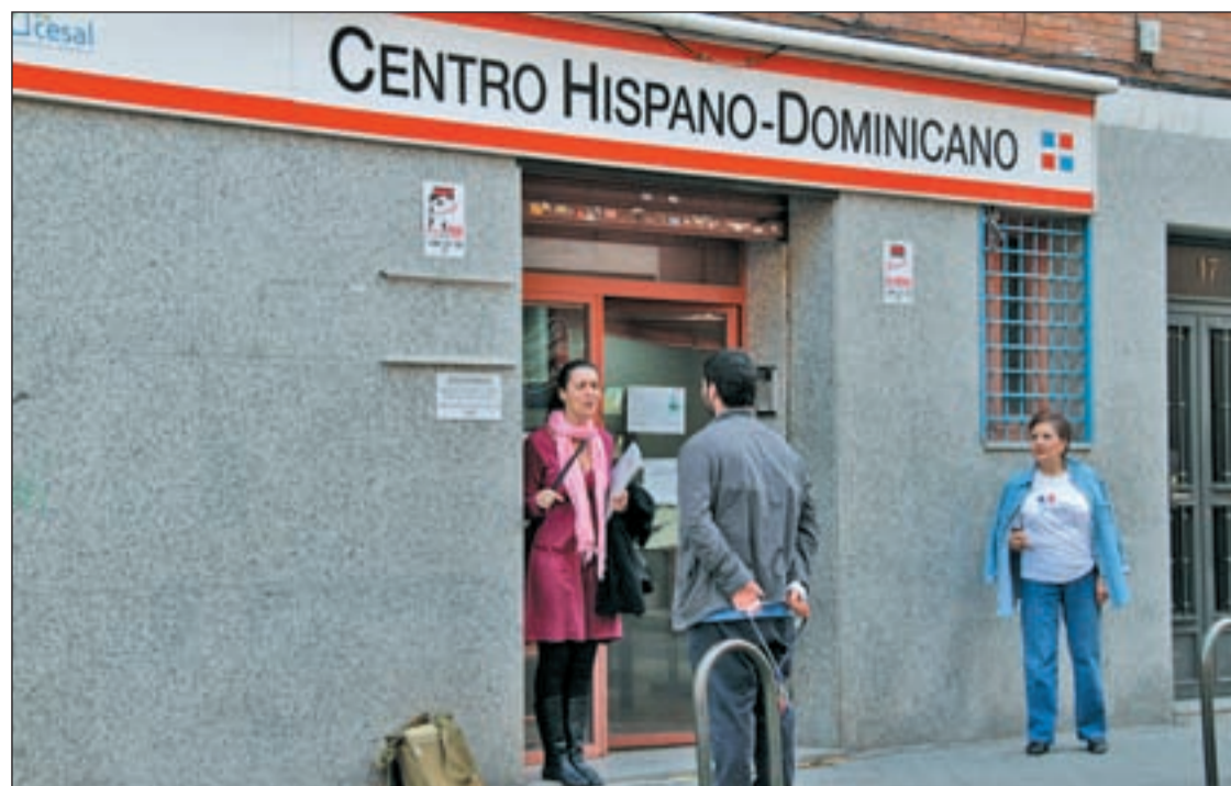
La preocupación por los servicios sociales ha sido una costumbre en el distrito durante los últimos años