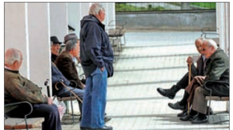
La iniciativa pretende evitar la soledad de los mayores

125 en Nochebuena y 125 en Nochevieja- en sus instalaciones asociadas. De este modo, los mayores que lo soliciten podrán pasar estas fechas en un cálido entorno. Además, disfrutarán de las cenas del 24 y el 31 de diciembre, así como de pernoctaciones durante ambas noches y los desayunos y comidas de Navidad y Año Nuevo. Además de los receptores de la Teleasistencia, cualquier mayor puede contactar en el teléfono 914220531 para solicitar su plaza.