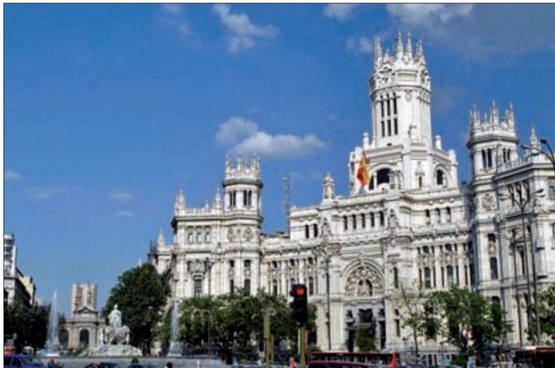
El acuerdo afecta a los 27.000 trabajadores que dependen de Cibeles

Además, también se mantendrán los ocho días de asuntos propios y, a diferencia de lo decidido por el Ejecutivo autonómico, se continuará abonando el cien por ciento del sueldo durante los primeros quince días de baja laboral.