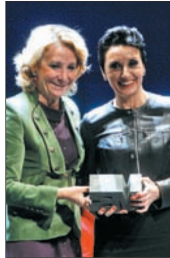
Aguirre junto Luz Casal

En esta edición, una de las figuras más representativas del cine español, el cineasta Carlos Saura recibió la Medalla Internacional de las Artes, un galardón dotado con 60.000 euros y que agradeció profundamente al "crisol de cultura" y "emporio del arte" que para él es la ciudad.