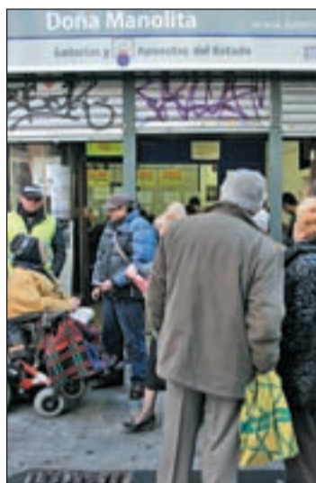
Curiosos ante el local

La aparente normalidad presidía la céntrica administración a la finalización del sorteo, justo antes del cierre. Numerosos curiosos se acercaban a observar los números agraciados y para invertir una vez más en la suerte. El suelo mojado y dos botellas vacías invitaban a pensar que la fiesta ya se había acabado. "Estamos muy contentos porque hemos dado un tercero y cuatro