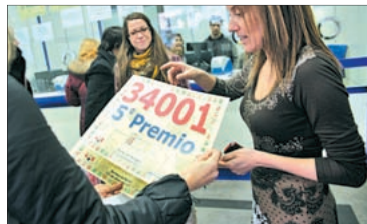
Uno de los décimos agraciados en el sorteo

En total, han vendido 19 millones de euros, "muy repartidos" para "que se cumplan mucha ilusiones". El pasado año tocó allí el segundo premio y hace dos fueron agraciados con el 'gordo' navideño.