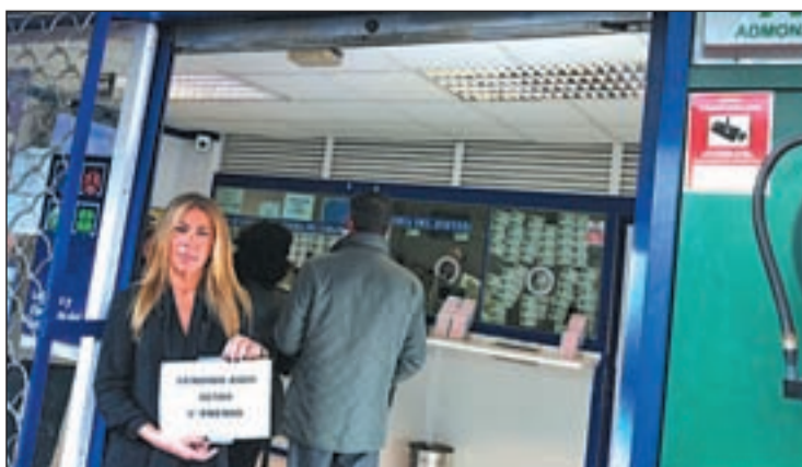
La dueña de la Administración con el cartel del número M. MARTÍNEZ

EL 02184 SE VENDE EN EL CENTRO COMERCIAL BURGOCENTRO