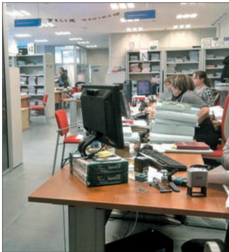
Funcionarios en su puesto de trabajo

Desde el sindicato han destacado que "una vez más", se trata de una "medida impuesta" en la que no ha habido "ningún tipo de negociación" con los sindicatos. "Esta medida impuesta su-