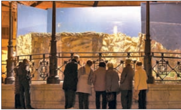
Vecinos ante el portal de Belén navideño

LOS MUNICIPIOS APUESTAN POR LA TRADICIÓN