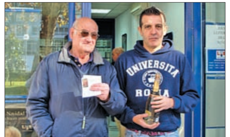
Alcorcón repartió 60.000 euros de un quinto premio