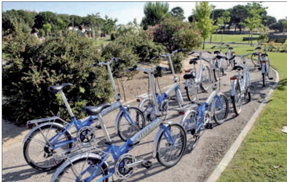
Estudio del Carril Bici en Boadilla del Monte