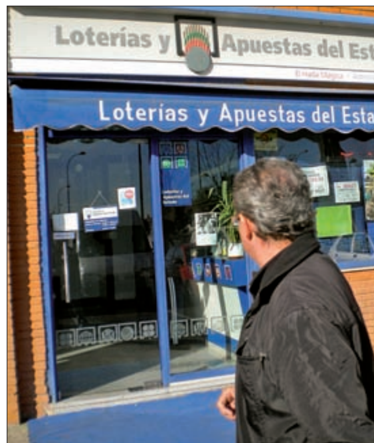
Fachada de la administración de lotería 'El Hada Mágica' de Getafe

mos), que equivalen a medio millón de euros. Todo se ha repartido en ventanilla, así que no sabemos a quién lo ha podido tocar”. La administración está en un pequeño centro comercial del Sector 3 de Getafe, uno de los barrios más nuevos de la localidad. “Por aquí pasa mucha gen-