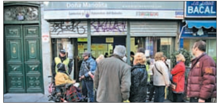
Numerosos curiosos se acercaron al local

En total, han vendido 19 millones de euros, "muy repartidos" para "que se cumplan mucha ilusiones".