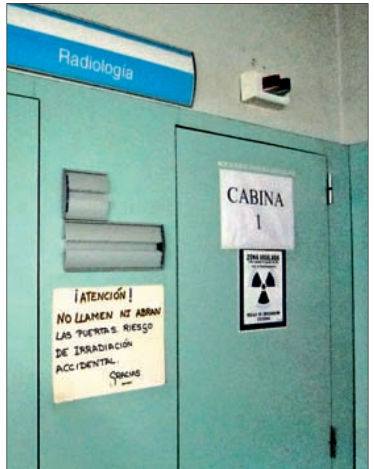
La sala de Rayos X del Hospital Cerro del Aire de Majadahonda