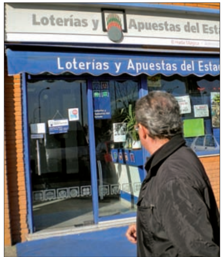
Fachada de la administración de lotería 'El Hada Mágica' de Getafe

mos), que equivalen a medio millón de euros. Todo se ha repartido en ventanilla, así que no sabemos a quién lo ha podido tocar”. La administración está en un pequeño centro comercial del Sector 3 de Getafe, uno de los barrios más nuevos de la localidad. “Por aquí pasa mucha gen-