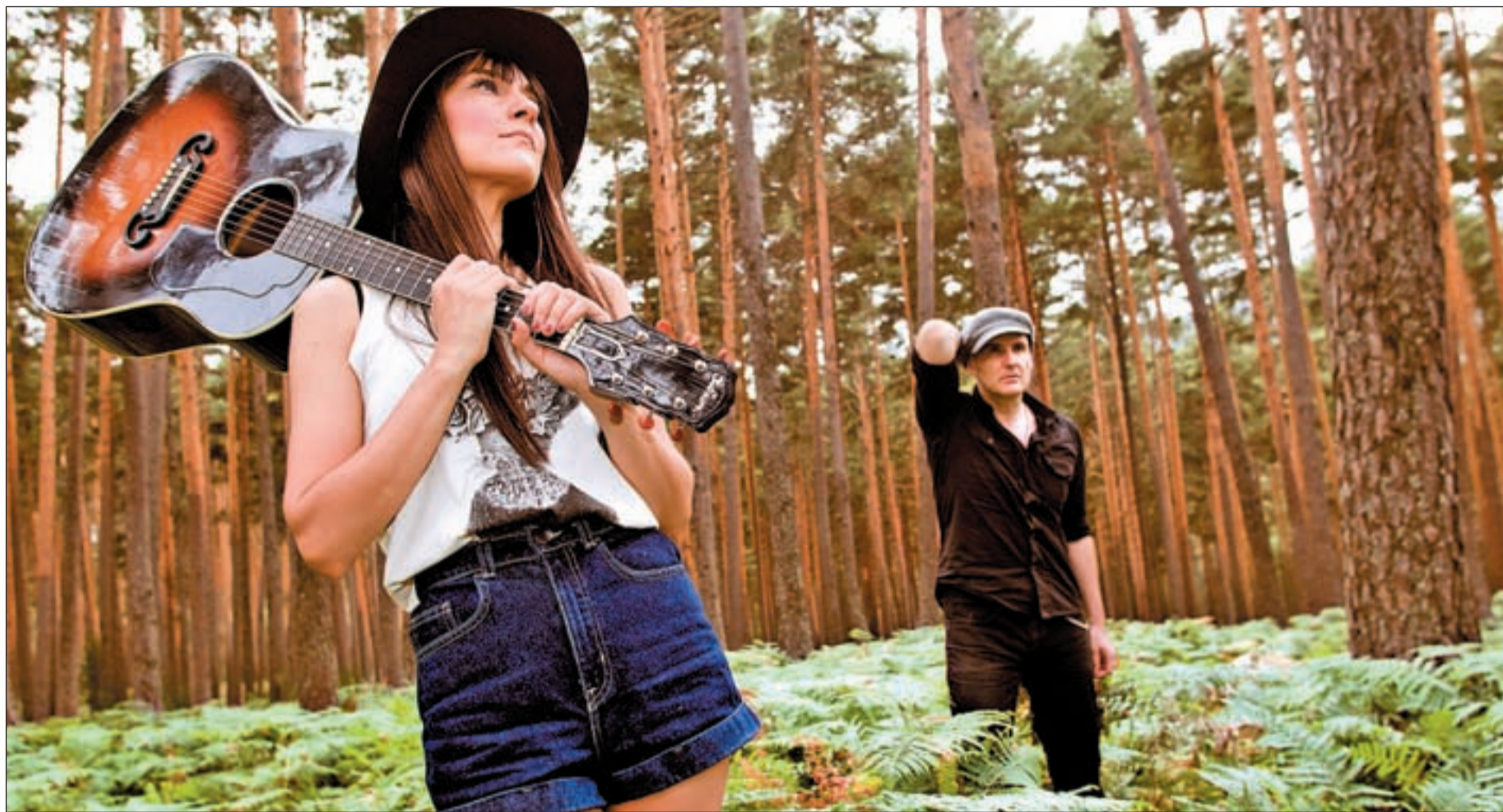
Eva Amaral (primer plano) y Juan Aguirre (segundo plano) se dieron a conocer entre el gran público con su tercer disco 'Estrella de Mar'