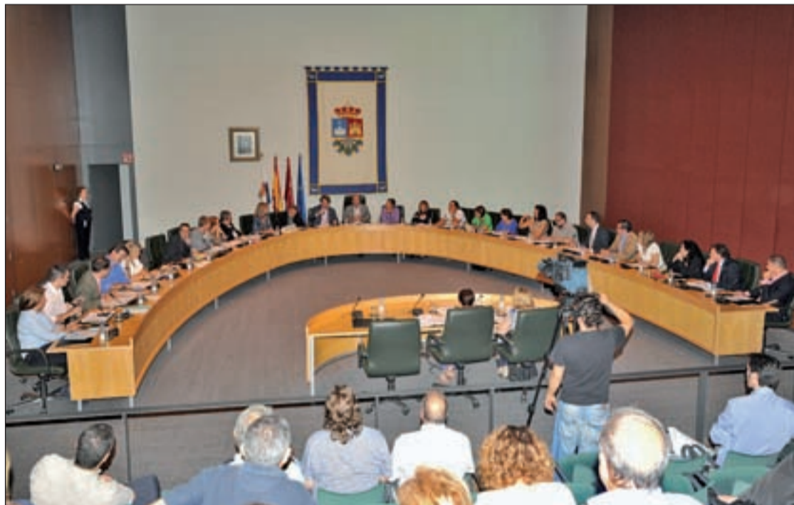
Pleno del Ayuntamiento de Fuenlabrada

En el capítulo de ingresos, el Gobierno local se topará con dos inconvenientes. Por un lado, el retraso en la elaboración de los Presupuestos Generales del Estado y, por otro, la obligación de devolver 16 millones de euros en los próximos cinco años al Go-