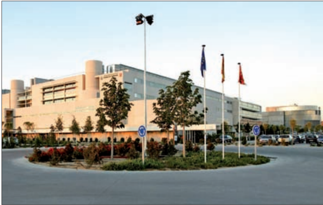
Hospital de Fuenlabrada