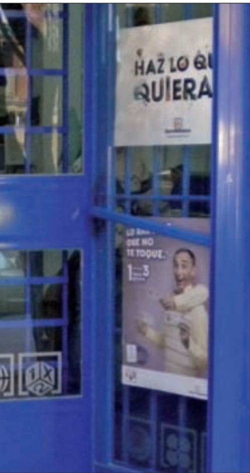
El número premiado

llevábamos algo”, decía una chica joven, feliz “por que mi madre compró el otro día un décimo y podremos celebrar la Navidad como se merece”. Así comenzaba una fiesta que duraría todo el día. Había que celebrar por todo lo alto que la suerte se acordó por una vez de Parla.