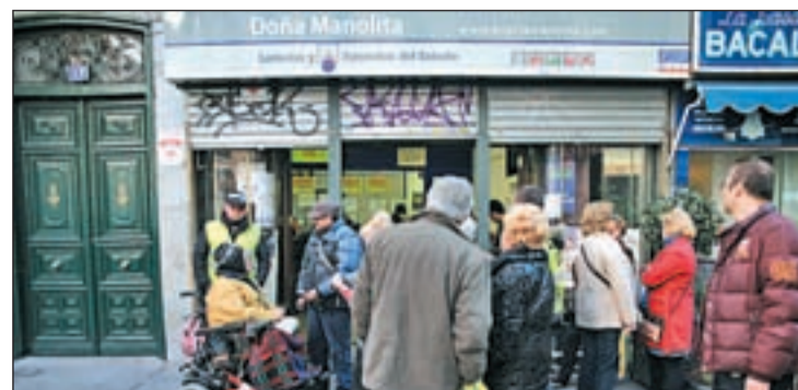
Numerosos curiosos se acercaron al local

En total, han vendido 19 millones de euros, "muy repartidos" para "que se cumplan mucha ilusiones".