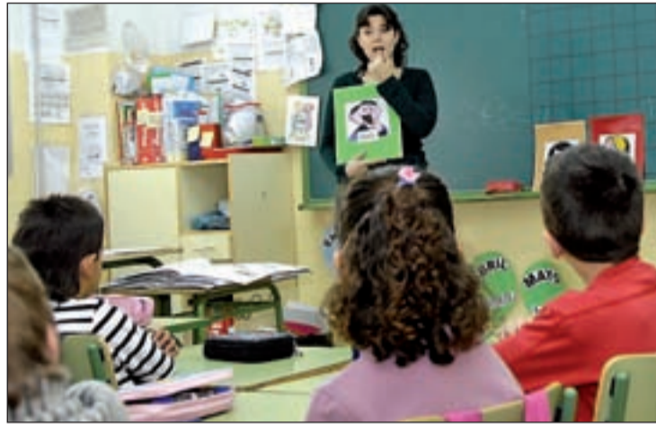
Alumnos de primaria en clase

El 84 por ciento de los más de 56.000 alumnos evaluados han aprobado este año el examen y el 71 por ciento ha obtenido una