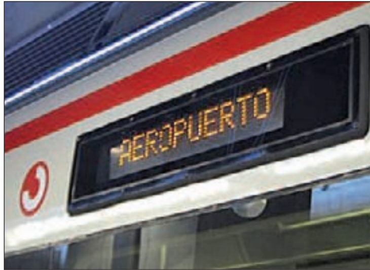
Los trenes Civia llegan a la T4 desde Chamartín en 11 minutos

Este acceso ferroviario, con una longitud total de casi nueve kilómetros, supuso una inversión superior a los 218 millones de euros. Desde entonces, el centro