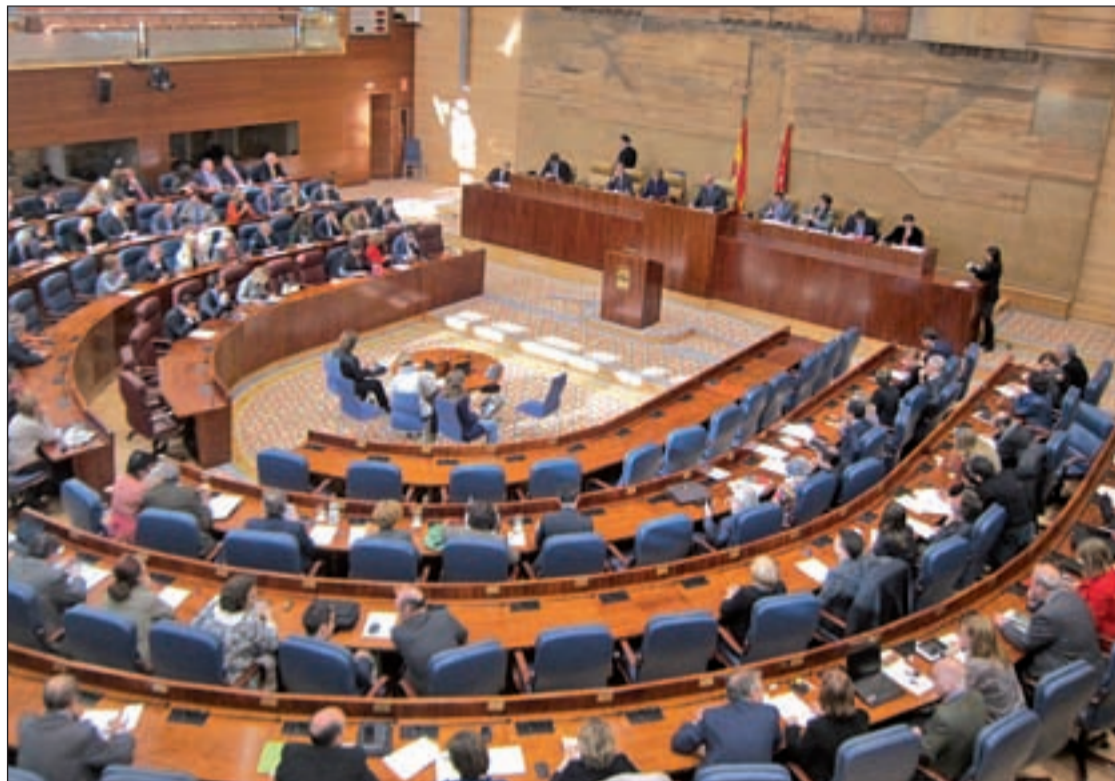
El pleno de la Asamblea de Madrid celebrado el pasado martes

Después de varios días de críticas a la propuesta de ampliar las horas laborales de los trabajadores públicos, lo que sólo era un proyecto se ha convertido en una realidad después de que el PP, valiéndose de su mayoría absoluta, lo aprobara en el pleno de la Asamblea de Madrid, celebrado el pasado martes. Ha quedado, por tanto, materializada la modificación de la jornada laboral de los empleados públicos, que tendrá un promedio semanal no inferior a las 37 horas y 30 minutos, frente a las 35 actuales. Asimismo, la aprobación de la Ley de Acompañamiento supone la modificación del pago que hace la Comunidad de Madrid del complemento de las bajas temporales al personal laboral. En consecuencia, la Seguridad Social seguirá pagando el 60% del salario de los afectados, pero el Gobierno regional no abonará el 40% restante como hacía hasta la fecha. Esta iniciativa, según el Grupo Popular, busca, más allá de un ahorro, que se calcula en unos 26 millones de euros, introducir un elemento de contención del absentismo laboral ligado a enfermedad común. "Creemos que para salir de la crisis económica, los trabajadores públicos deben hacer un nuevo esfuerzo, arrimar el hombro y adaptarse a la realidad actual en la que deben primar la producti-