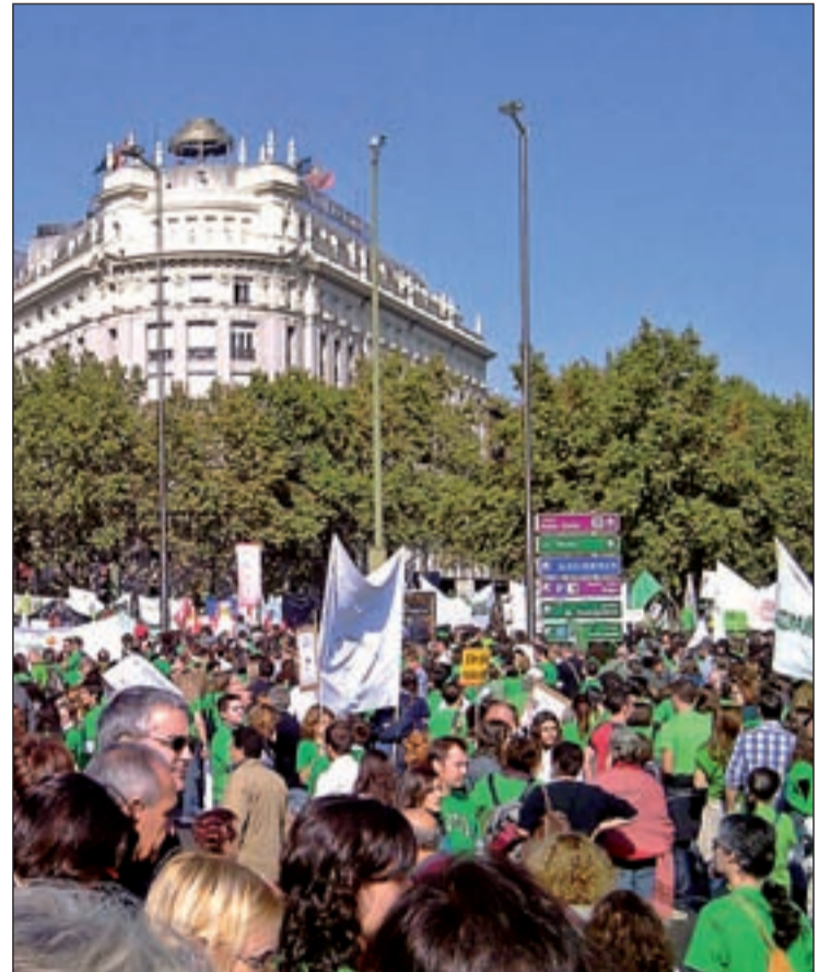
Una de las numerosas manifestaciones convocada por la Marea Verde

La respuesta a las medidas de Aguirre llegaron en forma de huelga con la 'Marea Verde'. En concreto, nueve fueron los paros convocados por los centros públicos autonómicos que contaron con un alto respaldo en la comunidad educativa nunca inferior al 45%. Cada jornada de paro ha supuesto unos cien euros menos en la nómina de los docentes que la secundan, lo que suma 900 en el caso de los que han participado en todos los paros. Las huelgas se han complementado con encierros, actos reivindicativos y grandes mar-