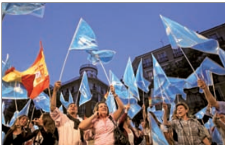
Los ciudadanos dieron su respaldo al PP de Madrid