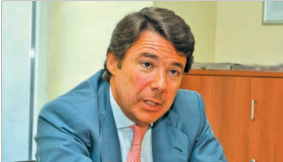
IGNACIO GONZÁLEZ SECRETARIO GENERAL DEL PP DE MADRID