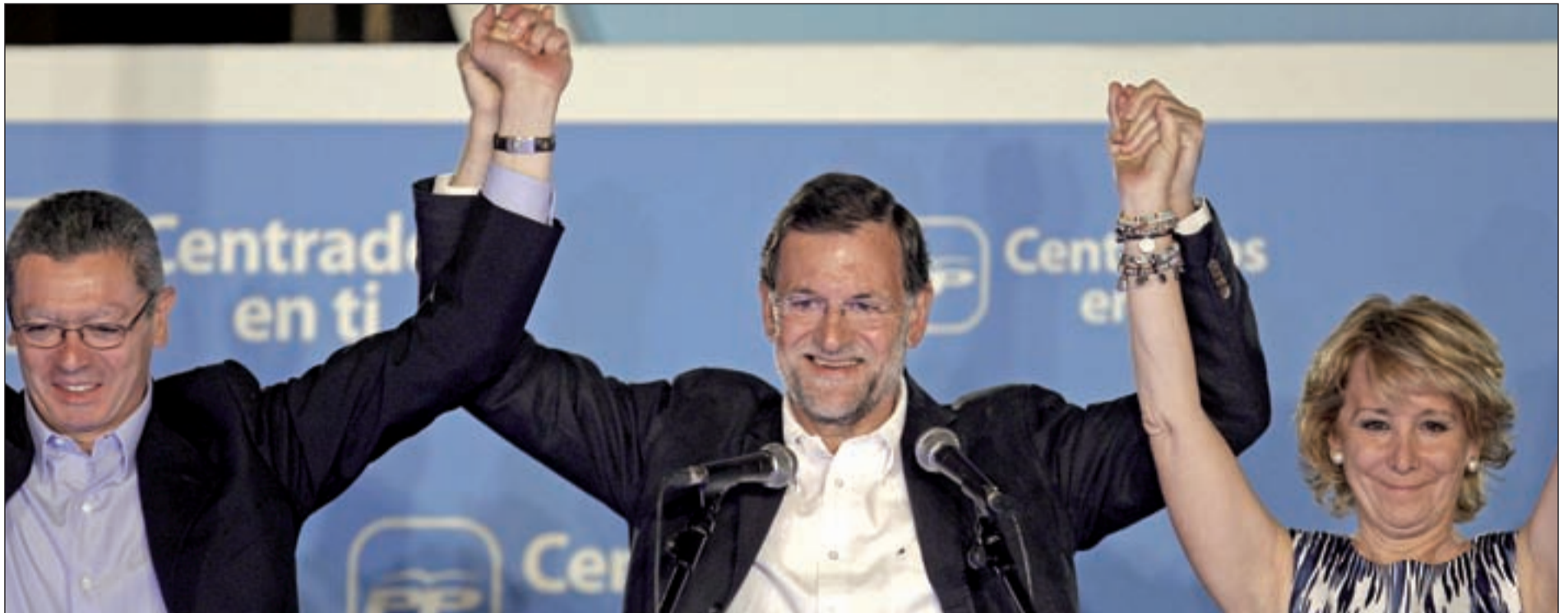
Gallardón, Rajoy y Aguirre celebrando el triunfo del PP en Génova durante la noche del 22 de mayo