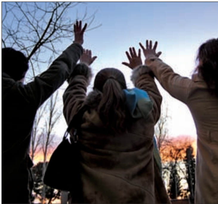
Tres mujeres se manifiestan en contra de la violencia machista

En abril de este año, la Policía detuvo en Torrejón de Ardoz a un joven rumano de 21 años por estrangular con una corbata a su pareja de 19 años y embarazada. El autor de los hechos mostró el cadáver por web cam al padre de la víctima, residente en Rumanía. Un mes después, una mujer moría presuntamente degollada