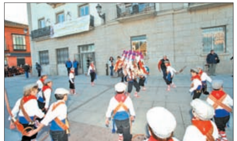
La fiesta de 'La Vaquilla' es de interés turístico

En la edición de este año, se ha establecido un Primer Premio, dotado con 600 € a una sola fotografía, y dos Accésit, dotados con 300 € cada uno. La fotografía ganadora del Primer Premio servirá como imagen del cartel anunciador de la Fiesta de 'La Vaquilla' de 2013, pasando todas las fotografías premiadas al Archivo fotográfico del Ayunta-