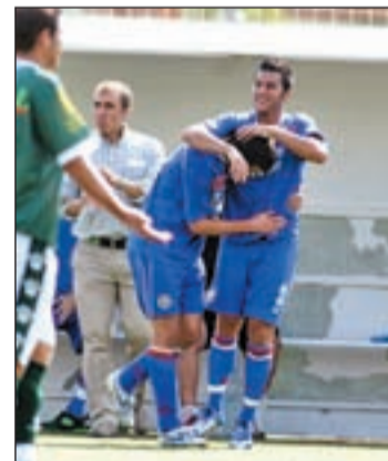
Alegoría en el equipo tricantino