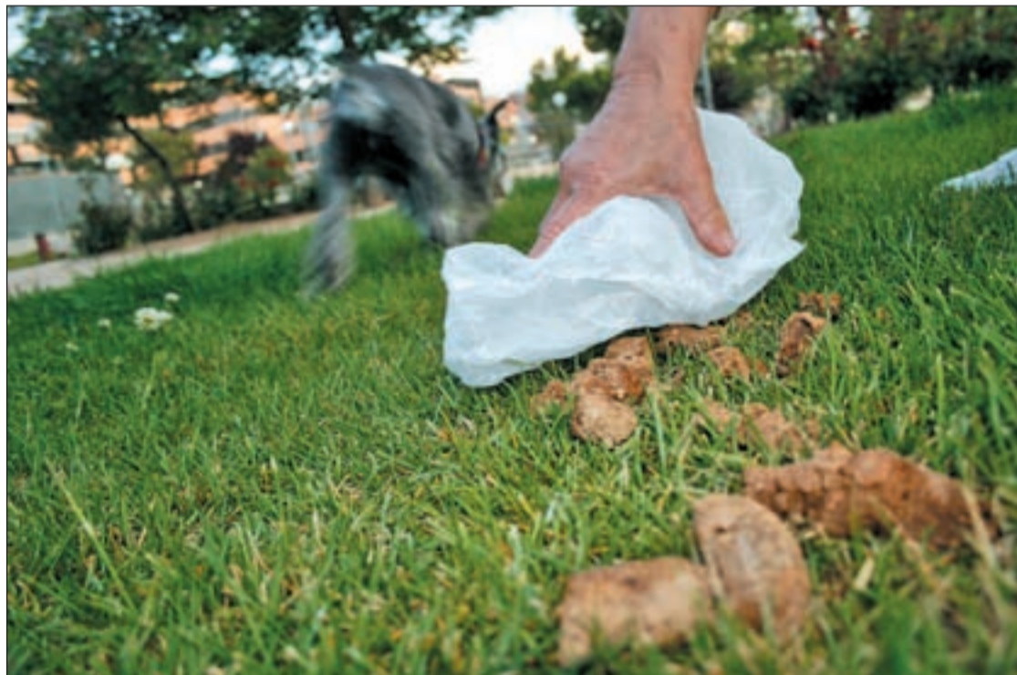
No limpiar las 'cacas' tendrá multa

Lo que se pretende con estas nuevas normas es actualizar y mejorar la ordenanza que estaba en vigor desde hace más de 11 años. Ahora, los dueños de estos animales de compañía deberán tener más cuidado con sus animales ya que se han impuesto normas antes no vigentes en la localidad. Entre ellas, la de multar por no limpiar las 'cacas' de los perros, se podrá sancionar a los propietarios con multas que van desde los 30 euros hasta los 1.202 euros.