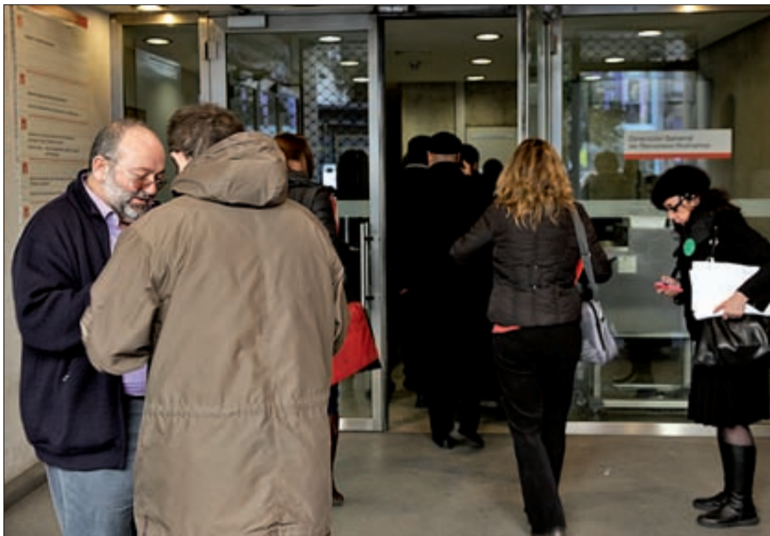
Los sindicatos a la entrada de la reunión