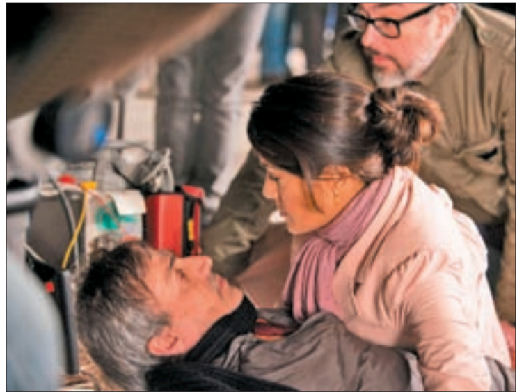
José Mota (izquierda) y Salma Hayek (derecha), durante una escena

Rodado con la mitad del presupuesto utilizado para 'Balada triste de trompeta', aproximada-