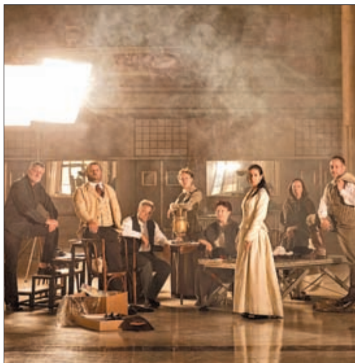
'Tío Vaina' de Chéjov estará en Los Teatros del Canal