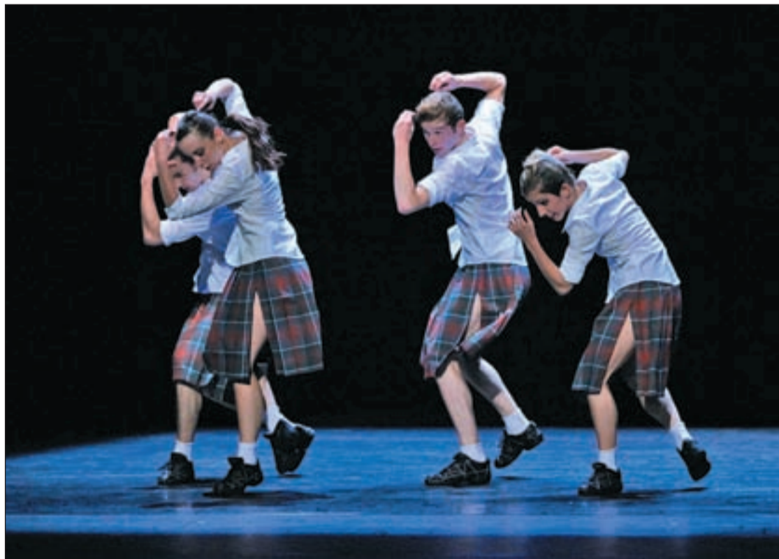
Una escena del espectáculo de danza 'Mintzo' para el que los 'Amigos del Auditorio' tendrán descuento

Los otros siete espectáculos restantes, a los que se podrá acceder con descuentos se llevarán a cabo a lo largo de todo este primer semestre de 2012 y son variados y para todos los gustos. El 5 de febrero, el concierto de Música de Cuerda y Clarinete, el es-