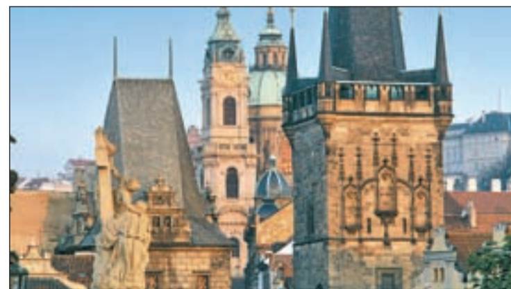
Uno de los rincones más emblemáticos de la capital checa

muerte de Rodolfo II de Habsburgo, archiduque de Austria, Rey de Hungría y Bohemia y emperador del Sacro imperio romano germánico, que fue educado en España bajo la tutela de su tío, el rey Felipe II. Para los cinéfilos, Praga lanza un guiño a través de la celebración del 100 aniversario del nacimiento de Jiri Trnka, célebre cineasta y animador más conocido como el 'Walt Disney del Este'. Valores añadidos a su reclamo turístico permanente.