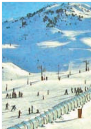
El esquí, deporte estrella

Baqueira Beret es la estación con más nieve de la península y buen ejemplo para generalizar y ejemplificar el balance del resto de sus homólogas. Esta estación, que acumula espesores de 60 cm a 160 cm, ha ofrecido a sus clientes el 100% de sus instalaciones con 113 de sus 120 km esquiabiles. De hecho, estas excelentes condiciones han sido las responsables de la gran afluencia de esquiadores durante las pasadas fiestas navideñas. Los resultados han sido muy positivos y durante las navidades han acudido a Baqueira Beret 154.693 esquia-