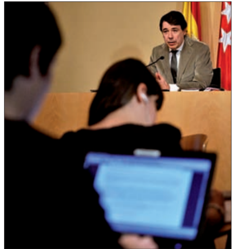
Ignacio González en la rueda de prensa posterior al Consejo de Gobierno

En este punto, ha vuelto a recordar que Madrid es "la única Comunidad Autónoma que ha cumplido con los objetivos de déficit fijados por el Gobierno en estos años", lo que, a su juicio, le ha permitido "tener una situación económica menos mala" que otras administraciones.