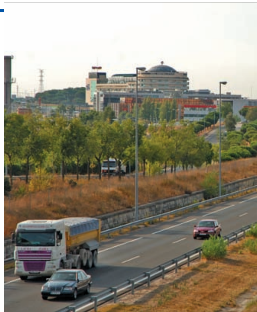
La M-607, una de las carreteras más atascadas de la Comunidad de Madrid CHEMA MARTÍN

Una de las luchas no de este año, sino de varios años, en Colmenar Viejo, es la construcción del tercer carril de la autovía M-607. Este año parece que la si-