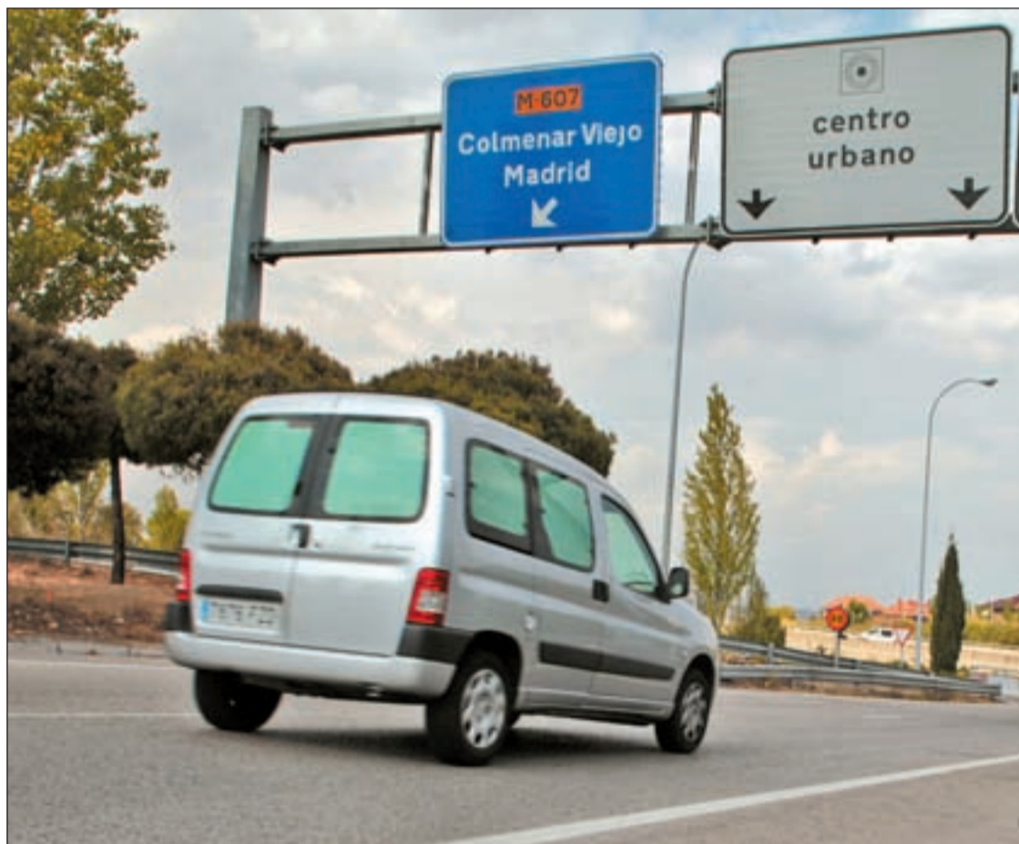
La M-607, carretera que une Madrid con Tres Cantos y Colmenar Viejo

Tres Cantos trabajará para conseguir un acceso más que el de la M-607 y Colmenar luchará por conseguir el tercer carril en esta carretera Págs. 12 y 13