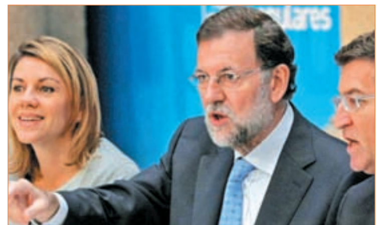
Feijóo y Cospedal con Mariano Rajoy

El portavoz adjunto del PP en el Congreso lo ha apoyado.