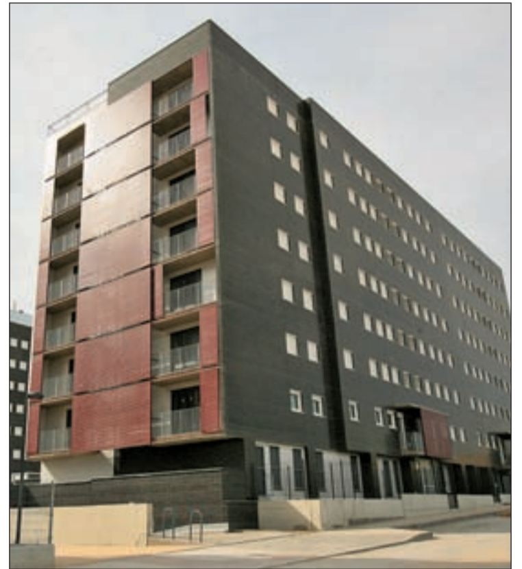
La entrega de las Mil Viviendas, uno de los principales retos de 2012

A lo largo de 2012, el Nuevo Tres Cantos irá creciendo. Entre otras cosas, se culminarán los accesos desde la M-607 a esta zona que, en la actualidad, está en construcción. También se está ampliando la depuradora para dar servicio a las nuevas viviendas.