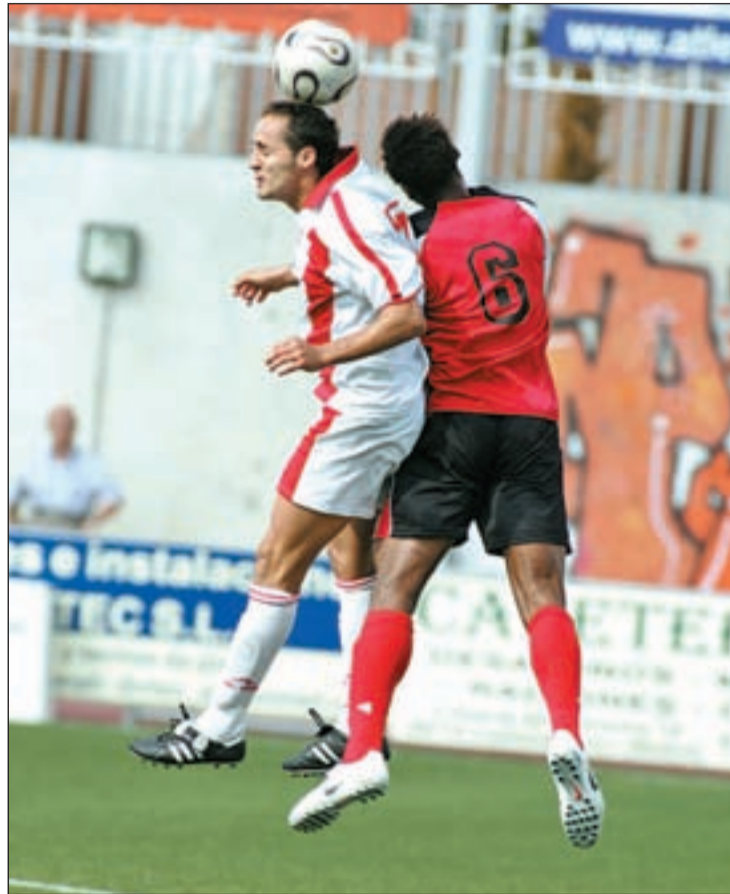
El Colmenar buscará reencontrarse con la victoria

Para empezar este segundo tramo del curso, el Colmenar juega por segunda semana consecutiva a domicilio, concreta-