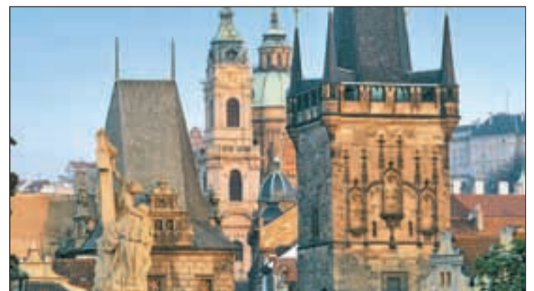
Uno de los rincones más emblemáticos de la capital checa

muerte de Rodolfo II de Habsburgo, archiduque de Austria, Rey de Hungría y Bohemia y emperador del Sacro imperio romano germánico, que fue educado en España bajo la tutela de su tío, el rey Felipe II. Para los cinefilos, Praga lanza un guiño a través de la celebración del 100 aniversario del nacimiento de Jiri Trnka, célebre cineasta y animador más conocido como el 'Walt Disney del Este'. Valores añadidos a su reclamo turístico permanente.