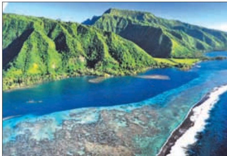
Una panorámica de los secretos de la ruta del aceite de Monoi

En el crisol de destinos que se congregarán en este evento de repercusión internacional destacan ofertas como las que presentará Argentina cuyos contenidos turísticos se vertebran en torno a nuevos ejes promocionales que combinan la Historia, inserta en