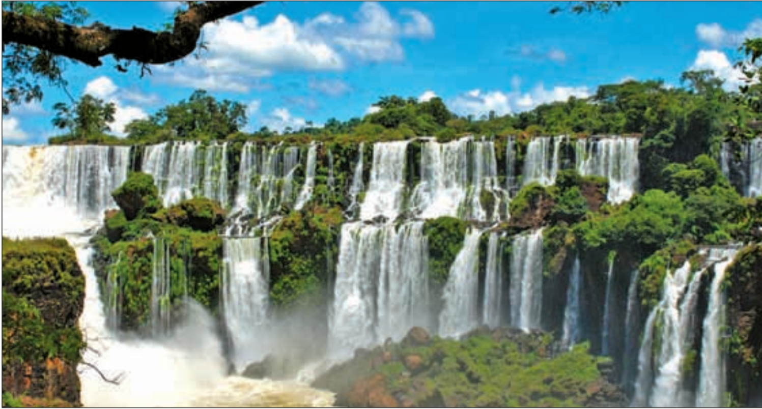
Las cataratas de Iguazú están formadas por 275 saltos de hasta 80 m de altura de los cuales el 80% están del lado argentino y el resto en tierras brasileñas