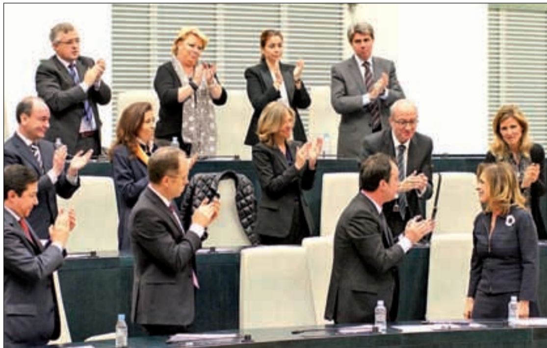
Ana Botella tomó posesión como alcaldesa el 27 de diciembre

En ella destaca la reducción de las Áreas de Gobierno, de ocho a siete, después de la fusión de las de Seguridad y de Medio Ambiente y Movilidad. Además, Vicealcaldía asume todas las competencias en materia de turismo