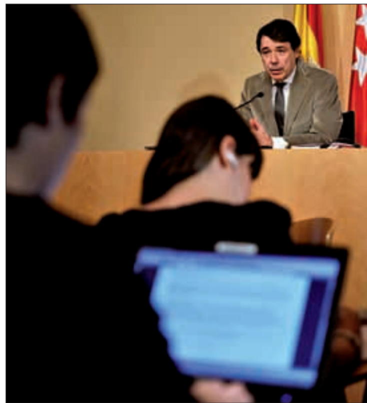
Ignacio González en la rueda de prensa posterior al Consejo de Gobierno

En este punto, ha vuelto a recordar que Madrid es "la única Comunidad Autónoma que ha cumplido con los objetivos de déficit fijados por el Gobierno en estos años", lo que, a su juicio, le ha permitido "tener una situación económica menos mala" que otras administraciones.