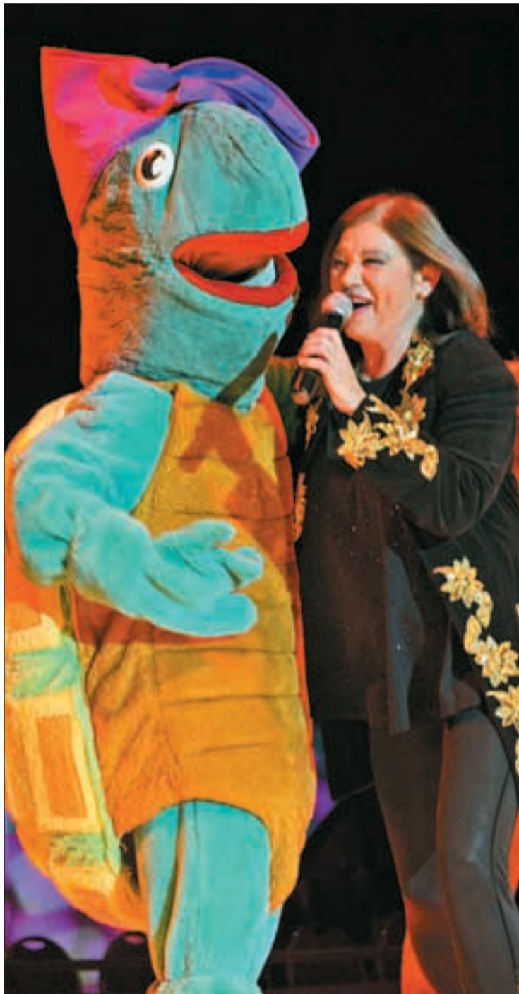
La popular cantante, junto a uno de los muñecos del montaje