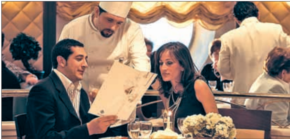
Una de las degustaciones a bordo del crucero