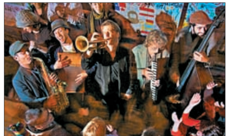
Los americanos The California Honeydrops abrirán el festival

Entre estas dos fechas, actuarán grandes nombres del panorama internacional: El gran 'bluesman' Lucky Peterson (USA) (jueves 15, Joy Eslava), el mítico directo de los californianos Breakestra (USA) junto a Jimmy Burns (USA) (viernes 23, Joy Eslava), el esperadísimo retorno de los españoles Speaklow y el 'show' salvaje de The Apples (sábado 24, Penélope). En febrero habrá presentaciones especiales