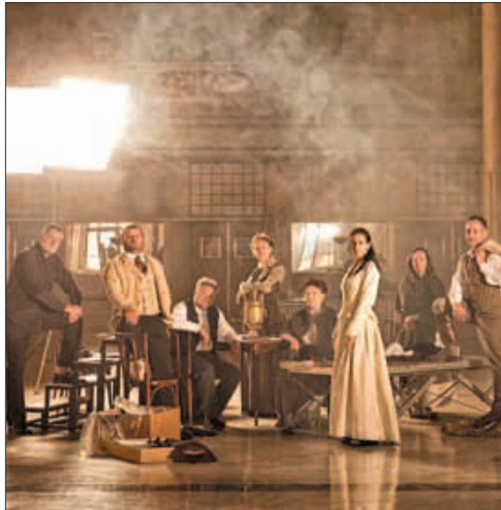
'Tío Vaina' de Chéjov estará en Los Teatros del Canal