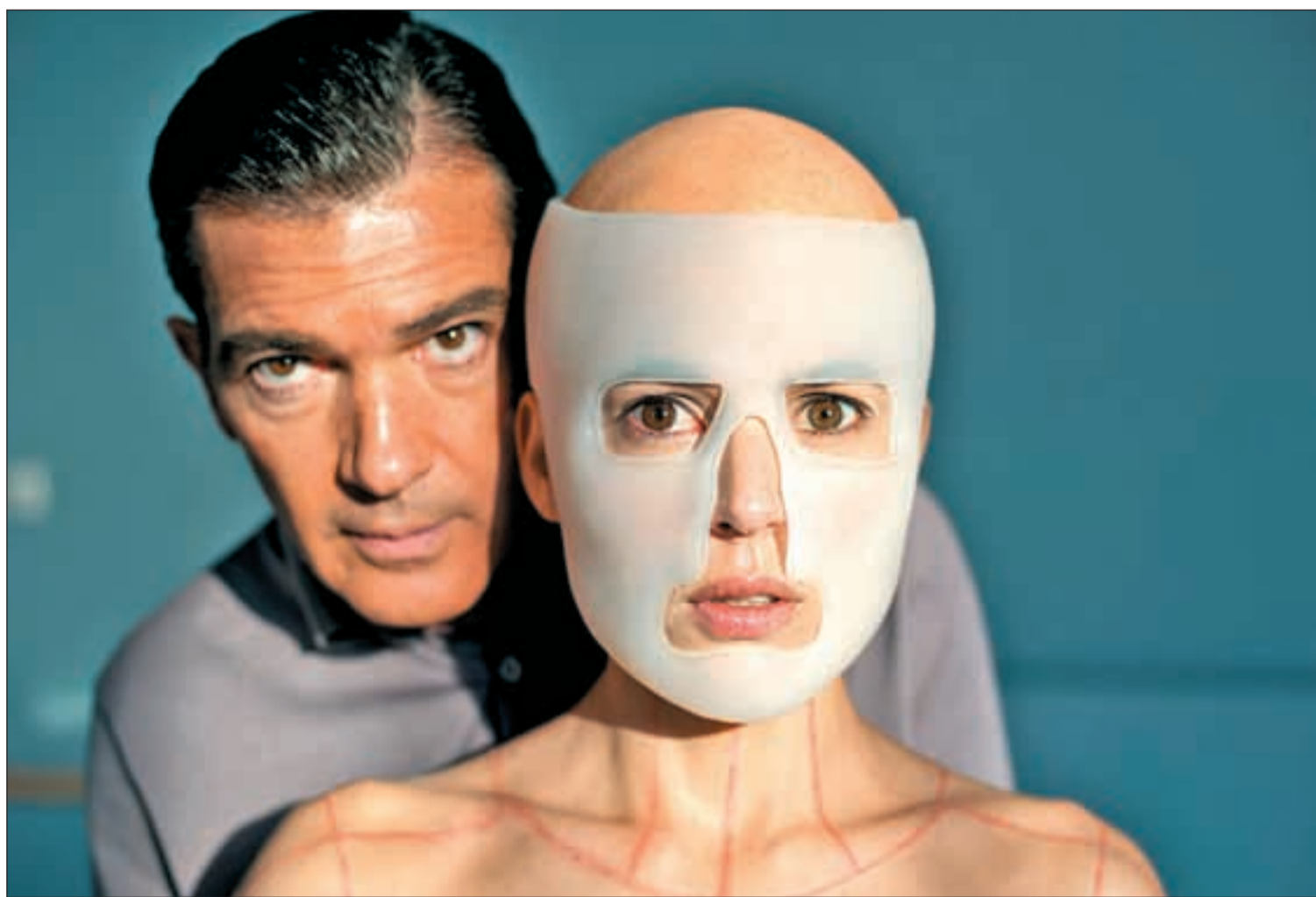
Antonio Banderas y Elena Anaya, protagonistas de 'La piel que habito', optan a los Goya por sus interpretaciones en esta película