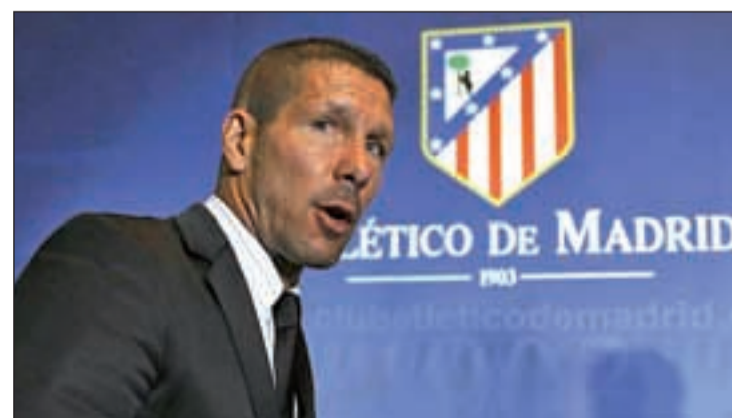
Simeone ya ha cogido las riendas del Atlético

ciencia que Simeone sea el revulsivo que necesitaba el equipo para abandonar los puestos de la zona media baja y encarar el comienzo de la segunda vuelta con serias opciones de acceder a los puestos europeos. El primer examen será este domingo ante el Villarreal (12:00 horas), en un encuentro en el que los visitantes llegan con la necesidad imperiosa de sumar puntos para escapar de los puestos de descenso. Domínguez, Perea y Marco Rubén se perderán esta cita.