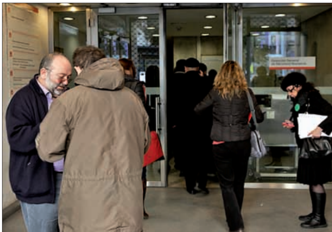
Los sindicatos a la entrada de la reunión