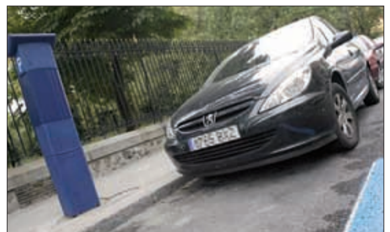
Algunas plazas azules se convertirán en verdes en los próximos meses

Por último, con respecto a las críticas de ecologistas por los al-