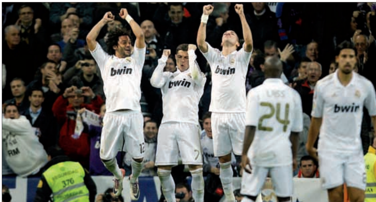
Los blancos marcan el ritmo en el campeonato de Liga

REAL MADRID Y FC BARCELONA CRUZAN SUS CAMINOS EN EL TORNEO DEL KO