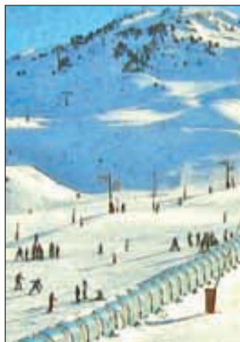
El esquí, deporte estrella

Baqueira Beret es la estación con más nieve de la península y buen ejemplo para generalizar y ejemplificar el balance del resto de sus homólogas. Esta estación, que acumula espesores de 60 cm a 160 cm, ha ofrecido a sus clientes el 100% de sus instalaciones con 113 de sus 120 km esquiabiles. De hecho, estas excelentes condiciones han sido las responsables de la gran afluencia de esquiadores durante las pasadas fiestas navideñas. Los resultados han sido muy positivos y durante las navidades han acudido a Baqueira Beret 154.693 esquia-