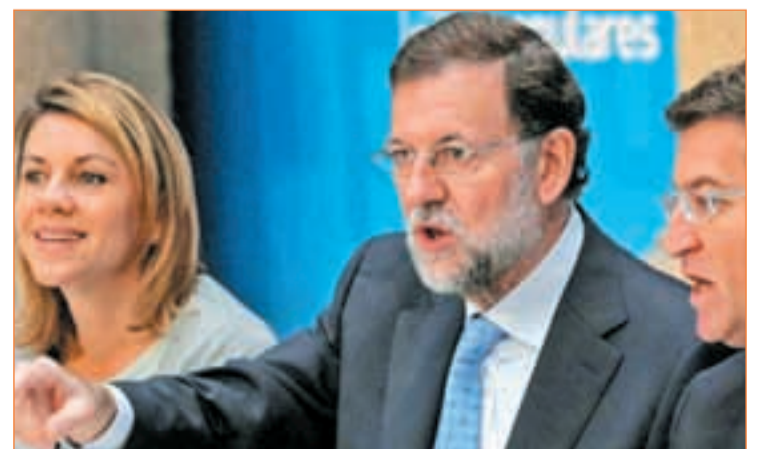
Feijóo y Cospedal con Mariano Rajoy

El portavoz adjunto del PP en el Congreso lo ha apoyado.