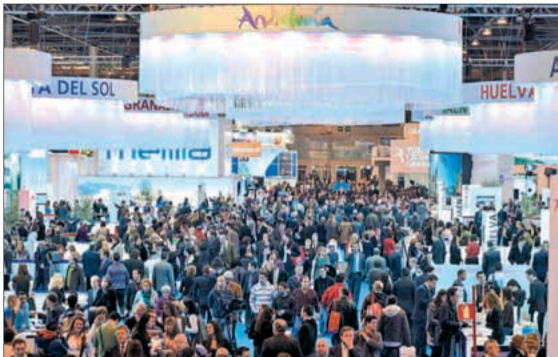
Panorámica de Fitur durante la edición de 2011

La temática que la Organización Mundial de Turismo (OMT) impulsa a través de Fitur 2012 será la Ruta de la Seda, un recorrido que abrió el primer puente de encuentro, comercialmente ha-