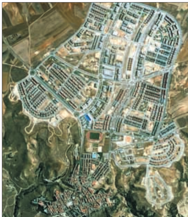
Una vista aérea del barrio de Valdecarros

El emplazamiento en el distrito madrileño tiene a su favor su buena comunicación por carretera, por su cercanía a las vías de circunvalación M-45 y M-40, y por transporte público, con la presencia del Metro. Sin embargo, en su contra, se encuentra su cercanía al completo vertedero de Valdemingó-