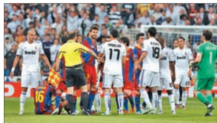
Los caminos de los dos grandes vuelven a cruzarse en el torneo del KO

Para este primer encuentro, José Mourinho tendrá la baja del sancionado Álvaro Arbeloa, expulsado ante el Málaga, y casi con toda seguridad deberá también hacer frente a la ausencia del centrocampista alemán Sami Khedira, lesionado.