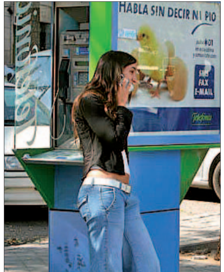
La penalización por la permanencia, uno de los motivos de protesta

En cuanto a la tramitación de las quejas, 914 de ellas se han re-