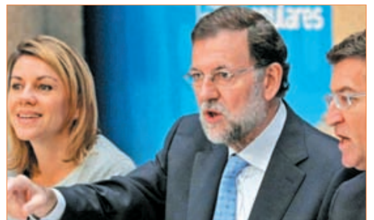
Feijóo y Cospedal con Mariano Rajoy

El portavoz adjunto del PP en el Congreso lo ha apoyado.