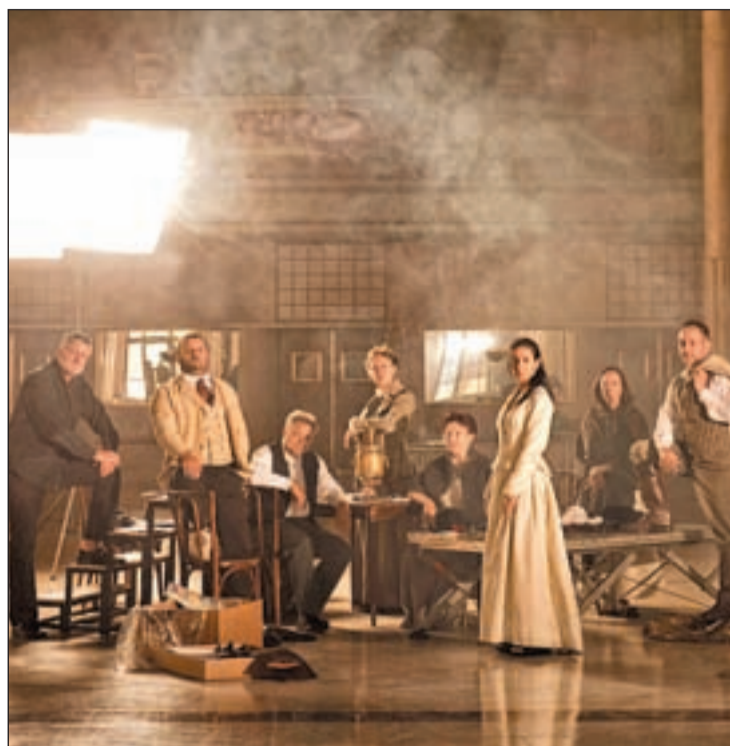
'Tío Vania' de Chéjov estará en Los Teatros del Canal