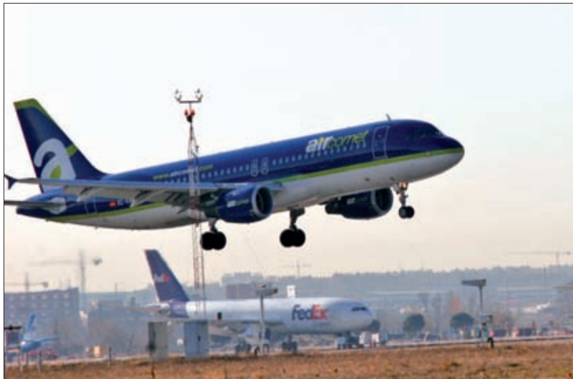
El colectivo considera que la base aérea supondría un ataque contra la salud de los vecinos