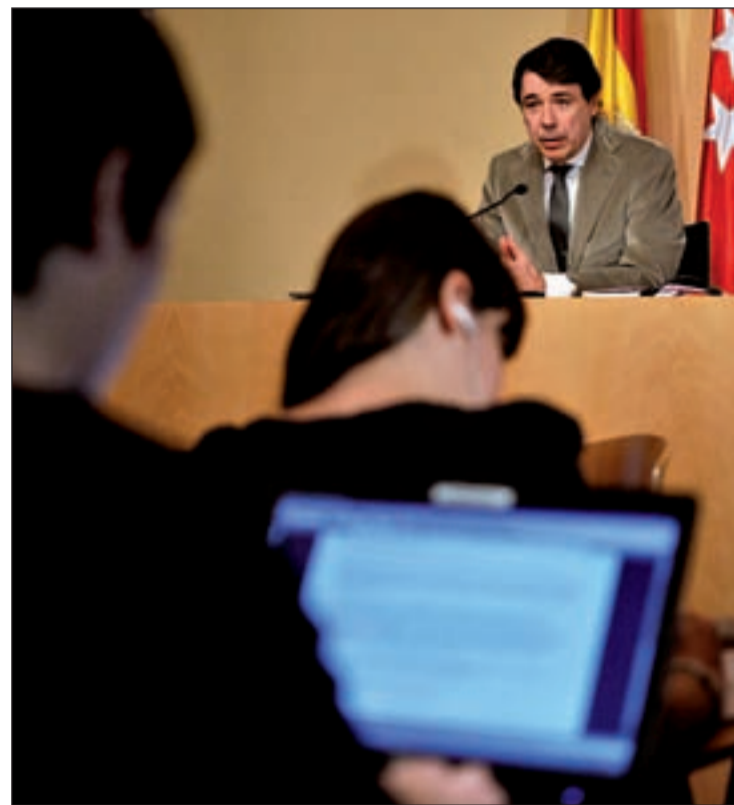
Ignacio González en la rueda de prensa posterior al Consejo de Gobierno

En este punto, ha vuelto a recordar que Madrid es "la única Comunidad Autónoma que ha cumplido con los objetivos de déficit fijados por el Gobierno en estos años", lo que, a su juicio, le ha permitido "tener una situación económica menos mala" que otras administraciones.