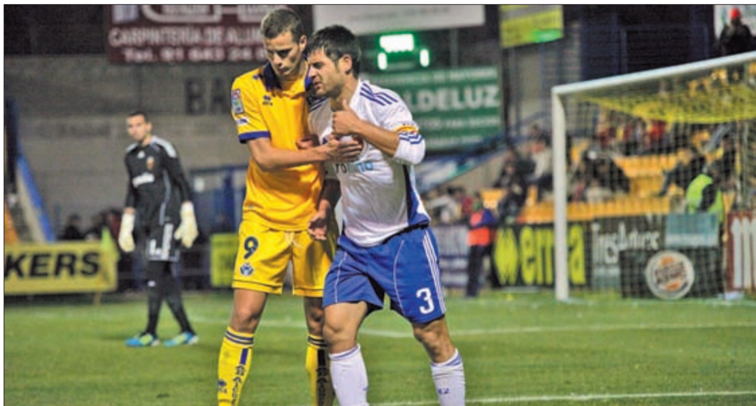
El exazulón Paredes es uno de los referentes del conjunto maño

EL GETAFE DE LUIS GARCÍA SE MIDE A UN RIVAL NECESITADO DE PUNTOS