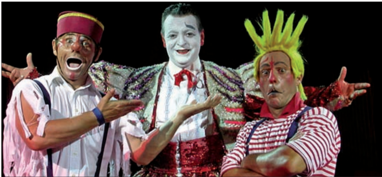
Algunos de los payasos que se darán cita el próximo 20 de enero