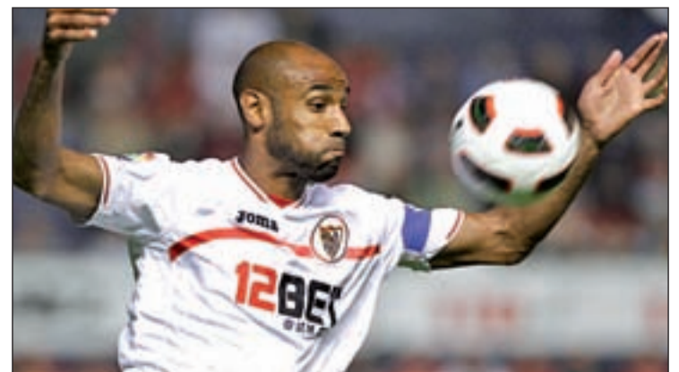
Kanouté no estará en el torneo de Guinea Ecuatorial

edición de la Copa África será seguida con mucha atención en nuestro país, ya que hasta 17 jugadores de diferentes categorías del balompié español defenderán los colores de sus países. La presencia de Guinea Ecuatorial ha servido para que este número sea sensiblemente mayor al de la anterior edición de Angola 2010.