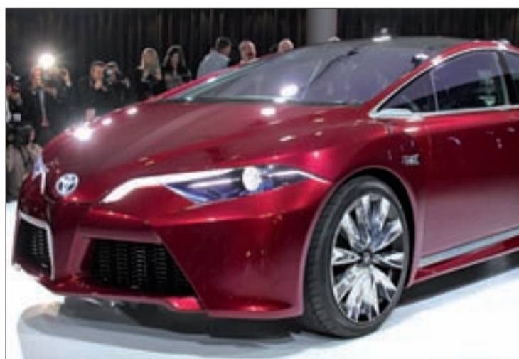
Presentación al público del híbrido de Toyota NS4

Con una inspiración similar, Honda ha presentado el concepto que marcará al nuevo Accord, que estará disponible con tracción híbrida enchufable, la cual permitirá al conductor, por ejemplo, seleccionar sólo el mo-