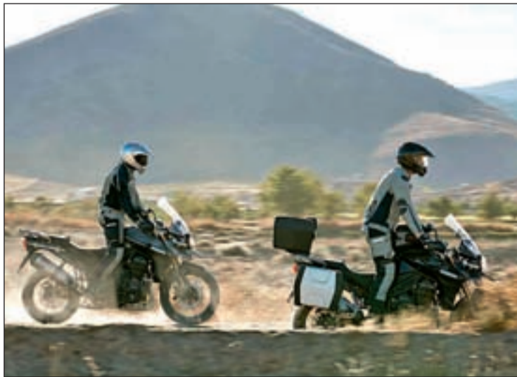
Los dos últimos modelos de la firma Triumph