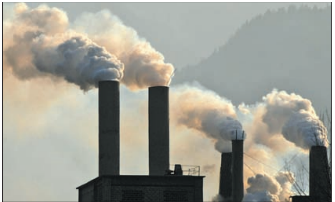
El descubrimiento se presenta como una posible solución al cambio climático

Debido a este motivo, la mayoría de países ha acordado que