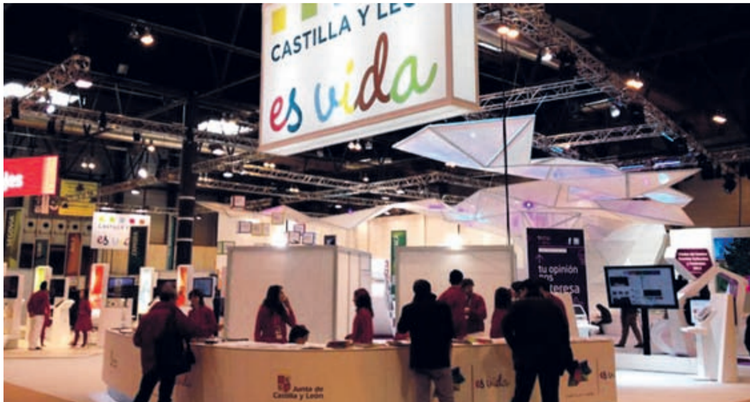
El stand de la Junta de Castilla y León en Fitur 2012 transmite una imagen “fresca, potente e innovadora con una fuerte carga profesional”.

La Junta de Castilla y León pretende transmitir el cambio de