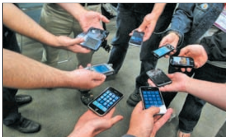
Un teléfono inteligente o 'smartphone'