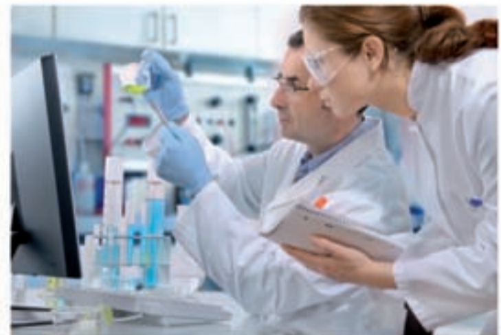
Nuestros laboratorios, siempre a la vanguardia de las nuevas tecnologías.

LA HUMEDAD amenaza tanto a la estructura del edificio como a su contenido y a sus ocupantes: pudrimiento de la carpintería, deterioro de los muebles, etc.