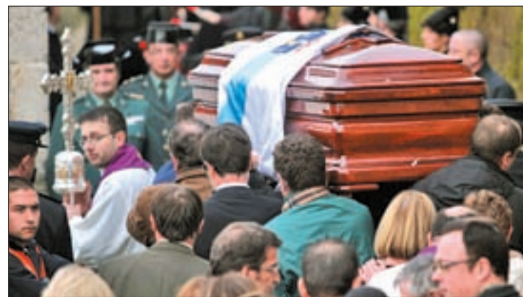
Galicia despidió a una de las figuras claves en la Transición

sonalidad propia en el seno del partido que fundó, pero que no le sirvió para escalar hacia La Moncloa. Siempre era uno de los primeros en ocupar su sitio, una costumbre que mantenía ya bien entrados los 80 en el Senado. Inquieto, era incapaz de perderse nada, especialmente si podía 'cocerse' algo interesante en él.