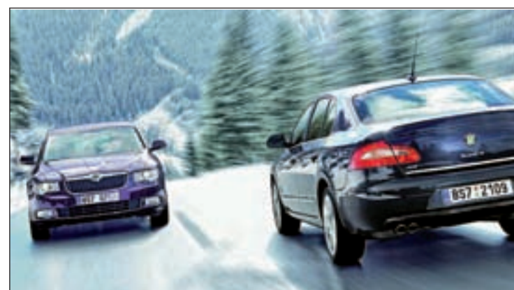
El actual límite español es de 120 kilómetros por hora

Por otra parte, Navarro ha manifestado ya en varias ocasiones su oposición a elevar a más de 120km/h los límites de velocidad en autopista puesto que en algunos países como Dinamarca, cuando en 2004 se cambió de 120 a 130 km/h el límite en las autopistas, aumentó un 20 por ciento el número de fallecidos en carretera.