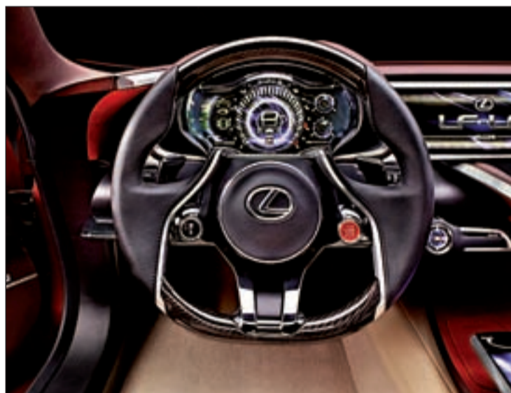
LEXUS LF-LC Incorpora la tecnología Advanced Lexus Hybrid Drive, la tercera generación de la batería híbrida de la marca. Tiene una motorización de ciclo Atkinson con batería de alto voltaje y un propulsor eléctrico mejorado.

Juke Nismo y el Leaf Nismo. La corporación ha explicado que este 'concept' se ha basado en la versión convencional del Micra, aunque incorpora componentes deportivos de Nismo, con el fin de combinar el espíritu deporti-