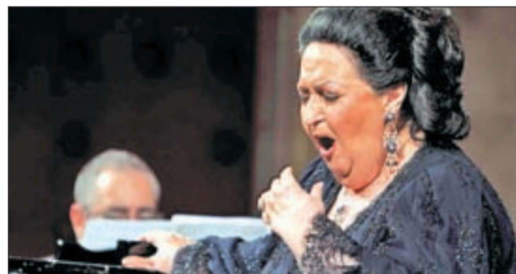
Caballé volverá a actuar el nueve de junio en Madrid

Se trataba de su primera ópera en el teatro madrileño aunque ya había dado conciertos y recitales desde su reapertura a finales de los noventa.