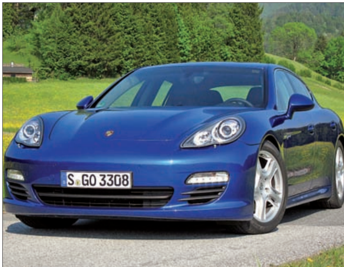
Nuevo Porsche Panamera S Híbrido 2012, el coche más económico y con menos emisiones de la firma alemana

Pero es tiempo de dejar los coches del futuro a un lado para centrarnos en los coches del presente, entre los cuales parece que, una vez más, reinan los deportivos. De hecho, la también japonesa firma de automóviles Nissan ha desvelado el nuevo 'concept' Micra Nismo. Esta nueva revolución en el mundo del motor representa el tercer modelo compacto deportivo que desarrolla la división de alto rendimiento de la compañía, tras el