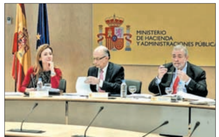
Montoro y su equipo tras el Consejo de Política Fiscal y Financiera

Sin embargo, en esta ocasión la liquidez va acompañada por una batería de sanciones para quienes incumplan los límites de déficit. Además exigirá responsabilidades penales a los gestores públicos que gasten más de lo presupuestado o guarden “facturas en el cajón”. La primera es que el Ejecutivo hará pagar a la autonomía la posible sanción que imponga Bruselas al Estado