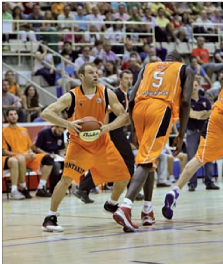
El Fuenlabrada de Fisac, uno de los implicados

Antes de que dé comienzo esta jornada, el honor de ocupar la octava posición recae en el CAI