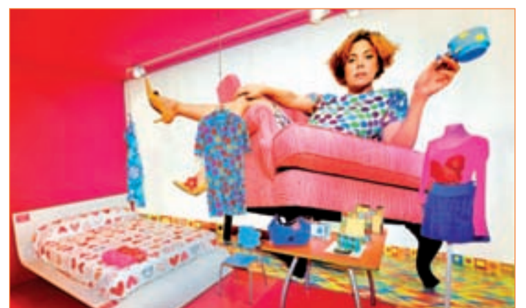
Escaparate de la firma Agatha Ruiz de la Prada

El mejor diseño tampoco podía faltar en estas jornadas. Las principales tiendas de la Milla del Oro, como Agatha Ruiz de la Prada, Adolfo Domínguez o Roberto Verino personalizarán sus escaparates con motivos culinarios en el Gastrofashion.