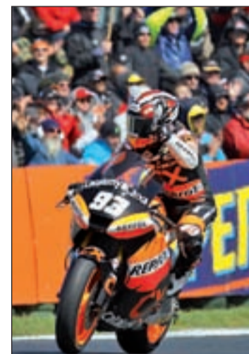
Márquez ya está en casa

Después de la decisión de pasar por el quirófano al no recuperar el nivel óptimo de visión, Márquez afronta un periodo de recuperación que pone en duda su