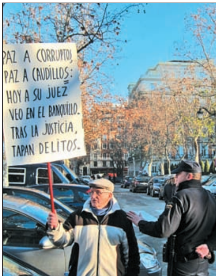
Uno de los asistentes a las protestas por el juicio contra Garzón

Garzón ha sido contundente al asegurar que las escuchas, autorizadas a petición de la Policía y la Fiscalía Anticorrupción, no se ordenaron para impedir el dere-