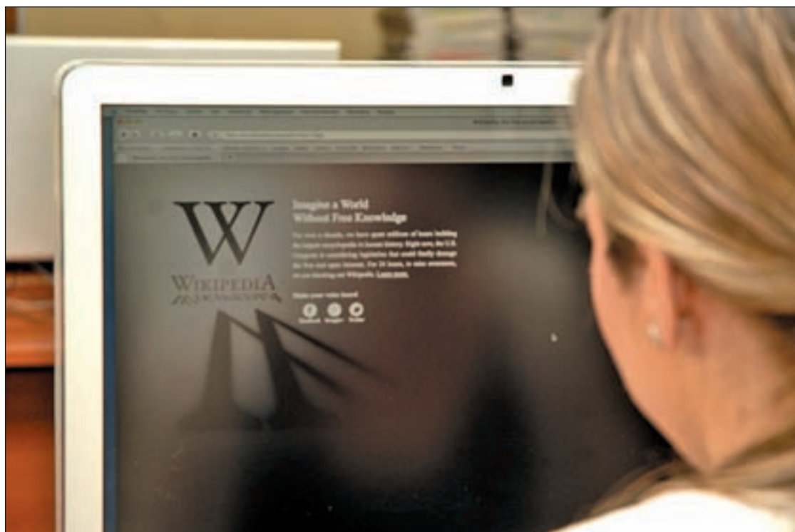
Apagón virtual en protesta de la ley estadounidense de descargas

La red ferroviaria pretende mejorar el servicio con la incorporación de nuevos paquetes especiales con descuentos destinados a viajeros nacionales e internacionales. En definitiva, se trata de una experiencia que conjuga las múltiples ventajas que, de un lado, ofrece la Alta Velocidad Española como medio de transporte con la belleza, de otro, de los distintos destinos que integran esta red de ciudades", concluyeron las mismas fuentes.