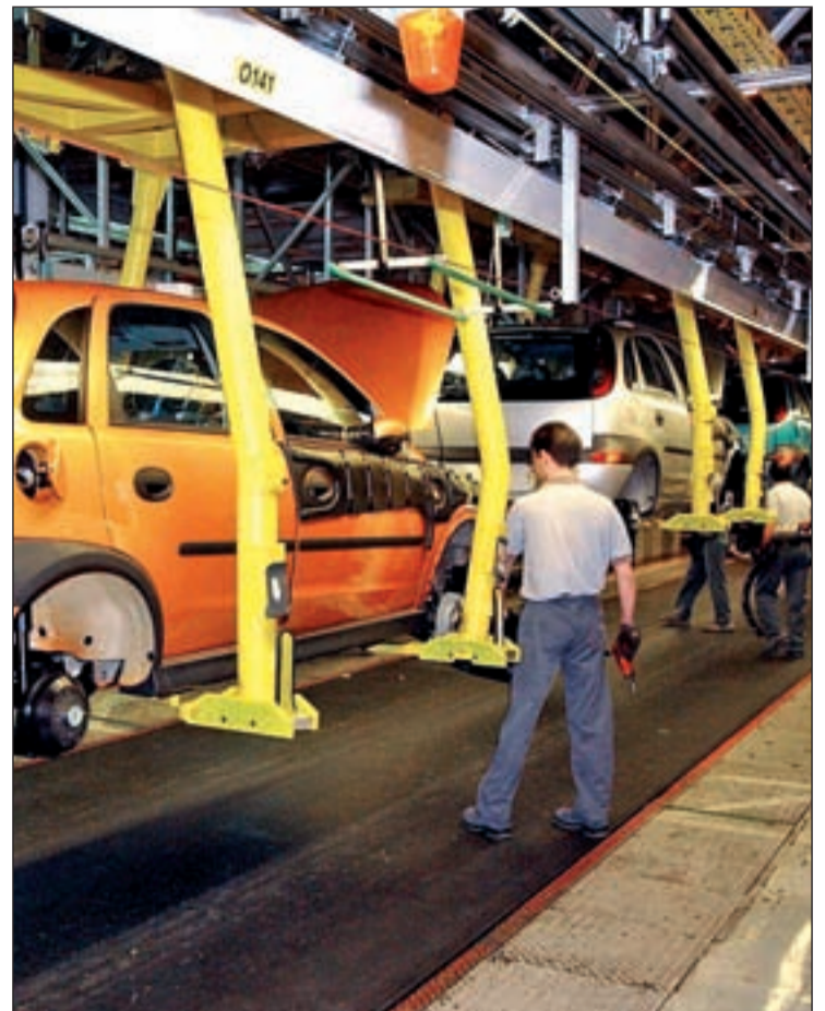
Trabajadores de la planta de GM en Figueruelas

Matizando de una forma más exacta podemos decir que los datos han puesto de manifiesto un crecimiento mínimo en las ventas a particulares, que acumulan un total de 17 meses consecutivos de caída. Contrariamente, las compras por parte de compañías de alquiler se dispararon un 218,2% en la primera mitad de enero y, por último,