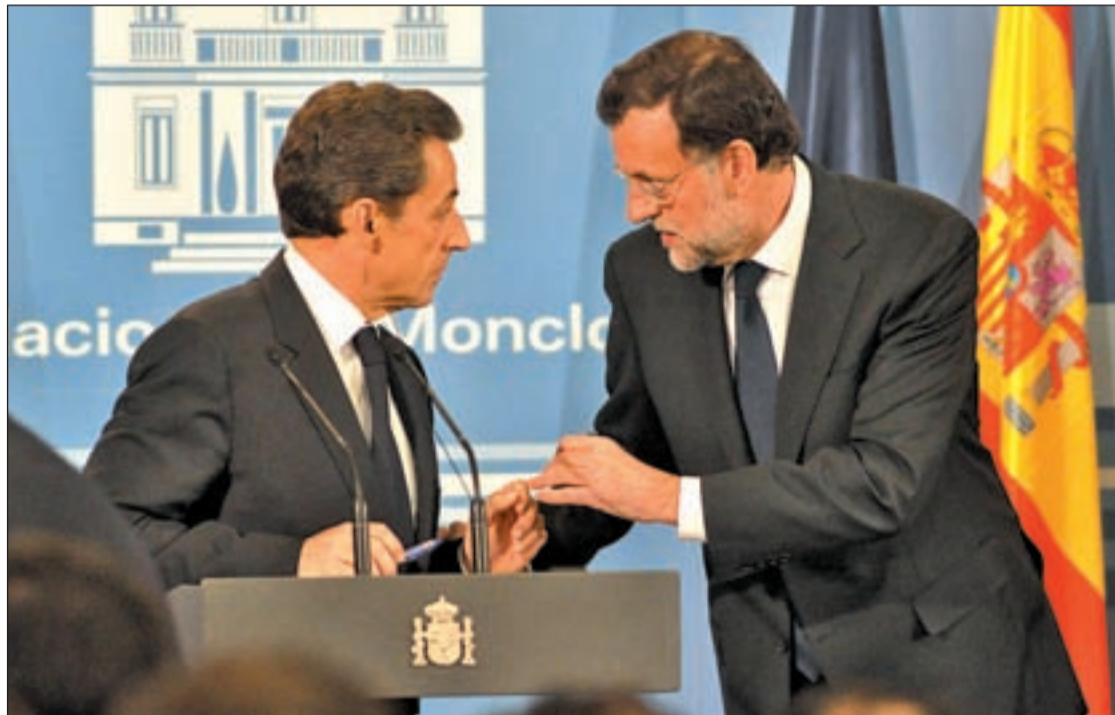
El presidente, Mariano Rajoy, hablando con su homólogo francés, Sarkozy, antes de su comparecencia

El presidente afirmó que ha sido una decisión que a él “personalmente” le había costado adoptar. Pero alegó que la situación es “muy complicada” y la alternativa era “no haber hecho absolutamente nada, dar un pésimo mensaje y no contribuir a resolver los problemas de España”. Así ha justificado la aplicación de la subida de los gravámenes que actúan directamente en la renta de los trabajadores.