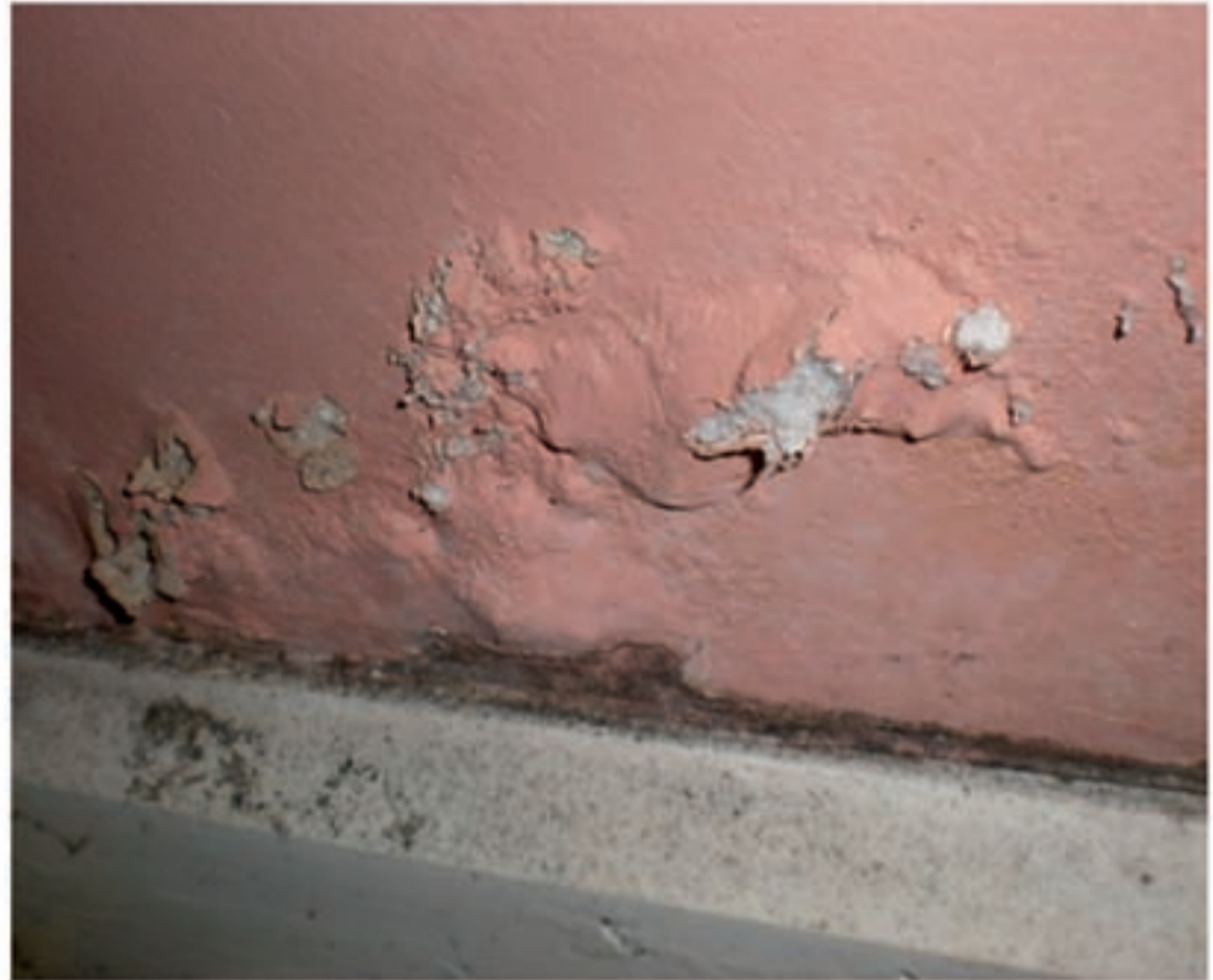
Problemas de humedad en una vivienda.

Se han realizado estudios científicos sobre adolescentes que sufren afecciones respiratorias, dando como resultado un 83% de asma, bronquitis asmáticas y bronquitis crónicas y un 87% de rinitis crónicas, que alcanzan a jóvenes que viven en habitaciones demasiado húmedas. De un 20 a un 30% de nosotros sufrimos alergias respiratorias, ¿dos veces más que hace 20 años!. Edouard Drouhet, jefe de microbiología en el Instituto de la Salud Pública Louis Pasteur, explica este aumento por nuestro modo de vida: "Vivimos más en el interior, en casa o en el despacho. Desde los años 60, tendemos a