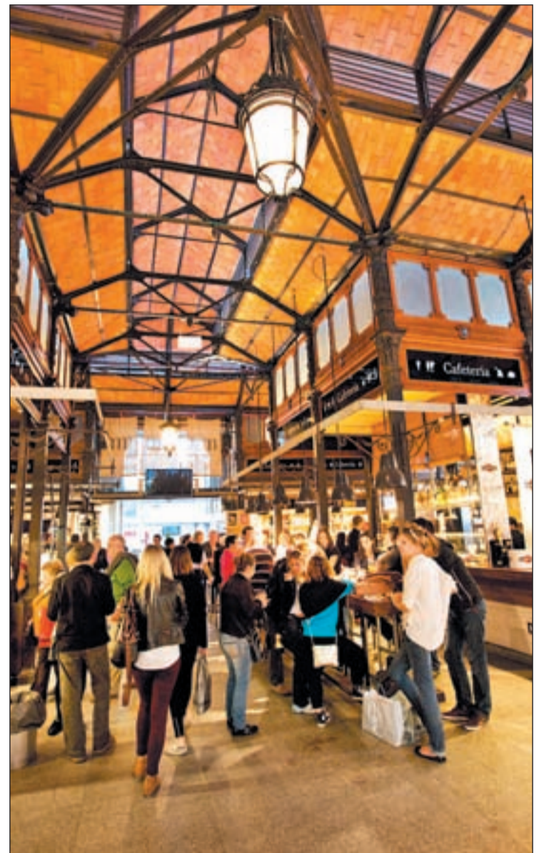
Mercado de San Miguel, referente culinario de la ciudad

Así el restaurante Pedro Larrumbe contará con la maestría del portugués José Avillez, el Jardín de Orfila con el mexicano Juan José Gómez, el poseedor de dos estrellas Michelin, la Terraza del Casino con GiHo Yim, The Westin Palace con el prestigioso cocinero coreano Yung Sik Yim, el recién inaugurado restaurante del Palacio de Cibeles con el turco Aidin Demir y el Restaurante Miyama Castellana con el japo-