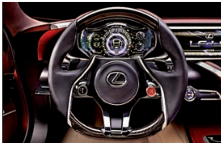
LEXUS LF-LC Incorpora la tecnología Advanced Lexus Hybrid Drive, la tercera generación de la batería híbrida de la marca. Tiene una motorización de ciclo Atkinson con batería de alto voltaje y un propulsor eléctrico mejorado.

versión convencional del Micra, aunque incorpora componentes deportivos de Nismo, con el fin de combinar el espíritu deportivo con las tan esperadas altas