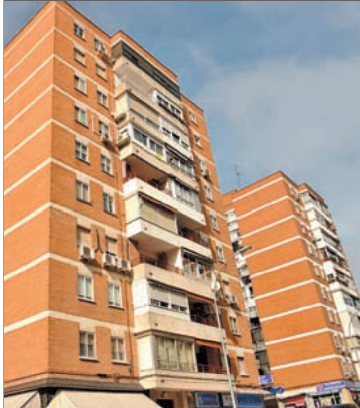
Edificio de viviendas en Fuenlabrada

Robles ha asegurado que con esta medida el Gobierno central "descarga" el peso de la crisis en los bolsillos de los ciudadanos, además de vaticinar un año "complicado y complejo" como consecuencia de las subidas del IRPF y del IBI. Por este motivo, el Gobierno local ha anunciado su intención de iniciar una campaña de información entre los vecinos, "informándoles de este pro-