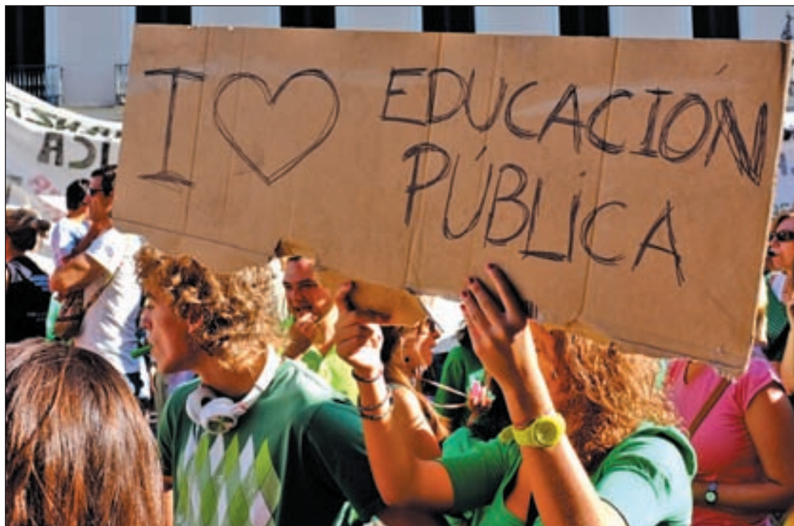
Los docentes han protestado por los recortes en nueve jornadas de huelga en los últimos meses

Las entidades pagan hasta 81 euros por tonelada en concepto de recepción, clasificación y almacenamiento de los Residuos de Aparatos Eléctricos y Electrónicos (RAEE) en las instalaciones municipales. Además, pagan los costes asumidos por la entidades locales en concepto de transporte desde las instalaciones municipales, aplicando estos beneficios con carácter retroactivo desde 2005 para los municipios que puedan acreditar facturas. Para acceder al cobro, las entidades deberán acreditar la adhesión al convenio marco así como a campañas de sensibilización y acciones de información a ciudadanos, empresas y otros usuarios locales.