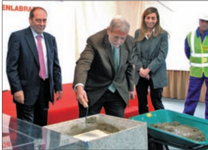
Colocación de la primera piedra de El Bañuelo en abril de 2011