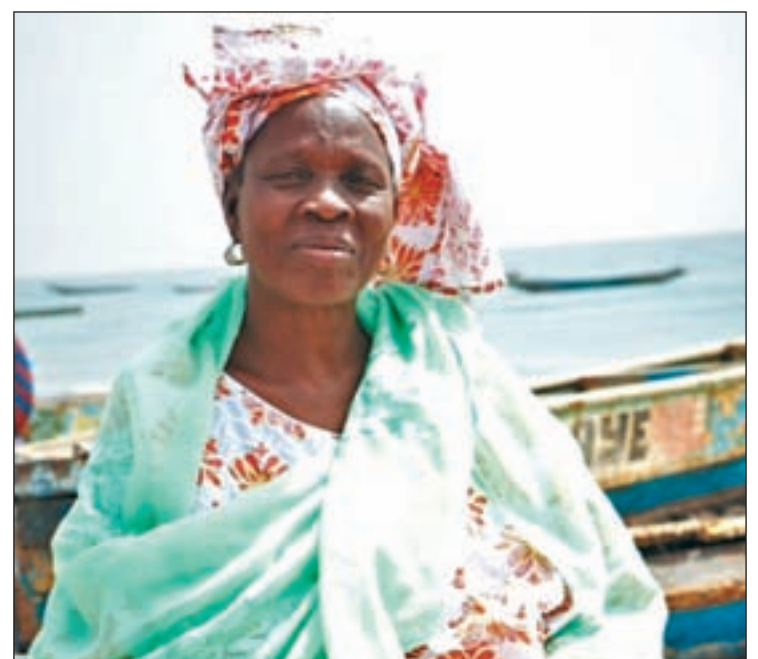
Imagen de una de las fotografías de la exposición

A través de las voces de estas nueve mujeres, la organización no gubernamental Habitáfrica quiere explicar las causas que empujan a estas personas a salir de su tierra y los efectos que conlleva el largo proceso, siempre aportando una visión positiva de estas mujeres como motor del desarrollo de África.