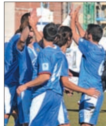
El Fuenla sigue lanzado A.BAQUERA

taja de cinco puntos respecto a su inmediato perseguidor. Ese colchón permite a los de Antolín Gonzalo visitar con cierta tranquilidad a otro de los aspirantes a jugar la fase de ascenso, como es el Parla. Los pupilos de Julián Calero se reencontraron con la victoria la jornada anterior tras ganar en Villaviciosa de Odón.