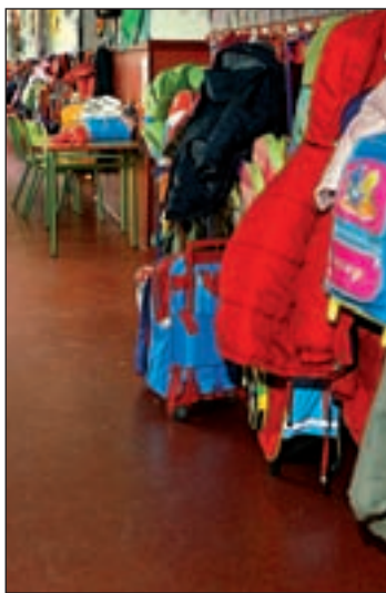
Imagen de una guardería

Ante la información publicada por el periódico 20 Minutos, situando la escuela al borde del cierre, y frente a denuncias como la recibida en Gente en los últimos días, Ludoland ha emitido un comunicado en el que demuestra que no tiene intención alguna de cerrar el centro. Así, la