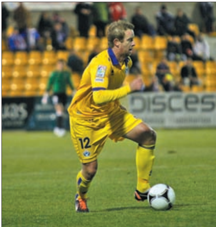
Carney lleva dos jornadas sin contar para Anquela

Pese a estar cumpliendo con el objetivo marcado, la sensación