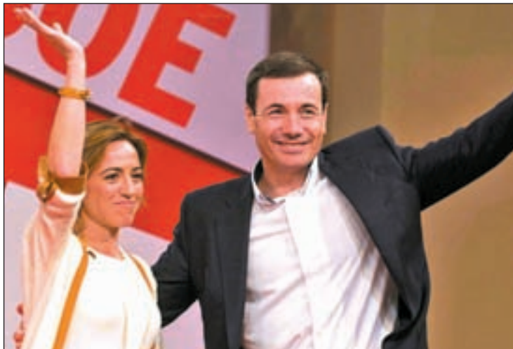
La candidata Carme Chacón con el líder del PSM, Tomás Gómez

Pero lo que no se sabe aún es si será el propio Gómez quien encabece una tercera vía para llegar a la secretaría general del partido nacional, aunque por el momento no hay nada escrito sobre esta posibilidad. Hasta ahora, en las diferentes agrupaciones socialistas de Madrid,