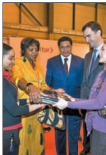
Los príncipes en Fitur

De este modo, la CAM y el Ayuntamiento comparten más de 2.000 metros dentro del actual escenario de restricción presupuestaria. Estos recortes permiten reducir los costes, puesto que ambas instituciones redu-