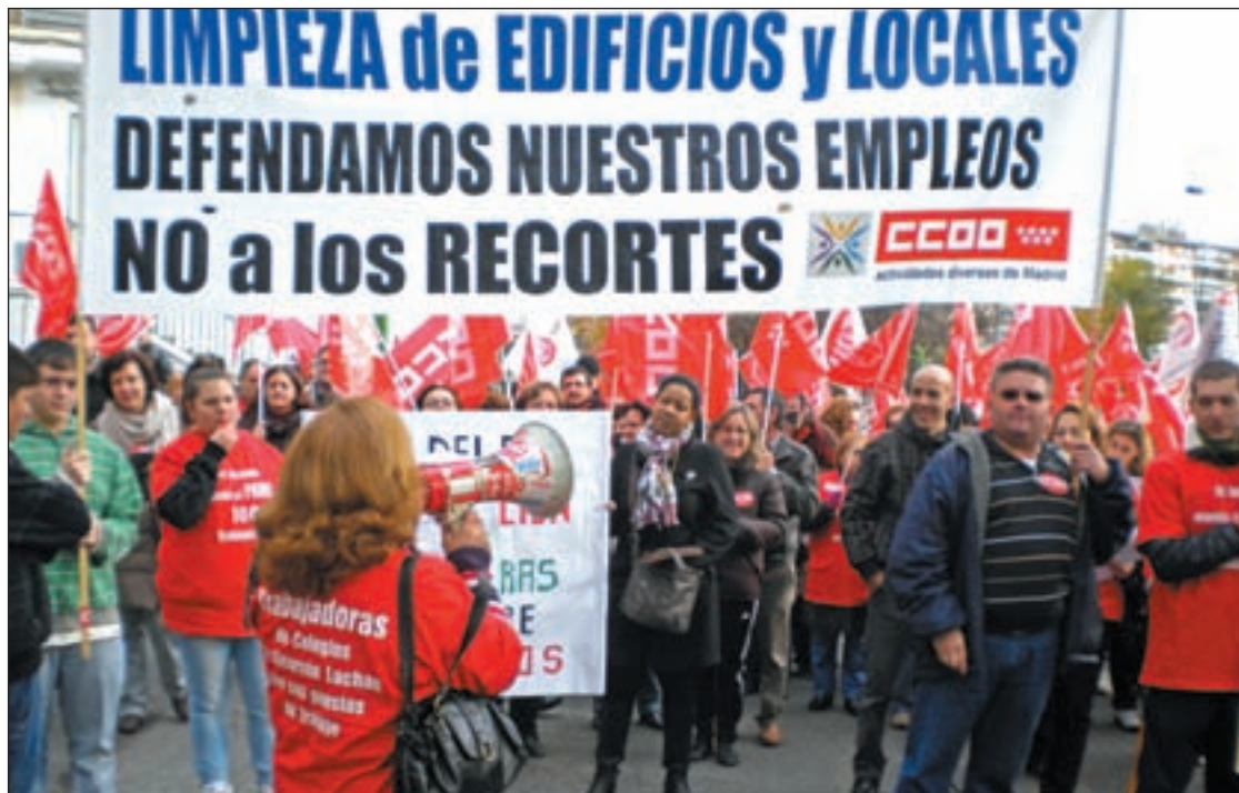
Concentración convocada por los trabajadores de Garbaldi el pasado diciembre

Los 98 empleados afectados de Garbaldi presentaron el pasado martes una demanda en el Registro del Ayuntamiento para que se les abonen las nóminas, coincidiendo con la celebración de la Junta de Gobierno. En el