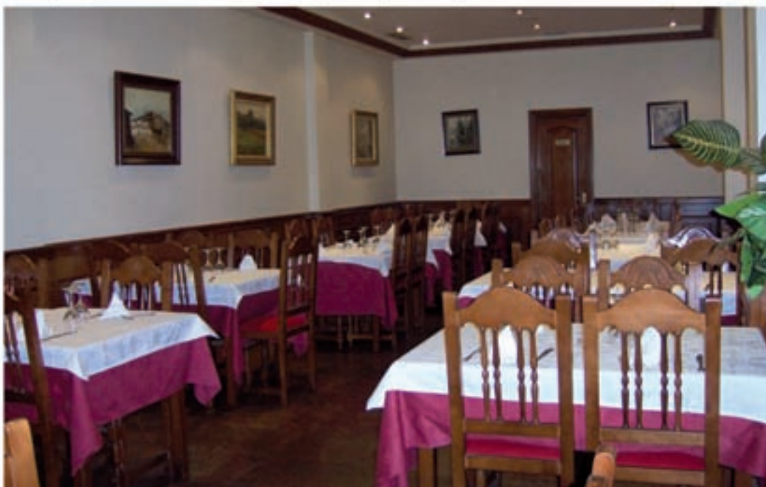
La Cruz de la Victoria de Asturias y varios cuadros decoran el acogedor salón del restaurante Los Cantos

Un servicio atento siempre supervisado por su dueño, hace de éste un sitio para visitar con unos precios muy ajustados.