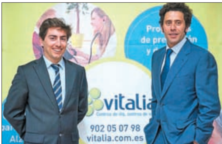
Un momento de la inauguración