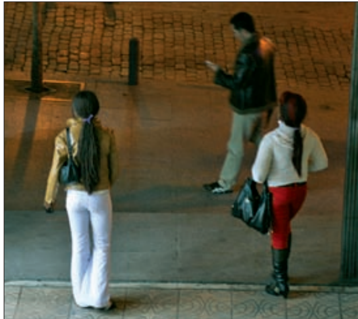
La calle Montera es uno de los núcleos problemáticos

“No hace falta penalizar, sino pensar que las mentalidades cambian, por lo que hay que hacer saber al cliente que posiblemente esas mujeres no son total-