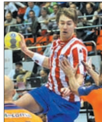
El sueco ya está recuperado