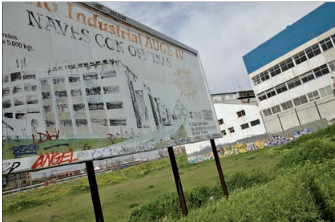
Uno de los polígonos industriales de la ciudad de Madrid

Con esta actuación, el Ayuntamiento de Madrid pretende