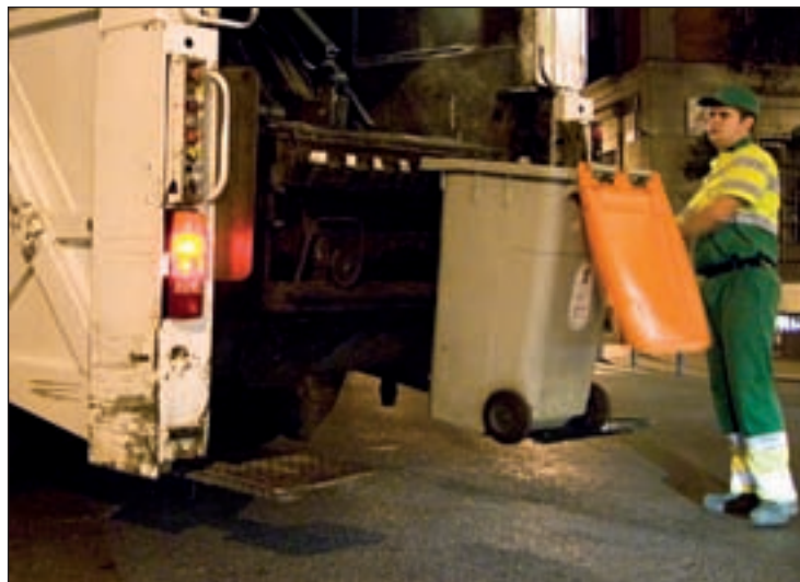
Limpieza y zonas verdes, servicios experimentales

Para este cometido, se licitará a un único adjudicatario un nuevo contrato -se pondrá en marcha cuando concluyan los actuales- que cubrirá las actividades mencionadas en un núcleo poblacional que alcanza los 425.000 habitantes. La actuación afecta a 5,3 millones de metros cuadrados entre aceras y calzadas, además de 29 hectáreas de zonas verdes,