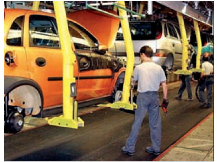
Trabajadores de la planta de GM en Figueruelas

Lo que también ha crecido en España son las matriculaciones de automóviles, que sumaron alrededor de 19.835 unidades en la primera quincena de enero, un 14,7% en comparación con el mismo período de 2011. Es iaho-