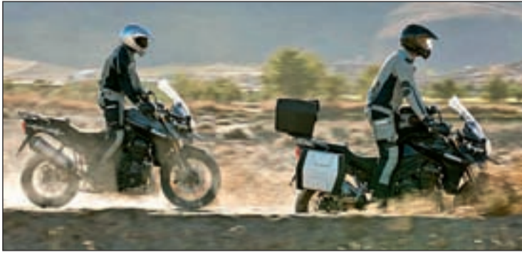
Los dos últimos modelos de la firma Triumph