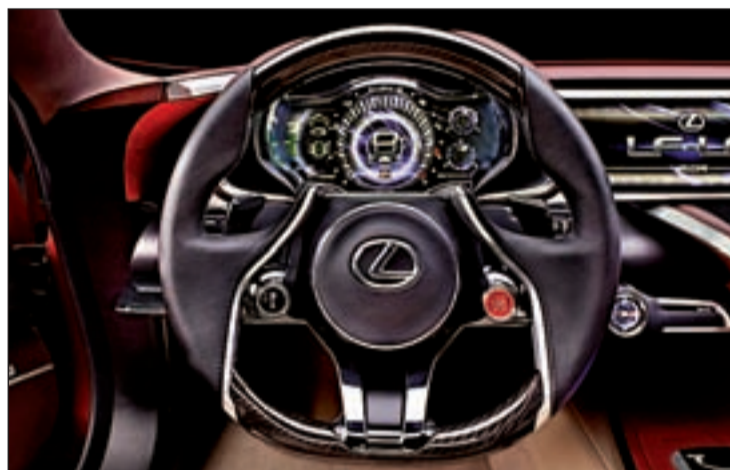
LEXUS LF-LC Incorpora la tecnología Advanced Lexus Hybrid Drive, la tercera generación de la batería híbrida de la marca. Tiene una motorización de ciclo Atkinson con batería de alto voltaje y un propulsor eléctrico mejorado.

versión convencional del Micra, aunque incorpora componentes deportivos de Nismo, con el fin de combinar el espíritu deportivo con las tan esperadas altas