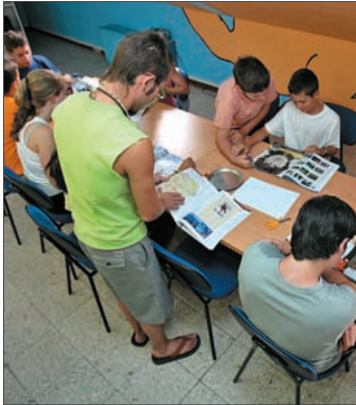
El curso pretende dotar a los más jóvenes de habilidades

Los interesados pueden formalizar la inscripción hasta el 10 de febrero solicitándola a formacion.juventud@ayto-getafe.org , a través de una ficha que se podrá descargar en Masjovengetafe.com , o personalmente en el SIAJ (calle Polvoranca, 21. Tfno. 91 202 79 91). Del 14 al 16 febrero se convocarán a una serie de entrevistas tras las cuales saldrán las listas de inscritos quienes podrán realizar la inscripción definitiva desde el 21 hasta el 28 de febrero mediante el abono de cuotas en la calle Béjar nº