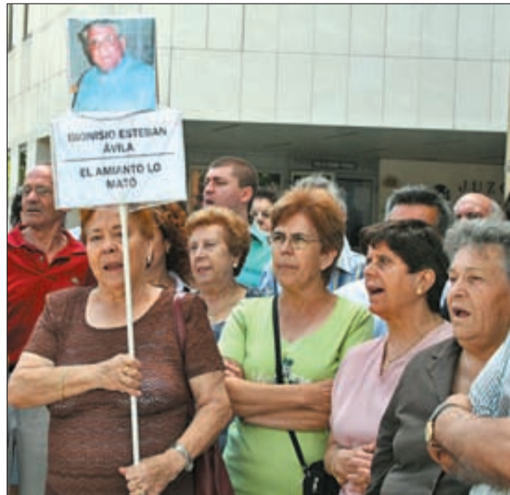
Concentración de afectados

En un juicio celebrado el pasado lunes en un Juzgado de lo Social,