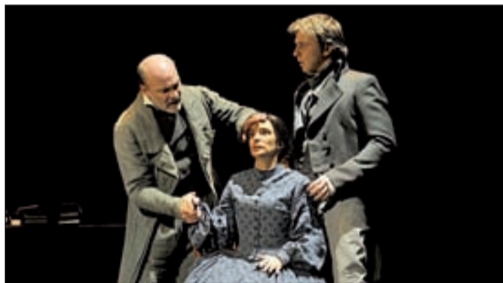
Una escena de la representación 'Madame Bovary'

Tanto el reparto como la dirección destacan en esta representación. La conocida Magüi Mira, tras 30 años de carrera sobre las tablas, es la encargada de