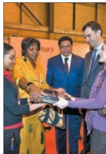
Los príncipes en Fitur

De este modo, la CAM y el Ayuntamiento comparten más de 2.000 metros dentro del actual escenario de restricción presupuestaria. Estos recortes permiten reducir los costes, puesto que ambas instituciones redu-