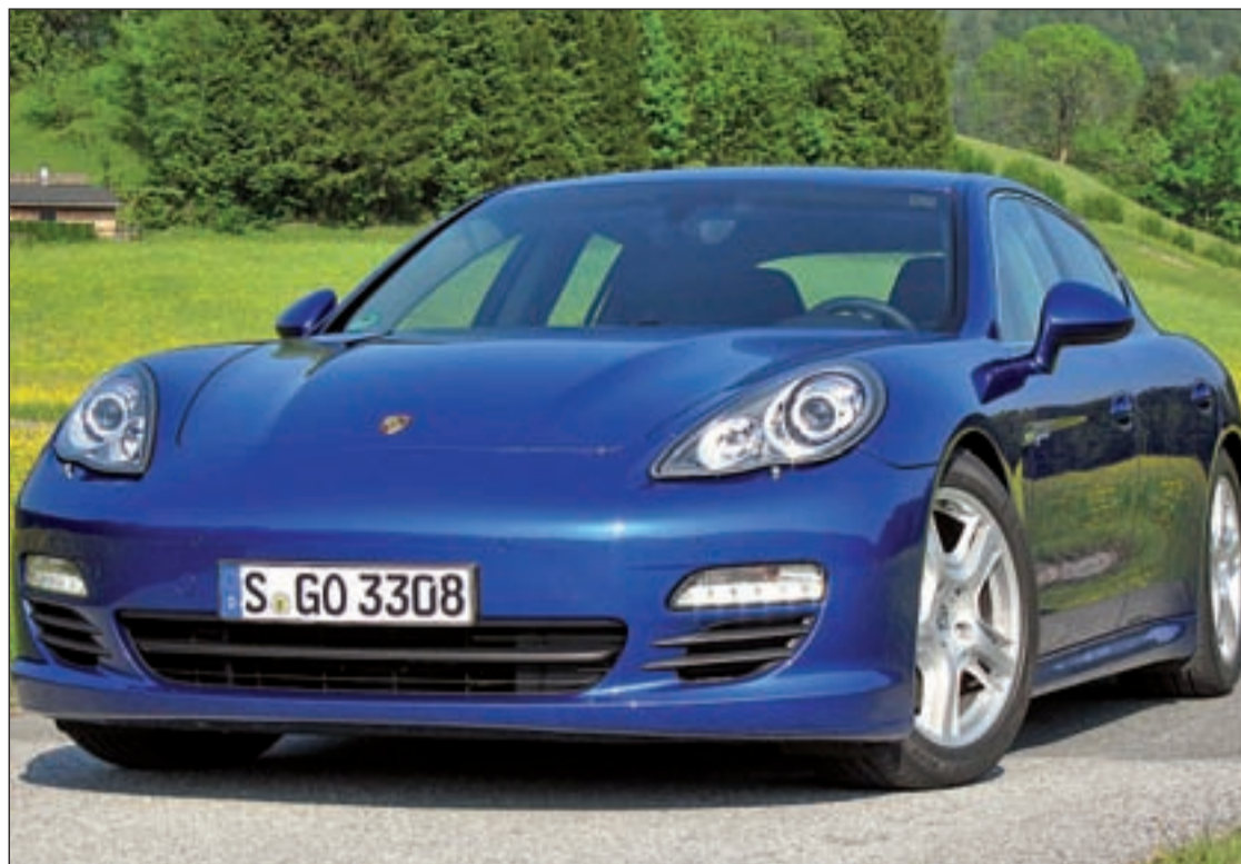
Nuevo Porsche Panamera S Híbrido 2012, el coche más económico y con menos emisiones de la firma alemana

Pero es tiempo de dejar los coches del futuro a un lado para centrarnos en los coches del presente, entre los cuales parece que, una vez más, reinan los deportivos. De hecho, la también japonesa firma de automóviles Nissan ha desvelado el nuevo 'concept' Micra Nismo. Esta nueva revolución en el mundo del motor representa el tercer modelo compacto deportivo que desarrolla la división de alto rendimiento de la compañía, tras el Juke Nismo y el Leaf Nismo. La corporación ha explicado que este 'concept' se ha basado en la