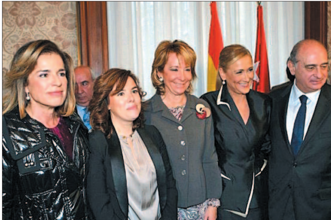
Cristina Cifuentes acompañada de Saenz de Santamaría, Aguirre y Botella

También confirmó que se va a reunir con los representantes de