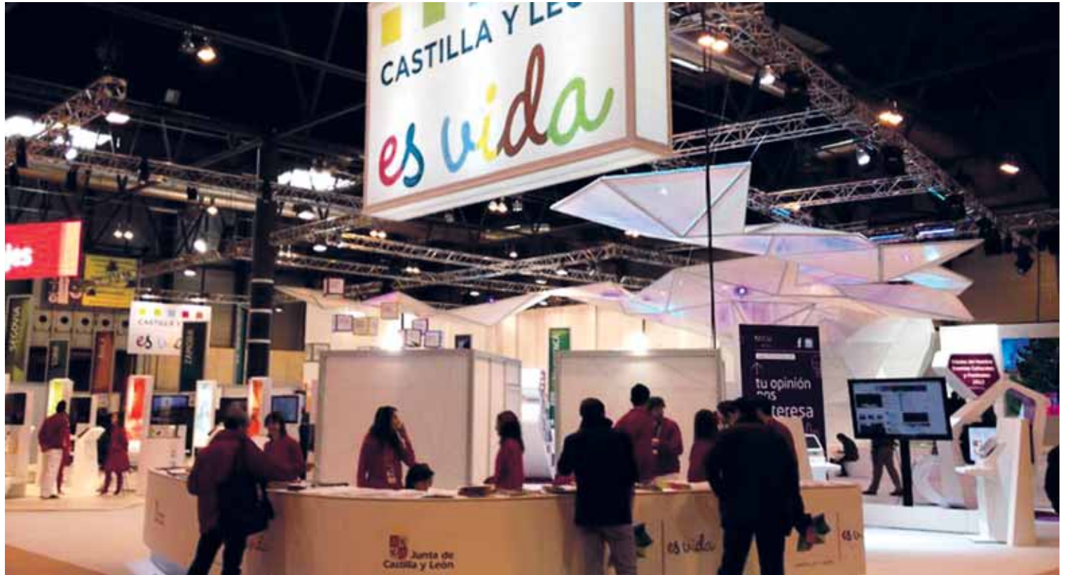
El stand de la Junta de Castilla y León en Fitur 2012 transmite una imagen "fresca, potente e innovadora con una fuerte carga profesional".

La Junta de Castilla y León pretende transmitir el cambio de