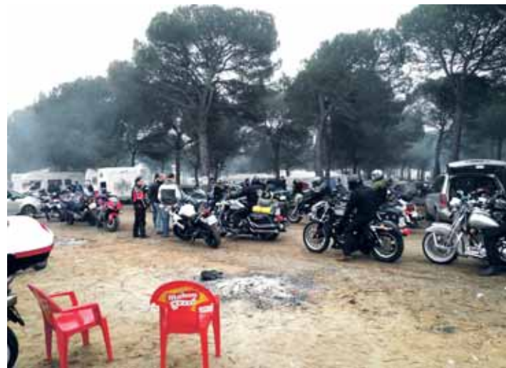
Clausura de Motauros de la pasada edición.

El motoclub gasta lo que ingresa y hará un esfuerzo en seguir prestando los mismos servicios que hasta ahora. La actuación musical del viernes correrá a cargo de 'Los Suaves'. El sábado habrá una excursión a Matapozuelos, organizada junto a la Posada Restaurante LienZero, y por la tarde una actuación acrobática a cargo de Narcís Roca. El mismo día en la carpa principal de la concentración se desarrollará la quinta edición del Bike Show Motauros y el segundo festival de grupos noveles para finalizar la jornada con el desfile de antorchas. A partir de las 23.30 horas tendrá lugar el homenaje a todos los moteros fallecidos este año.