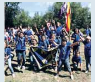
Grupo de scouts.