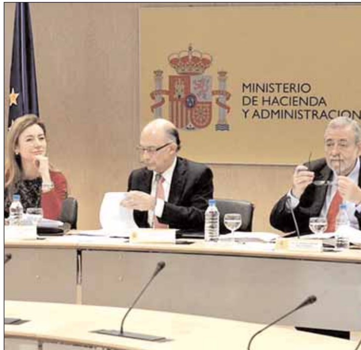
Montoro junto a su equipo en el Consejo de Política Fiscal y Financiera

La liquidez va acompañada por una batería de sanciones para quienes incumplan los límites de déficit. El Gobierno exigirá responsabilidades penales a los gestores públicos que gasten más. Una medida duramente criticada por todas las fuerzas de la oposición. Además se pondrá un interventor a vigilar la ejecución presupuestaria de las autonomías incumplidoras. Asimismo, hará pagar a la autonomía la sanción que imponga Bruselas al Estado por el desvío del déficit total. También las más derrochadoras se verán privadas de las ayudas económicas lanzadas desde La Moncloa.