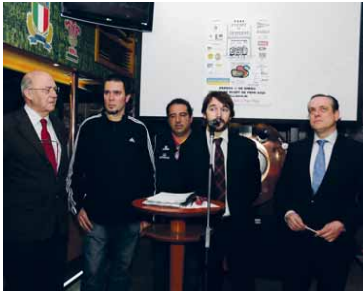
Presentación del campeonato del Torneo de Invierno.

DIVISIÓN DE HONOR. Al día siguiente, el domingo 22, llegará el turno para los mayores en la Liga de División de Honor. El Cetransa se medirá al Ordizia, mientras que el Quesos jugará el sábado en Guecho con la intención de recortar distancias con el primer puesto de la clasificación, que ocupa Santboi.