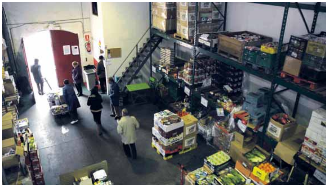
Vista panorámica del Banco de Alimentos en el callejón de la Alcoholera.

Aunque las ayudas son cada vez menores, el Banco de Alimentos sigue creciendo cada año y entregando comidas a las más necesitadas. En 2011 fueron más de 1.675 toneladas de productos , unas cifras similares a las de años anteriores, con una apuesta por la entrada de nuevos alimentos, como el aceite, con los que hacer frente a la crisis, para, a través de 189 asociaciones ((71 asociaciones, 60 agrupaciones de Cáritas y 31 conventos), llegar a más de 20.000 beneficiarios.