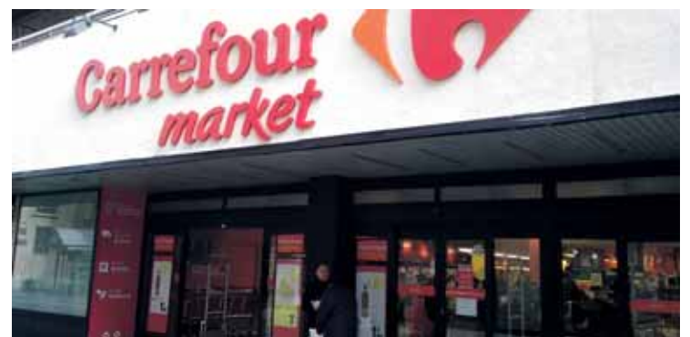
El centro Carrefour de la calle Santiago.

La mecánica de la iniciativa es simple: el cliente mayor de 65 años sólo debe darse de alta en el Club Carrefour (que es gratuito) y obtener la tarjeta +65 tras acreditar tener esa edad o superior. De este modo, al presentar la tarjeta en caja se le descuenta el IVA de forma automática, en el momento de pago, y aparece reflejado en el ticket de compra. Aquellos clientes mayores de 65 años que ya sean socios del Club Carrefour recibirán de forma inmediata su tarjeta con la que podrán adquirir estos productos sin IVA. Además, con el fin de agilizar los trámites, la compañía ha puesto a disposición de este colectivo azafatas en sus supermercados que se encargarán de ayudar a todos aquellos interesados en darse de alta.