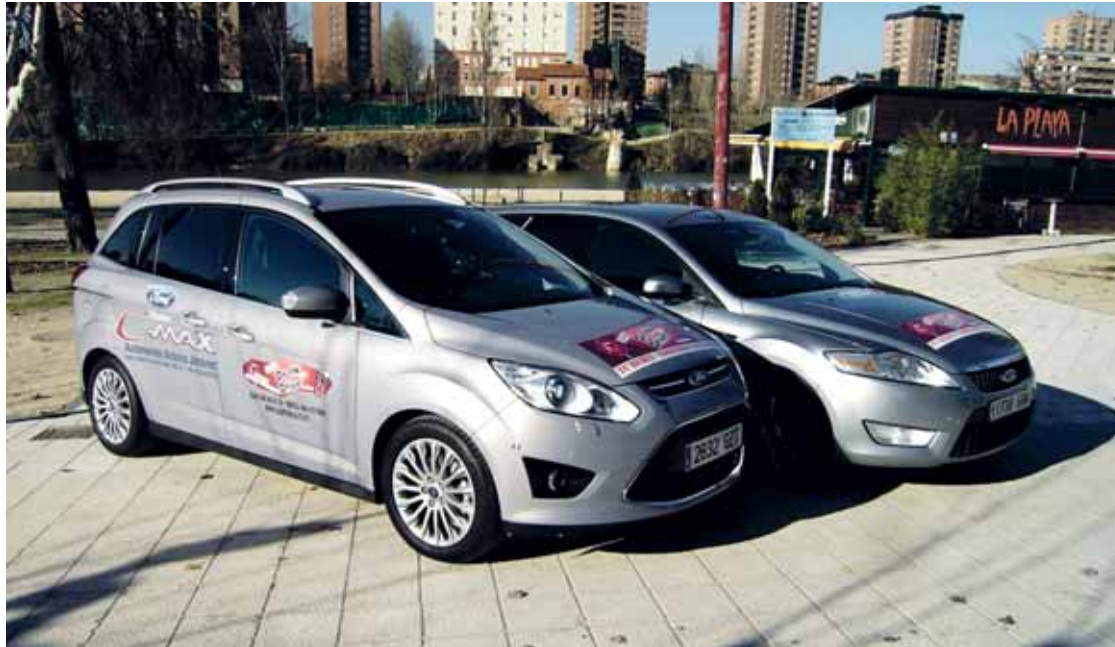
Algunos de los vehículos que forman parte de la flota de Kapitolia - Don't Drink and Drive.

Este joven búlgaro opina que hay atisbos de altruismo en su negocio: “Lo que quiero es ayudar