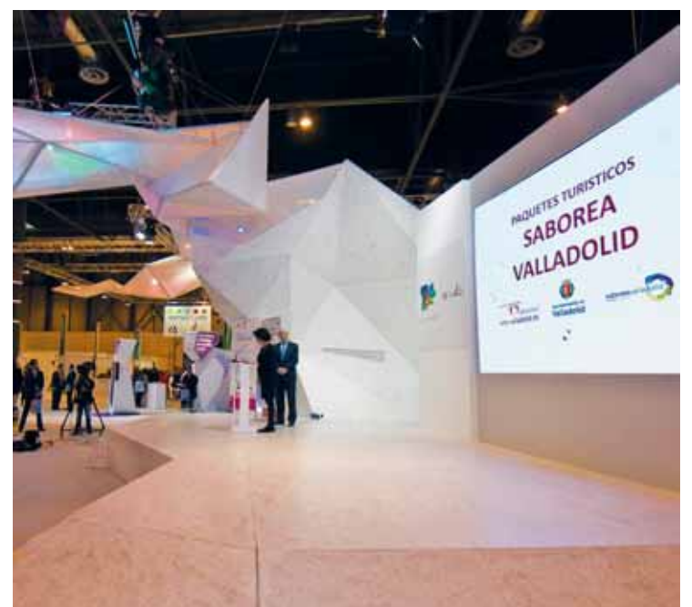
Las tres ofertas se engloban en el programa 'Saborea Valladolid'.