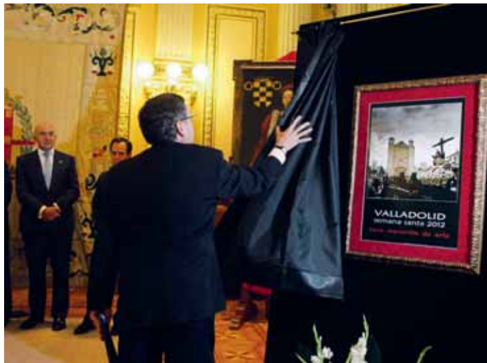
Presentación del cartel de la Semana Santa de Valladolid 2012.

La proclamación fue hecha pública durante la presentación del cartel anunciador del presente año, que refleja una imagen de La Quinta Angustia (Gregorio Fernández, hacia 1625) a su paso por la plaza de San Pablo y que incluye el lema 'Pura maravilla de arte' del fotógrafo José María Pérez Concellón. El célebre imaginero la talló por encargo de la Cofradía de Nuestra Señora de la Piedad, fundada en 1578, y en el cartel anunciador aparece durante la procesión de Penitencia y Caridad a su paso por la Plaza de San Pablo. La Semana Santa de Valladolid, con ta-