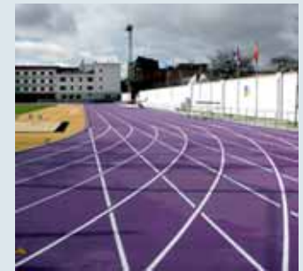
Pistas de Río Esgueva.

■ La falta de instalación cubierta en la región, y la negativa de Oviedo a repetir esta vez como sede, hará que el Autonómico Absoluto de pista cubierta se dispute en esta ocasión en Río Esgueva. Sin embargo, lo curioso es que la competición de pista cubierta se hará...en pista al aire libre. Lo nunca visto. Después de 21 años viajando a Oviedo, los atletas disputarán el Campeonato de Castilla y León en pista cubierta en tierras vallisoletanas. Este fin de semana, además del Campeonato de Castilla y León de pruebas de anillo (200m metros,