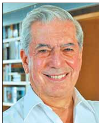
Mario Vargas Llosa

farel, quien ocupa el cargo desde 2007. De momento, el Gobierno está a la espera de la respuesta definitiva que dé Vargas Llosa y asume que, si aceptara el cargo, implicaría alguna modificación en la estructura del Instituto. El rey es un firme partidario de esta decisión.