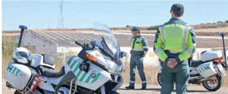
El vehículo fue localizado a la altura del kilómetro 116, en el límite con la provincia de Cantabria.

El vehículo fue localizado a la altura del kilómetro 116, coincidiendo con el límite entre las provincias de Palencia y Cantabria, próximo a la salida de Mataporquera. El conductor circulaba con destino a Palencia por los carriles destinados a la circulación hacia Santander.