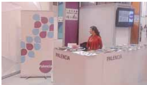
La marca 'Palencia Turismo' participa durante estos días en FITUR.

Los datos se han recopilado durante más de dos décadas de investigación para la edición de la Enciclopedia del Románico, que cuenta actualmente con 38 tomos. Combinando sus dos bases de datos con un Tesoro compuesto por más de 3.200 términos, el portal digital permite realizar hasta cinco tipos de búsqueda diferentes. Además, con el fin de impulsar el turismo cultural, el portal ofrece otros servicios, que se irán ampliando progresivamente como rutas con mapas descargables para dispositivos de geolocalización.