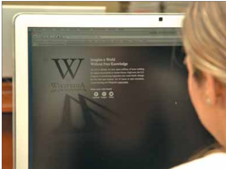
Apagón virtual en protesta de la ley estadounidense de descargas.

Además estos grandes gigantes cuentan con un gran respaldo, el de la Casa Blanca. "Cualquier esfuerzo por combatir la piratería en Internet debe protegerse contra el riesgo de la censura online de la actividad legal y no debe inhibir la innovación de nuestras empresas dinámicas, grandes y peque-