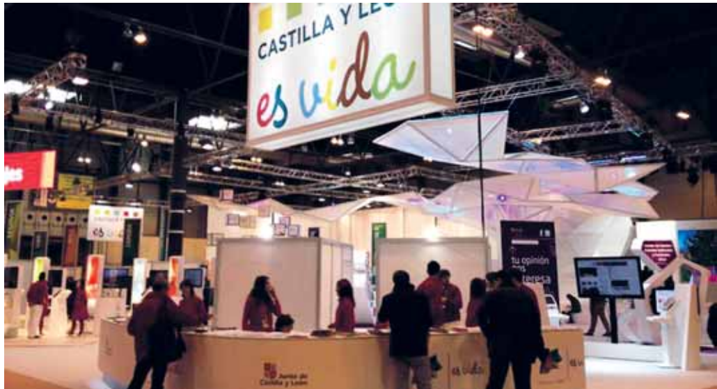
El stand de la Junta de Castilla y León en Fitur 2012 transmite una imagen “fresca, potente e innovadora con una fuerte carga profesional”.

La Junta de Castilla y León pretende transmitir el cambio de