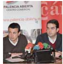
Imagen de la rueda de prensa.

Las entradas podrán conseguirlas todos los clientes de Palencia Abierta a través del programa de fidelización Cuenta Fiel para presenciar los partidos de Liga del primer equipo de baloncesto palentino en la LEB Oro.