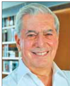
Mario Vargas Llosa.