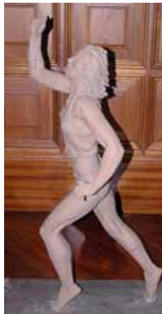
Imagen de la estatua.

"Con este sencillo pero sentido homenaje que llevaremos a