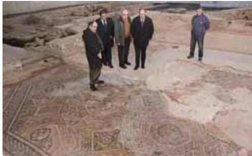
Los descubrimientos en el yacimiento son continuos, según se excava.

De los turistas castellanos y leoneses, el 16 por ciento fue de procedencia palentina y los ciudadanos de fuera de España sumaron un cinco por ciento del total de los visitantes, con un tres por ciento de europeos y un dos por ciento procedente del resto del mundo, lo que se traduce en que 3.508 personas de otros países recorrieron las instalaciones de la villa el