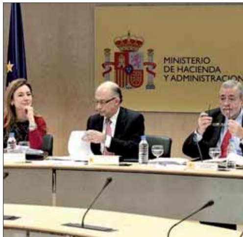
Montoro junto a su equipo en el Consejo de Política Fiscal y Financiera.

La liquidez va acompañada por una batería de sanciones para quienes incumplan los límites de déficit. El Gobierno exigirá responsabilidades penales a los gestores públicos que gasten más. Una medida duramente criticada por todas las fuerzas de la oposición. Además se pondrá un interventor a vigilar la ejecución presupuestaria de las autonomías incumplidoras. Asimismo, hará pagar a la autonomía la sanción que imponga Bruselas al Estado por el desvío del déficit total. También las más derrochadoras se verán privadas de las ayudas económicas lanzadas desde La Moncloa.