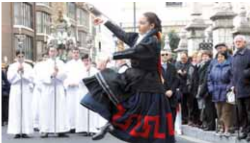
Imagen de archivo de la celebración de Las Candelas en Palencia.

En cuanto al programa festivo del próximo día 2 de febrero, señalar que a las 11 h será la recepción de autoridades en el Ayuntamiento, a las 11,15 la salida de la Procesión hacia La Compañía y a las 11,30, la bendición de Las Candelas y Procesión hasta la Catedral. Finalmente, a las 12 tendrá lugar una misa armonizada por la Coral Vaccea y la Banda Municipal de Música también en la Catedral.