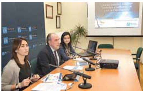
Cualquier notificación quedará en un buzón con plena validez jurídica.

La sede electrónica, a través de la dirección sede.diputaciondepalencia.es , se dirige a todas aquellas administraciones, personas y jurídicas que se relacionen administrativamente con la Diputación y