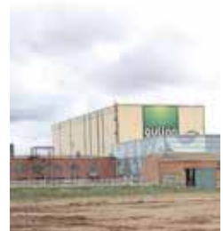
Imagen de archivo de la fábrica.

Estas iniciativas suponen que el recinto fabril aguilarenses cuente