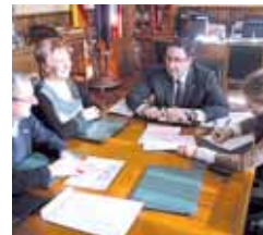
Un momento de la reunión.

El regidor, que reconoció la "ingente e importante labor" que viene desarrollando el CIT durante los últimos años por la "promoción turística" así como por la "recuperación de fiestas y celebraciones ancestrales" les manifestó su intención de apoyar dentro de las posibilidades del Ayuntamiento todas aquellas propuestas que "contribuyan a