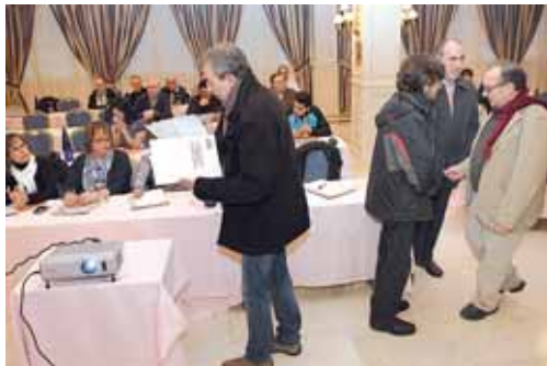
Medio centenar de delegados participaron en el Foro.