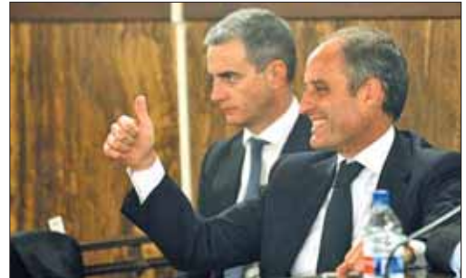
Camps y Costa después de escuchar el veredicto.

Distintas han sido las reacciones de la oposición. El PSOE ha lamentado el fallo y ha retado al PP a "rehabilitarlo" y volver a hacerle presidente, si cree que es "un ciudadano ejemplar" que "pagó sus trajes". El diputado de Izquierda Unida, Gaspar Llamazares, cree que el fallo "no es el correcto" y UPyD aboga porque Camps y Costa "no pueden seguir cobrando un sueldo público". Tras las voces parlamentarias, el eco de disconfor-