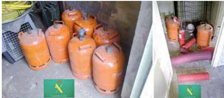
Los objetos fueron entregados al dueño de una empresa de construcción de Guardo.

La Guardia Civil, en un inmueble abandonado del pueblo minero utilizado, recuperó un total de siete bombonas de butano, una garrafa de gasolina, puntales, ca-