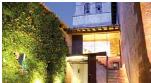
Las ayudas están destinadas a la mejora y modernización de los locales.

Por último cabe recordar que actualmente la Cueva de los Franceses está cerrada por motivos de preparación y adecuación del espacio y abrirá de nuevo sus puertas la segunda quincena de febrero.