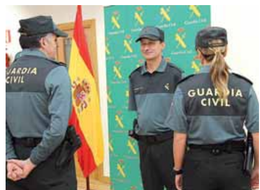
El teniente coronel posa junto al subdelegado y varios agentes. (Arriba)