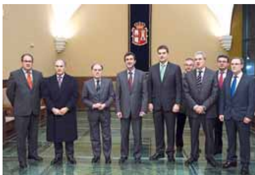
El monasterio de San Agustín acogió el acto conmemorativo.

La partida de 65 millones para el presente ejercicio se destinará a proyectos de expansión como la construcción de un gasoducto de transporte secundario en la localidad leonesa de Villadangos del Páramo a San Cristóbal de Polantera, que dará suministro a un gran nú-