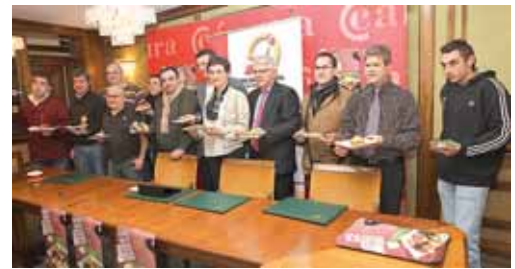
Imagen de la presentación en la Cámara de Comercio de Palencia.

Podrán ser consumidas del 2 al 5 del mismo mes en un total de trece bares asociados al colectivo