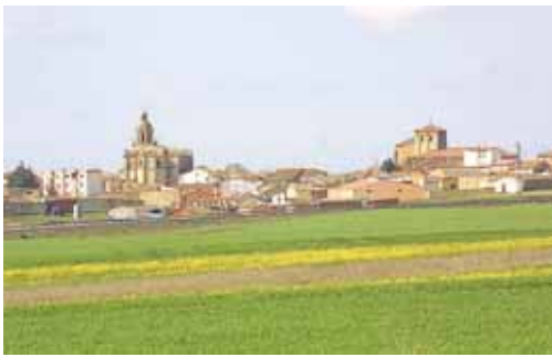
La apertura se realiza gracias a un convenio entre Diputación y Obispado.

La inversión, de 30 millones de euros en 2012 servirá para afianzar la posición de Gullón , completando los planes de desarrollo y crecimiento previstos para los próximos dos años.