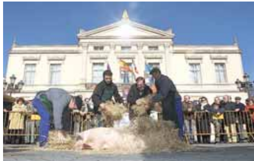
Imagen de archivo de la celebración del Día de la Matanza.

Como ya es tradición, la Fiesta de la Matanza se desarrollará en dos partes. Una, por la mañana, de 12,30 a 14,30 horas, en la que se iniciará el rito de la matanza con el chamuscado de los marranos y el reparto de dulces, chichurro y