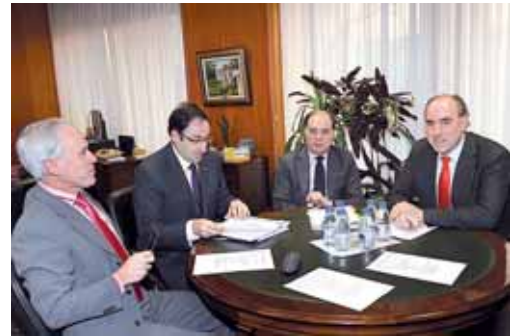
Un momento de la reunión mantenida en la delegación territorial.

También habló de que el apoyo al comercio se concreta en el apoyo de la Junta a la reforma de la Plaza de Abastos o que el nuevo centro polivalente del Cristo se destinará a celebrar cursos de formación.