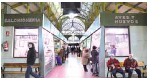
El plazo para la realización de estas obras es de ocho semanas.