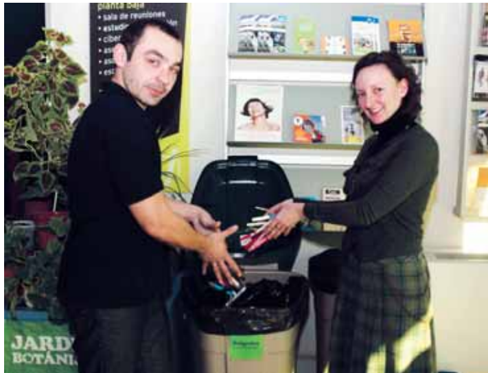
Dos empleados del Espacio Joven colaboran con la iniciativa.

"La gente está respondiendo muy bien. Ya hemos realizado dos recogidas de cinco kilos. Los