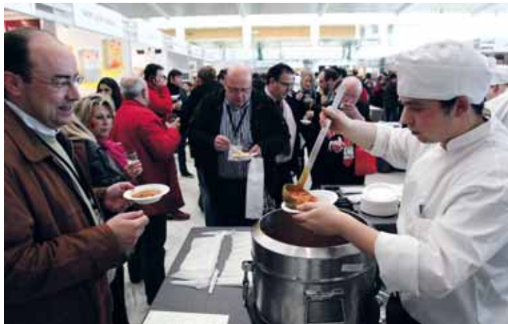
Degustación de la comida vallisoletana en Madrid Fusión.

En la degustación, los 21 establecimientos que participan han