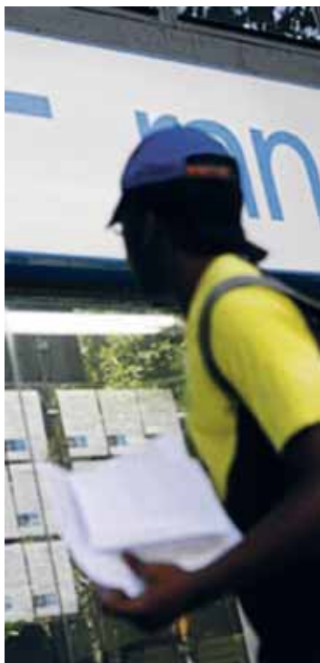
Un joven busca trabajo.

■ La Fiscalía solicita a seis directores de otros tantos hoteles de la provincia de Valladolid, cinco en Tordesillas y uno en Siete Iglesias de Trabancos, un conjunto de indemnizaciones que suman más de 400.000 euros por haber suscrito contratos de abono particular con Canal Satélite Digital S.L. y luego, supuestamente, distribuir la señal de la plataforma televisiva a las habitaciones de sus respectivos centros hosteleros.