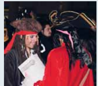
Carnavales en la Plaza Mayor.

■ Los actos de Carnaval, que se desarrollarán del 18 al 21 de febrero, abandonan este año su tradicional ubicación en la carpa ubicada en la Plaza Mayor para trasladarse a la Cúpula del Milenio. Además, y como adelantó la concejala de Cultura, Mercedes Cantalapiedra, el presupuesto se verá, una edición más, recordado, aunque se mantendrán los concursos y los principales desfiles. El pasado año el Carnaval ya sufrió un recorte en días de fiesta.