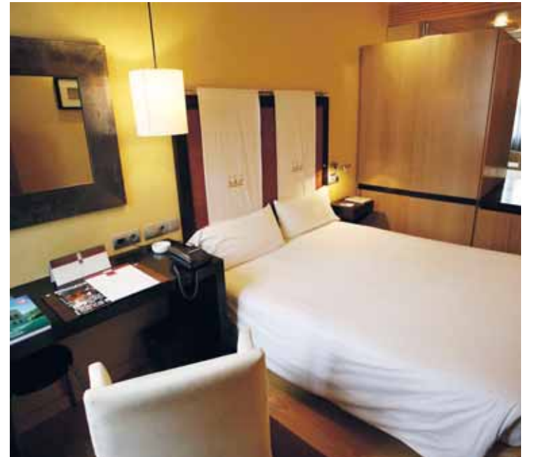
Mediante un contrato particular se distribuía la señal a las habitaciones.

Los acusados, que compartirán banquillo en la Audiencia de Valladolid, se encuentran imputados por un delito contra el mercado, recogido en el artículo 268,4 del Código Penal. Cada uno de ellos se enfrentan al pago de una multa de 1.800 euros y de las correspondientes indemnizaciones, que oscilan entre 43.185 y 144.592 euros, por los perjuicios ocasionados a Canal Satélite Digital S.L. y que, globalmente, se elevan a 443.396 euros, de las que deberían responder subsidiariamente las mercantiles propietarias o explotadoras de los