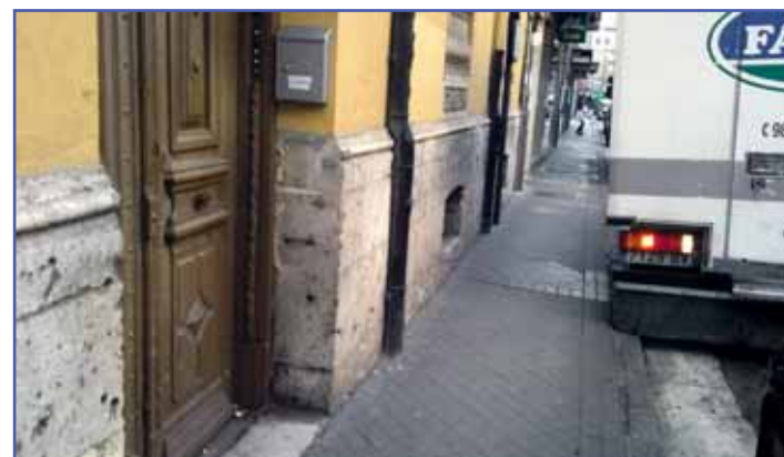
Acera estrecha de la calle Claudio Moyano.

peatonal. De esta manera, se eliminará la zona de aparcamiento de la ORA, aunque se mantendrán para las motos en la intersección con la calle Santiago. Así, los peatones tendrán más espacio para caminar. El objetivo es ejecutar las obras en verano para que el descenso de la actividad comercial no provoque problemas en la circulación.