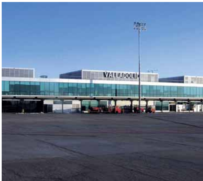
Vista del aeropuerto de Villanubla desde la pista de despegue.

El itinerario que se sigue en las visitas es el mismo que hacen los pasajeros que van a tomar un avión y el de los que acaban de aterrizar con el objetivo de que conozcan los procesos y trámites a realizar y puedan desenvolverse con facilidad en cualquier aeropuerto del mundo. Las visitas están abiertas también a colectivos como grupos de familias o centros de asistencia. Los interesados pueden ponerse en contacto con el Aeropuerto de Valladolid a través de la página web www.aena-aeropuertos.es