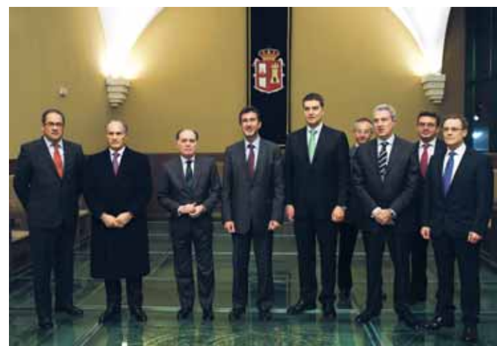
El monasterio de San Agustín acogió el acto conmemorativo.