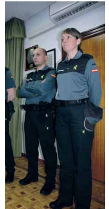
Nuevos uniformes de la G. Civil.

Está previsto que esta adquisición a la larga suponga un ahorro, pues las prendas del nuevo uniforme tendrán una mayor duración. En Valladolid, la Guardia Civil cuenta con 750 agentes repartidos en 24 puestos.