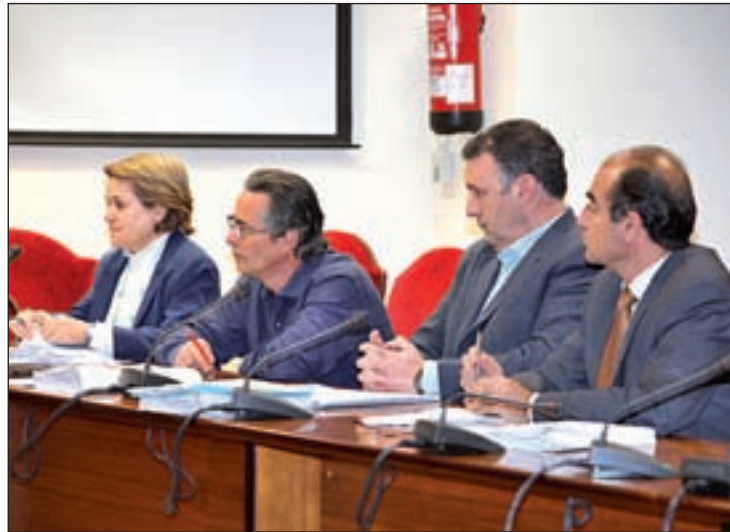
La 'sugerencia' de UPyD supondría un ahorro de 133.000 euros

Asimismo, ha indicado que los grupos municipales, que ya tenían tradición en el Ayuntamiento de Getafe, se redujeron un 33% su asignación básica a principios de la legislatura, "lo que no ha sufrido UPyD porque