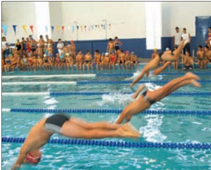
Imagen de la piscina

"En este contexto el Ayuntamiento está trabajando para solucionar la situación, dar viabili-