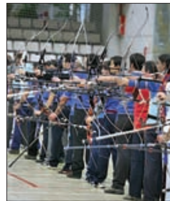
Las clases comienzan en marzo

curso se impartirá en el Gimnasio del Colegio Ramón y Cajal, en la calle Vereda del Camuerdo nº3, en el Sector Tres y el horario escogido será los sábados y domingos de diez y media de la mañana a una de la tarde. El proceso de formación correrá a cargo de entrenadores titulados a nivel regional y nacional.