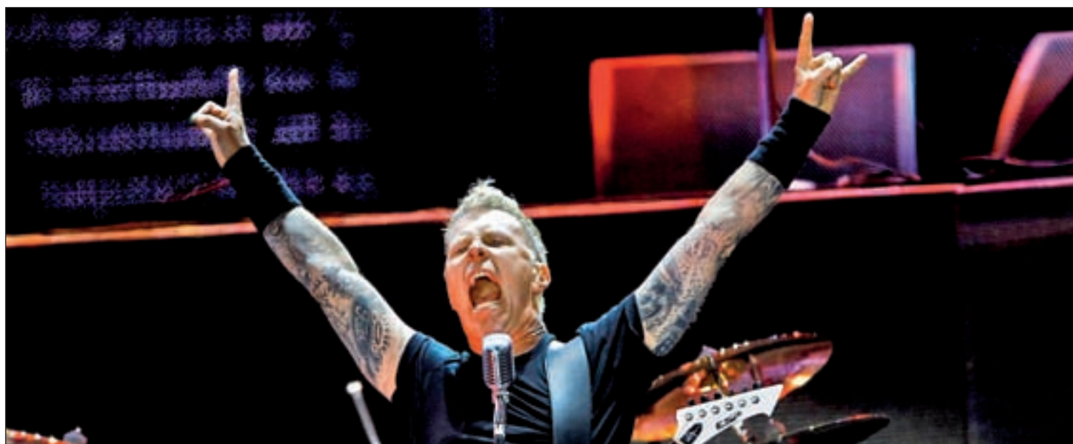
Metallica tocará su 'Black Album' en Getafe