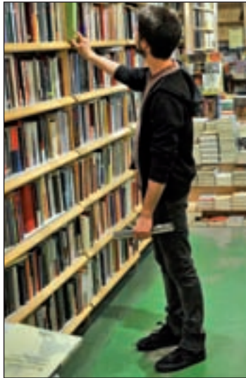
El castellano abarca el 79%

Durante 2011, las editoriales publicaron 97.211 libros en las len-