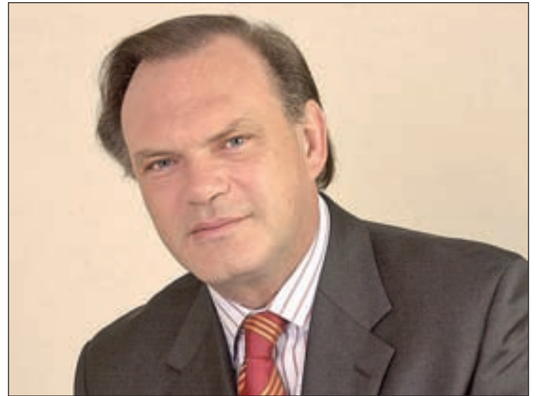
Pedro Piqueras es uno de las caras que lucha contra el cáncer

Así, del 1 al 21 de febrero, las personas que transiten por el Metro de Madrid podrán conocer a través de fotos y videos a numerosos pacientes que han superado esta enfermedad y que posan junto con rostros populares como Pedro Piqueras, Roberto Braseró, Beatriz Carvajal o Elena Rivera, quienes han participado en la iniciativa con el objetivo de ayudar a desmitificar la enfermedad y de crear conciencia en la sociedad. Más de 100.000 pacientes superan cada año el cáncer en España gracias a la investigación, al diagnóstico