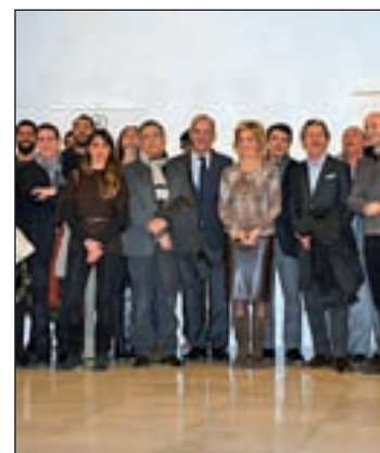
Foto de familia