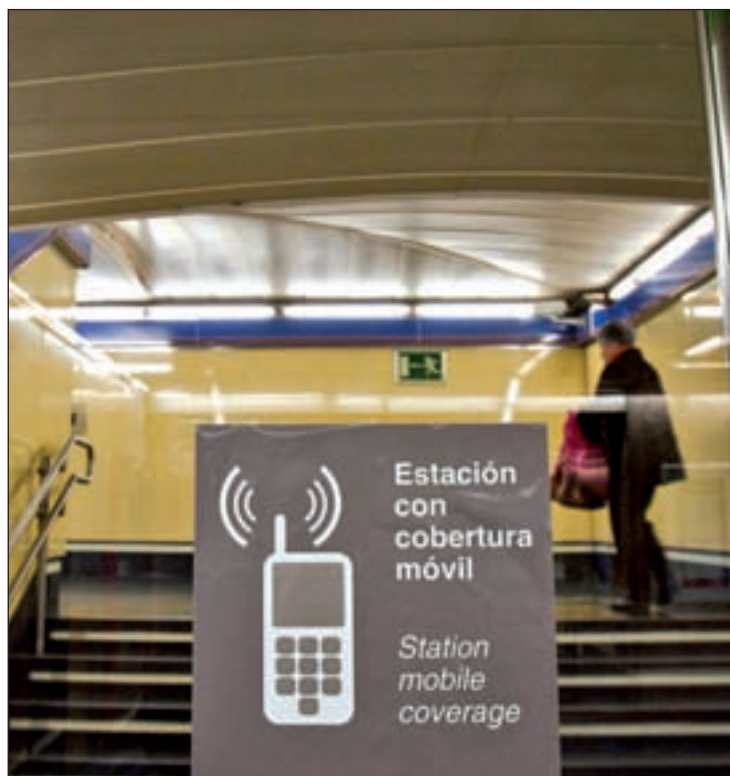
Las estaciones tienen un dispositivo que identifica la cobertura