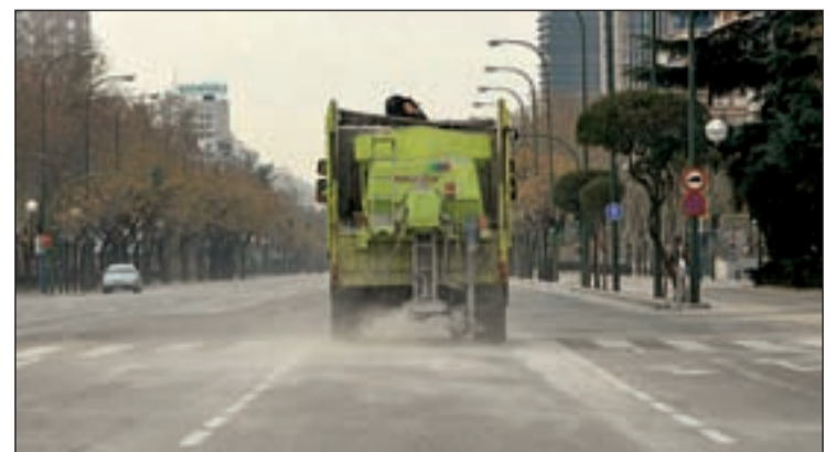
Uno de los 773 medios mecánicos del operativo

cas. Para evitar la formación de placas de hielo se suprimen los baldeos con agua y se han salado las zonas sombrías y proclives a helarse. Los 6.770 trabajadores municipales que conforman el Plan Nevada están repartidos en tres departamentos limpieza urbana, vías públicas y Calle 30. Entre los 773 medios mecánicos que completan el operativo hay máquinas quitanieves, camiones esparcidores de sal, baldeadoras y vehículos auxiliares con cuchillas.