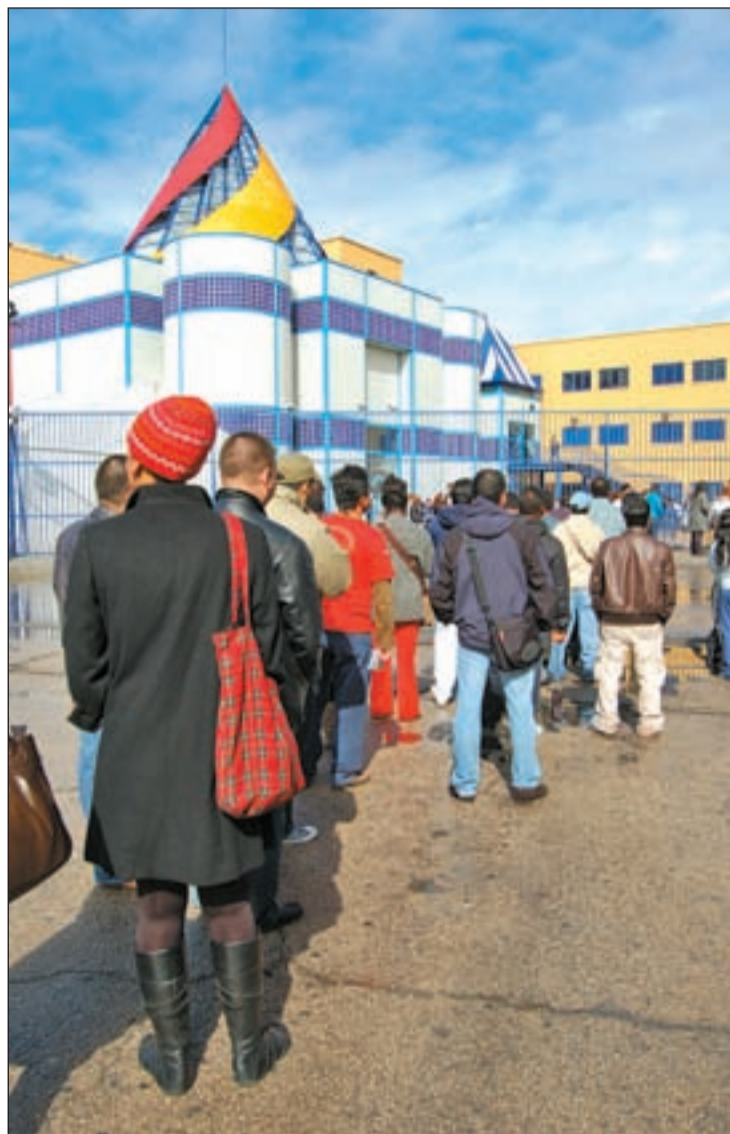
El CIE de Aluche, en la antigua cárcel de Carabanchel