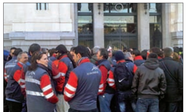
Los trabajadores de Arcelor Mittal en Cibeles.

El 2 de febrero la plantilla al completo fue recorriendo las diferentes sedes para entregar un comunicado donde explican sus argumentos para oponerse al