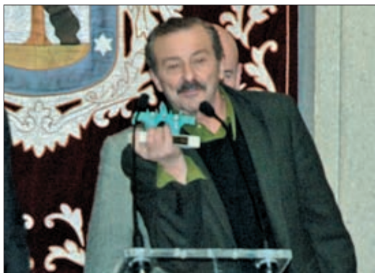
Juan Diego posa con el Premio Puente de Toledo