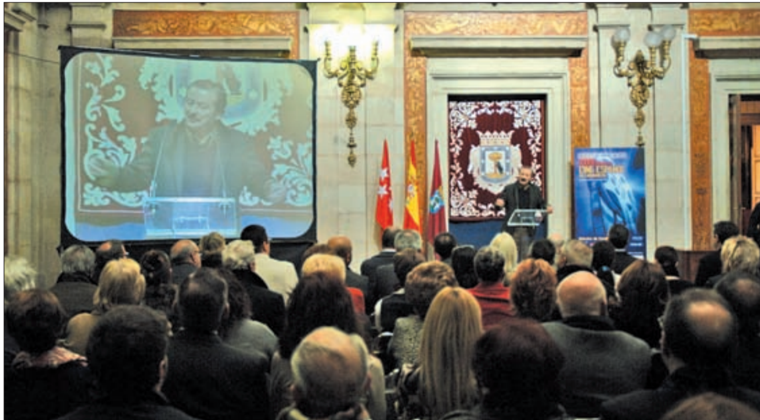
Un Patio de Cristales repleto acogió la puesta de largo de la edición de este año del certamen