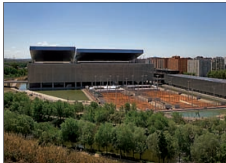
La Caja Mágica fue concebida para albergar unos Juegos Olímpicos