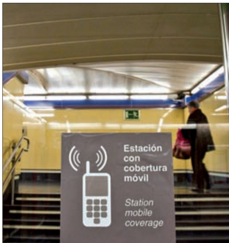
Las estaciones tienen un dispositivo que identifica la cobertura