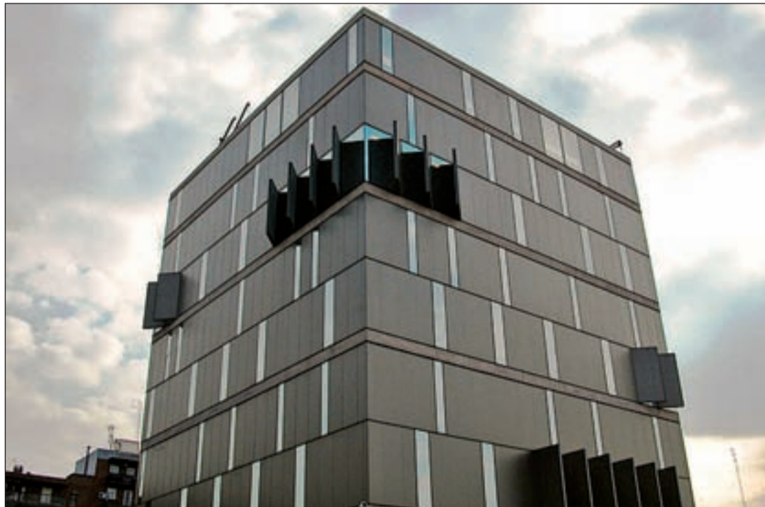
La José Hierro es la única biblioteca pública del distrito

Un año más, el servicio de Dinamización Vecinal de Villaverde, la asociación Semilla, la asociación Educación Cultura y Solidaridad y el servicio de Dinamización de espacios públicos, organizan una jornada de 'basket callejero' el 12 de febrero en las canchas del centro sociocultural Los Rosales. La iniciativa para equipos mixtos a partir de 15 años, se disputará de 11 a 18 horas y las inscripciones, gratuitas, se puede hacer a través del tuenti "San Nicolas asoci d vecins" o en el e-mail: dinamizacion.san-cristobal@aavvmadrid.org.