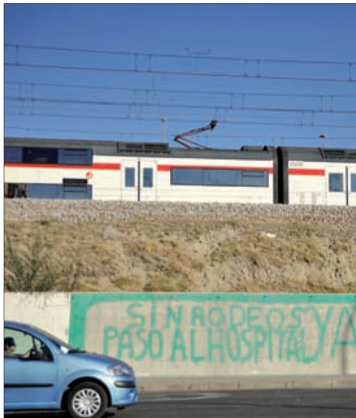
Lugar donde los residentes quieren que se haga el acceso. MANUEL VADILLO

Los residentes consideran que mientras "el Ayuntamiento ve imposible seguir negociando la construcción de un acceso