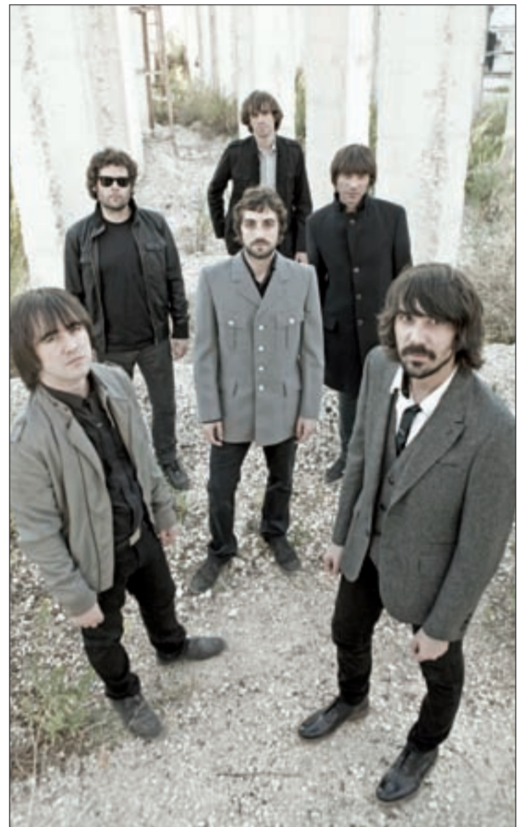
El sexteto andaluz está hospedado en la sala madrileña

Ya en tiempo presente, los Lori Meyers llevarán a cabo este viernes la puesta en escena de 'Cronolánea' (2008), tercer disco