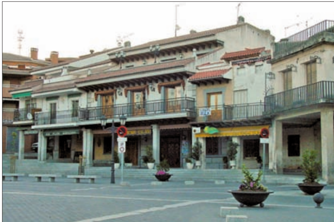
Plaza Mayor de El Molar

Ese espacio cuenta con 2,3 millones de metros cuadrados calificados, "espacio suficiente" inicialmente, a juicio del alcalde,