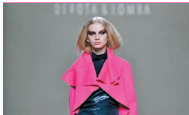
Un momento del desfile de Devota & Lomba

Por último, ha señalado que “no hay que olvidar que España es número uno en gran distribución de moda”.