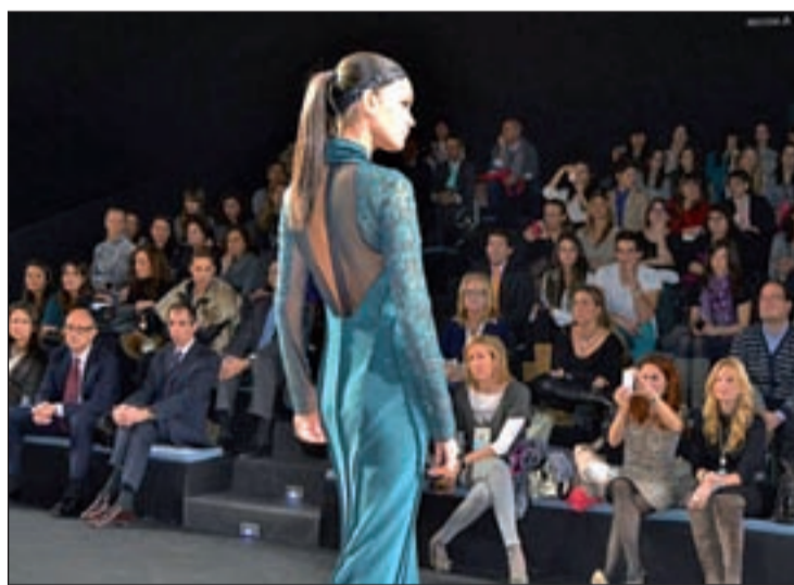
HOMENAJE A SU LEGADO El desfile, en el que ha predominado las faldas asimétricas con leggings debajo y el juego entre lo masculino y lo femenino, se ha convertido en un homenaje a Jesús y en un tributo a su legado.

tantísimo”. “La gestión del color, el como drapear directamente sobre el maniquí son técnicas de trabajo que él nos enseñó y, a partir de ahí, lo natural es que salga lo más afín a su trabajo”, ha señalado.