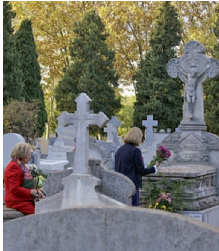
Uno de los espacios del cementerio de La Almudena, en Ciudad Lineal