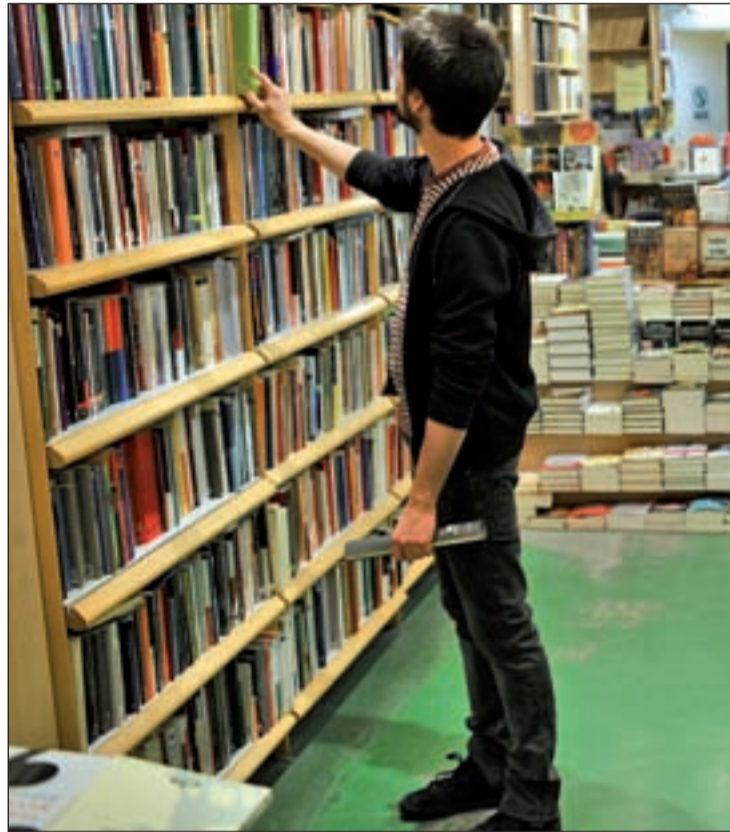
Se han publicado hasta 22.437 traducciones de otras lenguas

Hay que destacar, también, que hasta 3.574 sellos editoriales publicaron al menos un libro du-