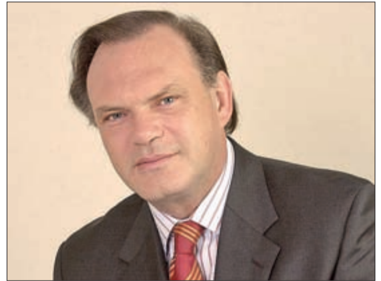
Pedro Piqueras es uno de las caras que lucha contra el cáncer

Así, del 1 al 21 de febrero, las personas que transiten por el Metro de Madrid podrán conocer a través de fotos y vídeos a numerosos pacientes que han superado esta enfermedad y que posan junto con rostros populares como Pedro Piqueras, Roberto Braseró, Beatriz Carvajal o Elena Rivera, quienes han participado en la iniciativa con el objetivo de ayudar a desmitificar la enfermedad y de crear conciencia en la sociedad. Más de 100.000 pacientes superan cada año el cáncer en España gracias a la investigación, al diagnóstico