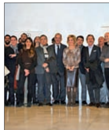
Foto de familia