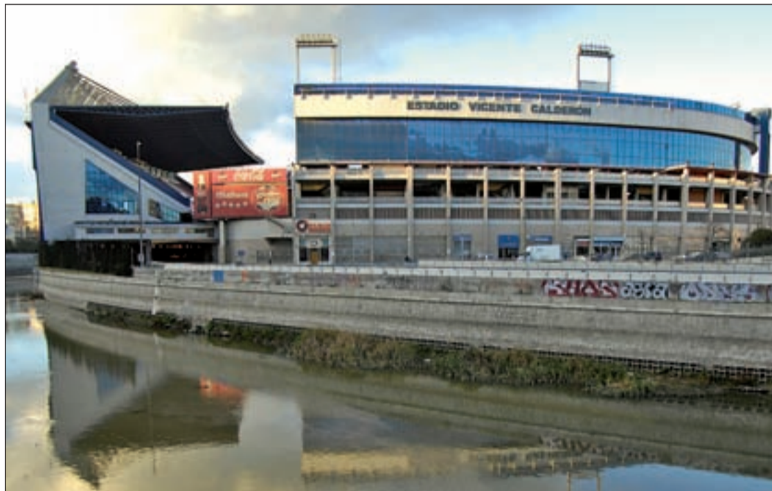
Panorámica del Vicente Calderón

El TSJM indica en su sentencia que la Ley del Suelo únicamente permite superar esta altura (tres plantas más el ático) en el caso de edificios singulares -situación que no se corresponde con el plan ideado-, pero nunca con carácter general. Por lo tanto, insta a que se presente una motivación individual y solicita un informe favorable de la Comisión Provincial de Urbanismo de