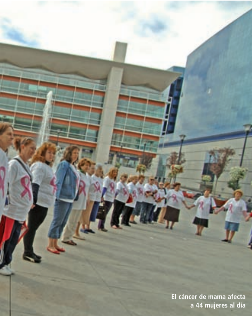
El cáncer de mama afecta a 44 mujeres al día