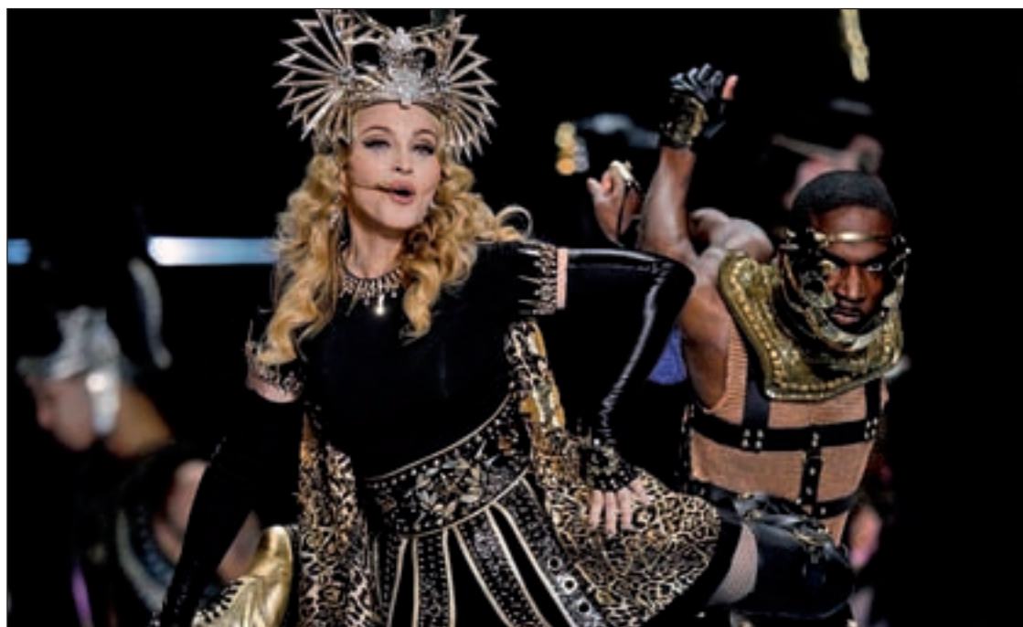
Así se presentó la artista estadounidense en el intermedio de la Super