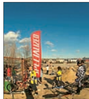
El trazado coge forma

ran con ilusión la llegada de esta jornada en la que se espera que el sol haga acto de presencia y con él se pueda disfrutar de los nuevos remotes. Hay que recordar que la instalación está abierta siempre que el tiempo lo permite y que este club es un auténtico pionero en España.