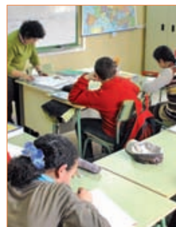
Niños en centro escolar

Otra de las relevantes novedades que incorpora la normativa de la Comunidad es la inclusión de la Renta Mínima de Inserción (RMI) en los criterios de admisión. A partir del próximo curso 2012/2013, las familias que reciban la RMI sumarán 2 puntos al elegir centro.