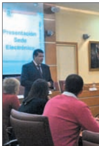
Presentación de la Sede

A la presentación de este nuevo modelo de ayuntamiento online acudió el viceconsejero de presidencia, Borja Sarasola, que