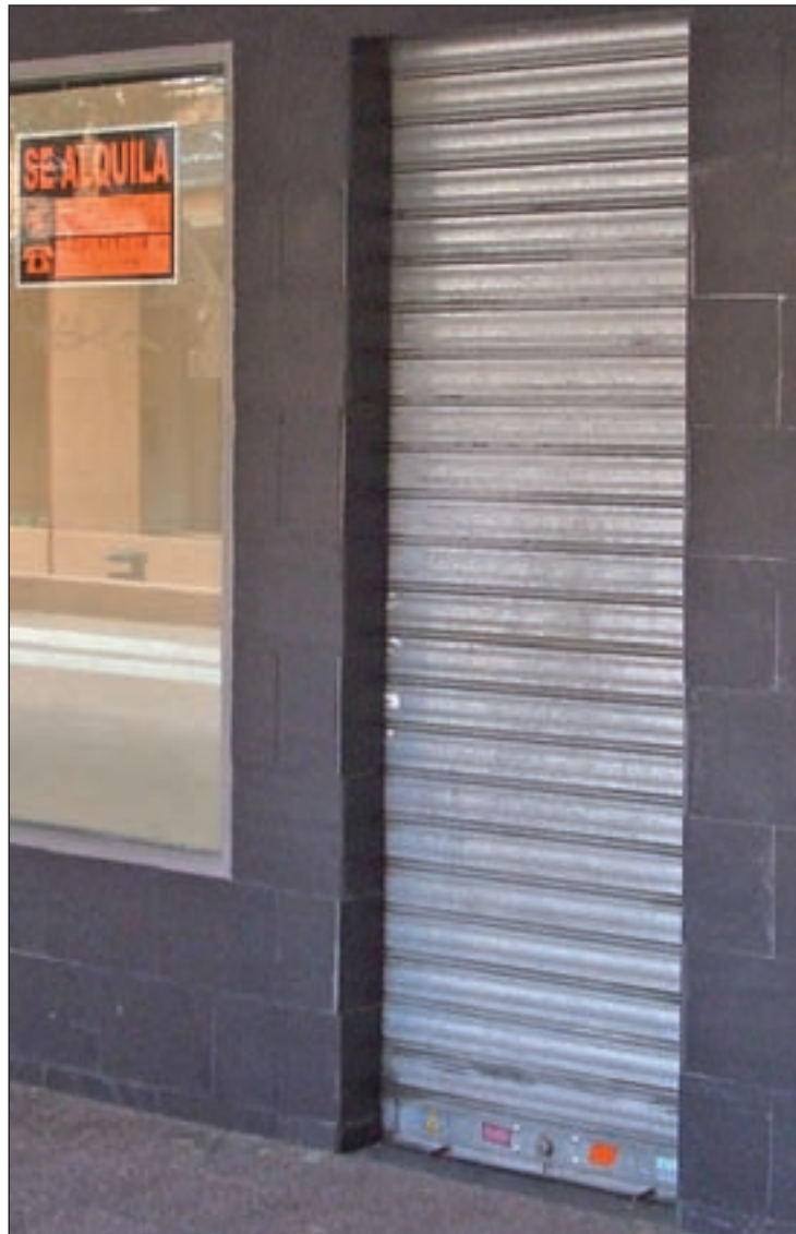
La estampa que se repite en diversos puntos de Tres Cantos

Lo que sí ha sabido GENTE es que esta misma semana los comerciantes han pedido una reu-