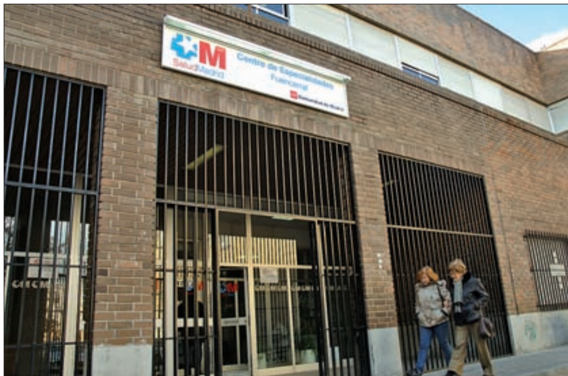
Centro de Especialidades de Fuencarral