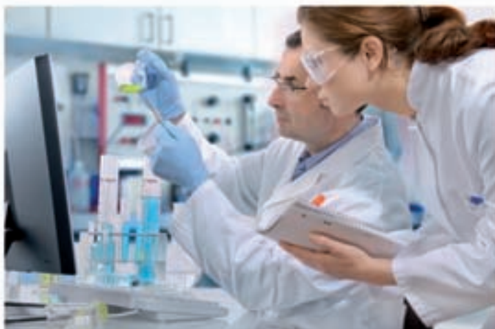
Nuestros laboratorios siempre a la vanguardia