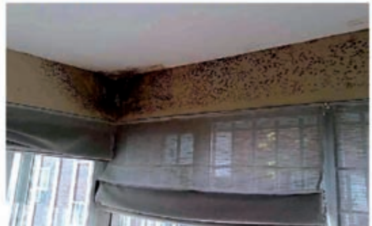
Problemas de humedades por condensación

micología en el instituto de la Salud Pública Louis Pasteur, explica este aumento por nuestro modo de vida: "Vivimos más en el interior, en casa o en el despacho. Desde los años 60, tendemos a un exceso de aislamiento para no dejar escapar el calor y además no se airea suficientemente".