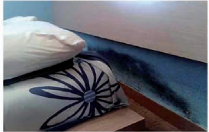
Problemas de humedades por capilaridad

Se han realizado estudios científicos sobre adolescentes que sufren afecciones respiratorias, dando como resultado un 83% de asma, bronquitis asmáticas y bronquitis crónicas y un 87% de rinitis crónicas, que alcanzan a jóvenes que viven en habitaciones demasiado húmedas. De un 20 a un 30% de nosotros sufrimos alergias respiratorias, ¡dos veces más que hace 20 años!. Edouard Drouhet, jefe de