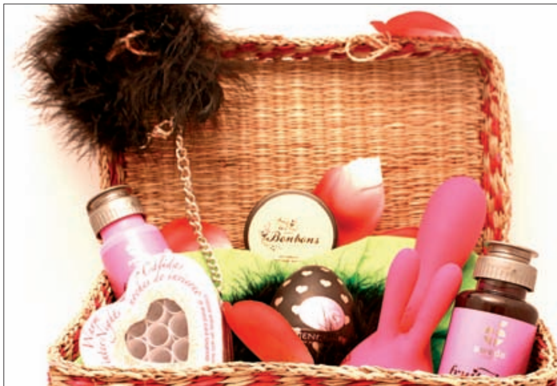
Cesta regalo especial San Valentín de 'Los placeres de Lola'

Para adentrarnos en la demanda de los regalos más sexys contactamos con la tienda erótica 'Los placeres de Lola'. Nos explican que en San Valentín existe mu-