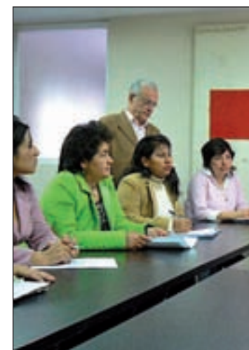
Desempleados piden ayuda

El plan de Cruz Roja está basado en la formación, se realizan cursos de captación de habilidades y se les ayuda para hacer su currículum o también algo muy importante como dice Pilar, que es